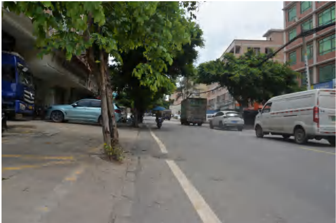
图 18 大朗站地表现状（南—北）