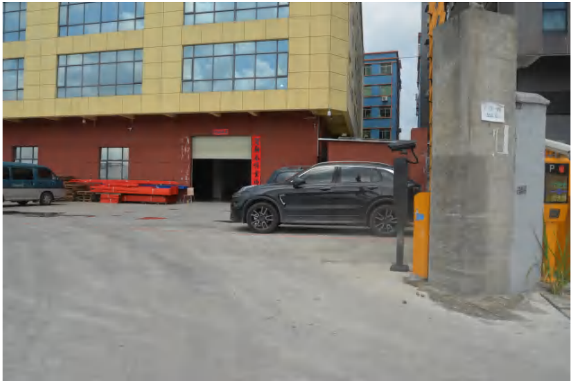
图 26 均禾站地表现状（东—西）