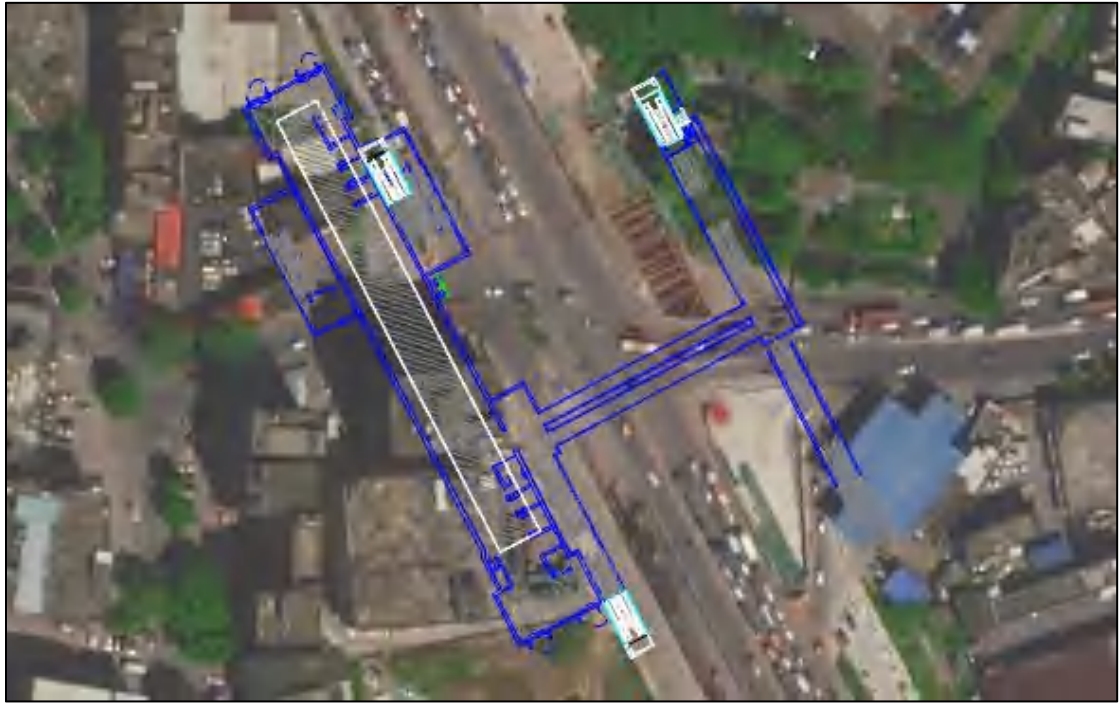
图 4 均禾站卫星红线图（高德地图）