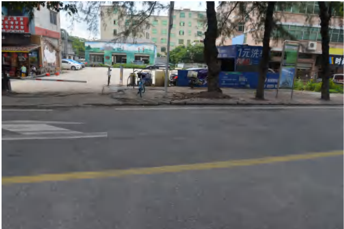
图 12 大朗站地表现状（西—东）