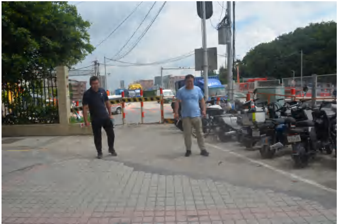
图 10 对工程用地地表进行踏查（南—北）