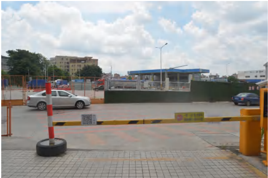
图 36 均禾站地表现状（西—东）