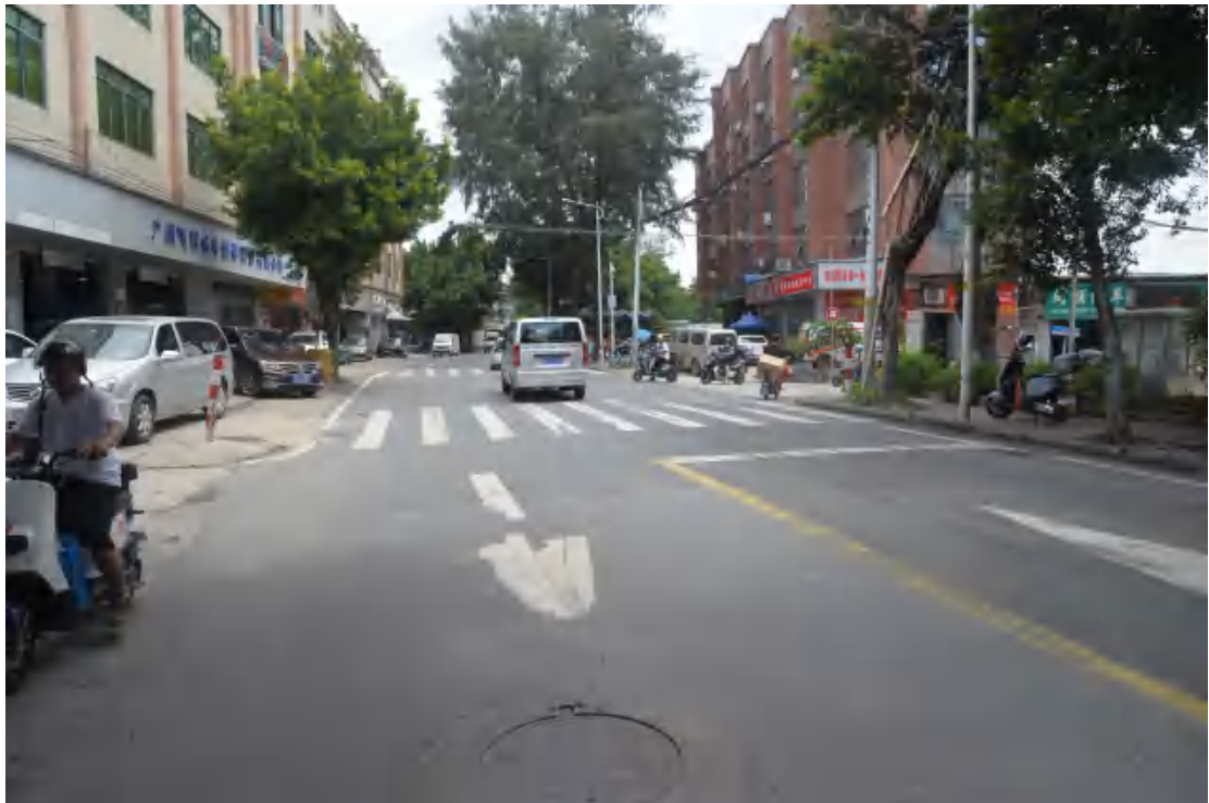
图 14 大朗站地表现状（南—北）