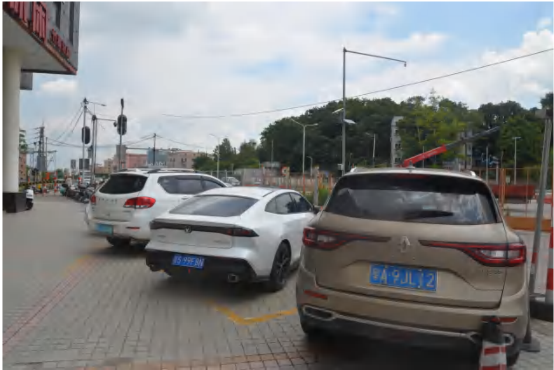
图 35 均禾站地表现状（南—北）