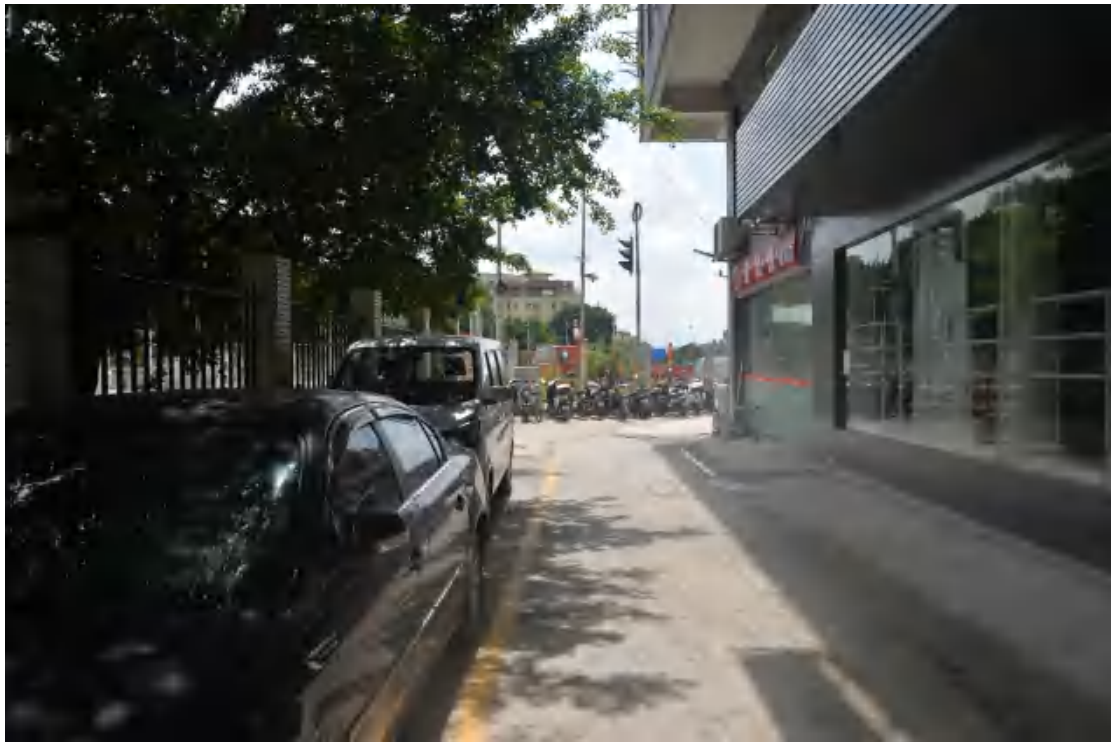
图 28 均禾站地表现状（西—东）