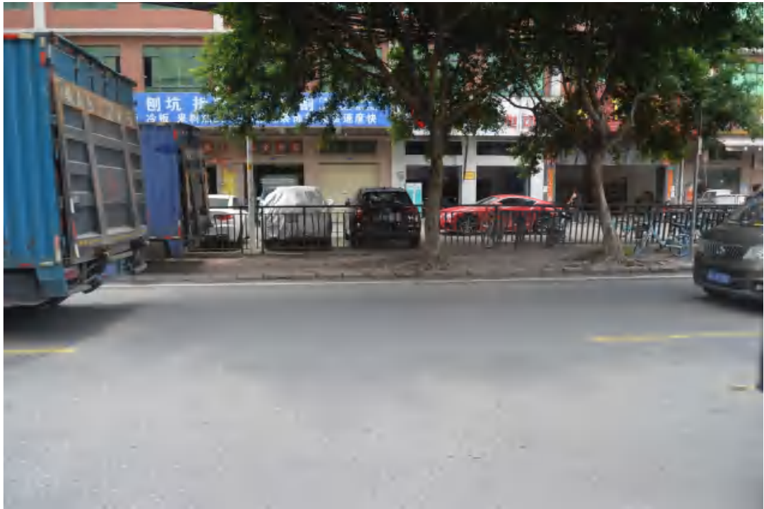
图 17 大朗站地表现状（西—东）