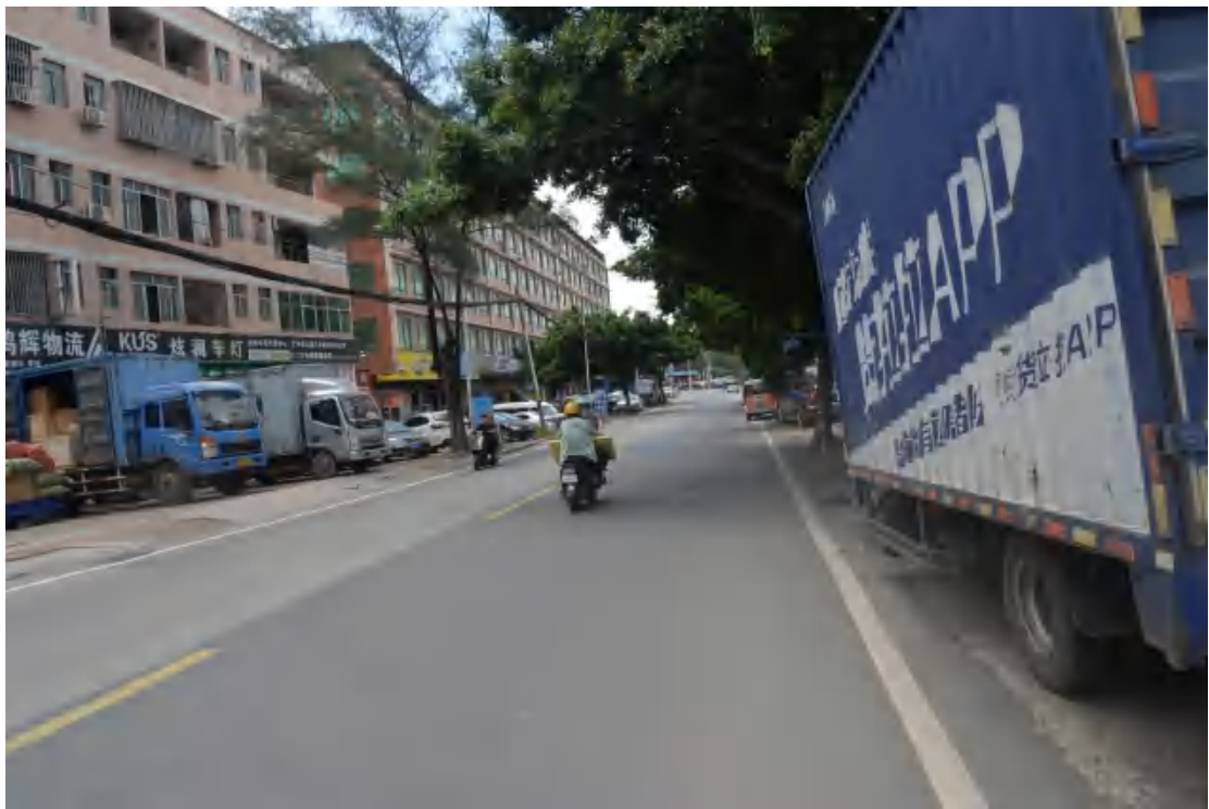
图 21 大朗站地表现状（北—南）