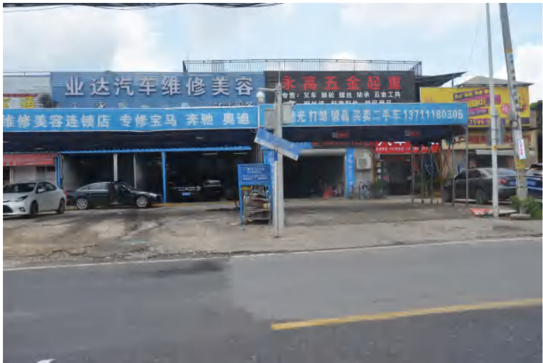
图 19 大朗站地表现状（西—东）