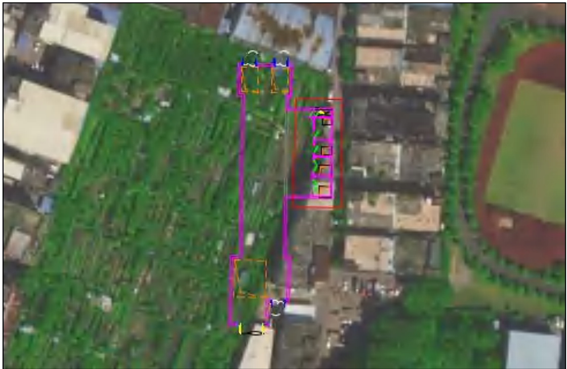
图 5 黄夏区间风井卫星红线图