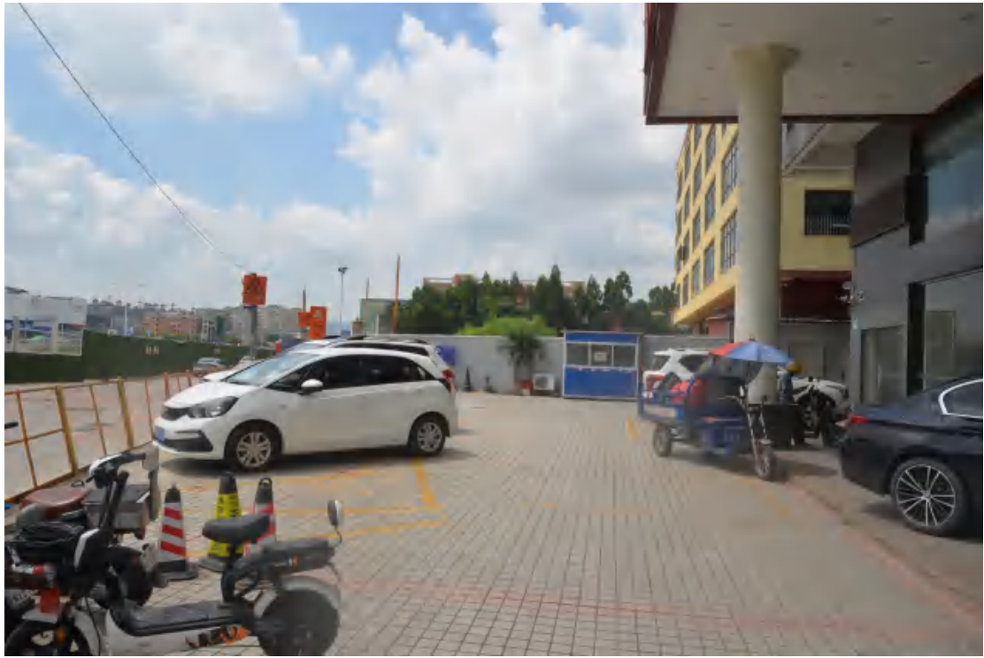
图 27 均禾站地表现状（北—南）