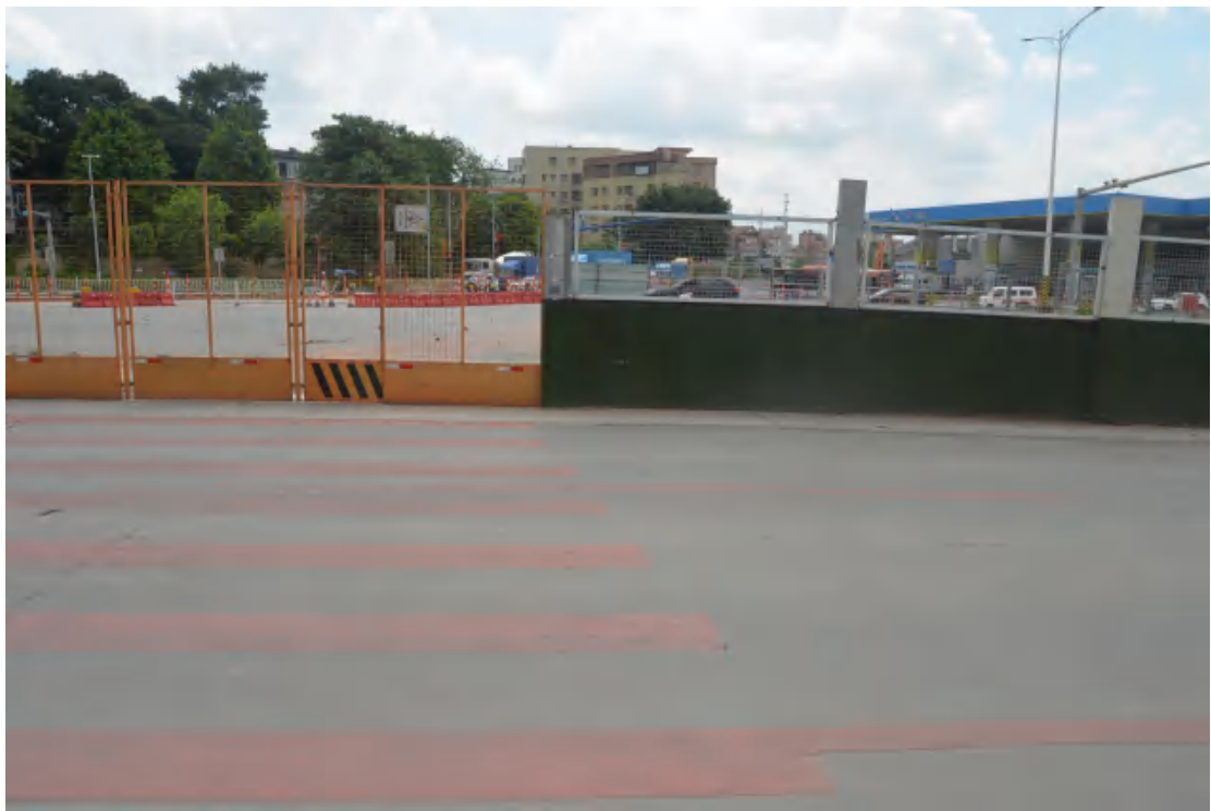
图 33 均禾站地表现状（西—东）