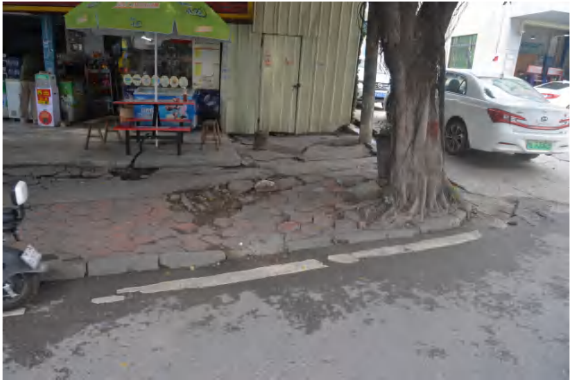
图 11 大朗站地表现状（东—西）