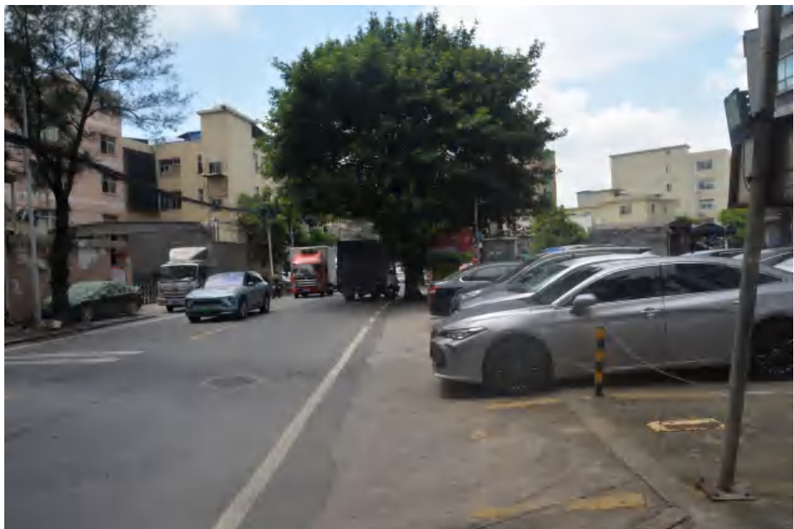
图 20 大朗站地表现状（北—南）