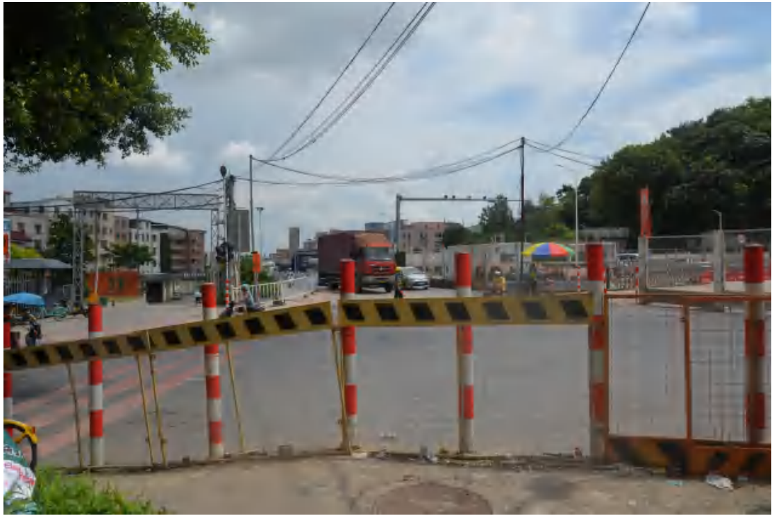
图 25 均禾站地表现状（南—北）