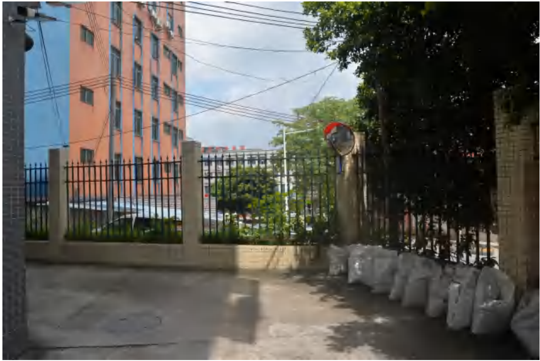
图 29 均禾站地表现状（东—西）