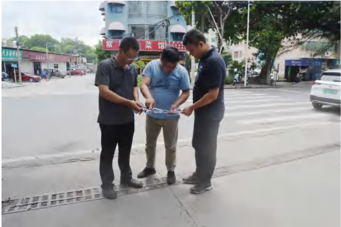
图 9 与工作人员确认工程用地范围（西—东）