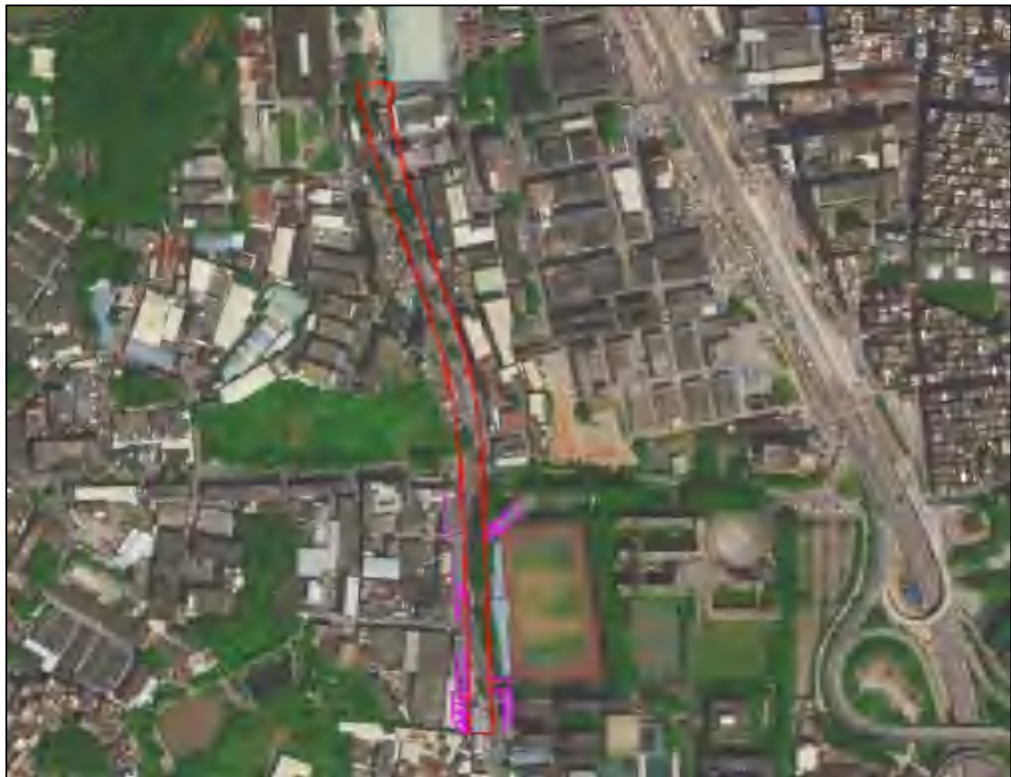
图 3 大朗站卫星红线图（高德地图）