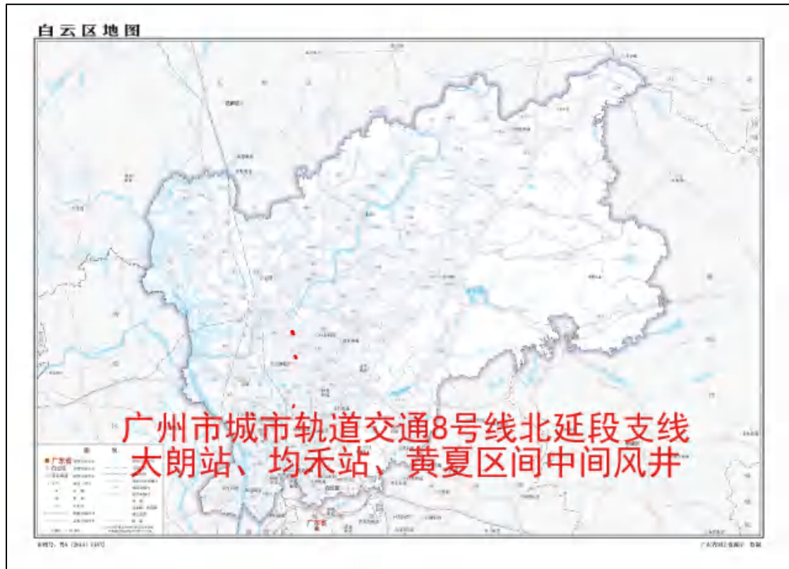
图 2 地块在白云区的位置示意图（广东省国土资源厅）