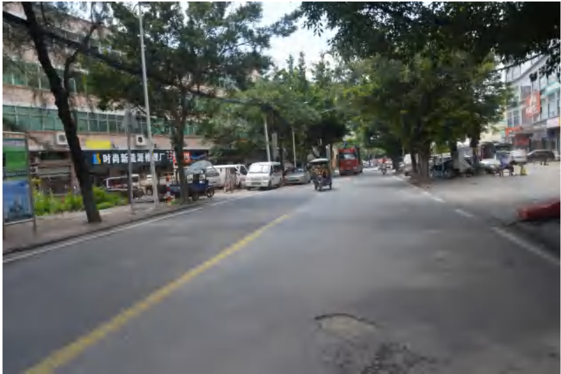
图 13 大朗站地表现状（北—南）