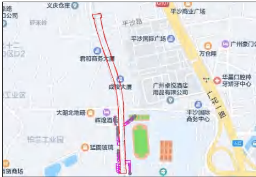
图 6 大朗站周边环境示意图（腾讯地图）