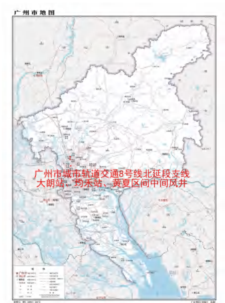
图 1 工程用地在广州市的位置示意图(广东省国土资源厅)

根据《中华人民共和国文物保护法》《广州市文物保护规定》，按照《广州市文物局关于广州市城市轨道交通 8 号线北延段支线工程(江府-纪念堂)考古调查勘探工作的复函》(文物 2023475 号)的指导意见，受广东华隧建设集团股份有限公司委托，由我院配合该工程建设，对该工程用地进行考古调查工作。