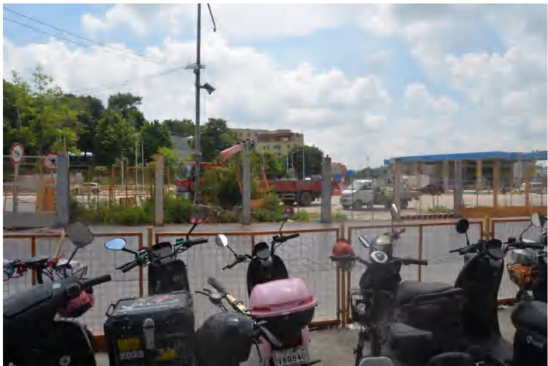
图 24 均禾站地表现状（西—东）