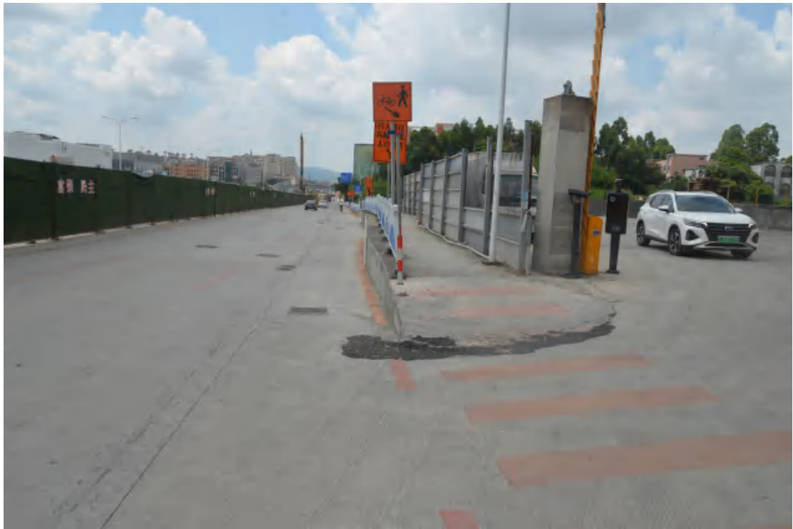
图 30 均禾站地表现状（北—南）