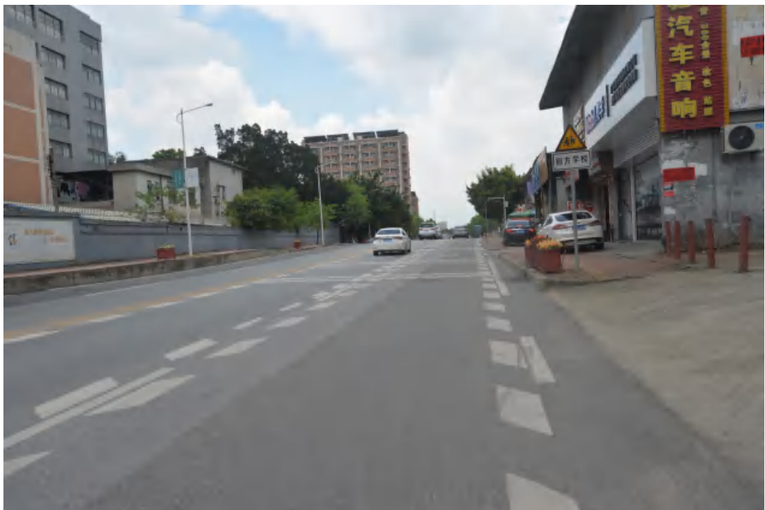
图 22 大朗站地表现状（北—南）