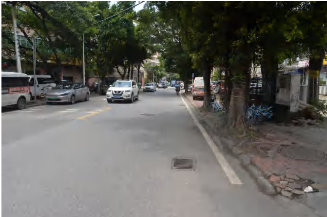
图 16 大朗站地表现状（北—南）