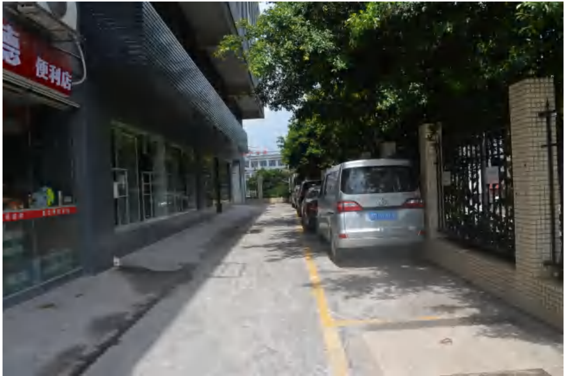
图 31 均禾站地表现状（东—西）