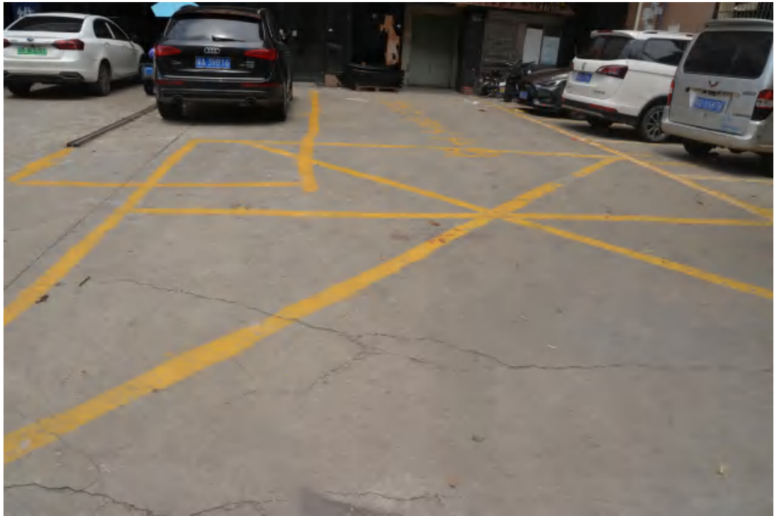
图 15 大朗站地表现状（东—西）