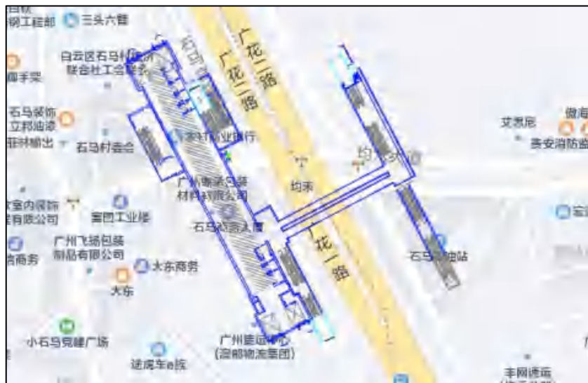
图 7 均禾站周边环境示意图（腾讯地图）