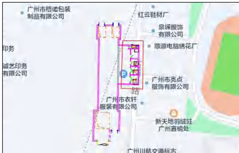
图 8 黄夏区间风井周边环境示意图（腾讯地图）