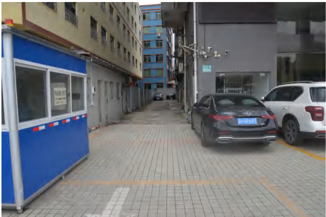
图 34 均禾站地表现状（东—西）