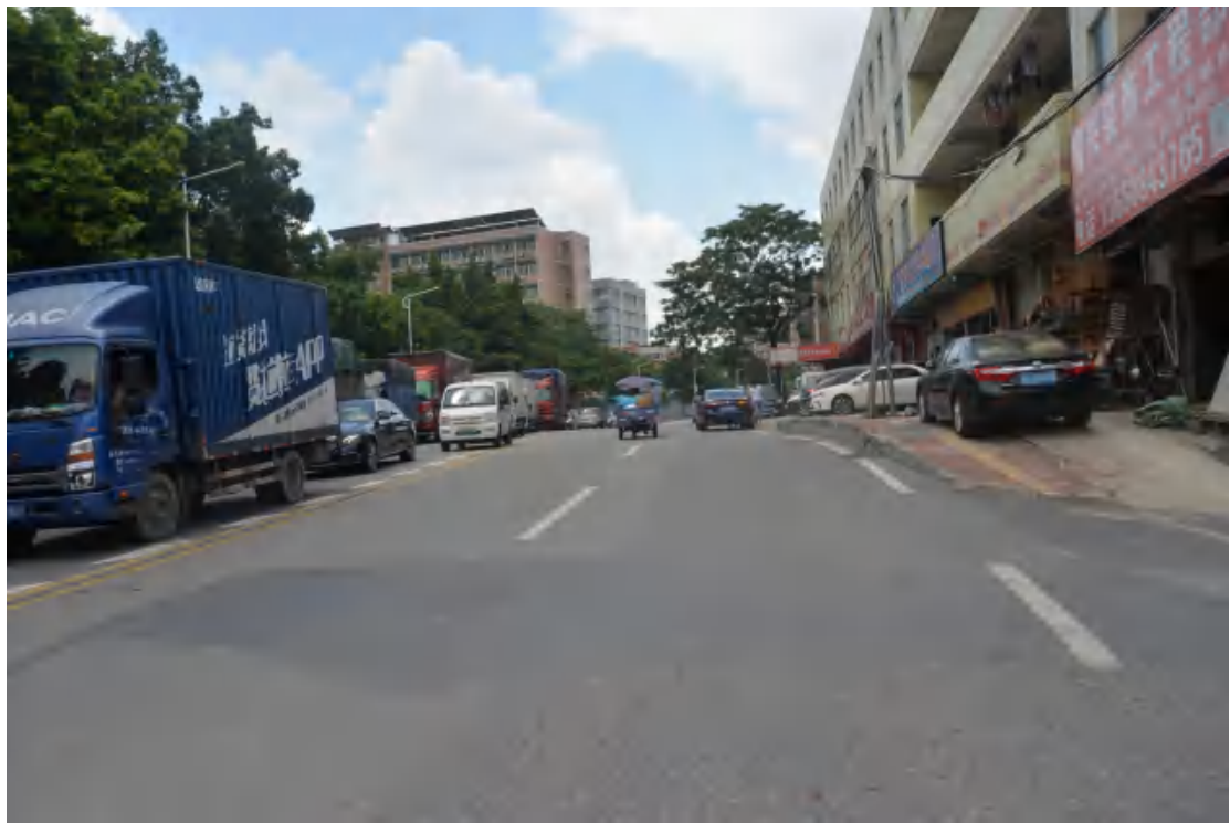
图 23 大朗站地表现状（北—南）