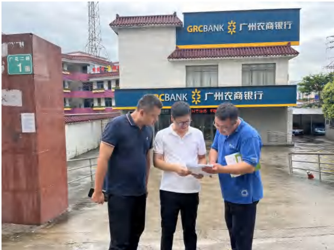
图5 与工作人员确认工程用地范围（北—南）