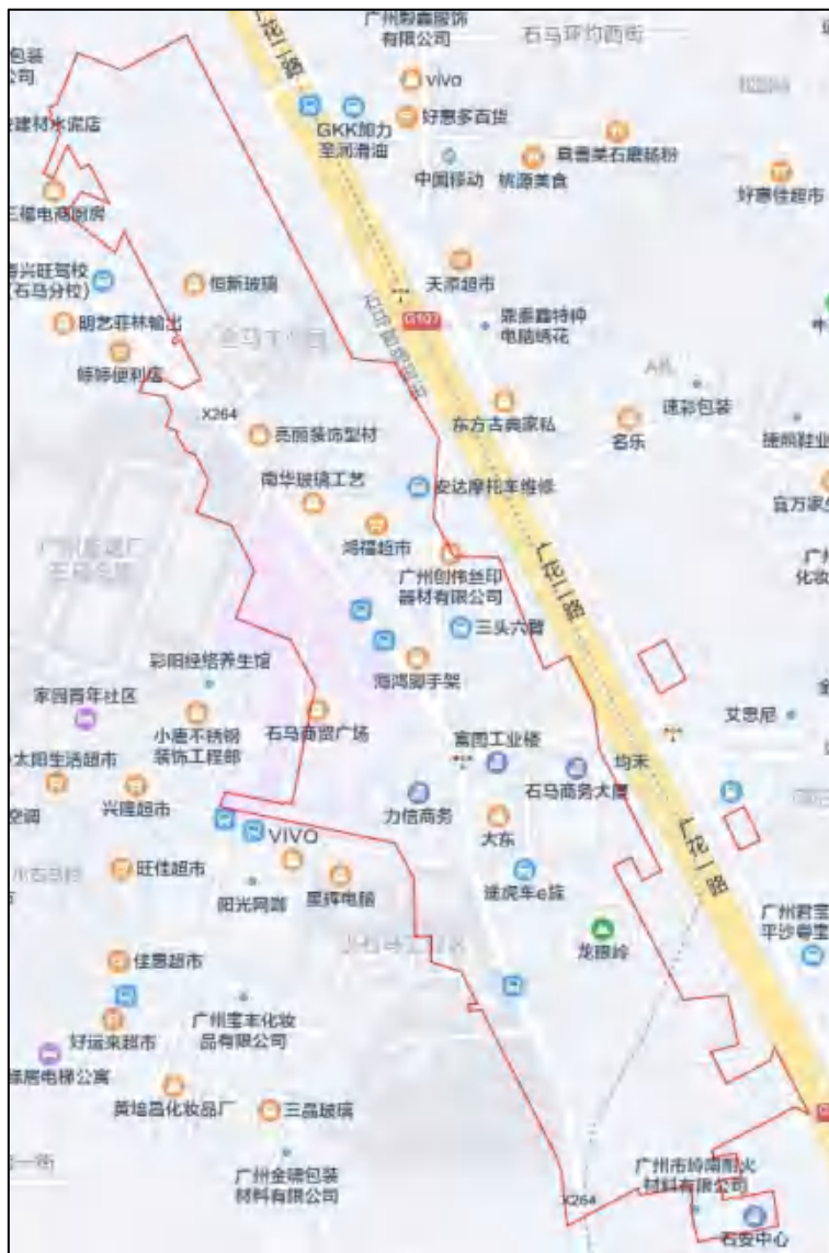
图 3 唐阁停车场周边环境示意图（腾讯地图）