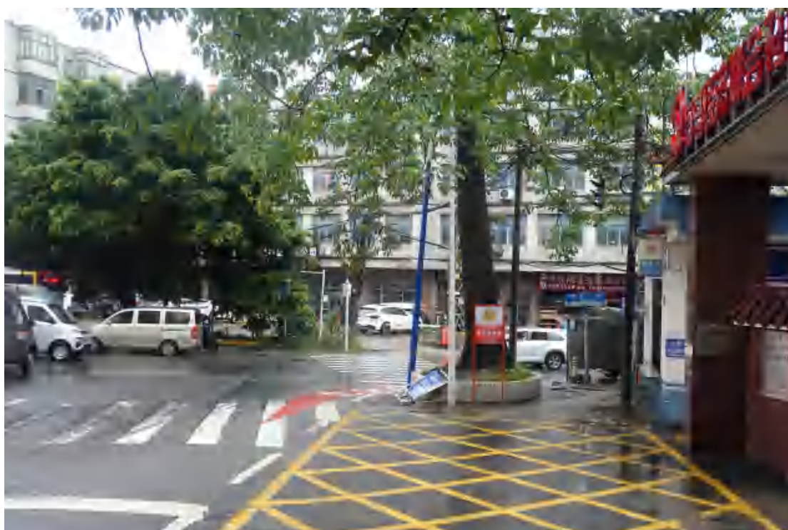
图 17 工程用地北部地表现状（西一东）