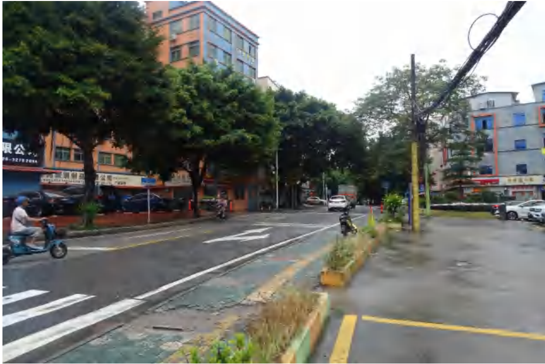
图 20 工程用地南部地表现状（北—南）