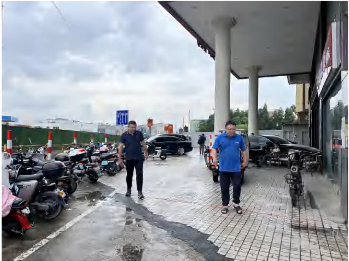
图 6 对工程用地地表进行踏查（北—南）