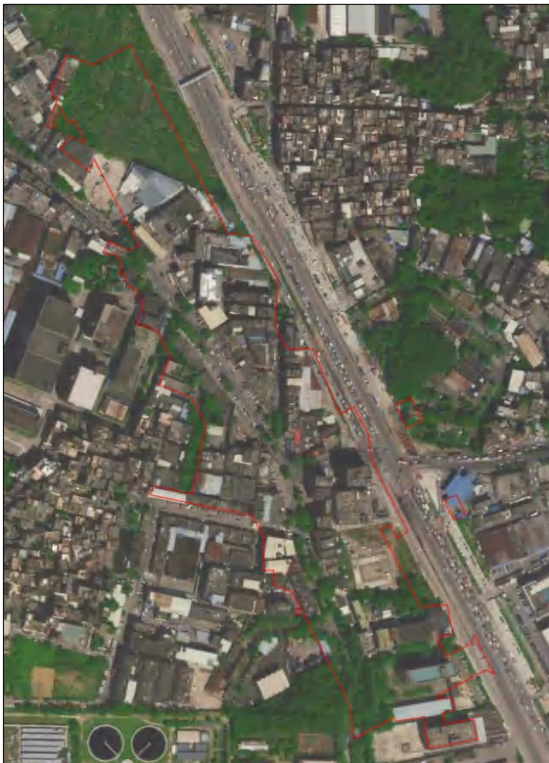
图 4 唐阁停车场卫星红线图