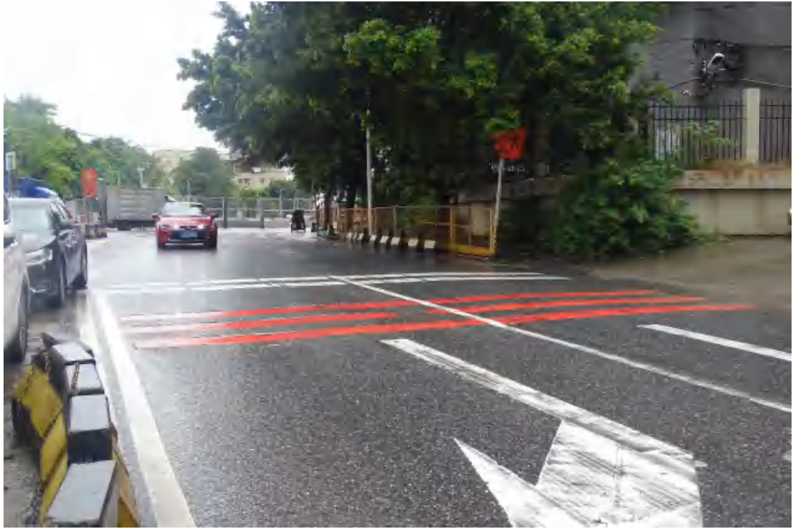
图 14 工程用地北部地表现状（东—西）