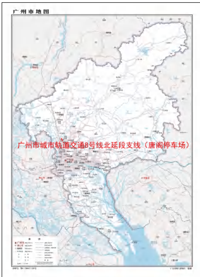
图 1 工程用地在广州市的位置示意图(广东省国土资源厅)

根据《中华人民共和国文物保护法》《广州市文物保护规定》，按照《广州市文物局关于广州市城市轨道交通8号线北延段支线工程(江府-纪念堂)考古调查勘探工作的复函》(文物 2023475 号)的指导意见，受广州地铁建设管理有限公司委托，由我院配合该工程建设，对该工程用地进行考古调查工作。