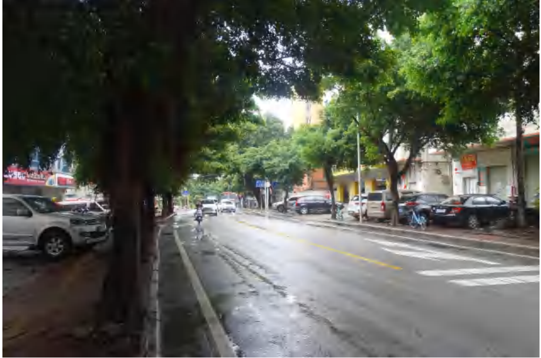
图 26 工程用地南部地表现状（南—北）