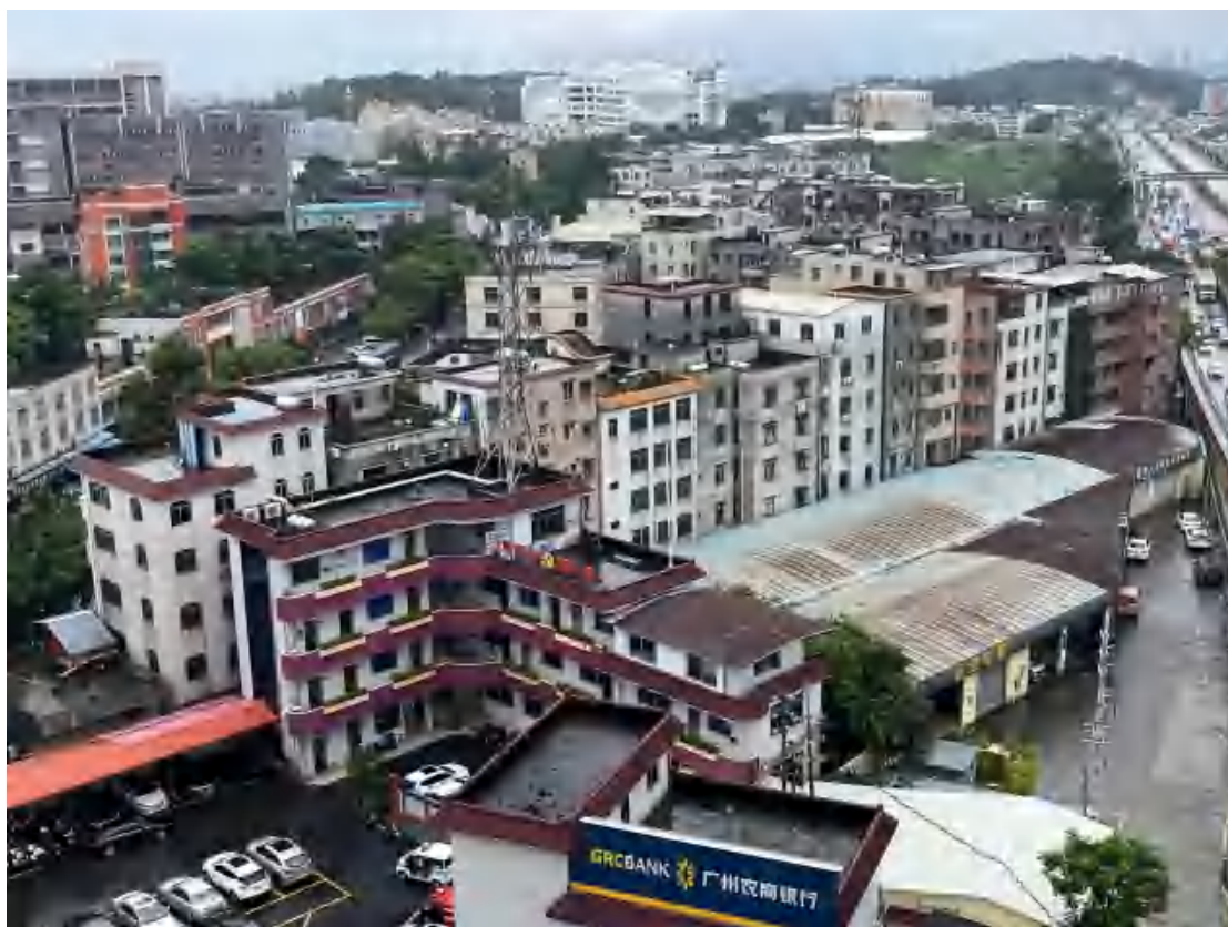
图 12 工程用地北部远景（北—南）