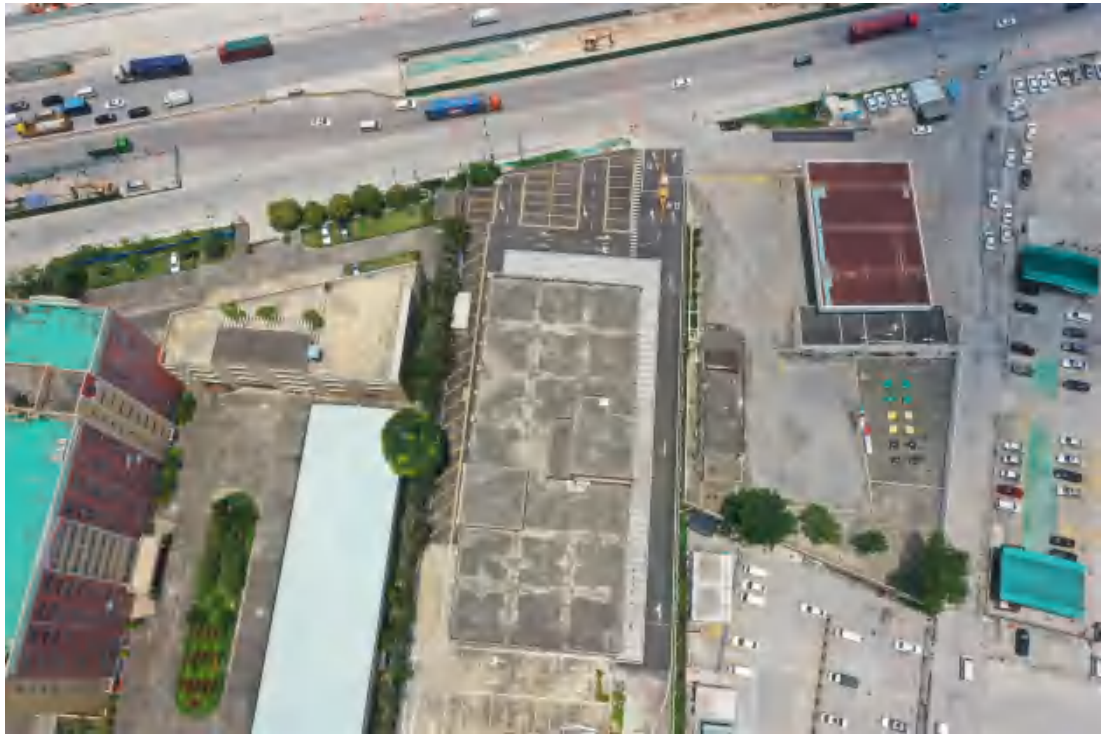
图 10 工程用地航拍图（西—东）