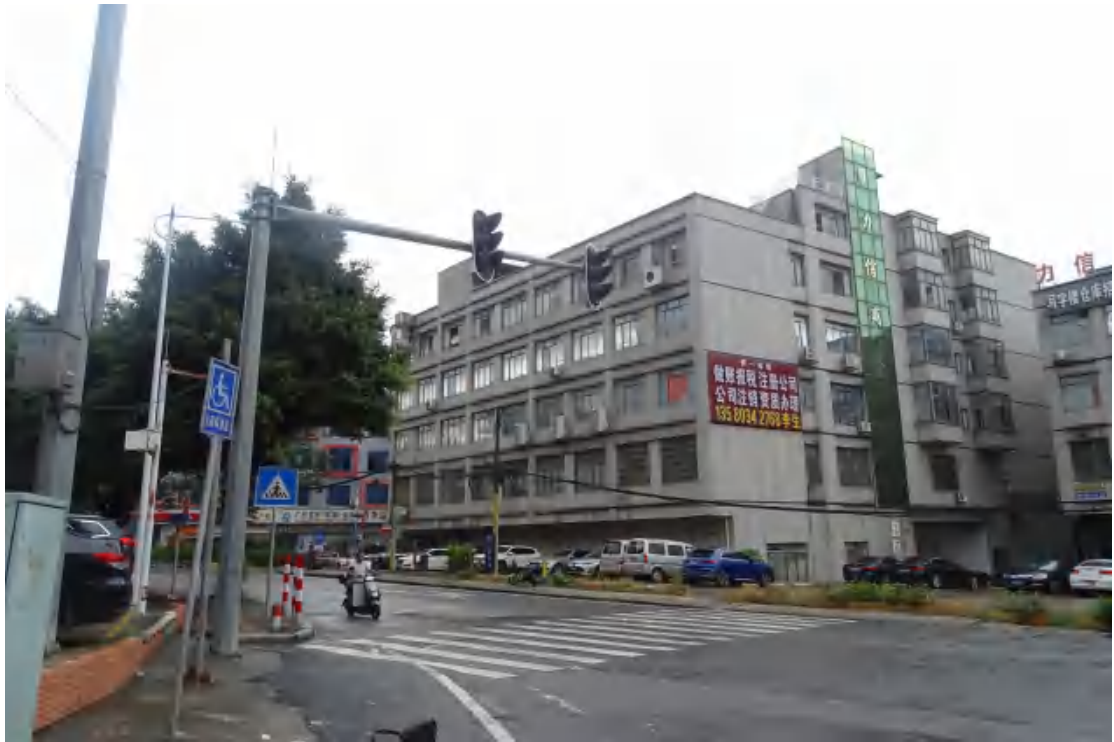
图 15 工程用地北部地表现状（西—东）