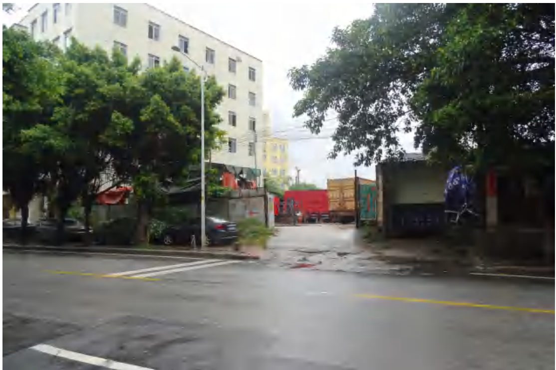
图 25 工程用地南部地表现状（东—西）