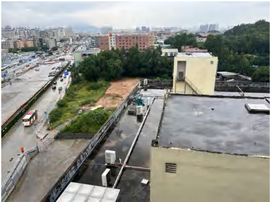
图 11 工程用地北部远景（北—南）