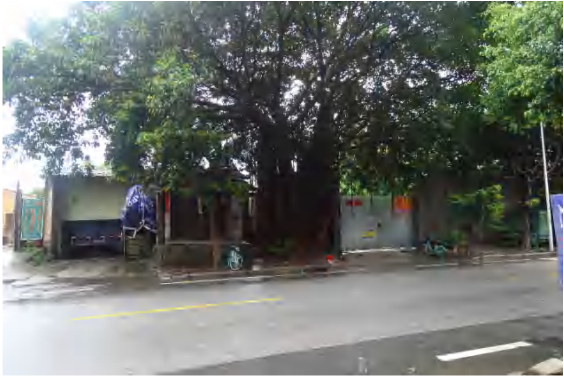
图 24 工程用地南部地表现状（东—西）