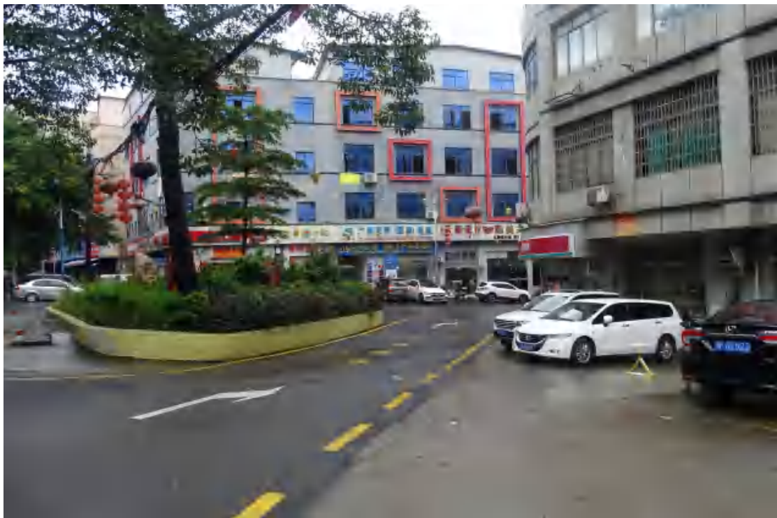
图 21 工程用地南部地表现状（北—南）