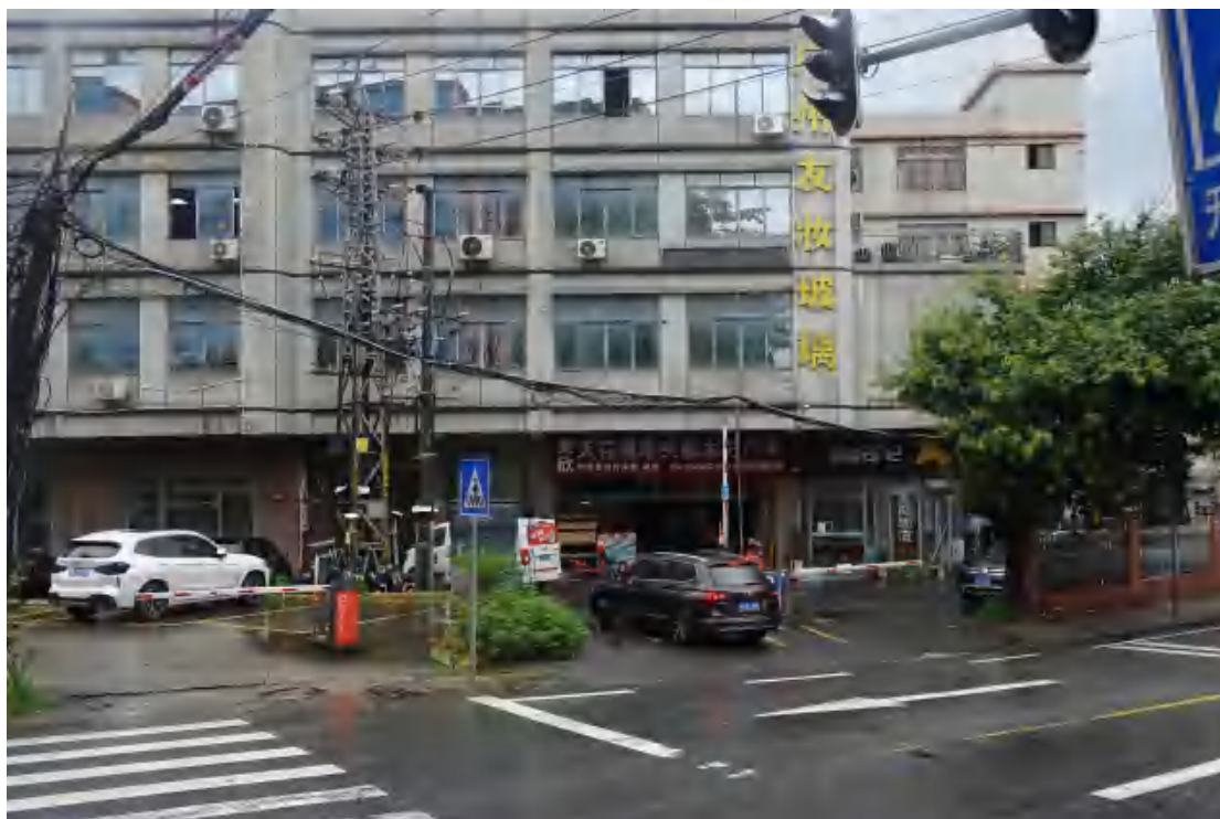
图 16 工程用地北部地表现状（西一东）