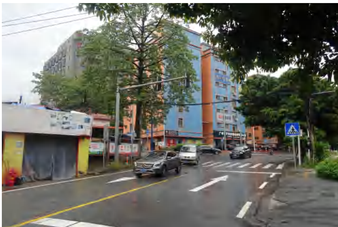
图 19 工程用地北部地表现状（东—西）