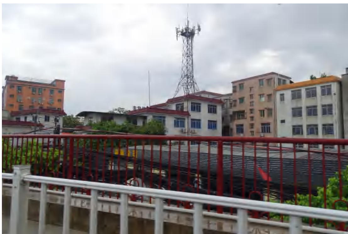
图 13 工程用地北部地表现状（西—东）