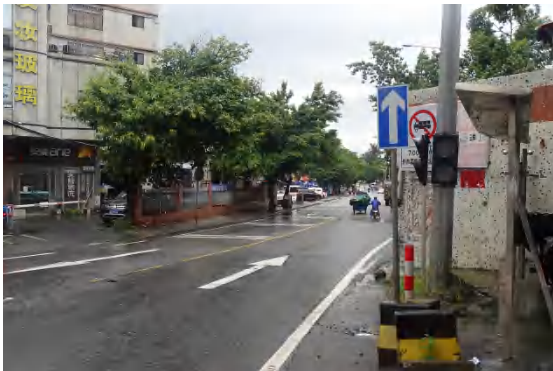
图 18 工程用地北部地表现状（南—北）