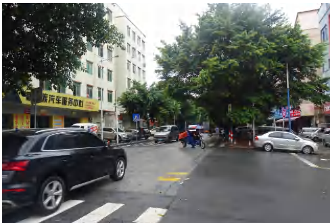
图 22 工程用地南部地表现状（北—南）