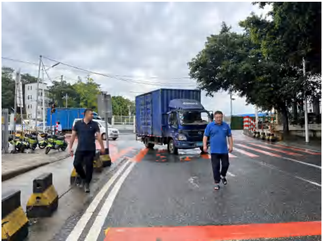
图 7 对工程用地地表进行踏查（东—西）