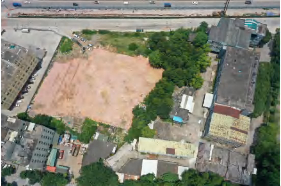
图 8 工程用地航拍图（西—东）