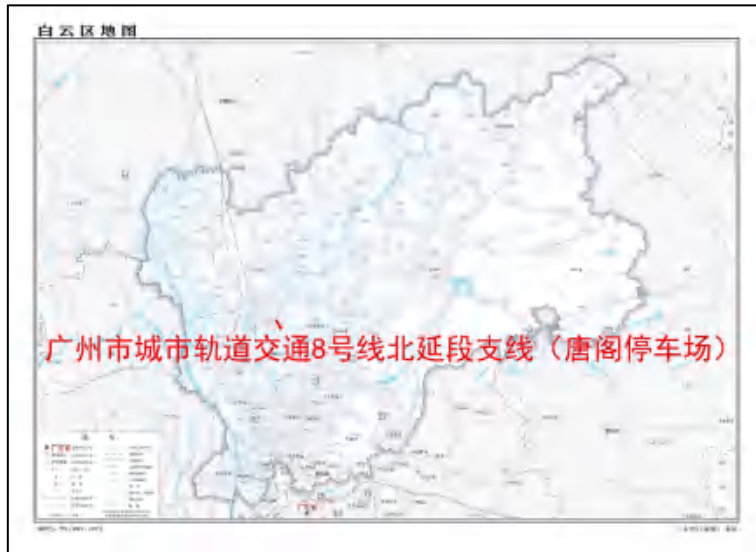
图 2 地块在白云区的位置示意图（广东省国土资源厅）