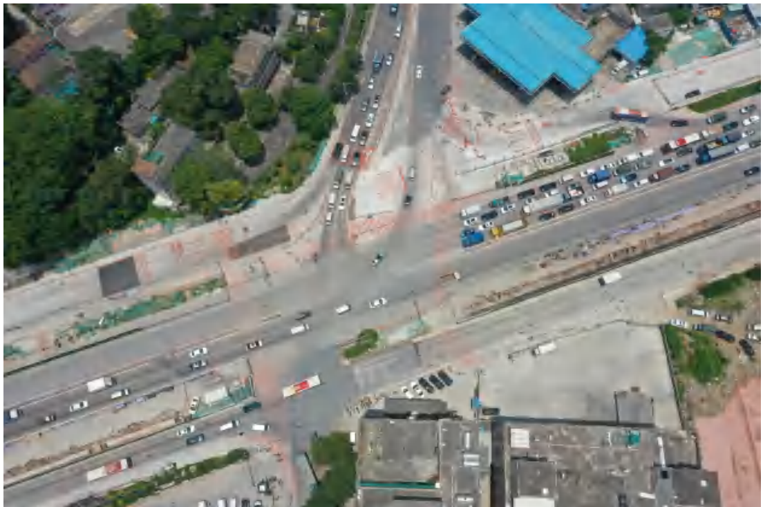
图 9 工程用地航拍图（西—东）