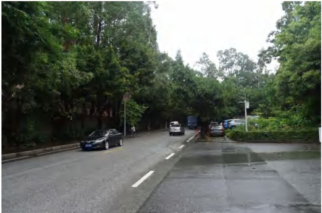
图 27 工程用地南部地表现状（北—南）