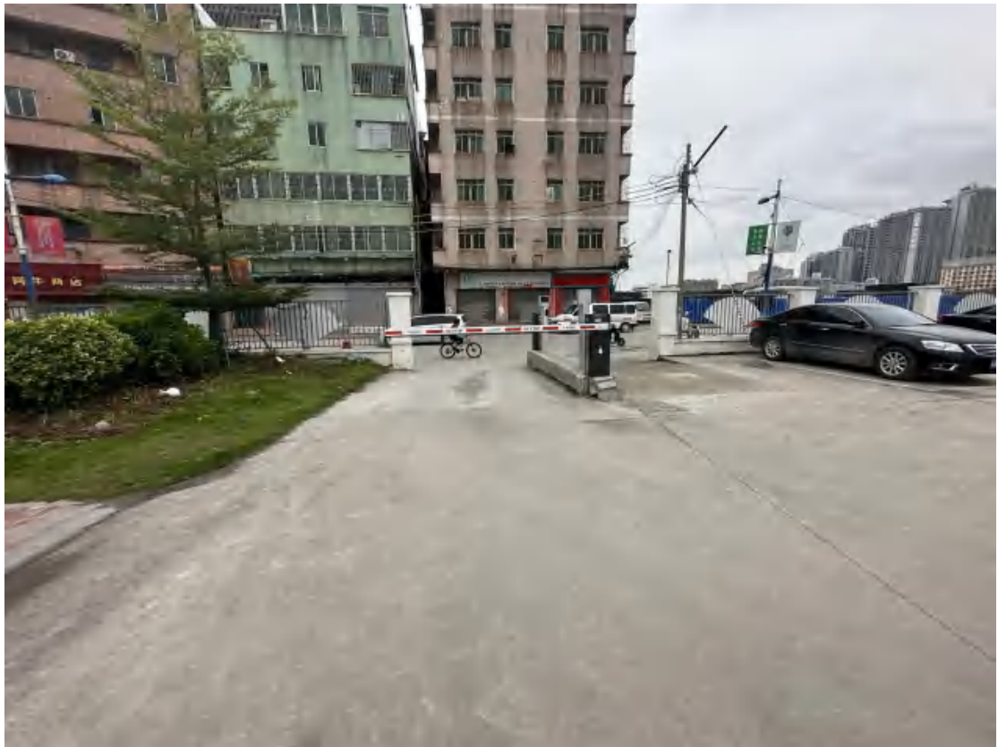
图 32 工程用地南部地表现状（东-西）