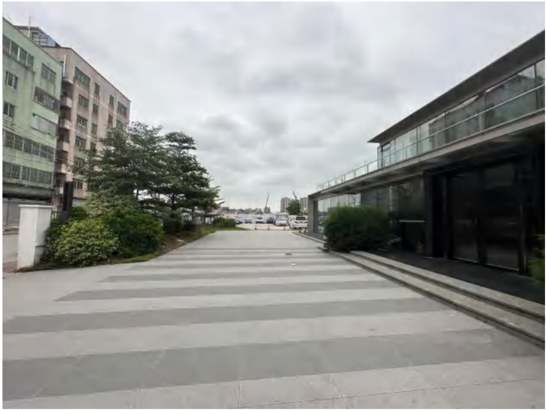
图 31 工程用地南部地表现状（南-北）