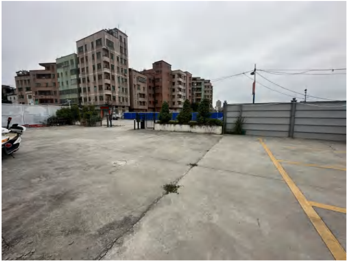
图 27 工程用地南部地表现状（东-西）