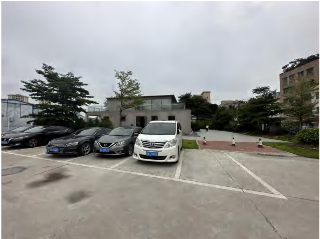
图 26 工程用地南部地表现状（北-南）