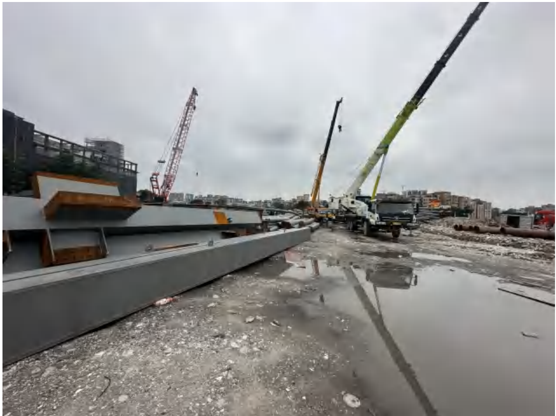
图 12 工程用地北部地表现状（北-南）