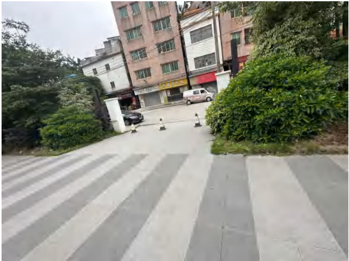
图 30 工程用地南部地表现状（东-西）