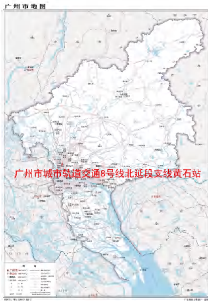
图 1 工程用地在广州市的位置示意图 (广东省国土资源厅)

根据《中华人民共和国文物保护法》《广州市文物保护规定》，按照《广州市文物局关于广州市城市轨道交通 8 号线北延段支线工程(江府-纪念堂)考古调查勘探工作的复函》(文物 2023475 号)的指导意见，受中铁六局集团有限公司委托，由我院配合该工程建设，对该工程用地进行考古调查工作。