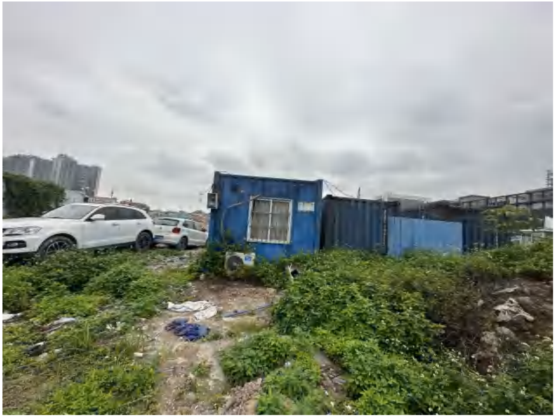
图 21 工程用地南部地表现状（南-北）