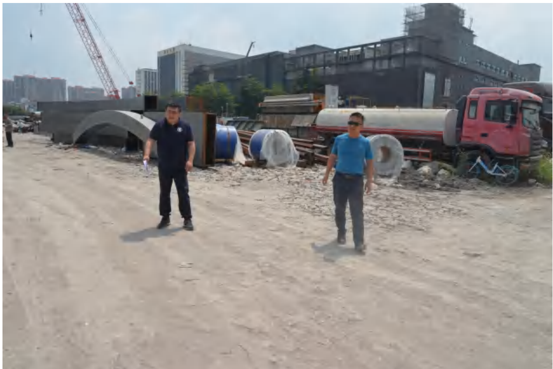
图 6 对工程用地地表进行踏查（西-东）