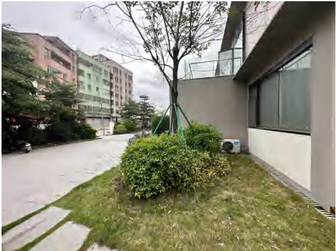
图 28 工程用地南部地表现状（南-北）