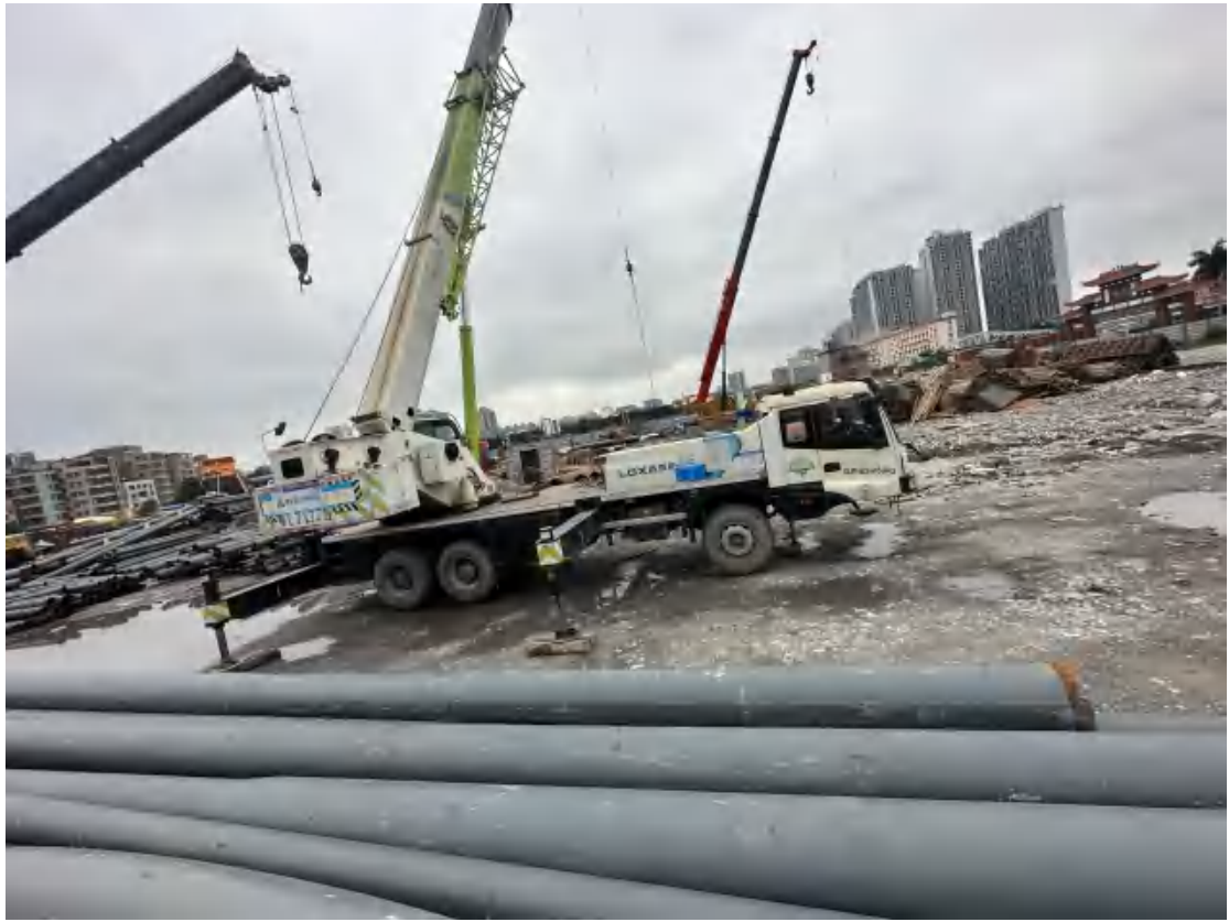
图 15 工程用地北部地表现状（东-西）