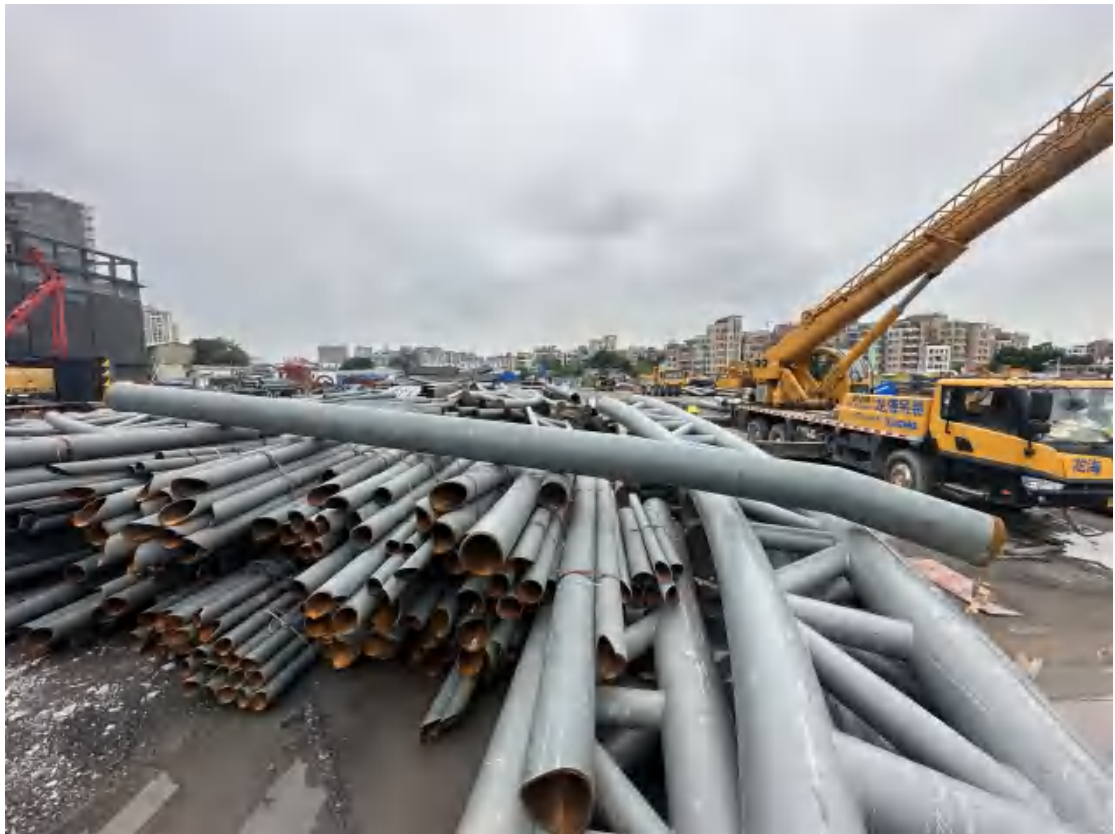
图 16 工程用地北部地表现状（北-南）