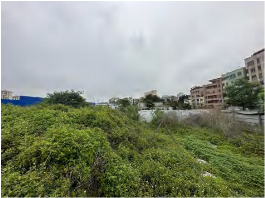
图 23 工程用地南部地表现状（北-南）