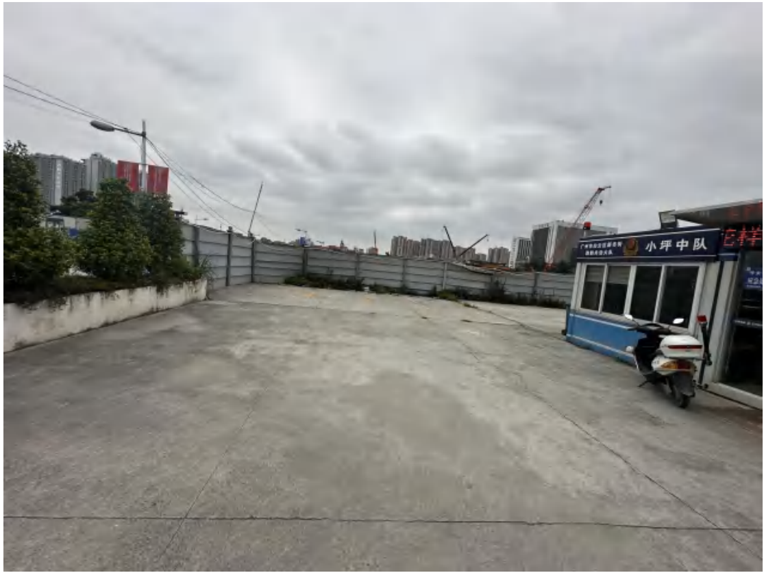
图 25 工程用地南部地表现状（南-北）