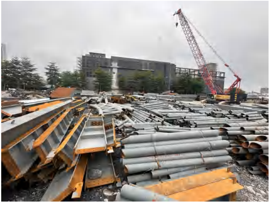
图 17 工程用地北部地表现状（西-东）