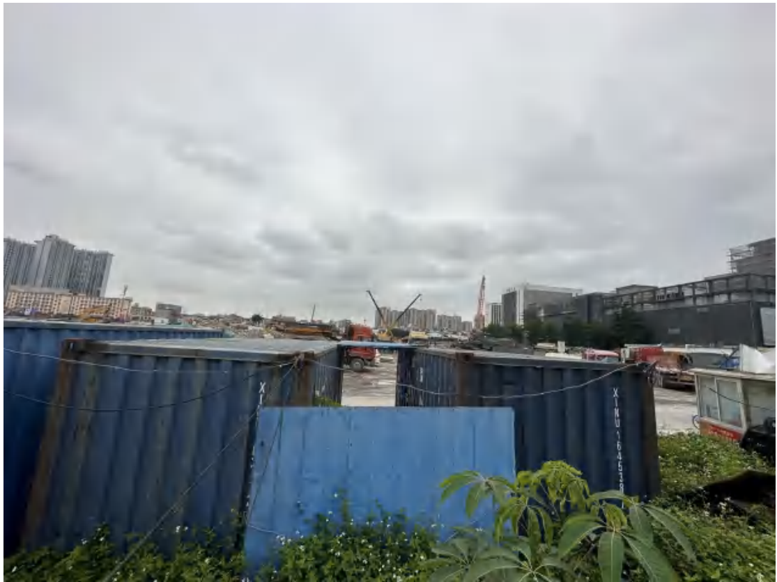
图 24 工程用地南部地表现状（南-北）