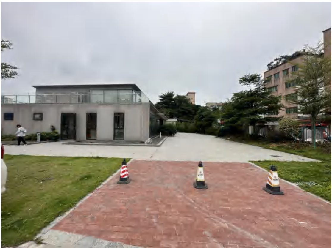
图 20 工程用地南部地表现状（北-南）