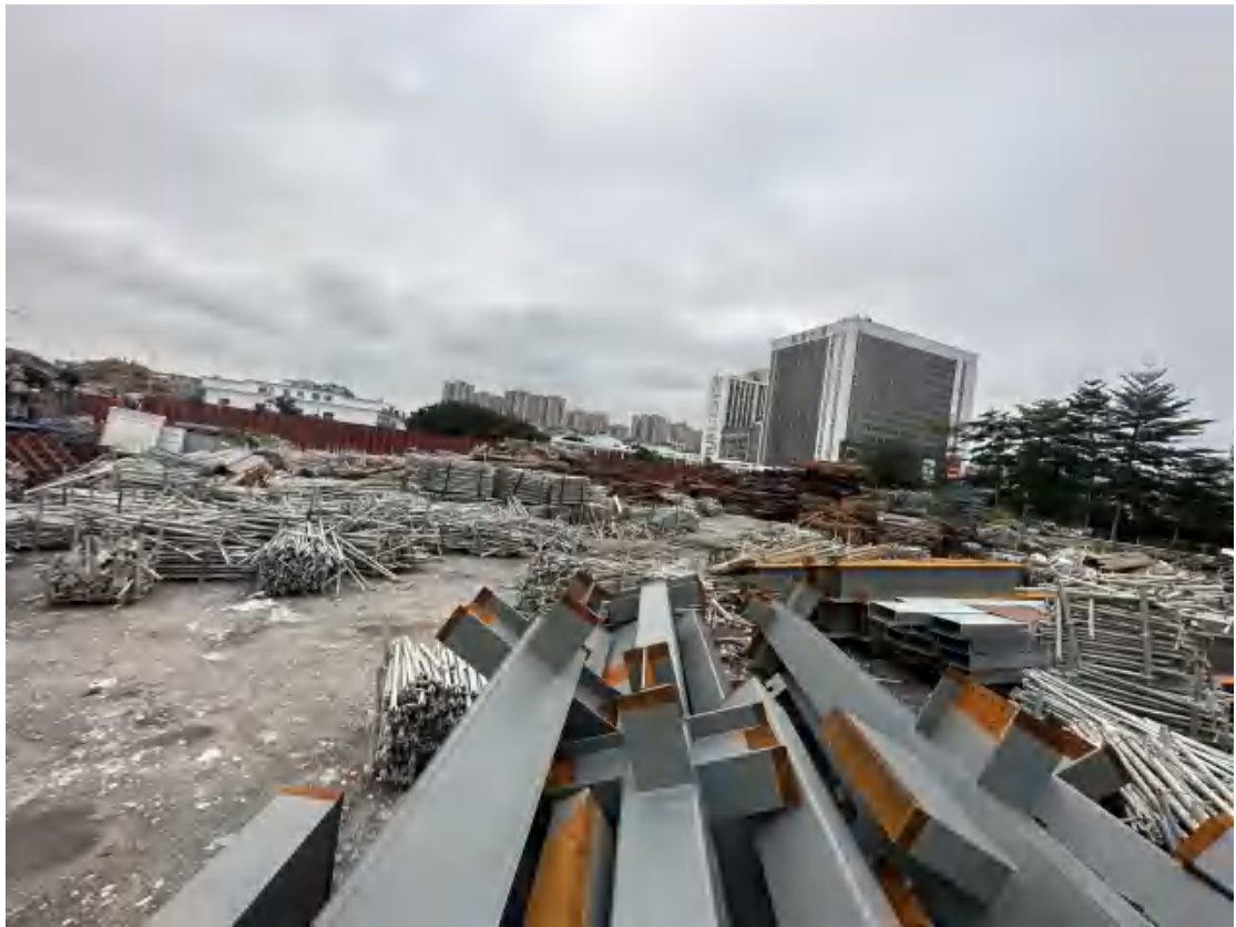
图 14 工程用地北部地表现状（南-北）