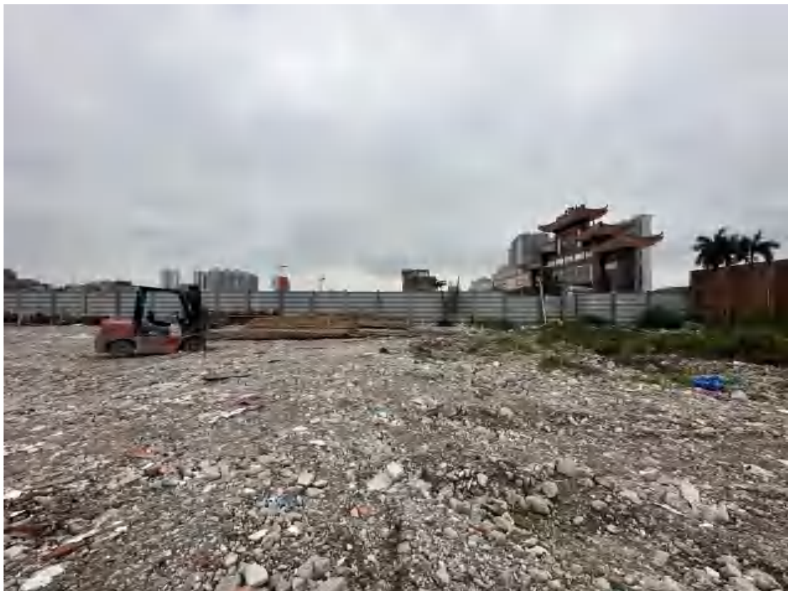
图 8 工程用地北部地表现状（东-西）