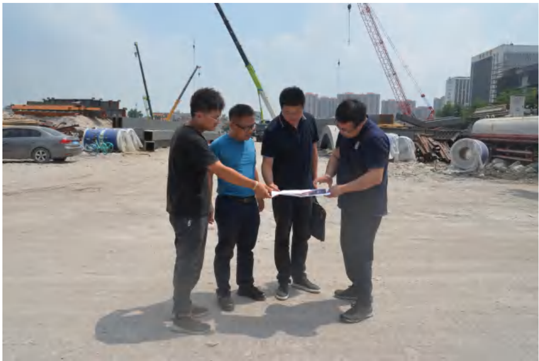
图 5 与工作人员确认工程用地范围（南-北）