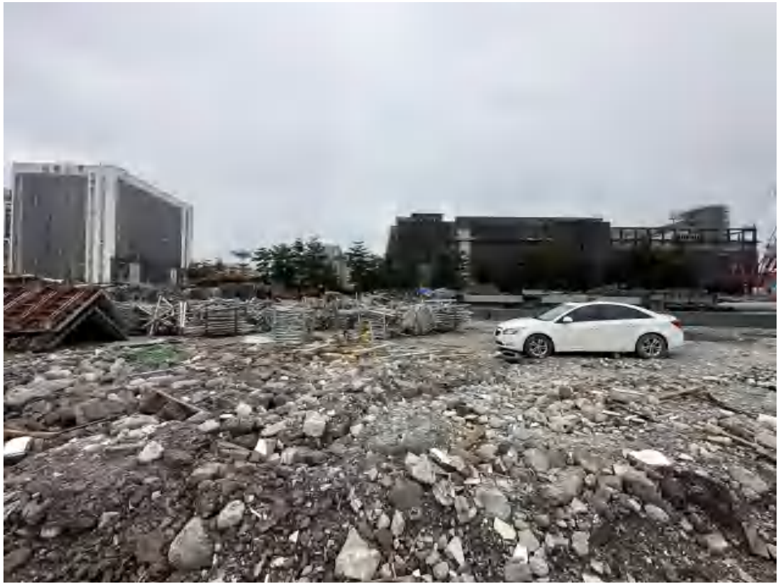
图 11 工程用地北部地表现状（西-东）