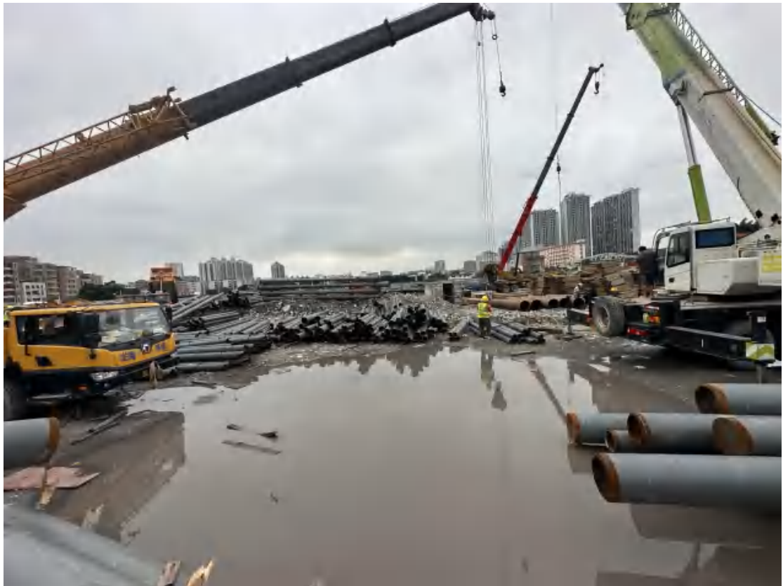
图 18 工程用地北部地表现状（东-西）