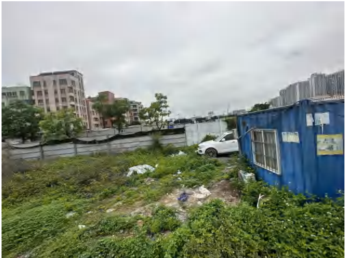
图 22 工程用地南部地表现状（东-西）