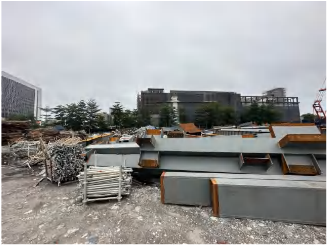
图 13 工程用地北部地表现状（西-东）