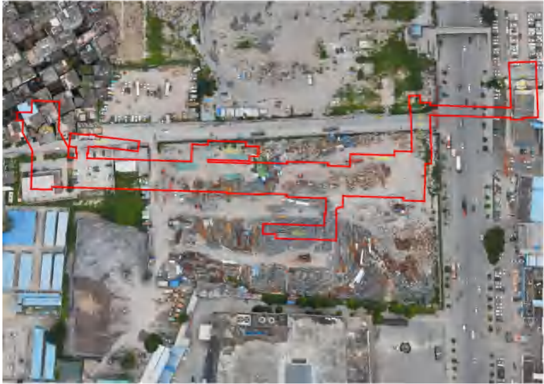
图 7 工程用地航拍图