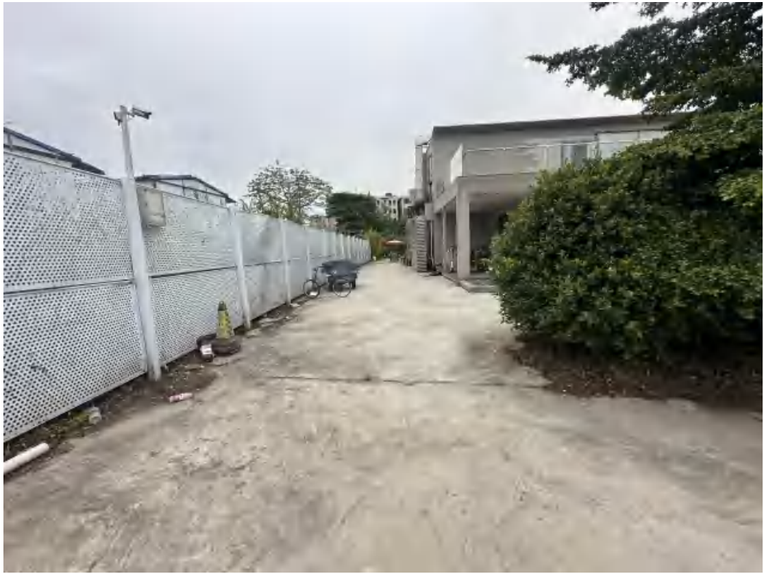
图 29 工程用地南部地表现状（北-南）