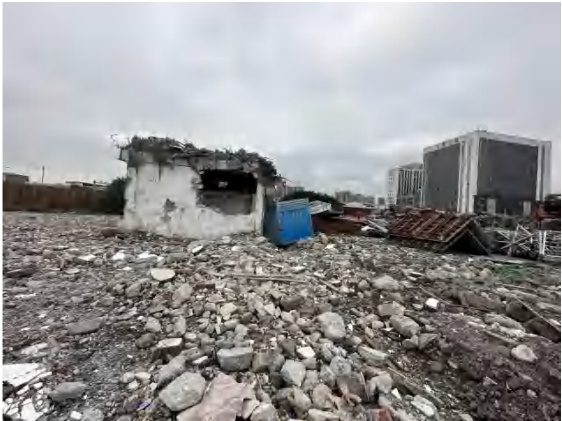
图 10 工程用地北部地表现状（南-北）