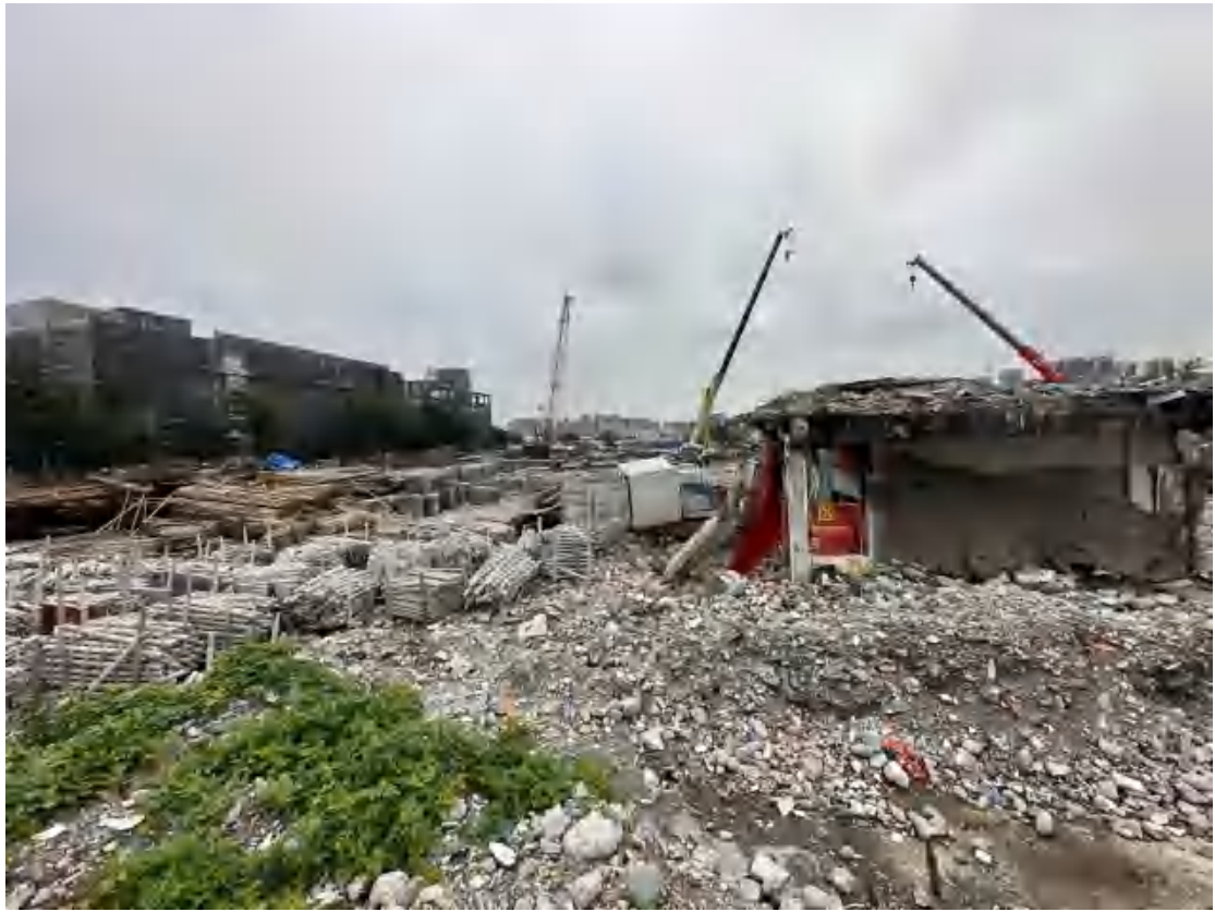
图 9 工程用地北部地表现状（北-南）