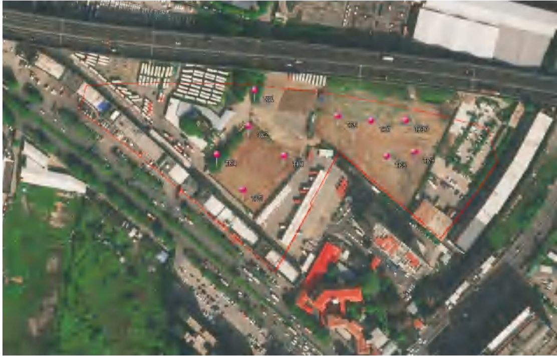
图 30 试探孔分布示意图

为了进一步了解并掌握该地块内地层堆积情况，我们在地块内进行试探，共布设 10 个标准型试探孔，编号为 TK1-TK10，具体介绍如下：