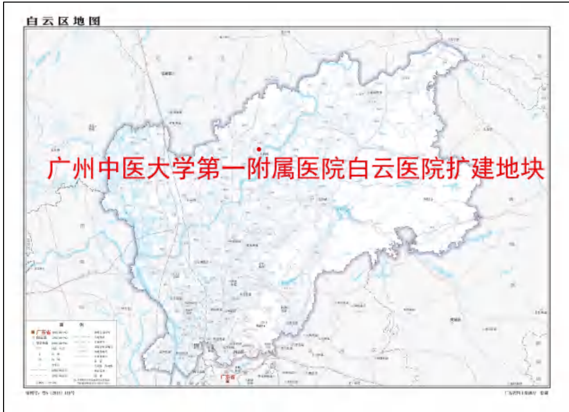
图 2 地块在白云区的位置示意图（广东省国土资源厅）