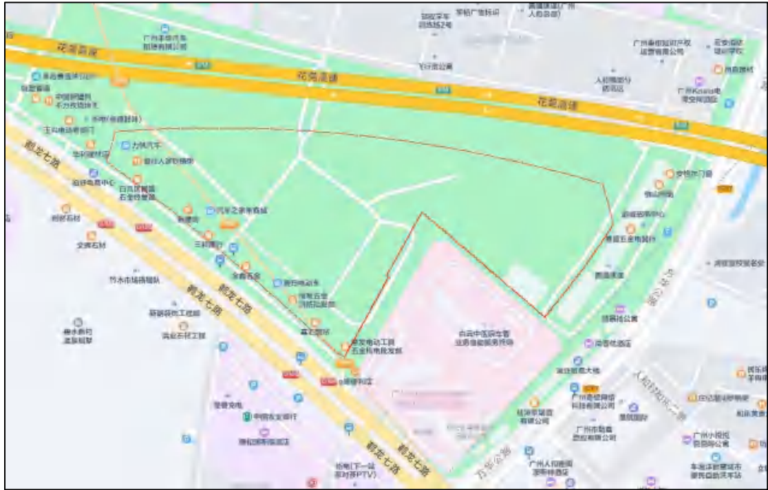
图 4 地块周边环境示意图（腾讯地图）