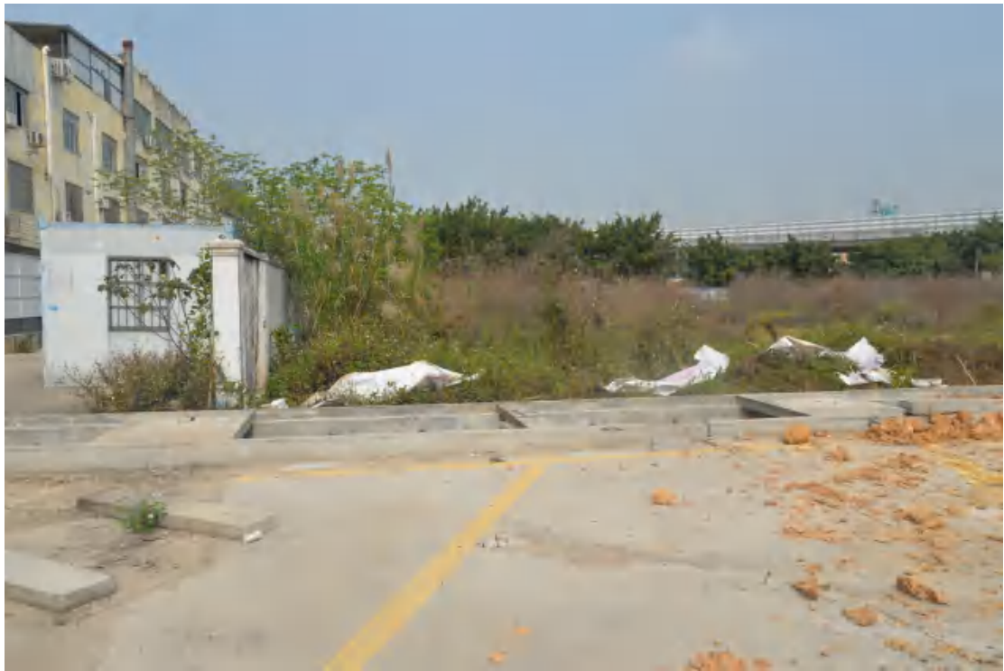
图 19 地块地表现状（南-北）