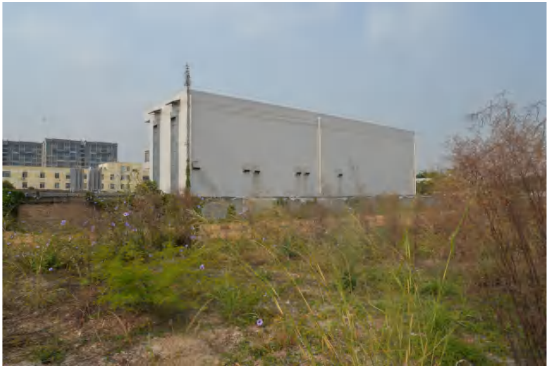
图 27 地块地表现状（东—西）