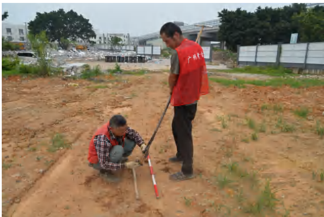
图 33 试探孔土样分析（东—西）