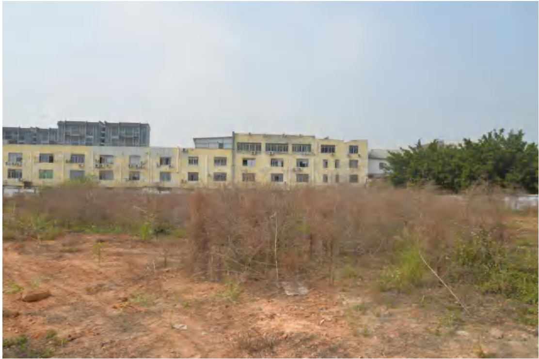
图 20 地块地表现状（东-西）