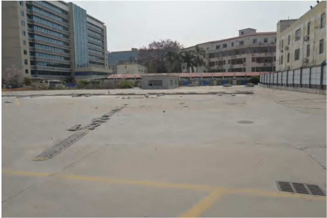
图 28 地块地表现状（北—南）