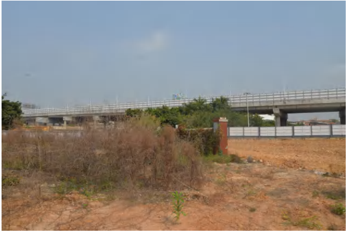
图 14 地块地表现状（南—北）