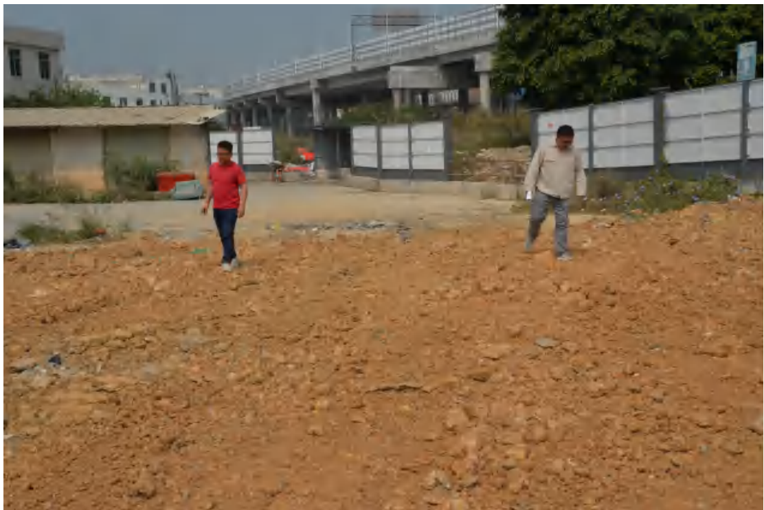
图 7 对地块地表进行踏查（东-西）