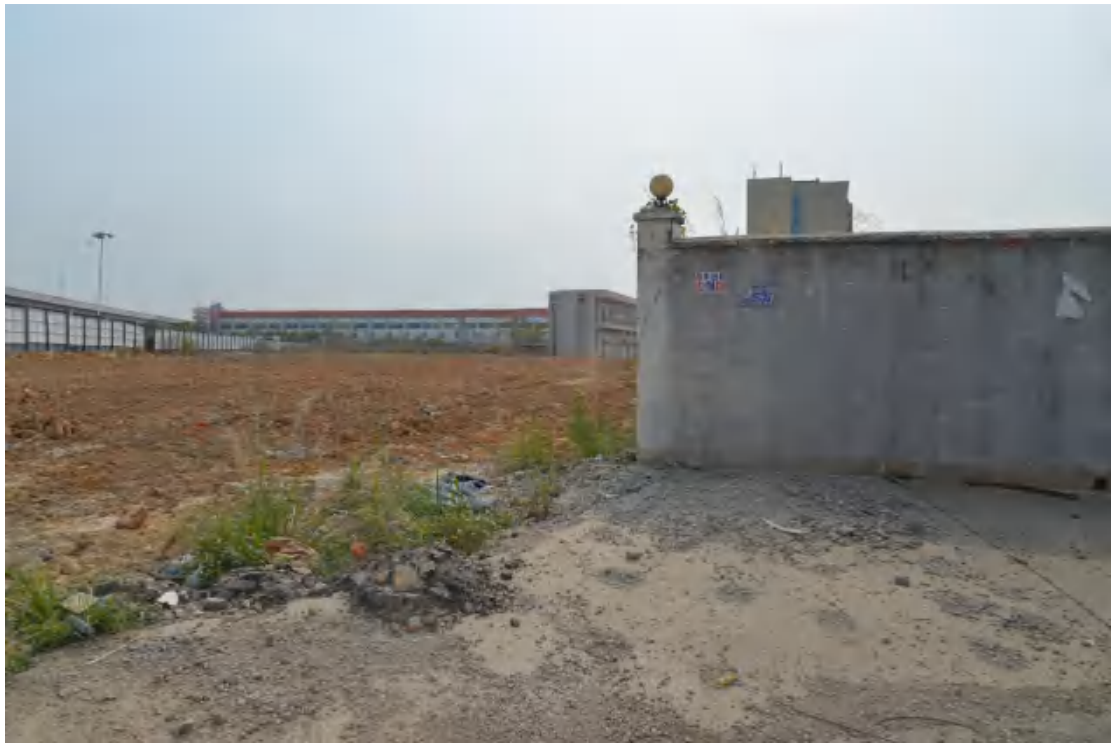
图 11 地块地表现状（西-东）