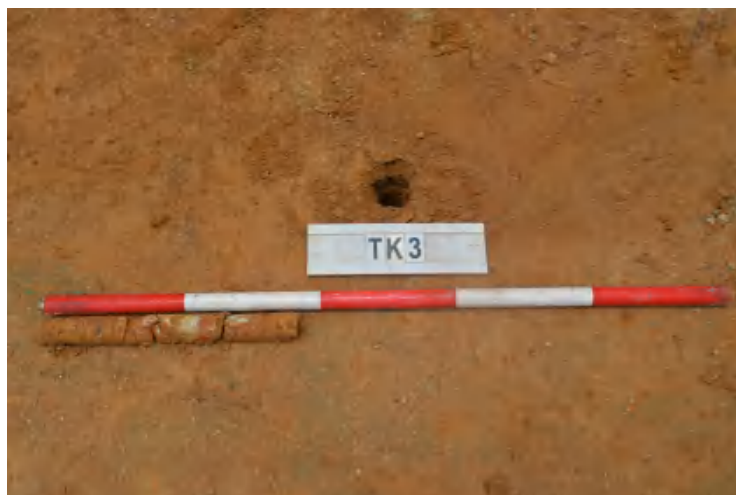
图 36 TK3 土样（一米标杆，土样由左往右）

①层：现代回填土层，为红褐色沙土，土质疏松，含植物根系、石粒等；探至 0.4 米，石块阻拦，无法向下提取土样。