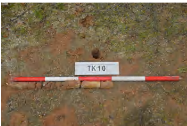
图 43 TK10 土样（一米标杆，土样由左往右）

①层：现代回填土层，为红褐色沙土，土质疏松，含植物根系、石粒等；探至 0.6 米，石块阻拦，无法向下提取土样。