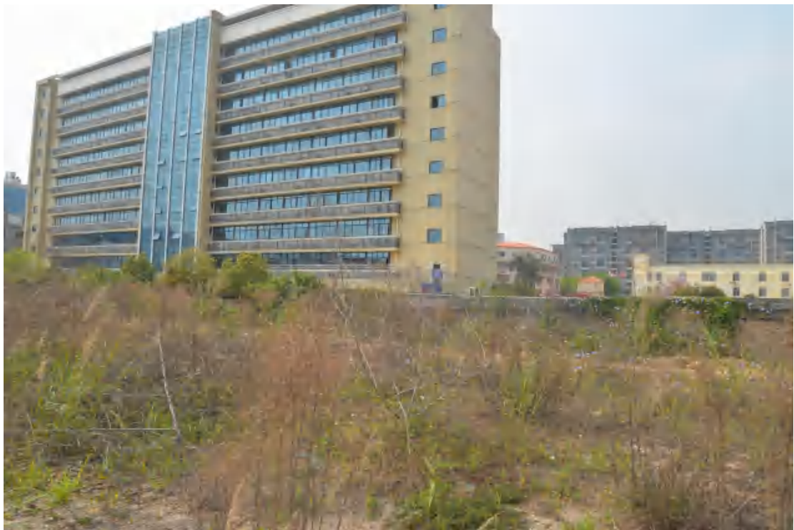
图 23 地块地表现状（北—南）