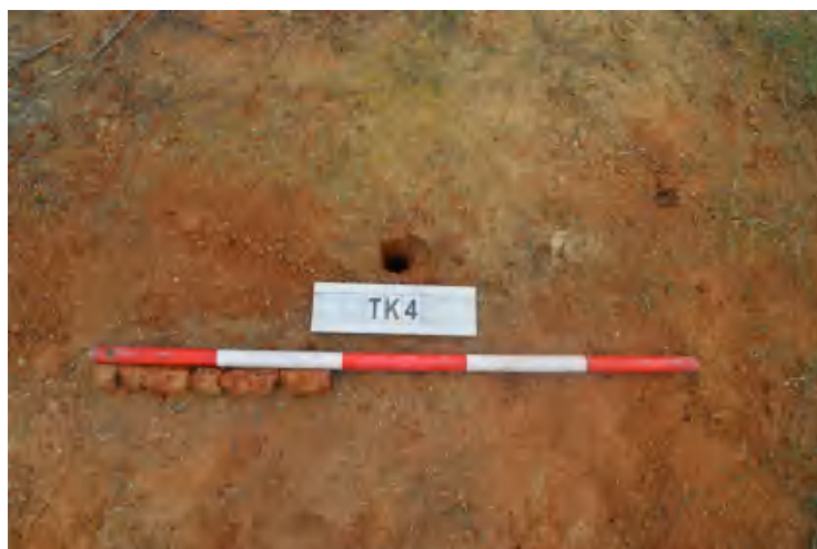
图 37 TK4 土样（一米标杆，土样由左往右）

①层：现代回填土层，为红褐色沙土，土质疏松，含植物根系、石粒等；探至 0.4 米，石块阻拦，无法向下提取土样。