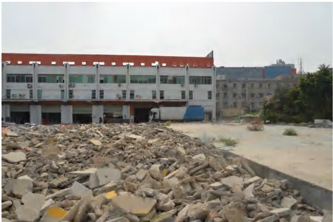
图 25 地块地表现状（北—南）