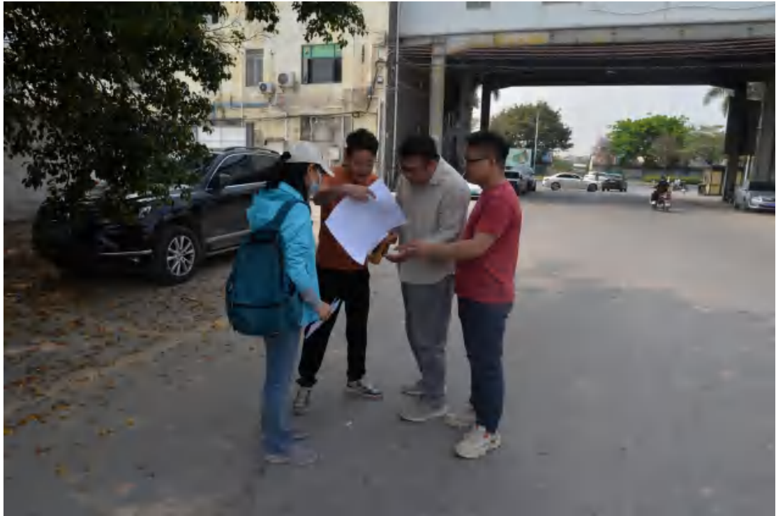
图 6 与甲方工作人员确认地块范围（北-南）