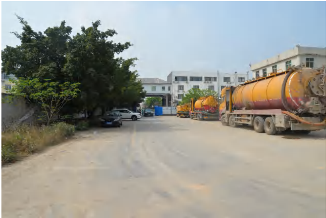
图 13 地块地表现状（北—南）