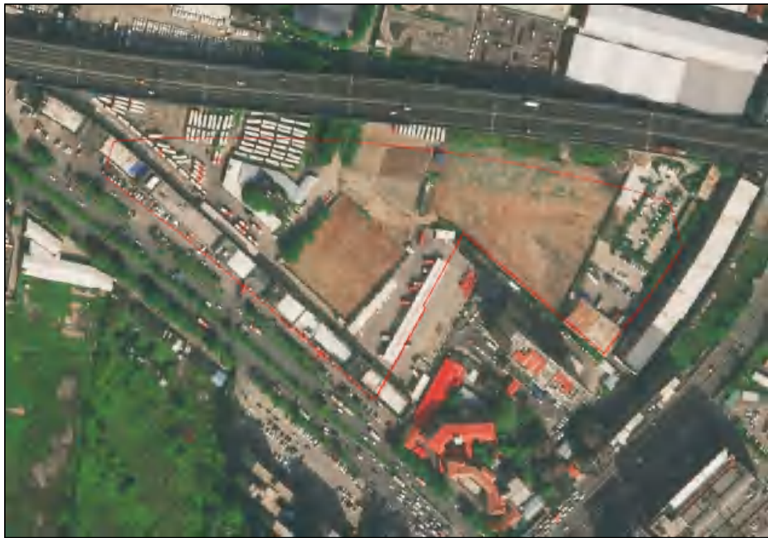
图 3 地块卫星红线示意图（高德地图）