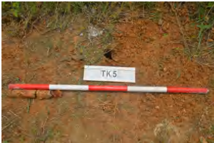
图 38 TK5 土样（一米标杆，土样由左往右）

①层：现代回填土层，为红褐色沙土，土质疏松，含植物根系等；探至 0.25 米，石块阻拦，无法向下提取土样。