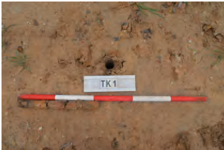
图 34 TK1 土样（一米标杆，土样由左往右）

①层：现代回填土层，为红褐色沙土，土质疏松，含植物根系、石粒等；探至 0.4 米，石块阻拦，无法向下提取土样。