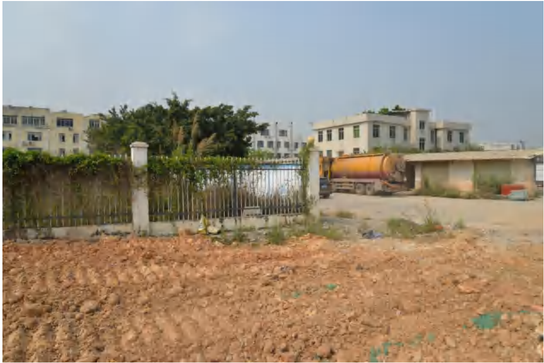
图 16 地块地表现状（东—西）