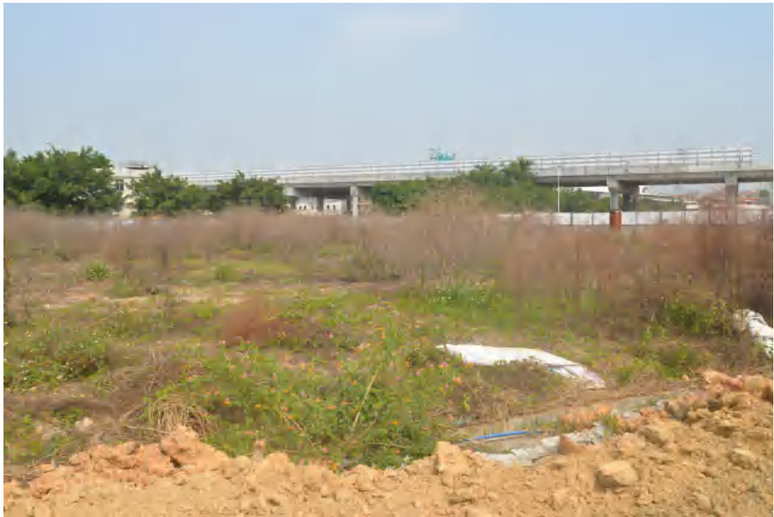
图 17 地块地表现状（南—北）