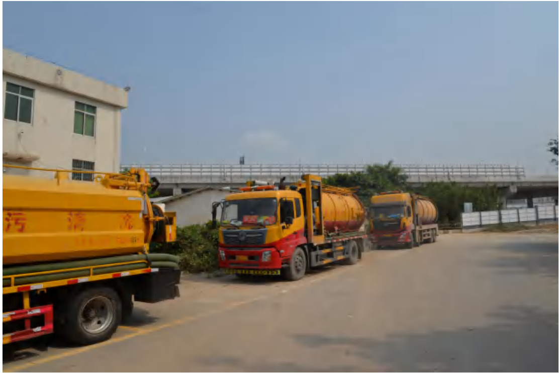
图 8 地块地表现状(南—北)