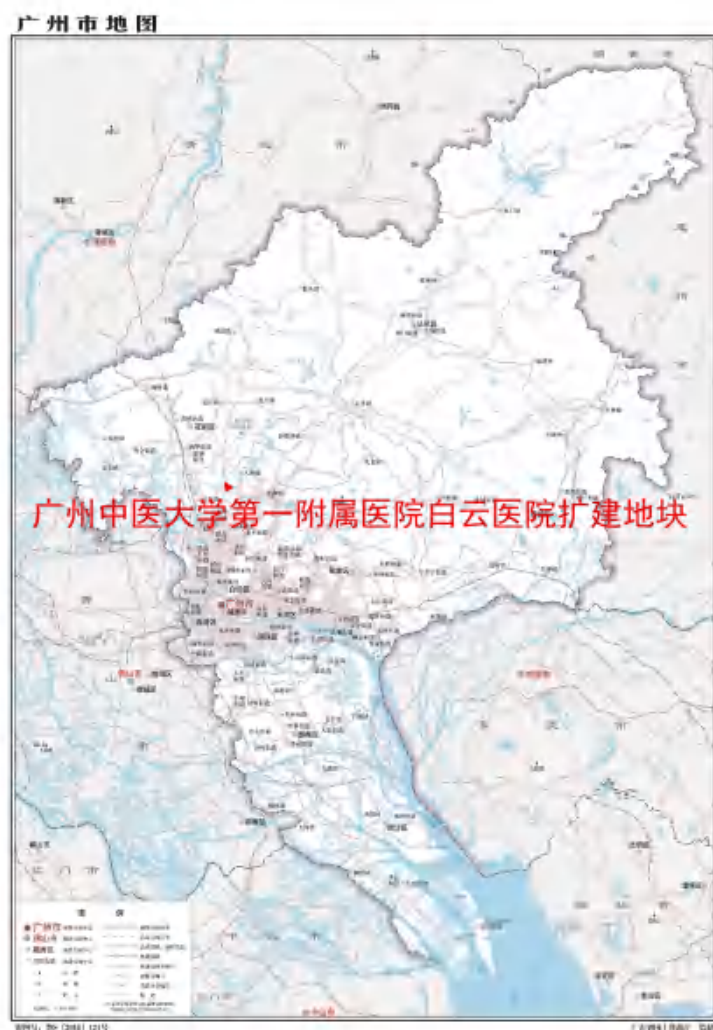
图1 地块在广州市的位置示意图（广东省国土资源厅）

根据《中华人民共和国文物保护法》《广州市文物保护规定》，按照《广州市文物局关于白云区广州中医药大学第一附属医院白云医院扩建地块考古调查勘探工作的复函》（文物2022855号）的指导意见，受广州中医药大学第一附属医院白云医院委托，由我院配合该地块建设，对该地块进行考古调查工作。