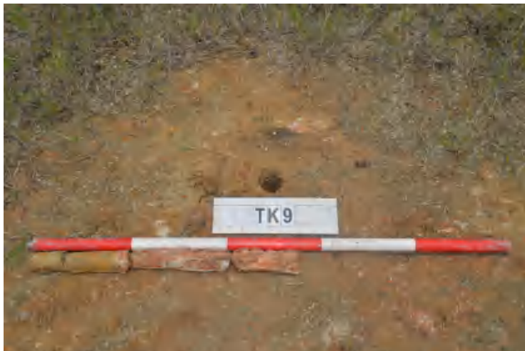
图 42 TK9 土样（一米标杆，土样由左往右）

①层：现代回填土层，为黄褐色沙土，土质疏松，含植物根系、石粒等；探至 0.55 米，石块阻拦，无法向下提取土样。