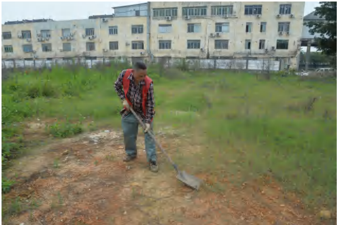
图 31 试探孔地表清理（北—南）