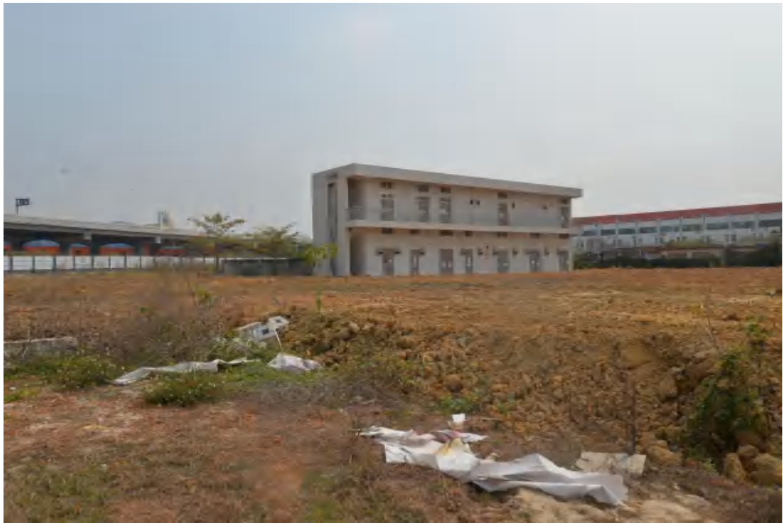
图 21 地块地表现状（西-东）