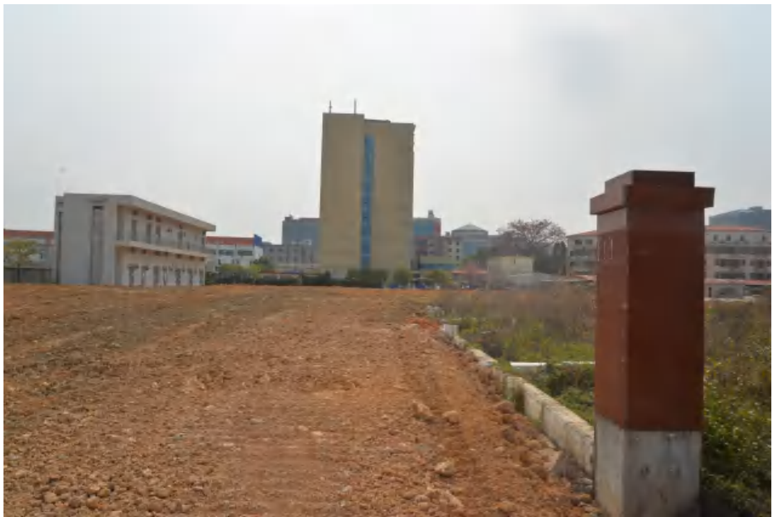
图 15 地块地表现状（北—南）