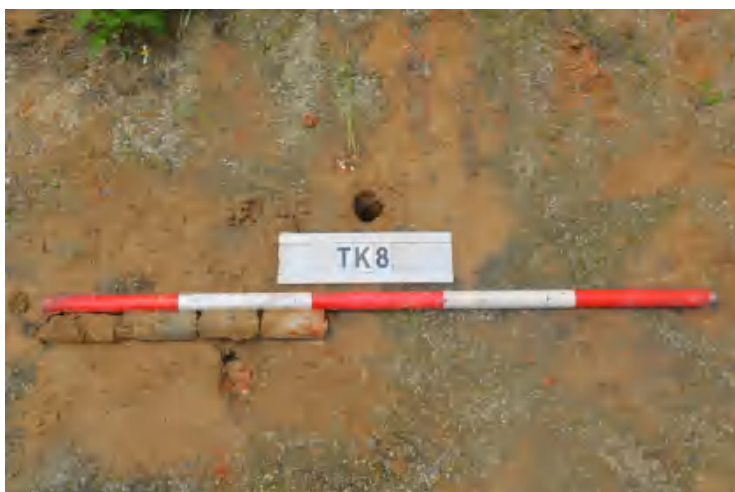
图 41 TK8 土样（一米标杆，土样由左往右）

①层：现代回填土层，为红褐色沙土，土质疏松，含植物根系、石粒等；探至 0.4 米，石块阻拦，无法向下提取土样。