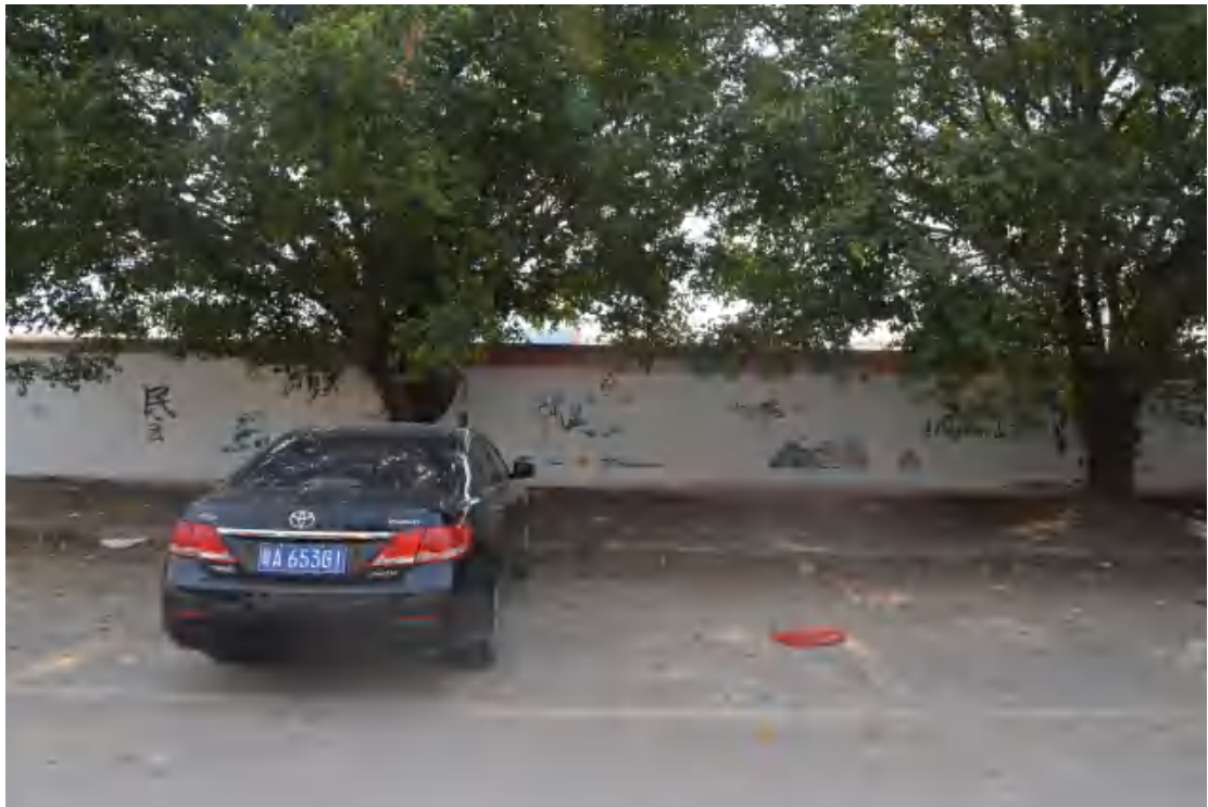
图 29 地块地表现状（西—东）