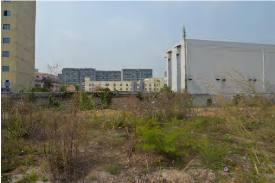
图 22 地块地表现状（东—西）