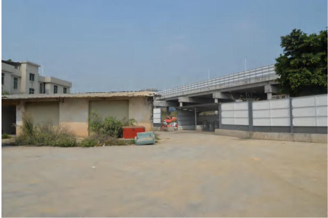
图 10 地块地表现状（东-西）