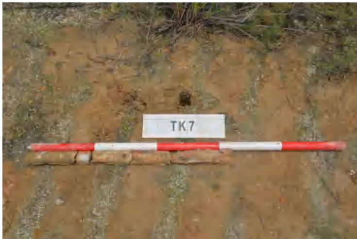
图 40 TK7 土样（一米标杆，土样由左往右）

①层：现代回填土层，为黄褐色沙土，土质疏松，含植物根系、石粒等；探至 0.6 米，石块阻拦，无法向下提取土样。