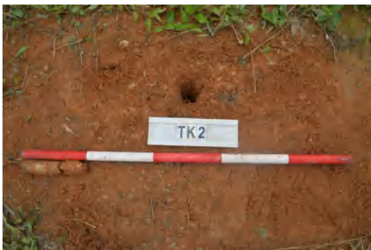
图 35 TK2 土样（一米标杆，土样由左往右）

①层：现代回填土层，为红褐色沙土，土质疏松，含植物根系、石粒等；探至 0.2 米，石块阻拦，无法向下提取土样。