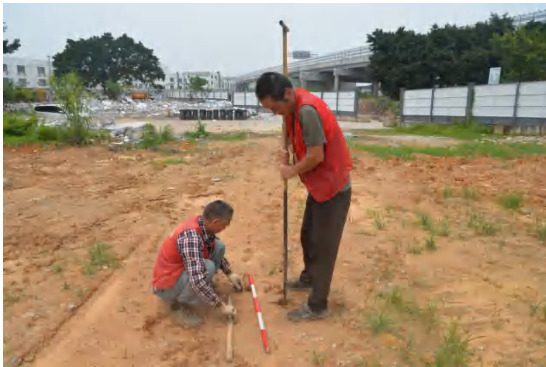
图 32 试探孔土样提取（东—西）