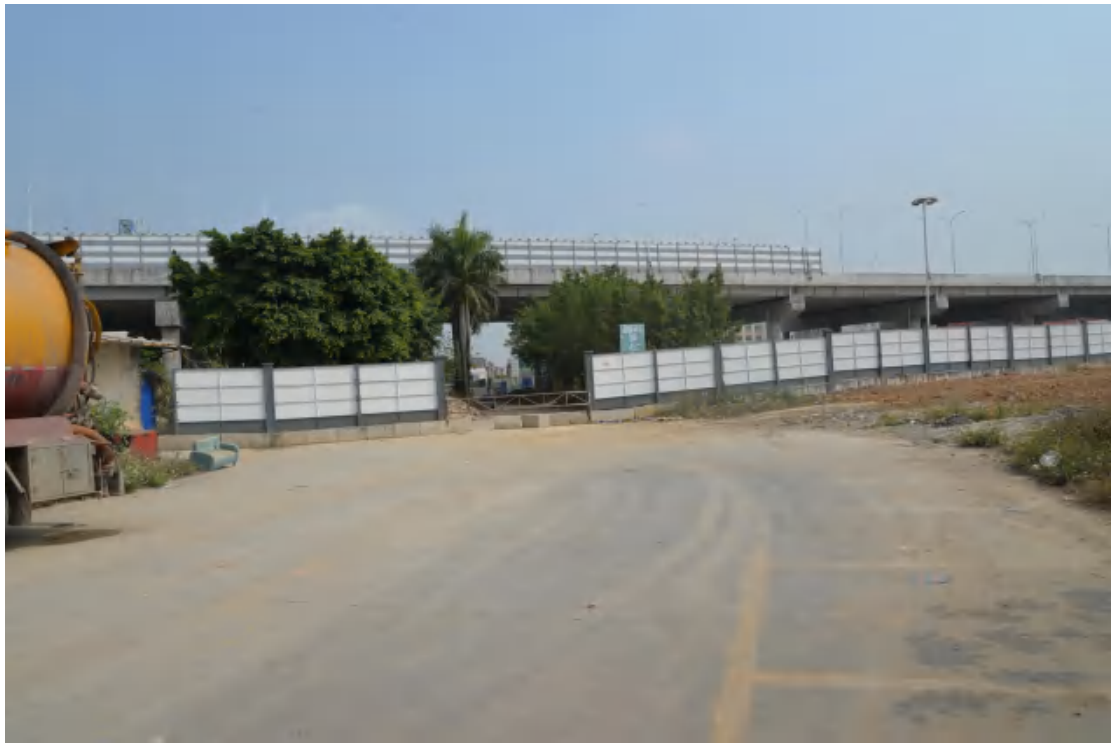
图 9 地块地表现状(南—北)