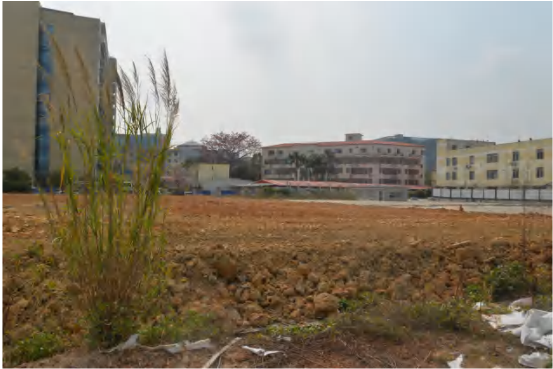
图 18 地块地表现状（北-南）