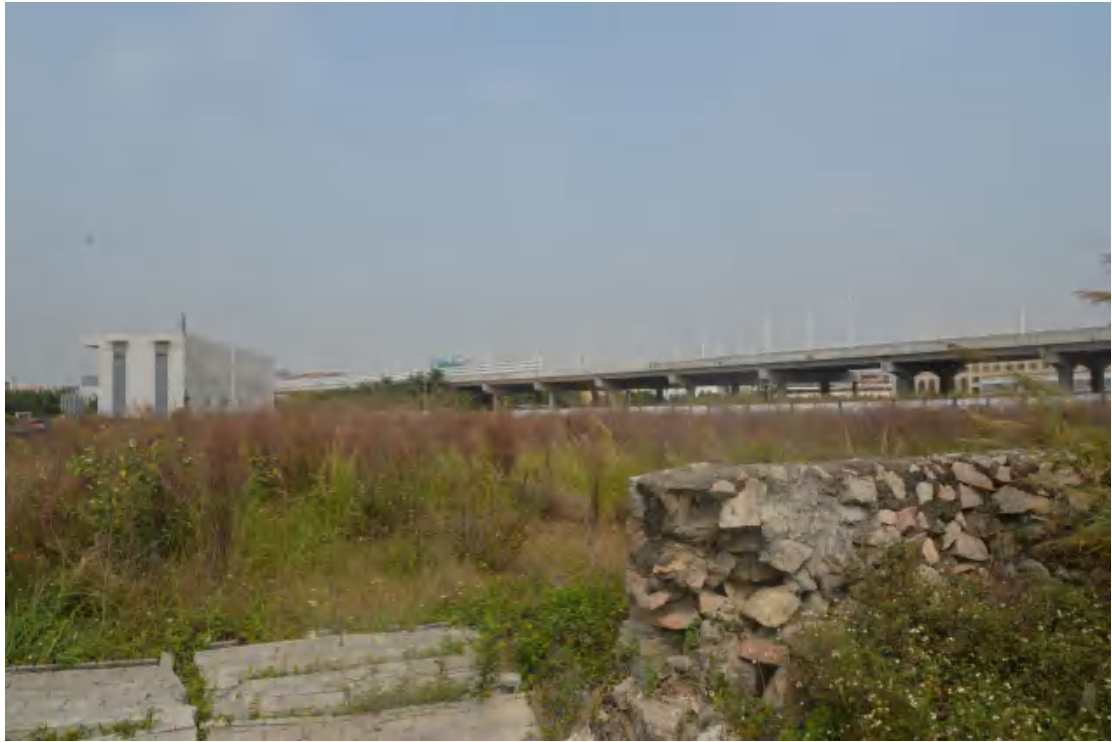
图 24 地块地表现状（南—北）