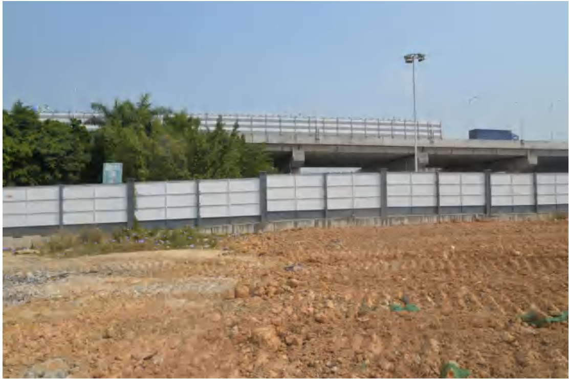
图 12 地块地表现状（南—北）