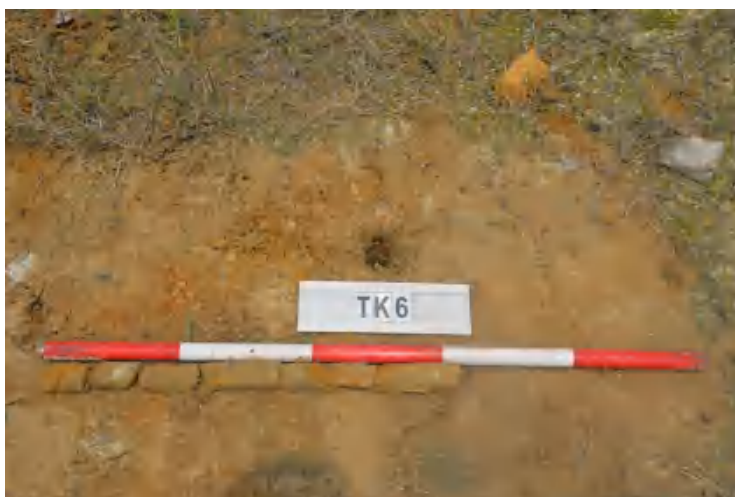
图 39 TK6 土样（一米标杆，土样由左往右）

①层：现代回填土层，为黄褐色沙土，土质疏松，含植物根系、石粒等；探至 0.65 米，石块阻拦，无法向下提取土样。