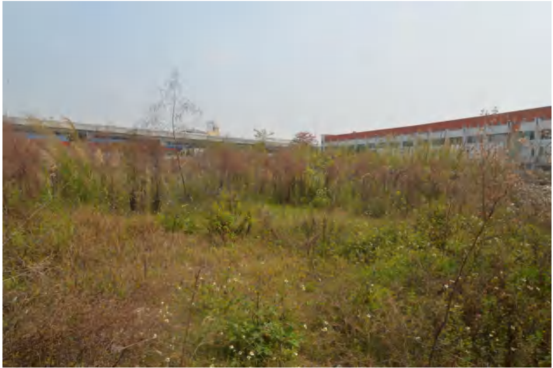
图 26 地块地表现状（西—东）