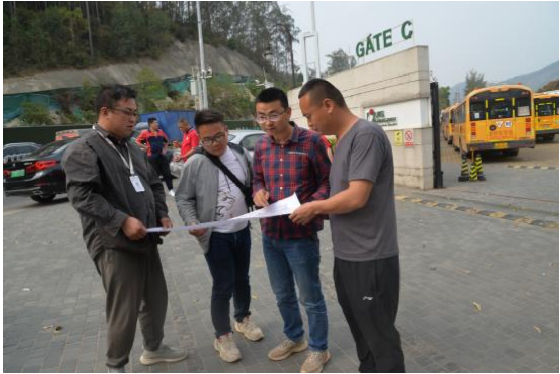
图 7 与现场工作人员确定地块范围（东-西）