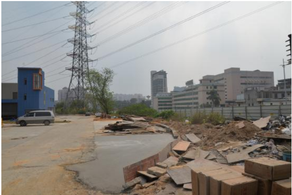
图 26 工程用地南部地表现状（西-东）