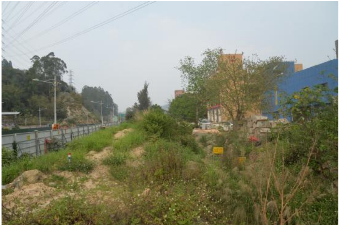
图 22 工程用地南部地表现状（东-西）