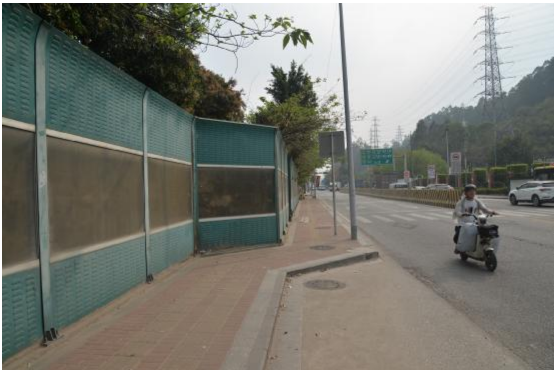
图 30 工程用地北部地表现状（西-东）