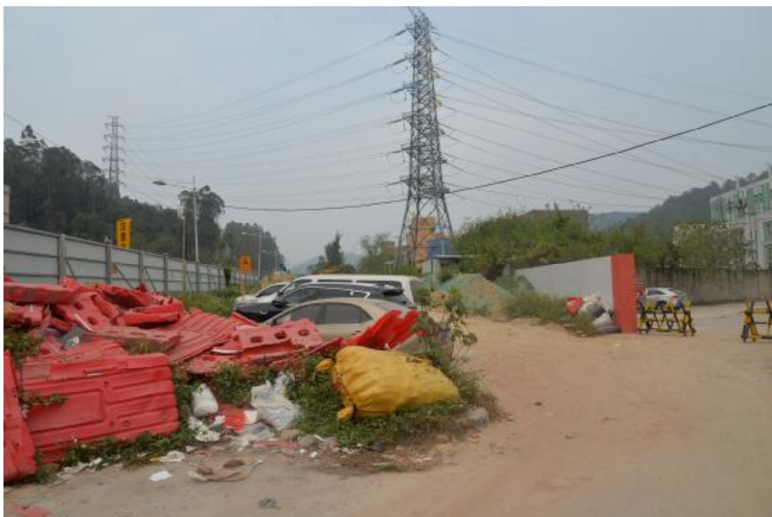
图 20 工程用地南部地表现状（东-西）