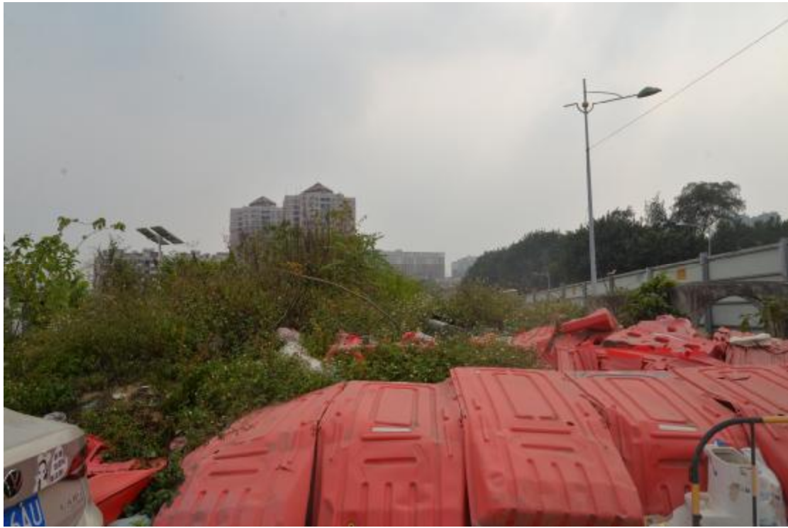
图 17 工程用地南部地表现状（西-东）