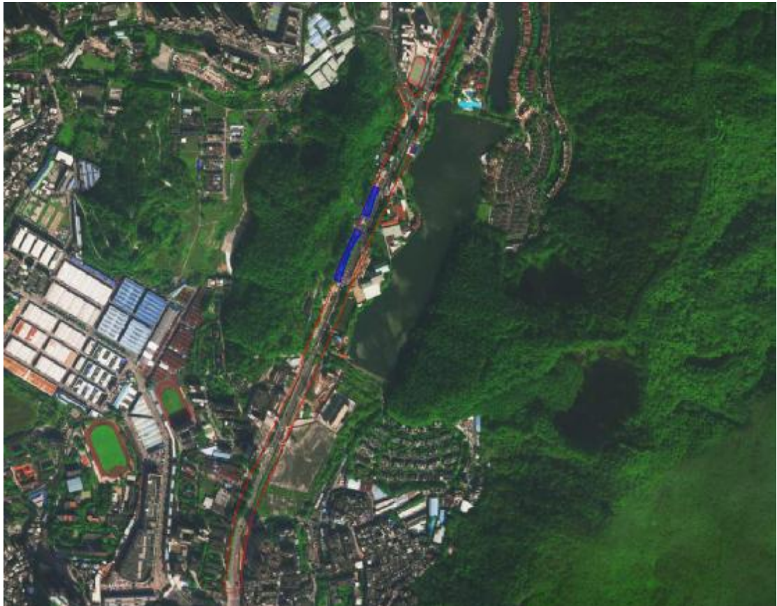
图6 工程地块红线图（蓝色区域为已施工区域）