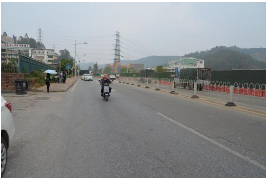
图 14 工程用地南部地表现状（东-西）