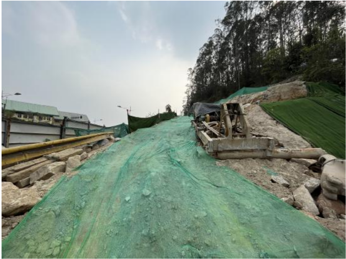
图 37 工程用地中部已施工山岗区域地表现状（西-东）