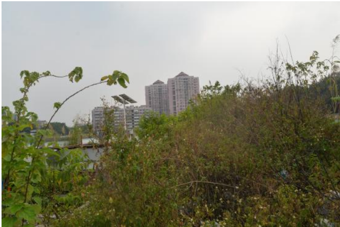
图 18 工程用地南部地表现状（东-西）