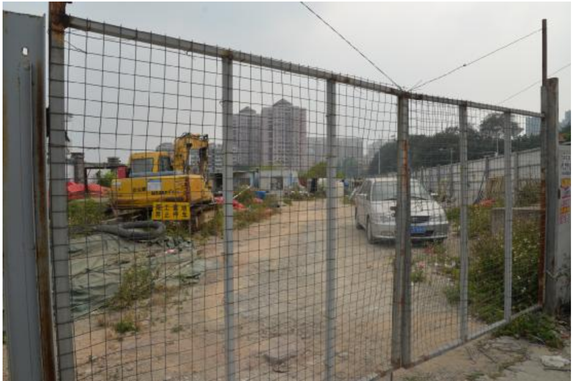
图 21 工程用地南部地表现状（西-东）