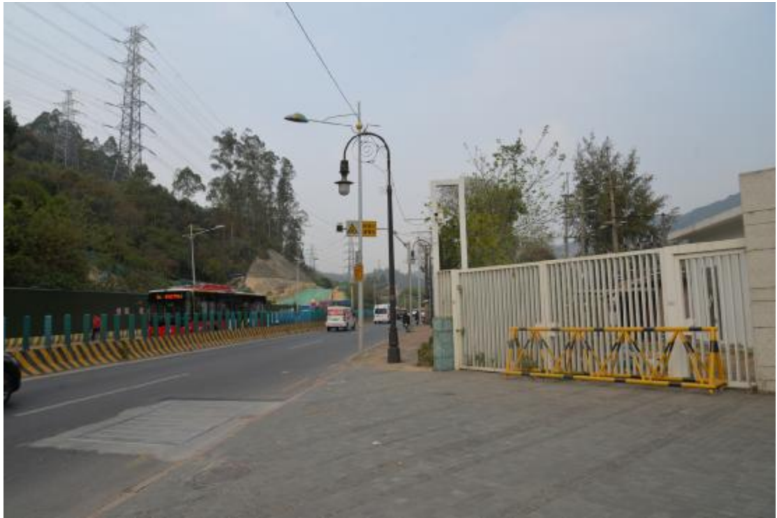
图 33 工程用地中部地表现状（东-西）