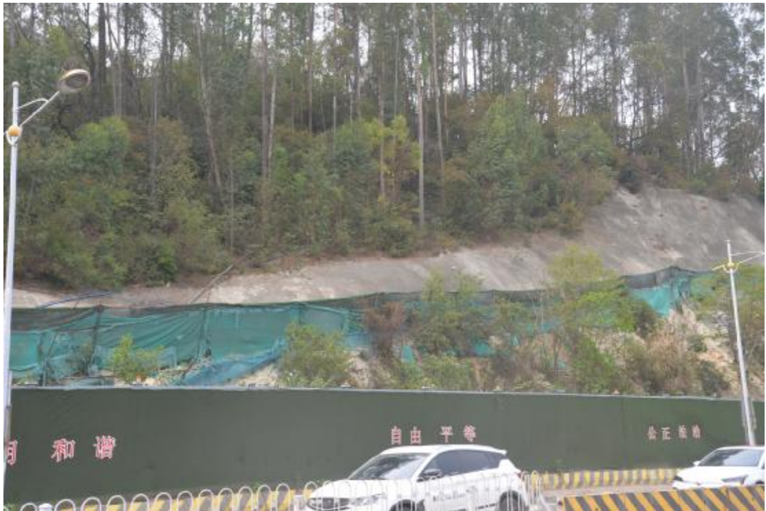
图 32 工程用地中部地表现状（北-南）