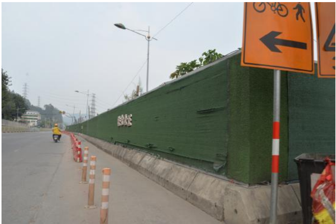
图 16 工程用地南部地表现状（东-西）