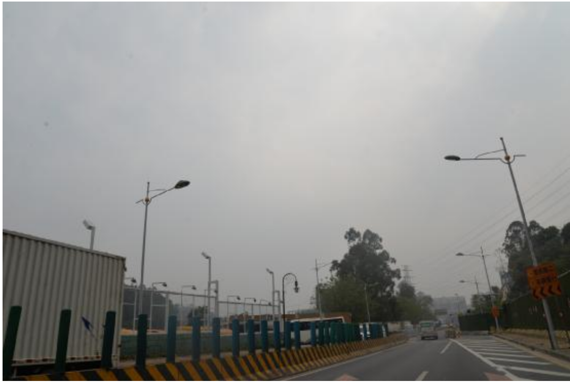
图 11 工程用地南部地表现状（西-东）