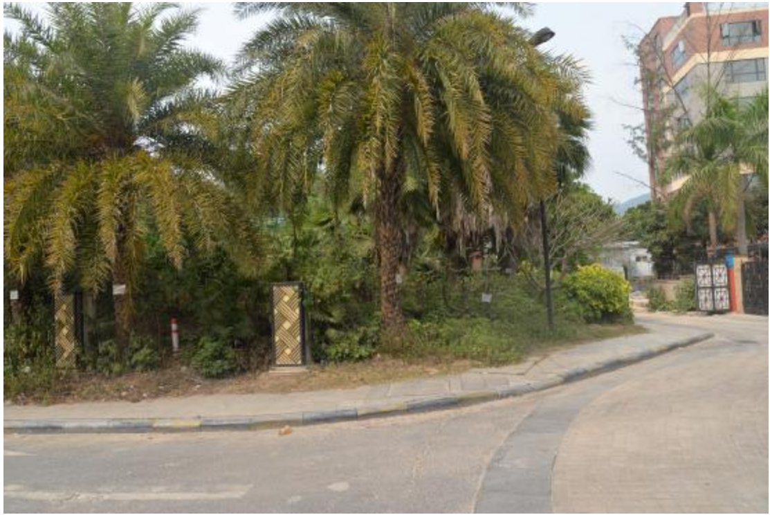
图 25 工程用地南部地表现状（西-东）