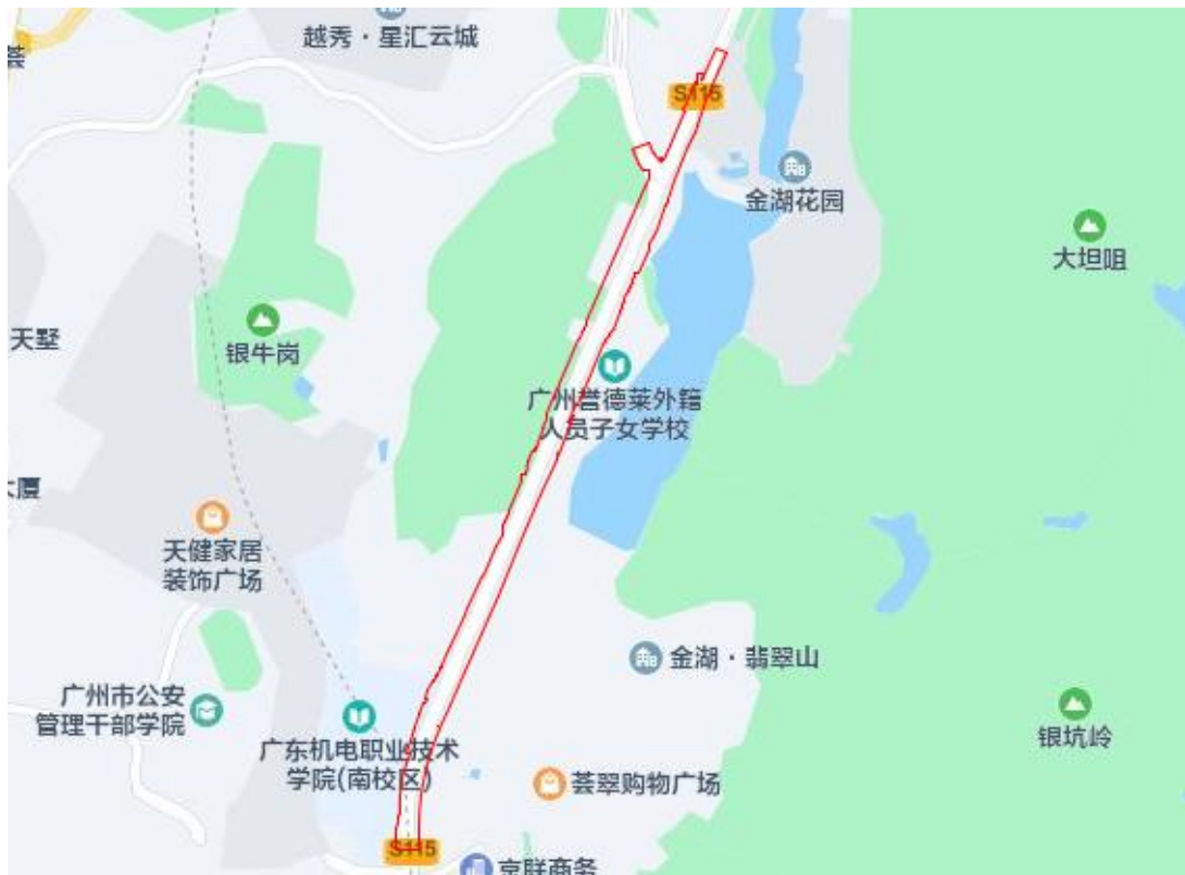
图 3 该工程用地周边环境示意图（腾讯地图）