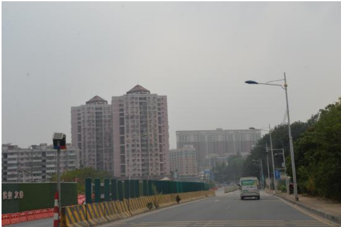
图 12 工程用地南部地表现状（西-东）