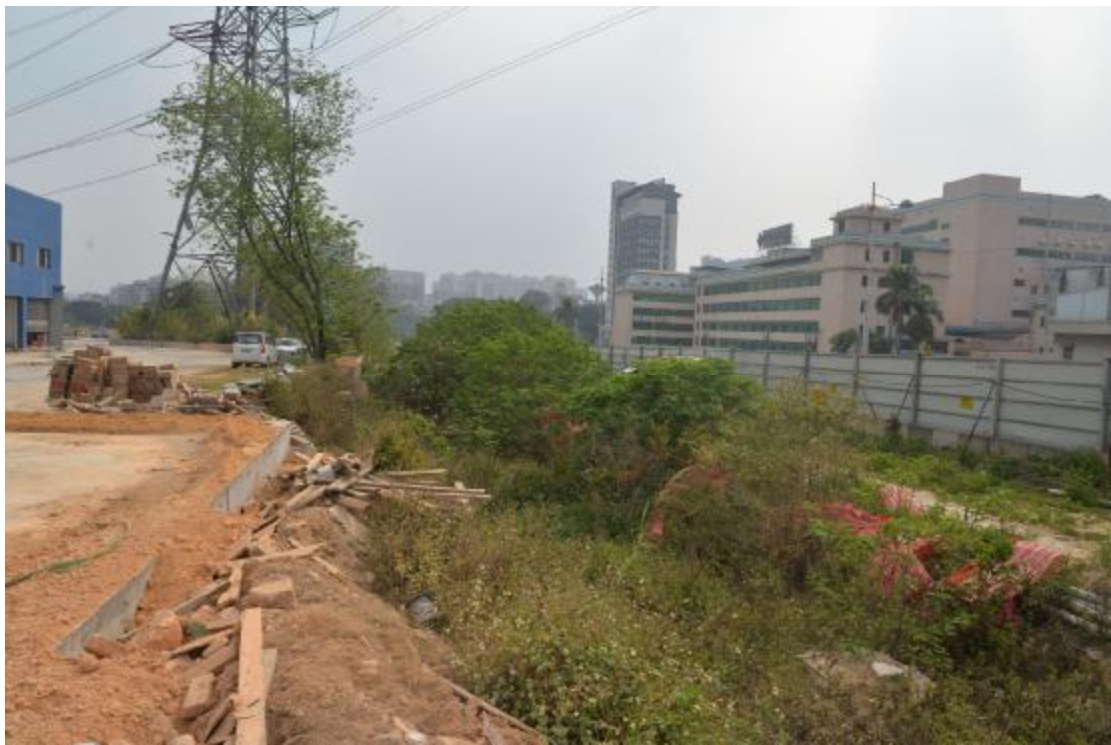
图 27 工程用地南部地表现状（西-东）