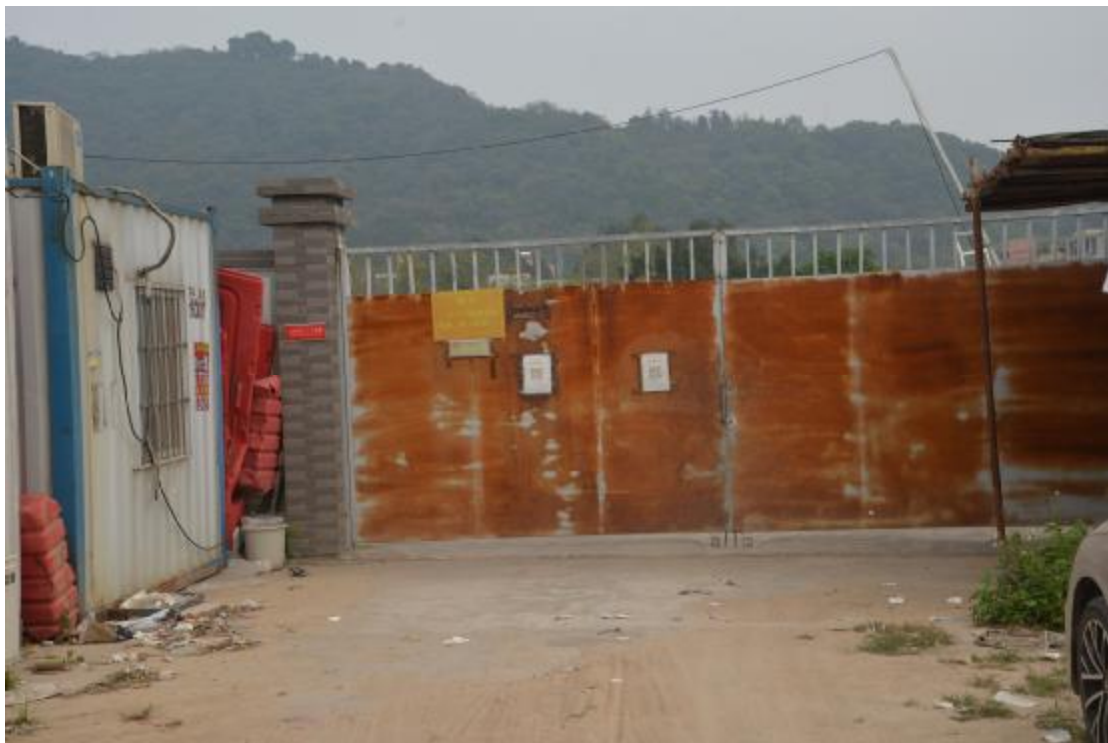
图 19 工程用地南部地表现状（南-北）