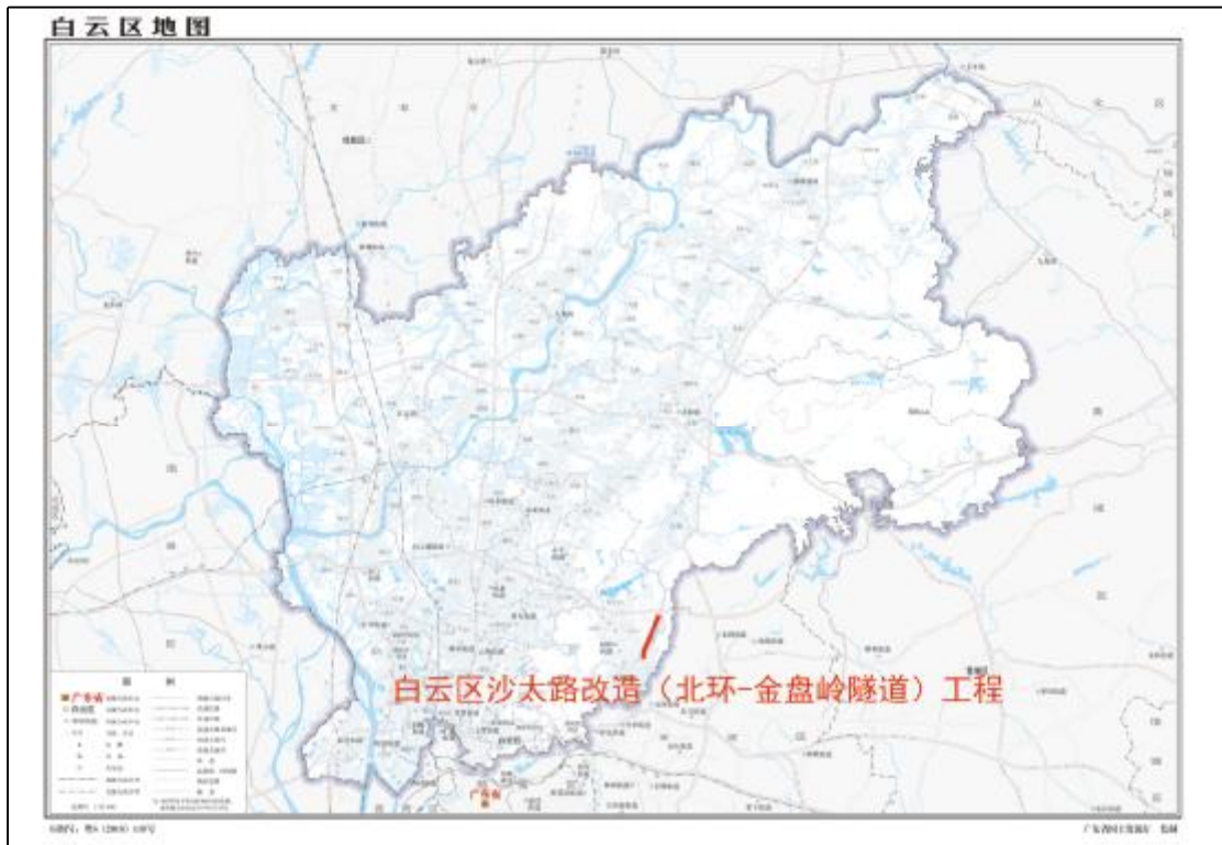
图 2 该工程用地在白云区的位置示意图（广州市规划和自然资源局）