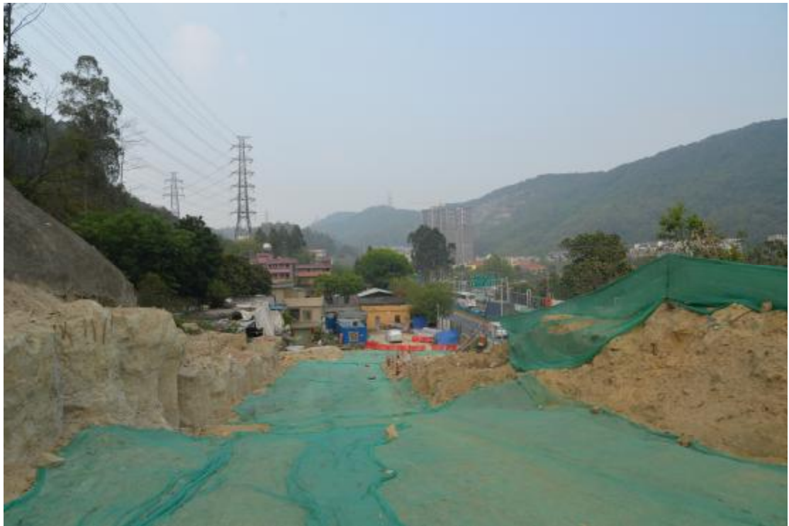
图 36 工程用地中部已施工山岗区域地表现状（东-西）