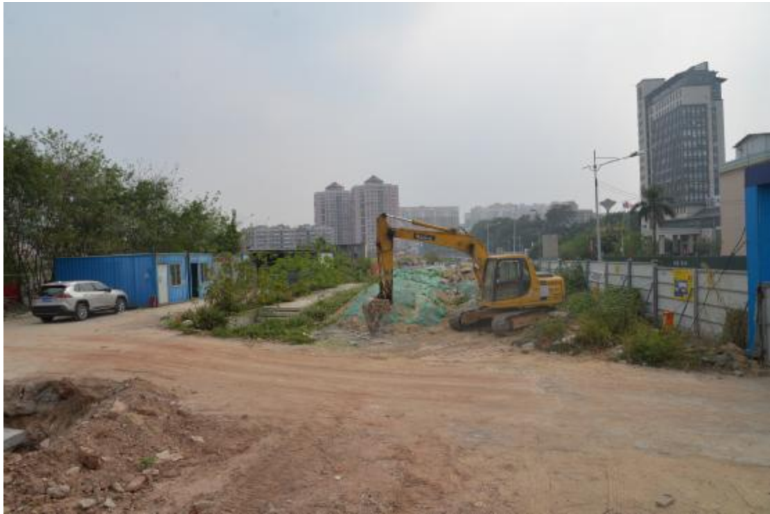
图 23 工程用地南部地表现状（西-东）