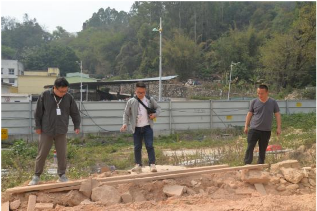
图 8 对地表进行踏查（北-南）