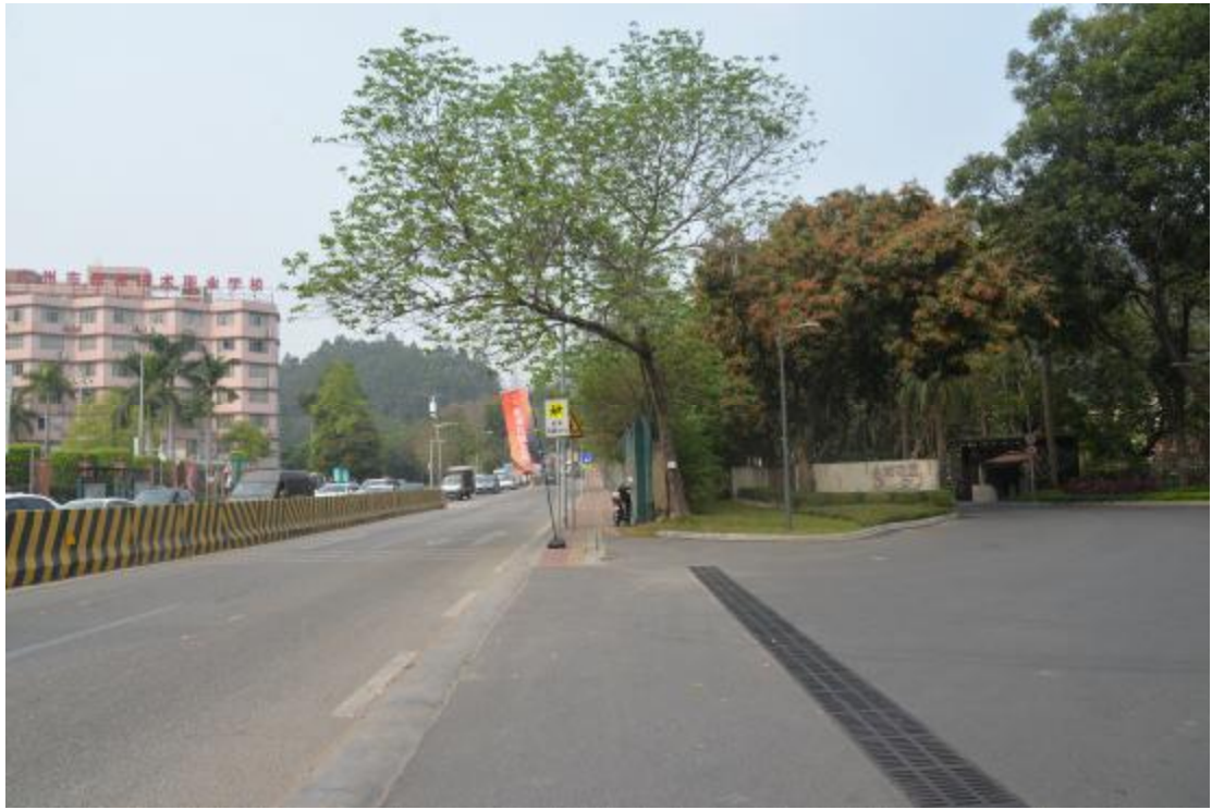
图 29 工程用地北部地表现状（东-西）