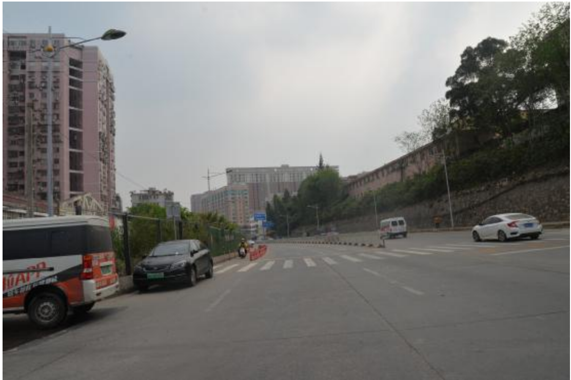
图 15 工程用地南部地表现状（西-东）