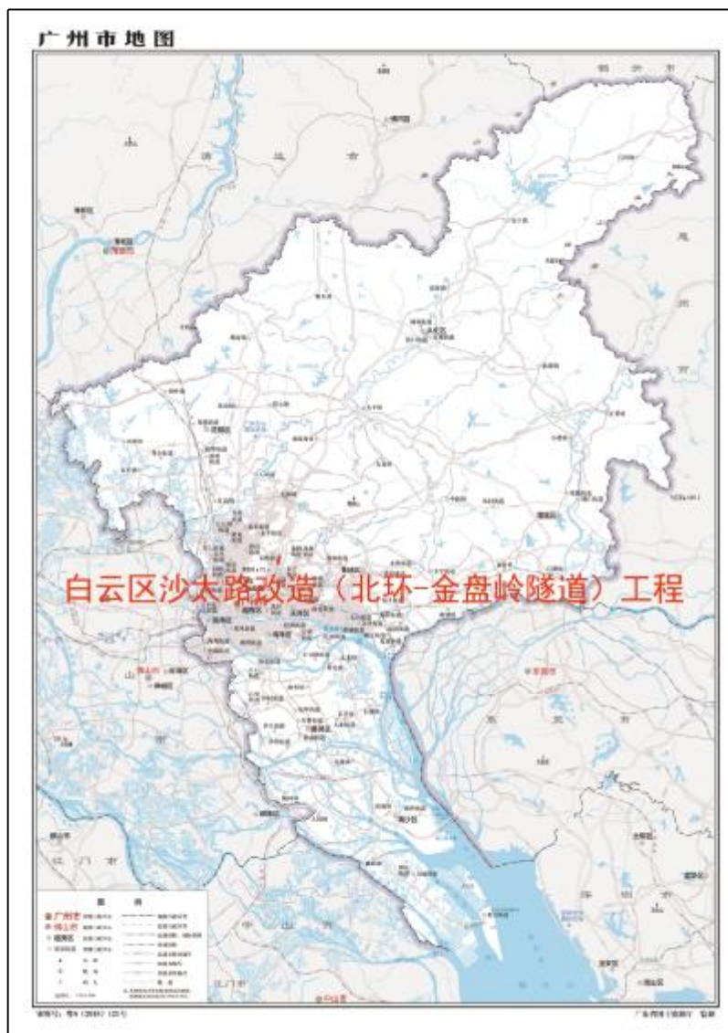
图 1 该工程用地在广州市的位置示意图（广东省国土资源厅）

根据《中华人民共和国文物保护法》《广州市文物保护规定》，按照《广州市文物局关于白云区沙太路改造（北环-金盘岭隧道）工程考古调查勘探工作的复函》（文物 2022898 号）指导意见，受广州市白云区住房和城乡建设局委托，由我院配合该工程用地建设，对该工程进行考古调查工作。