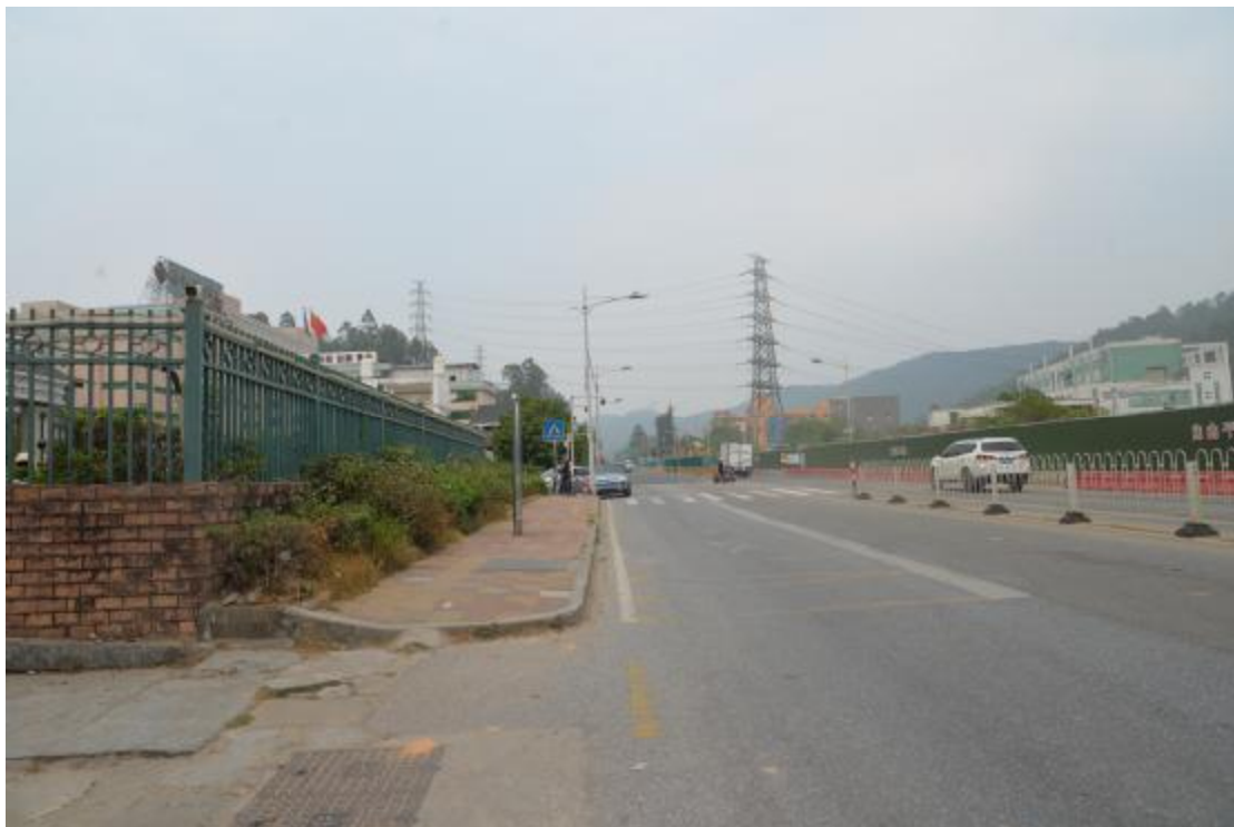
图 13 工程用地南部地表现状（东-西）