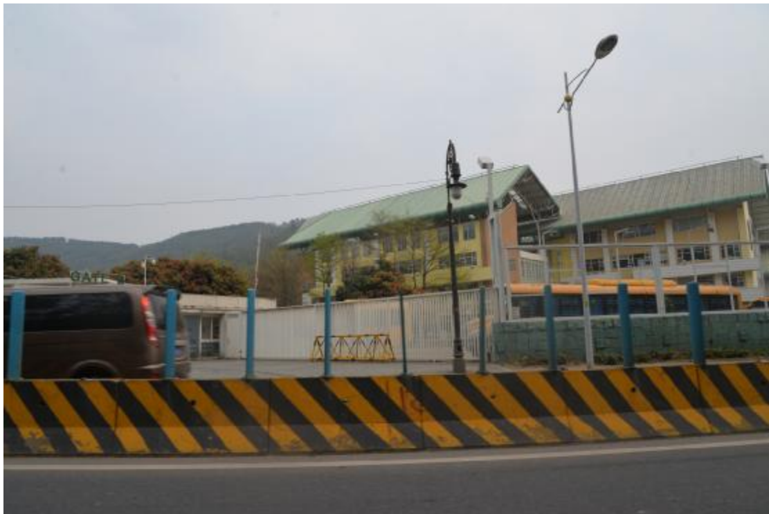
图 10 工程用地南部地表现状（南-北）