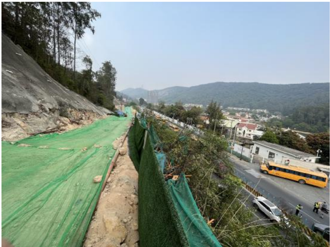
图 38 工程用地中部已施工山岗区域地表现状（东-西）