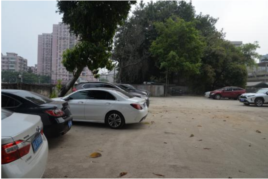
图 9 工程用地南部地表现状（西-东）