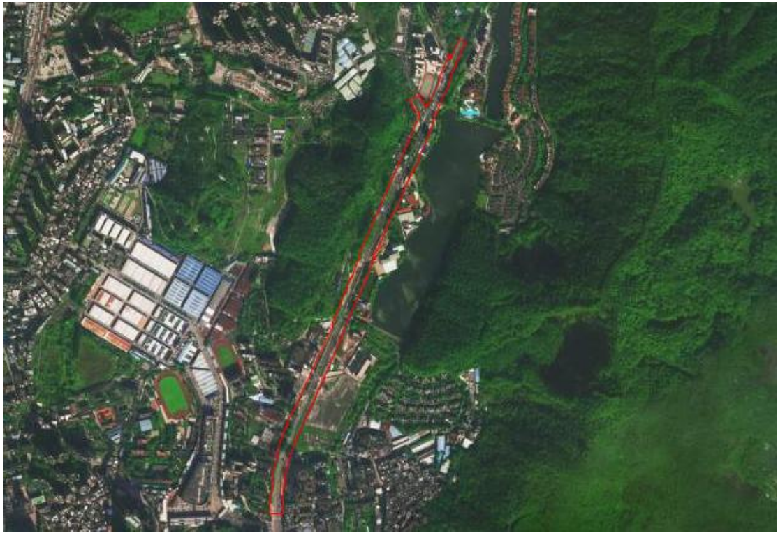
图 4 该工程卫星红线图（高德地图）