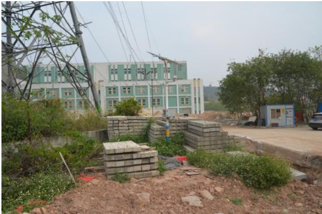
图 24 工程用地南部地表现状（南-北）