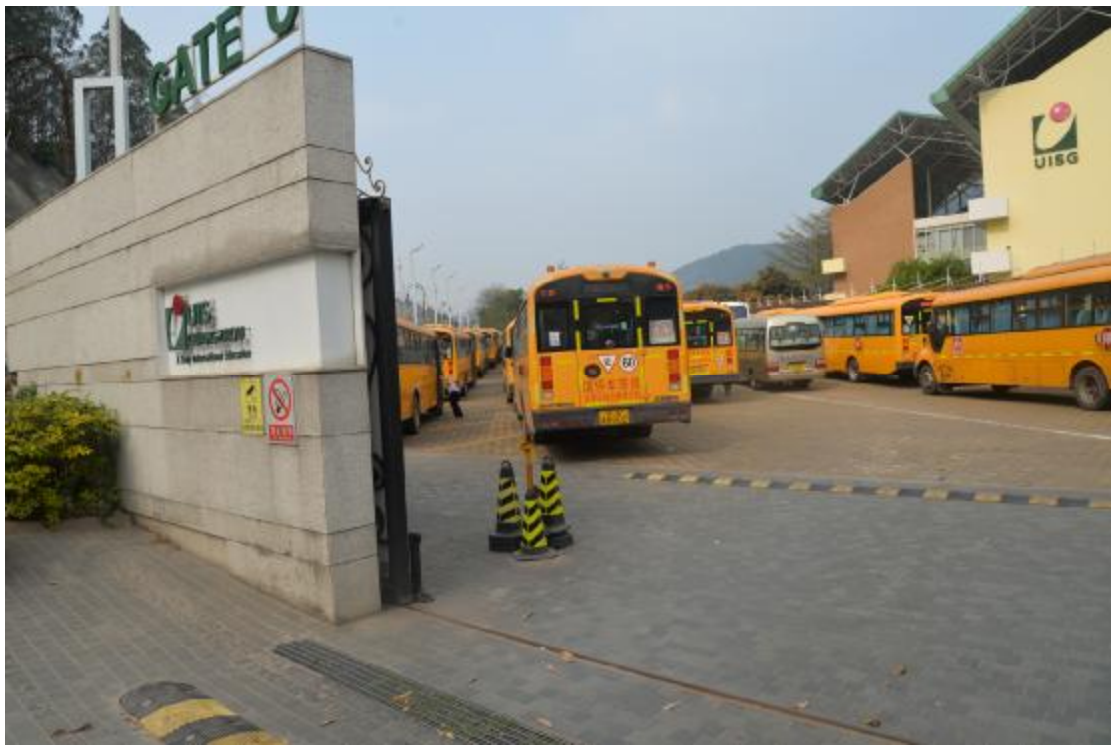
图 31 工程用地中部地表现状（东-西）