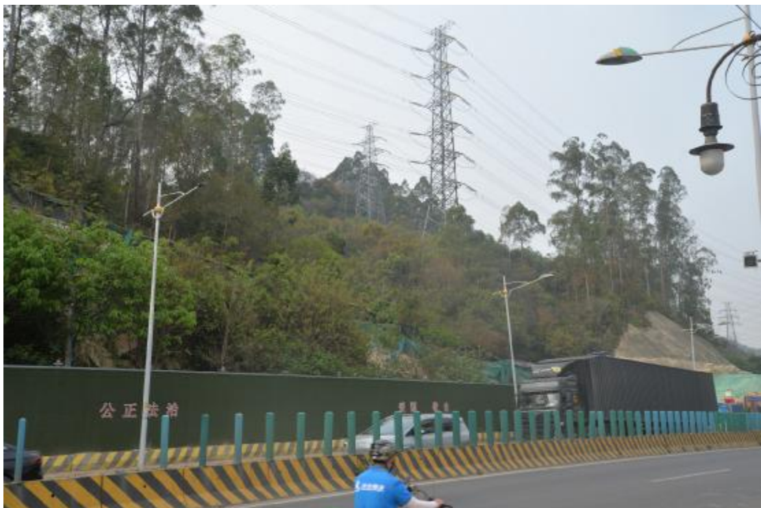
图 28 工程用地北部地表现状（北-南）