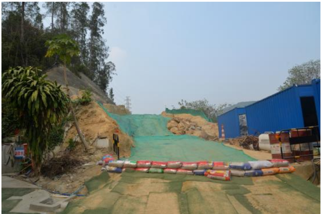
图 34 工程用地中部已施工山岗区域地表现状（东-西）