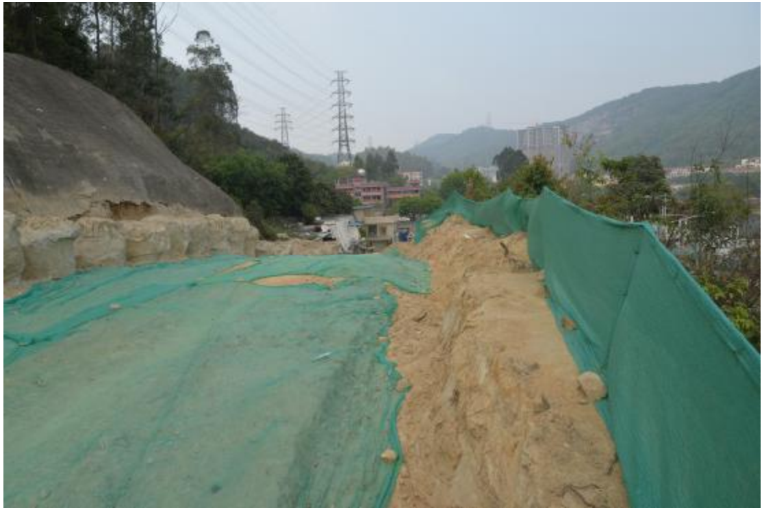
图 35 工程用地中部已施工山岗区域地表现状（东-西）