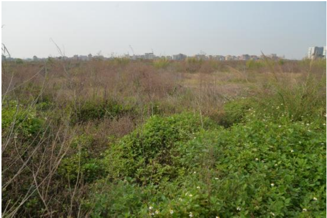
图 24 地块地表现状（北—南）