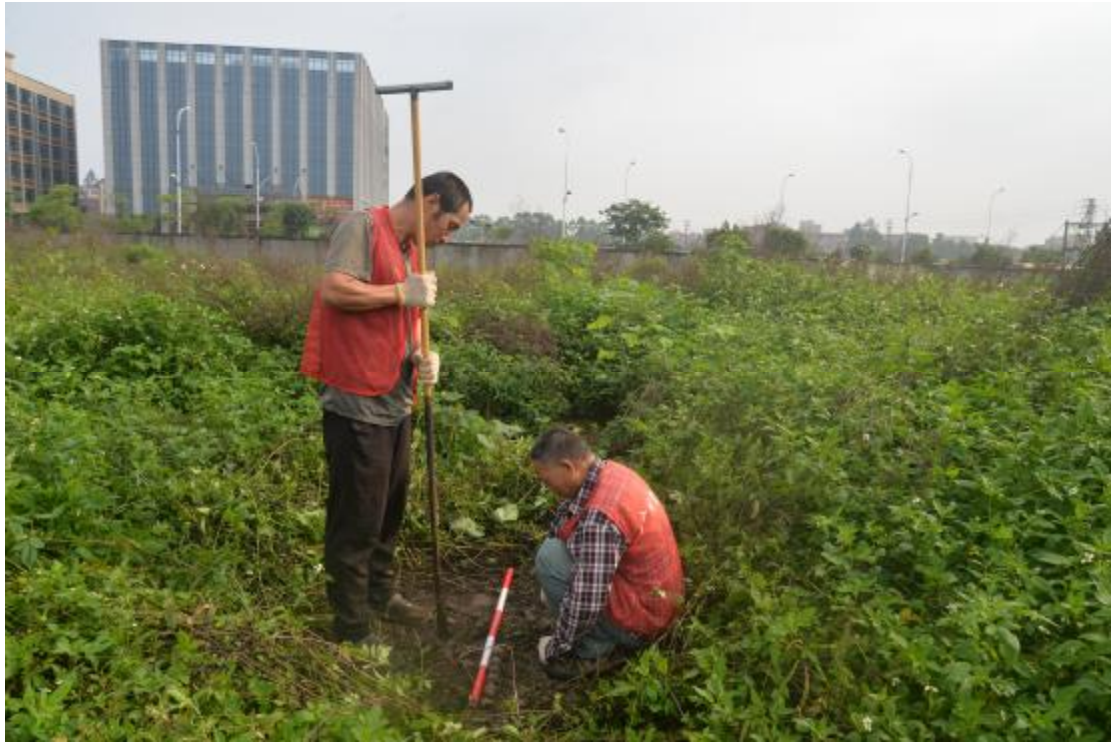
图 29 试探孔土样提取（南—北）