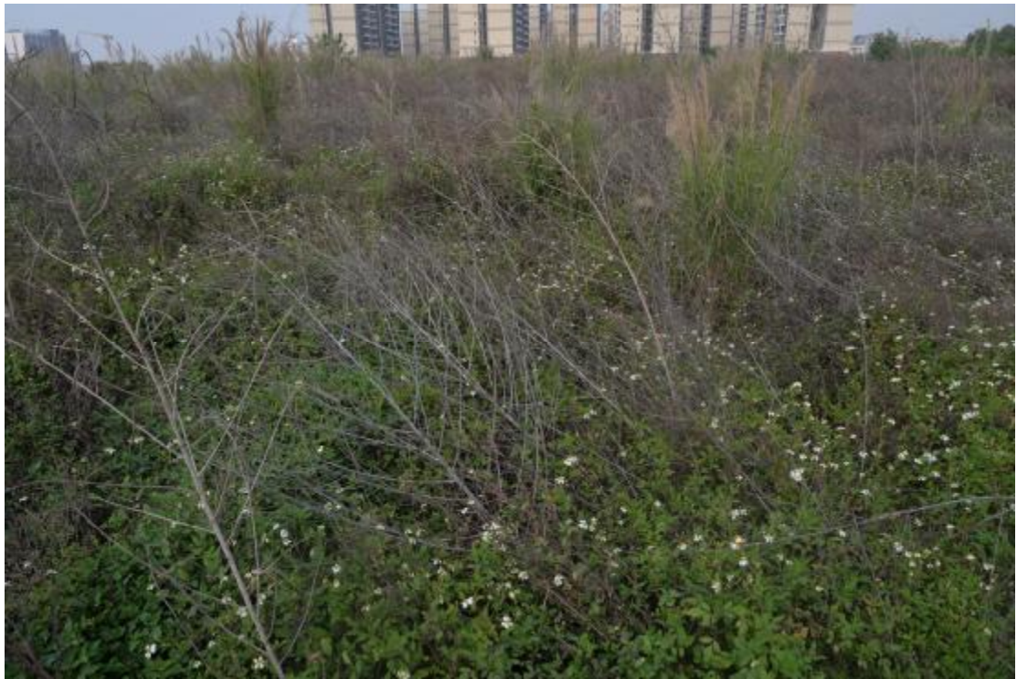
图 14 地块地表现状（东—西）