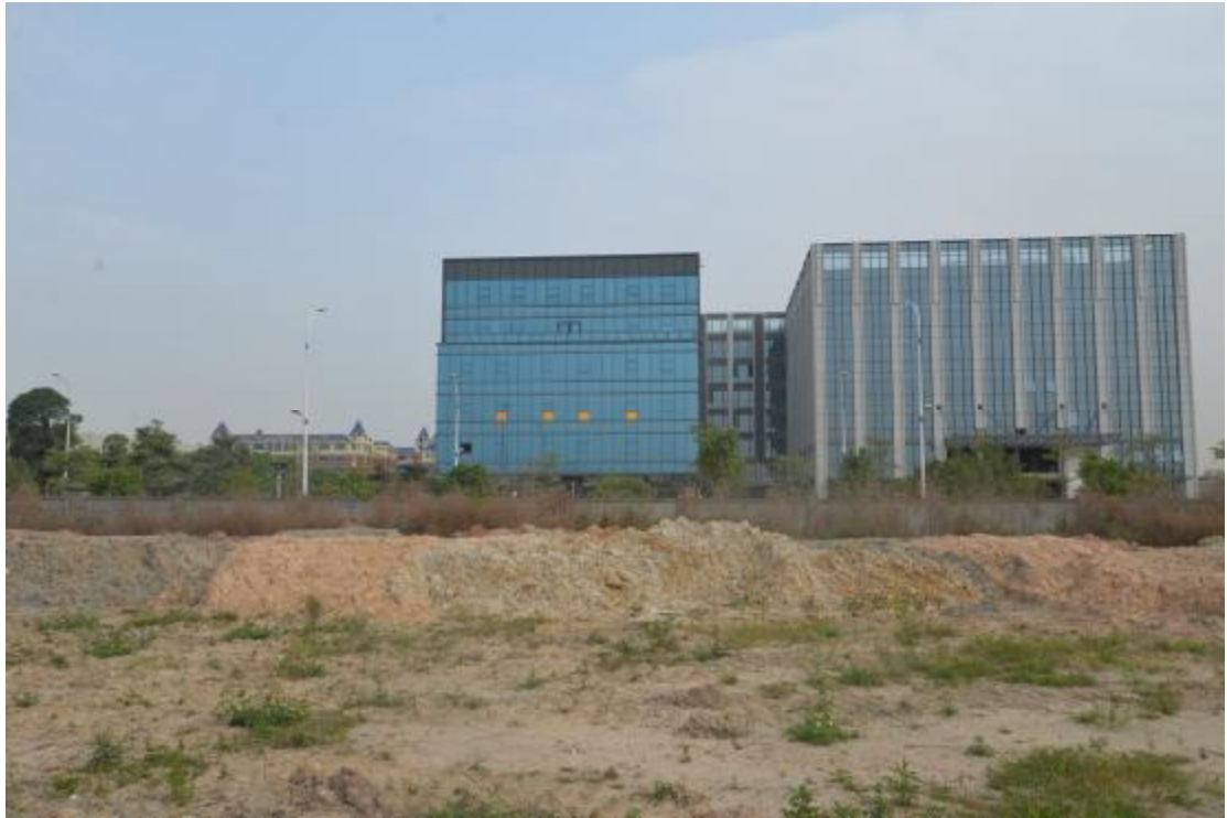
图 13 地块地表现状（南—北）