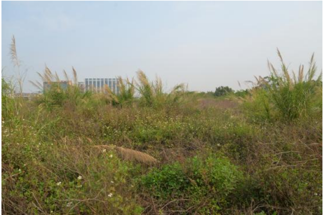
图 25 地块地表现状（南—北）