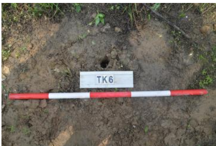
图 36 TK6 土样 (一米标杆, 土样由左往右)

①层: 现代回填土层, 为灰褐色沙土, 土质疏松, 含植物根系、石粒等; 探至距地表 0.15 米时, 因石块阻拦, 无法继续向下提取土样。