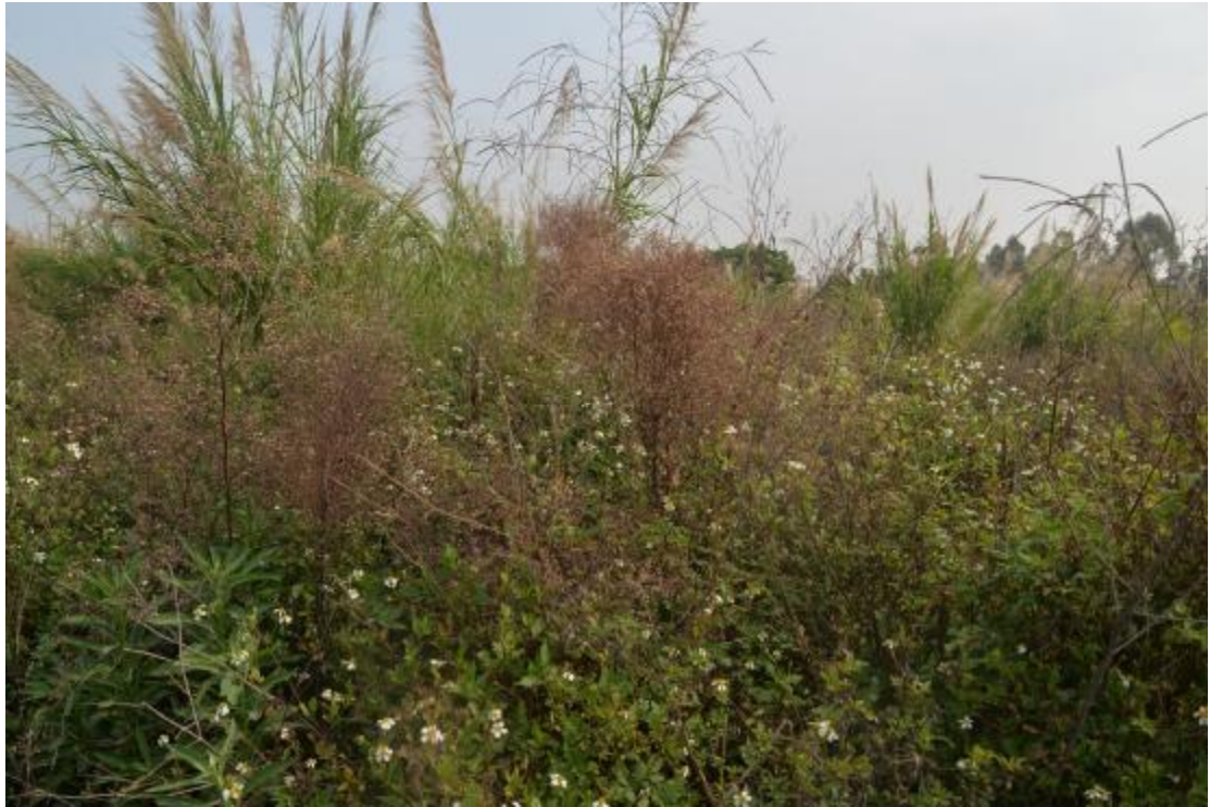
图 23 地块地表现状（南—北）