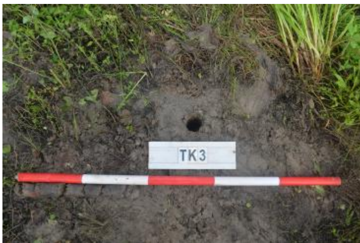
图 33 TK3 土样 (一米标杆,土样由左往右)

①层: 现代回填土层,为灰褐色沙土,土质疏松,含植物根系、碎砖块等; 探至距地表 0.35 米时,因石块阻拦,无法继续向下提取土样。