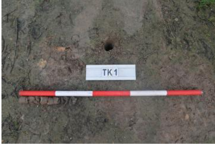
图 31 TK1 土样（一米标杆，土样由左往右）

①层：现代回填土层，为灰褐色沙土，土质疏松，含植物根系、石粒等；探至距地表 0.3 米时，因石块阻拦，无法继续向下提取土样。