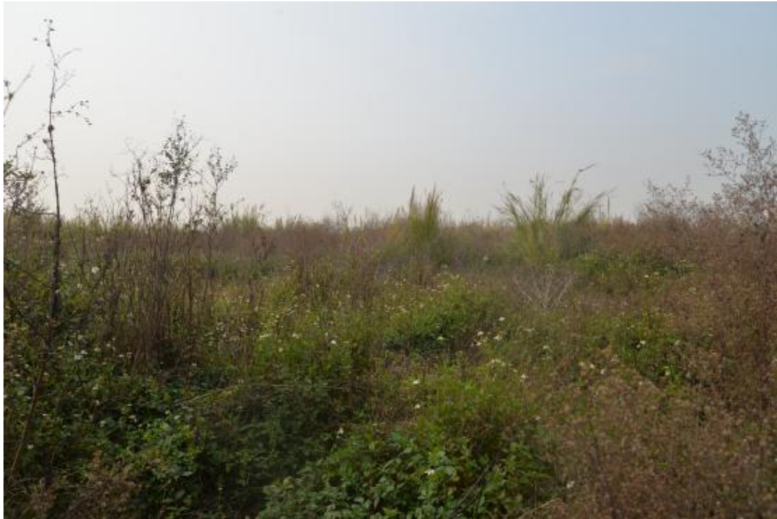
图 17 地块地表现状（北—南）