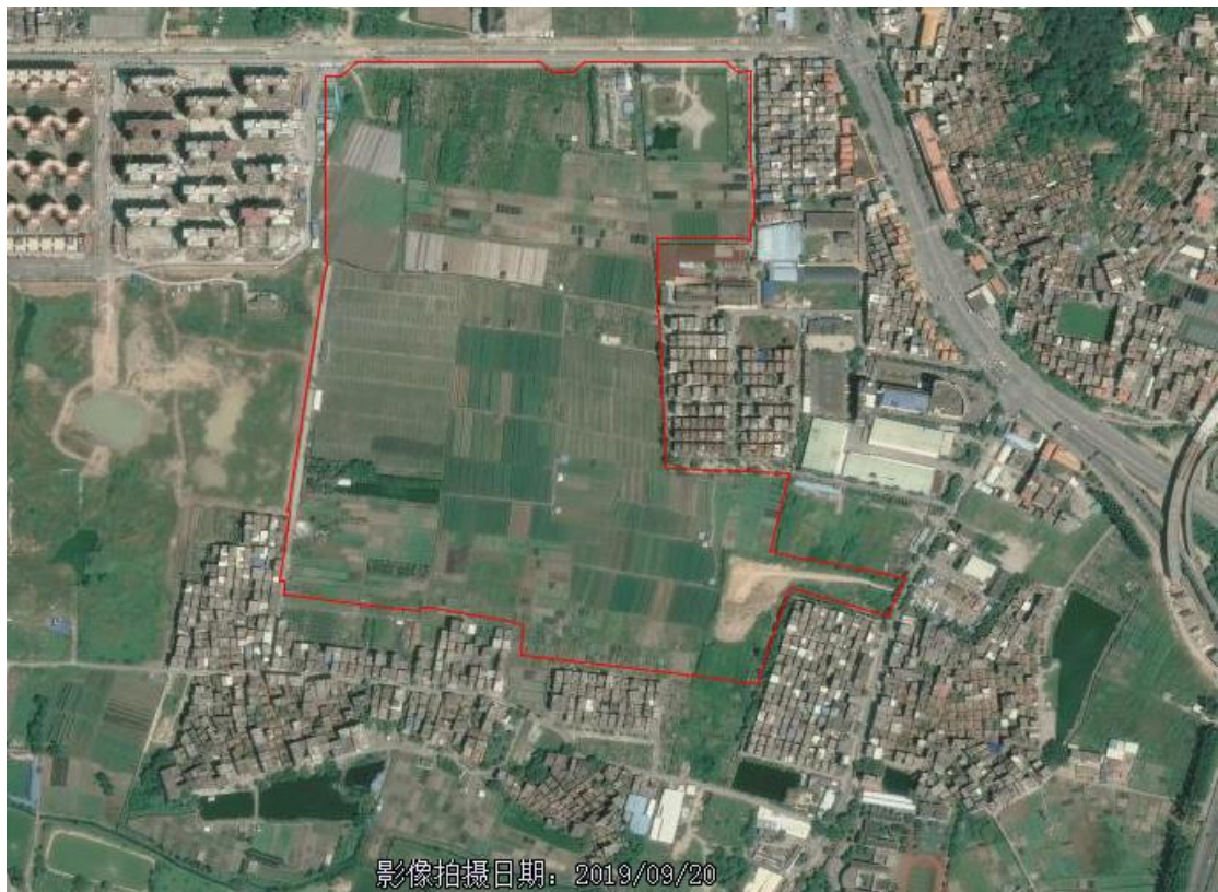
图 6 2019 年 9 月 20 日地块卫星图