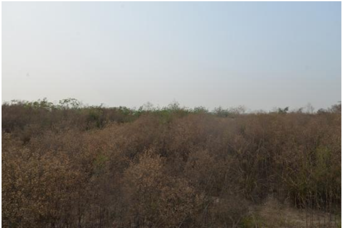
图 10 地块地表现状（北—南）