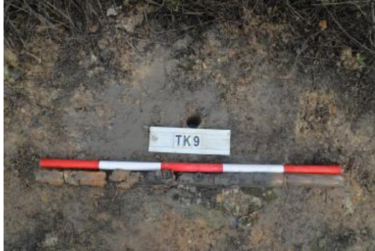
图 39 TK9 土样（一米标杆，土样由左往右）

①层：现代回填土层，距地表深约 0-0.75 米，厚约 0.75 米，以灰褐色沙土为主，土质疏松，含植物根系、石粒等；以下为灰红白相间黏土，土质致密、纯净，系生土。