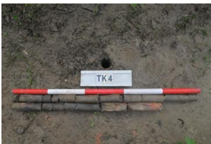
图 34 TK4 土样 (一米标杆,土样由左上往右下)

①层: 现代回填土层,距地表深约 0-1.5 米,厚约 1.5 米,为灰褐色黏土,土质疏松,含植物根系、碎砖块等; 以下为灰红白相间黏土,土质致密、纯净,系生土。