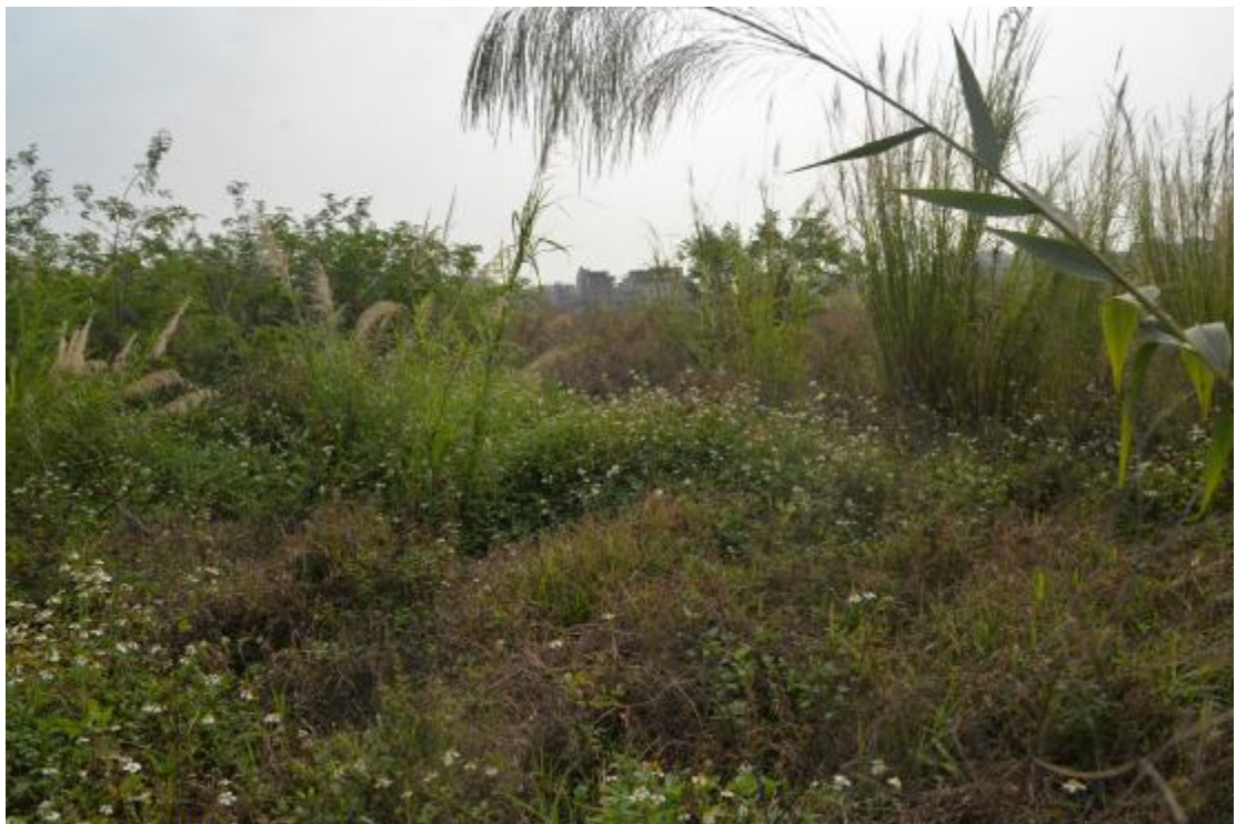
图 22 地块地表现状（西—东）