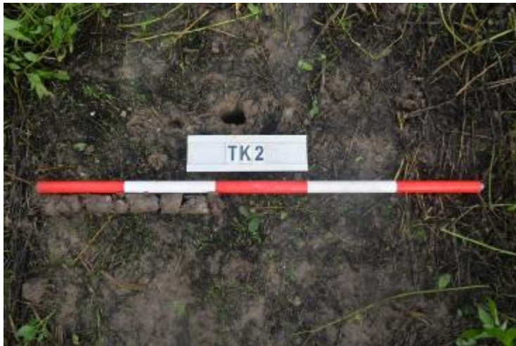
图 32 TK2 土样（一米标杆，土样由左往右）

①层：现代回填土层，为灰褐色沙土，土质疏松，含植物根系、石粒等；探至距地表 0.4 米时，因石块阻拦，无法继续向下提取土样。