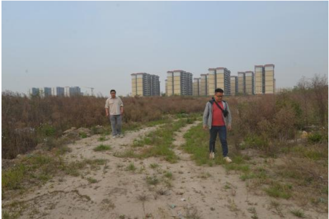
图 9 对地块地表进行踏查（东—西）