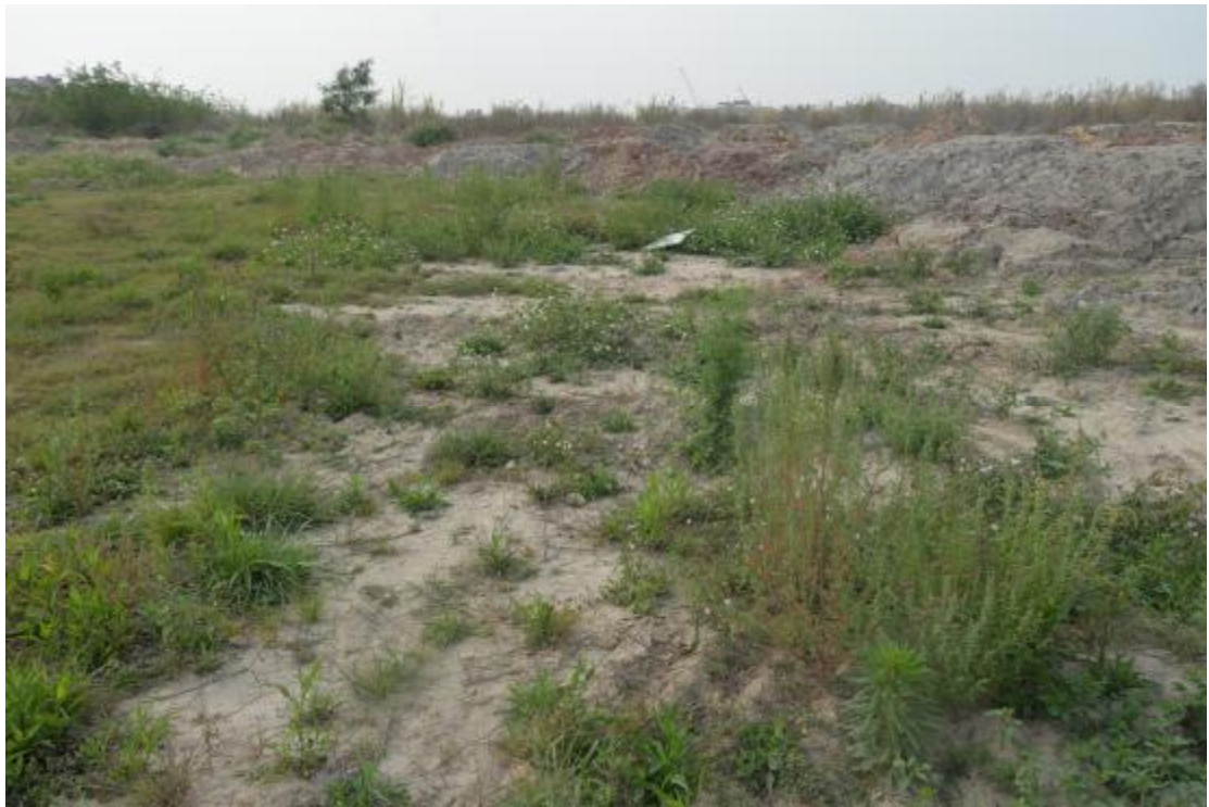
图 12 地块地表现状（东—西）