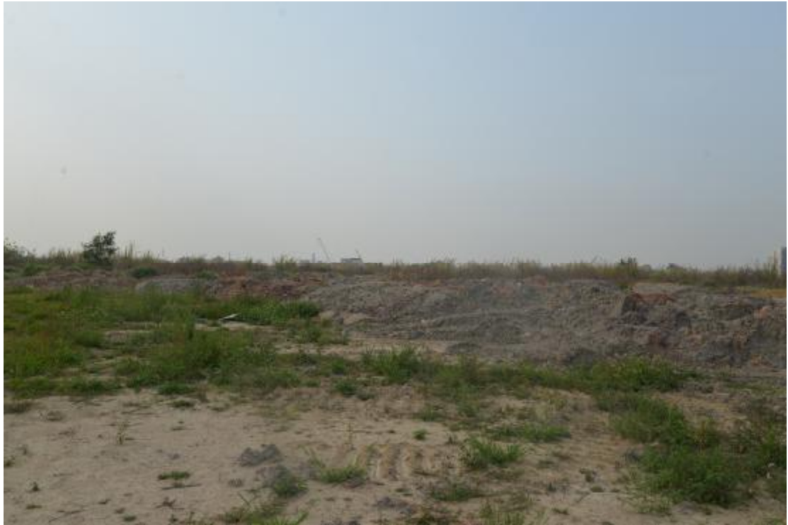
图 15 地块地表现状（北—南）