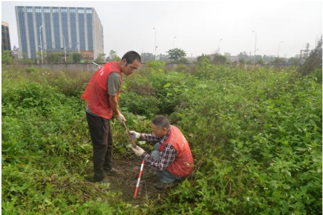
图 30 试探孔土样分析（南—北）