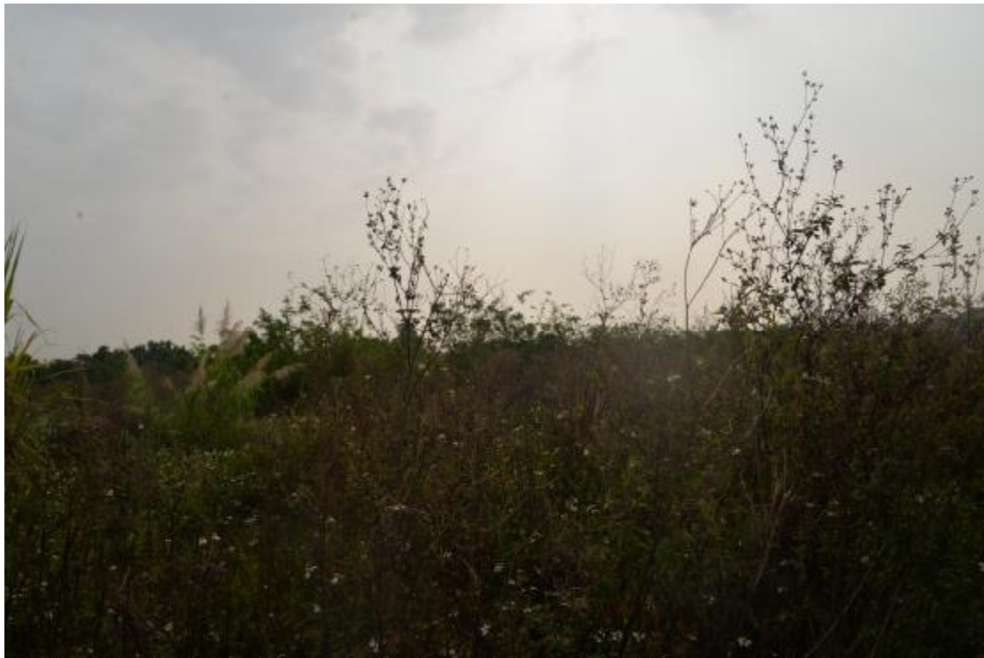
图 18 地块地表现状（西—东）