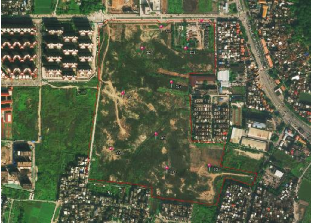
图 27 试探孔分布示意图

为了进一步了解并掌握该地块内地层堆积情况，我们在地块内进行试探，共布设 10 个标准型试探孔，编号为 TK1-TK10，具体介绍如下：