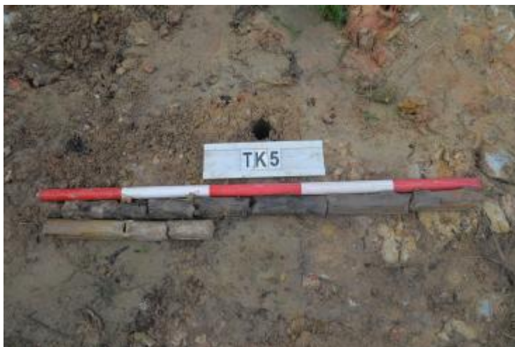
图 35 TK5 土样 (一米标杆, 土样由左上往右下)

①层: 现代回填土层, 距地表深约 0-1.0 米, 厚约 1.0 米, 为灰褐色黏土, 土质疏松, 含植物根系、建筑垃圾等; 以下为灰红白相间黏土, 土质致密、纯净, 系生土。