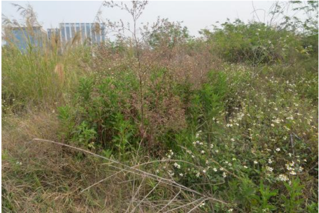
图 21 地块地表现状（南—北）