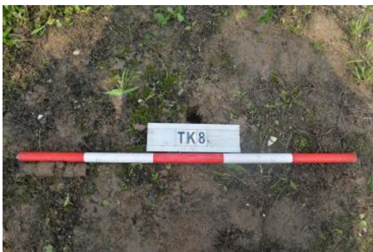
图 38 TK8 土样 (一米标杆, 土样由左往右)

①层: 现代回填土层, 为灰褐色沙土, 土质疏松, 含植物根系、粗砂粒等; 探至距地表 0.2 米时, 因石块阻拦, 无法继续向下提取土样。