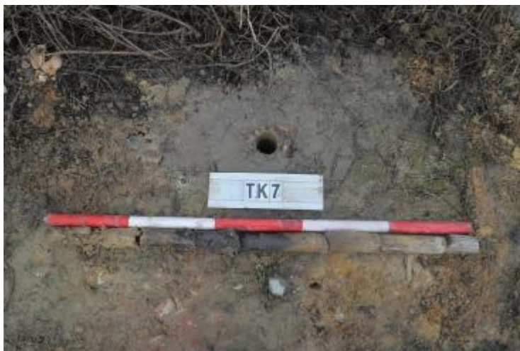
图 37 TK7 土样 (一米标杆, 土样由左往右)

①层: 现代回填土层, 距地表深约 0-0.6 米, 厚约 0.6 米, 为灰褐色沙土, 土质疏松, 含植物根系、粗砂粒等; 以下为灰红白相间黏土, 土质致密、纯净, 系生土。