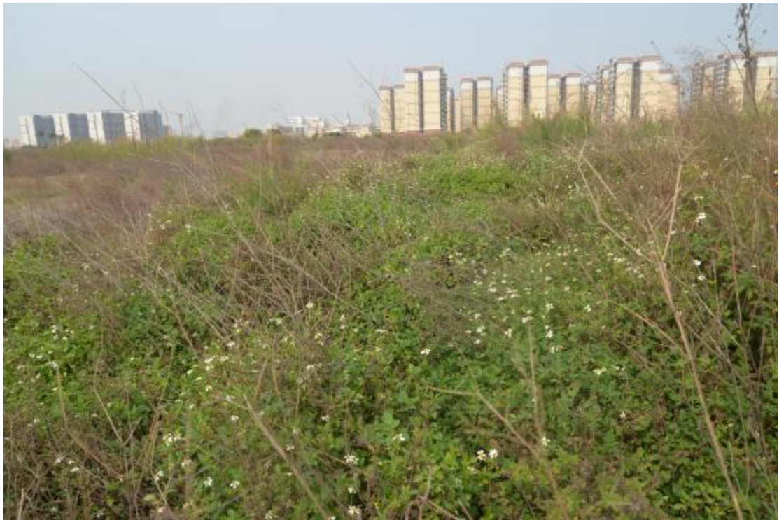
图 26 地块地表现状（东—西）