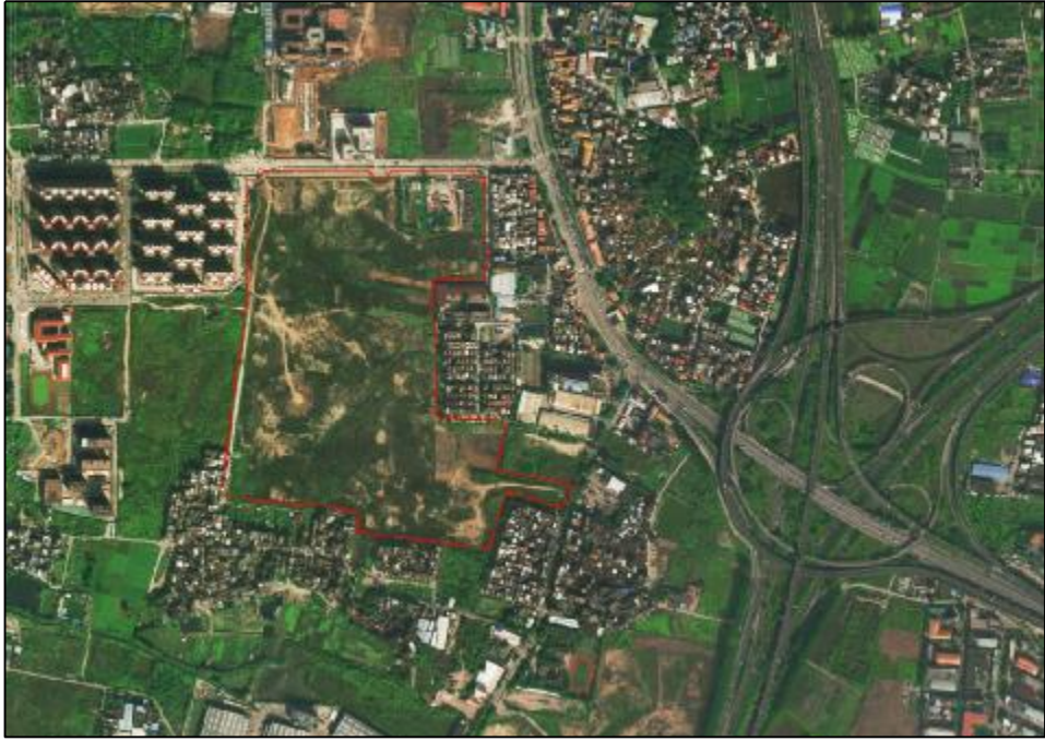
图 4 该地块卫星红线图