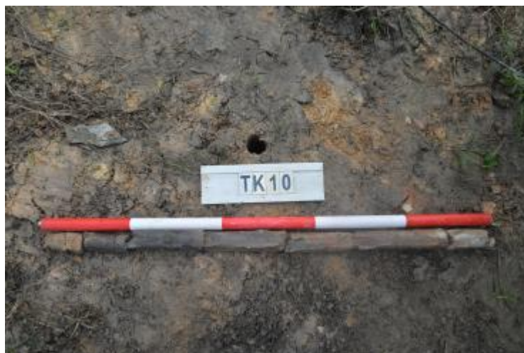
图 40 TK10 土样（一米标杆，土样由左往右）

②层：黏土层，距地表深约 0.1-0.6 米，厚约 0.5 米，为黑褐色黏土，土质较致密，含植物根茎等；以下为灰红白相间黏土，土质致密、纯净，系生土。