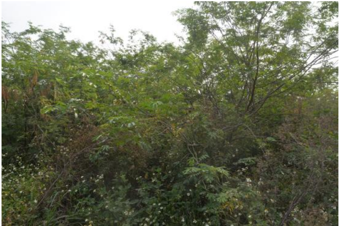
图 16 地块地表现状（西—东）