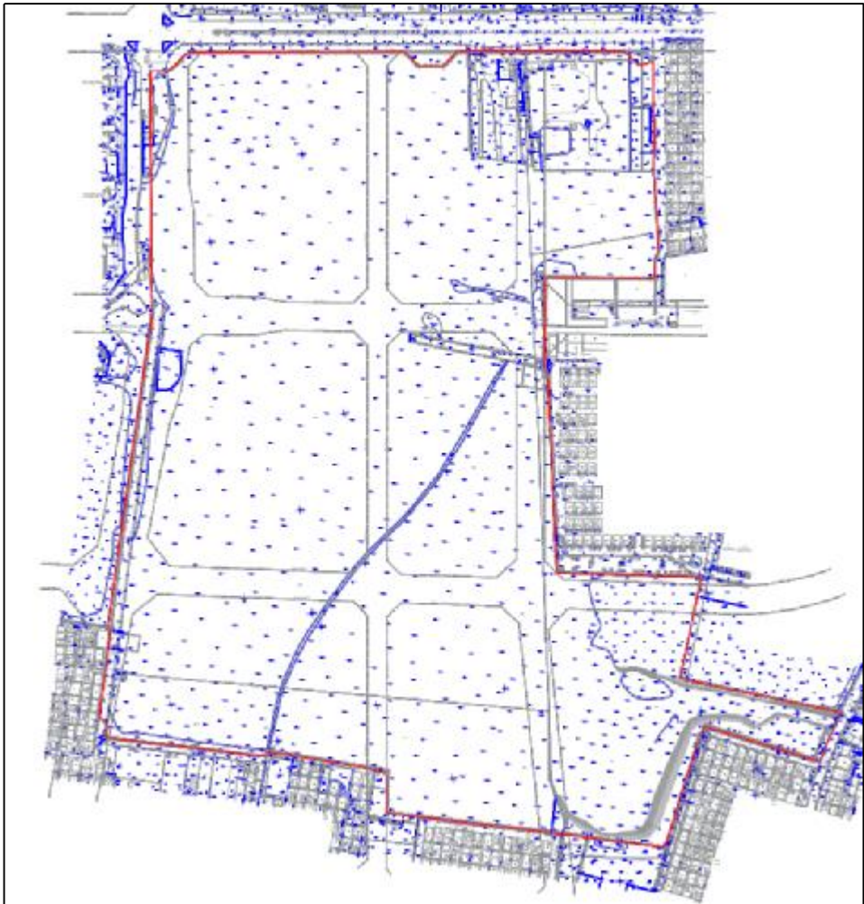
图 5 该地块地形图（甲方提供）