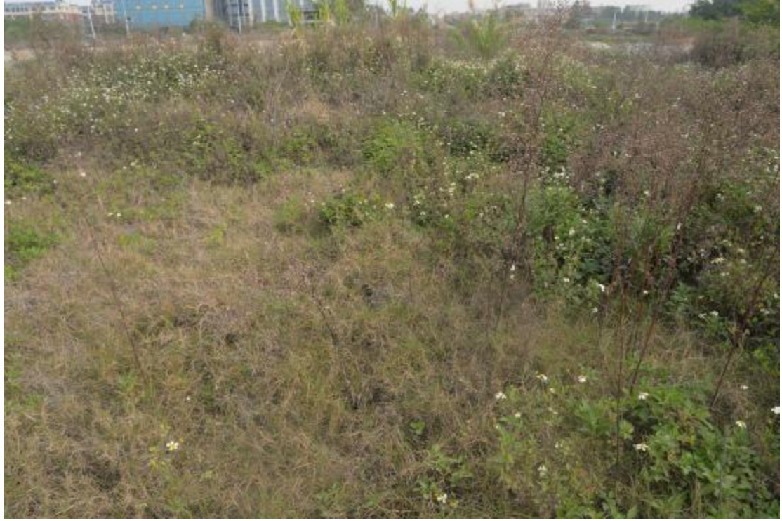
图 19 地块地表现状（南—北）