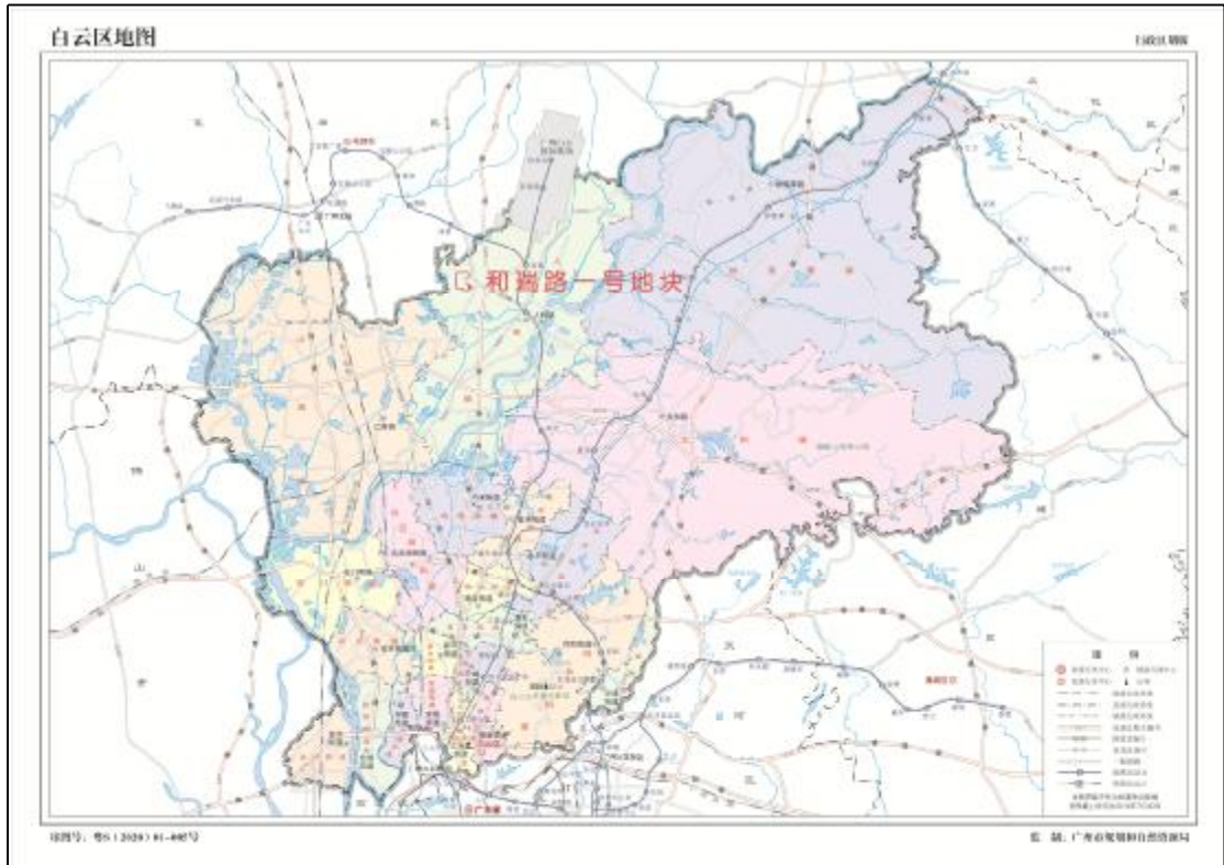
图 2 该地块在白云区的位置示意图（广州市规划和自然资源局）