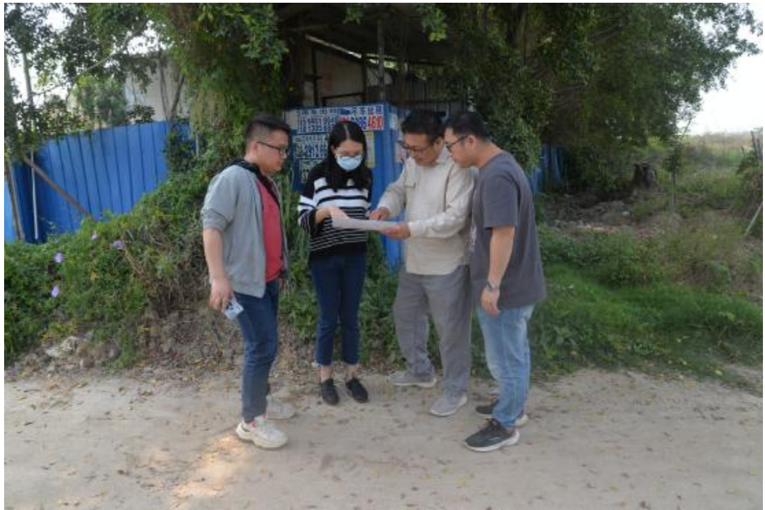
图 8 与工作人员确认地块范围（北—南）