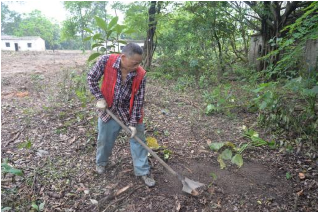
图 28 试探孔地表清理（南—北）