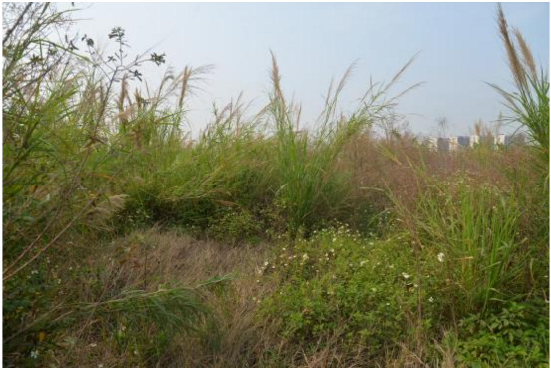
图 20 地块地表现状（北—南）