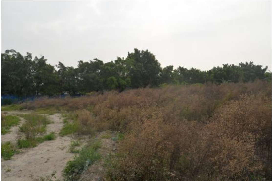
图 11 地块地表现状（西—东）