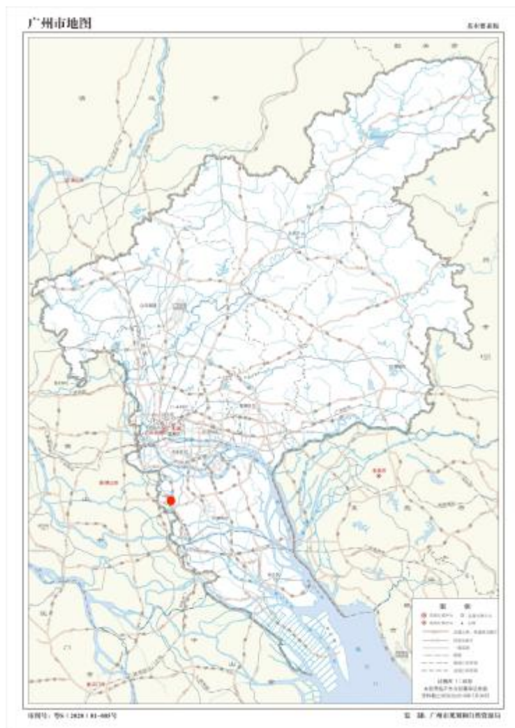
图 1 项目地块在广州市位置示意图（广州市规划和自然资源局）

根据《中华人民共和国文物保护法》《广州市文物保护规定》，按照《广州市文物局关于广铁石牌站等 38 宗市本级地块考古调查勘探工作的复函》（文物 2023197 号）指导意见，受广州市土地开发中心委托，配合土地出让，对该地块进行考古调查工作。