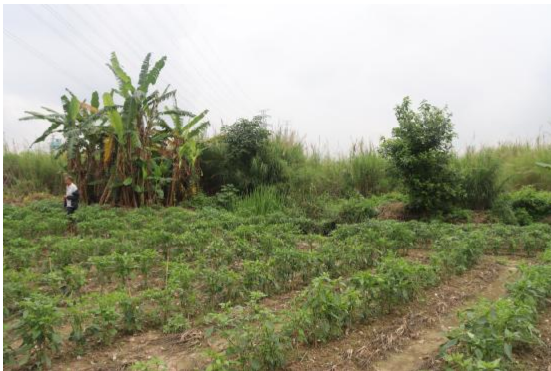
图 13 地块内东部现状（北-南）