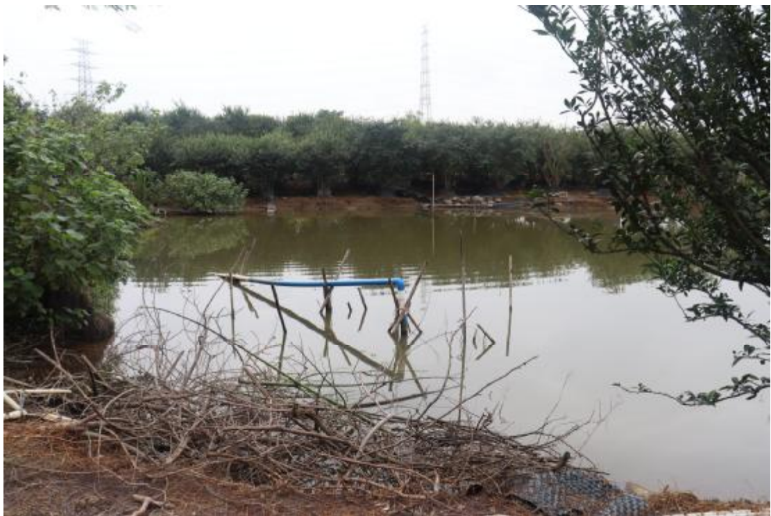
图 20 地块内南部现状（西北-东南）