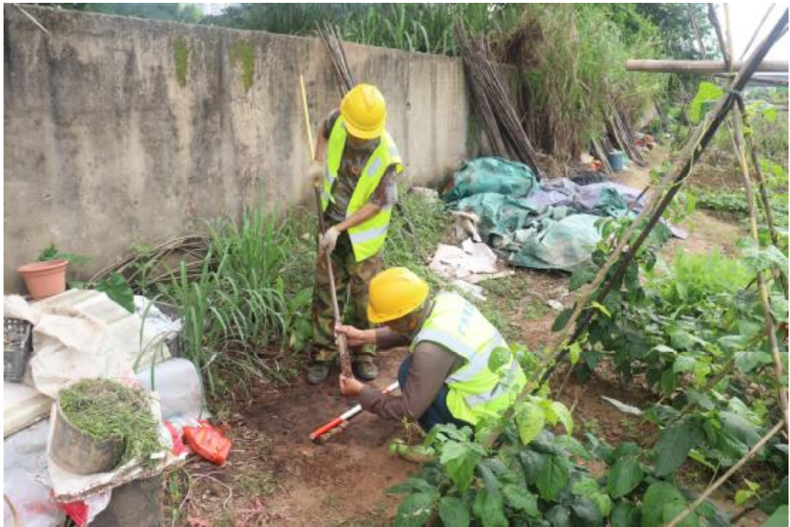
图 26 试探孔土样分析（西南-东北）