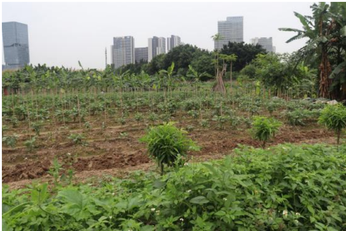
图 10 地块内北部现状（东南-西北）