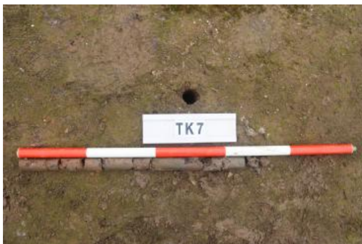
图 33 TK7 土样 (一米标杆, 土样由左往右)

②层: 淤积层, 距地表深 0.4-0.7 米, 厚 0.3 米, 为灰黑色淤泥, 土质较疏松, 含砂砾。以下渗水严重, 无法提取土样。