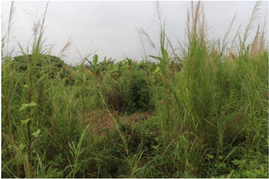
图 15 地块内中部现状（东北-西南）