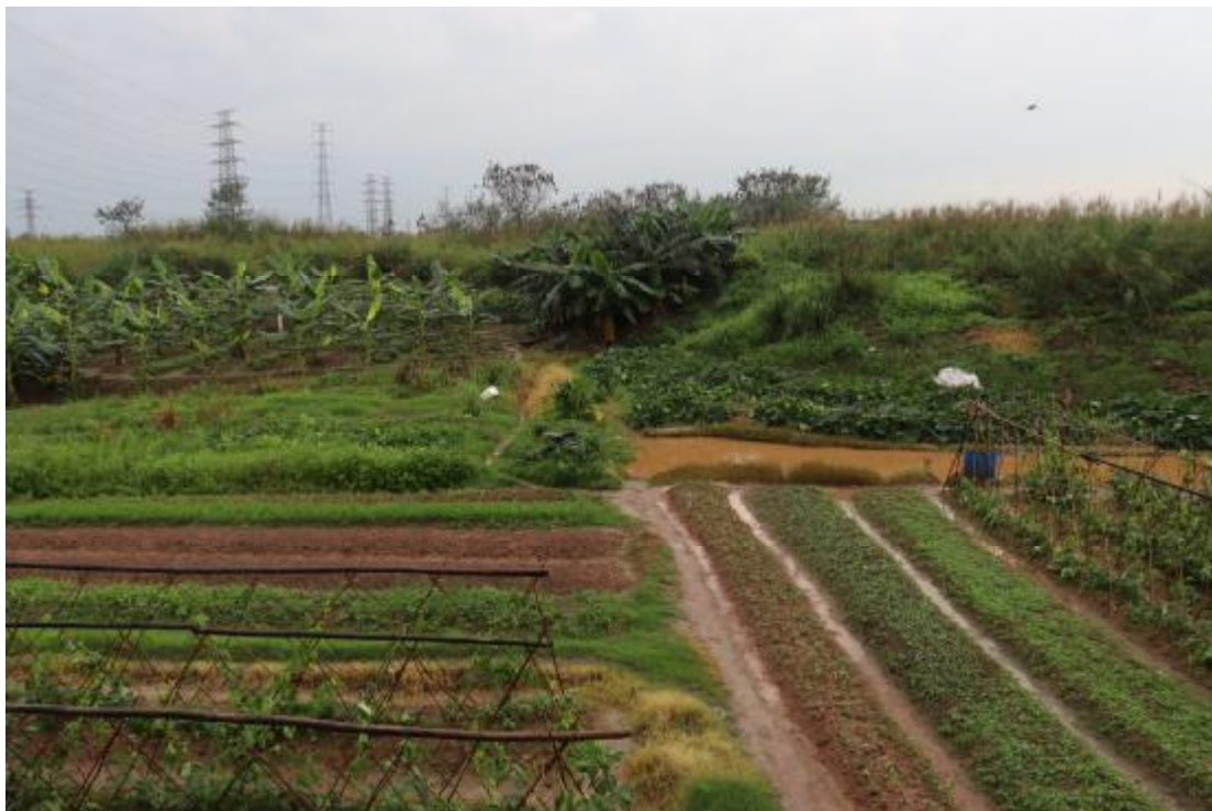
图 8 地块内北部现状（北-南）