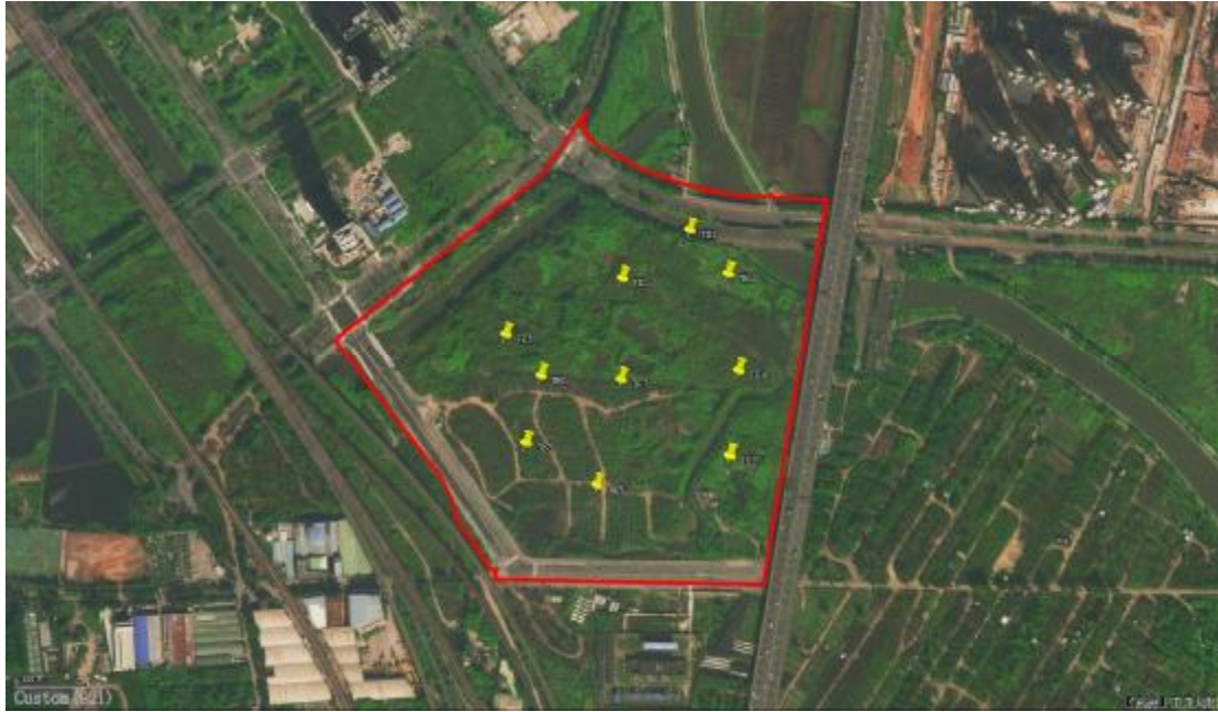
图 23 试探标准孔分布图

根据地形地貌及工作需要，为进一步了解并掌握该地块地层堆积情况，我们在地块范围内进行试探，共选取 10 个标准型探孔，编号为 TK1-TK10。其具体情况简要如下：