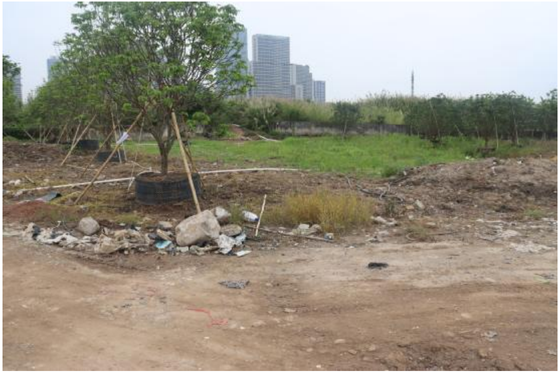
图 21 地块内西部现状（南-北）