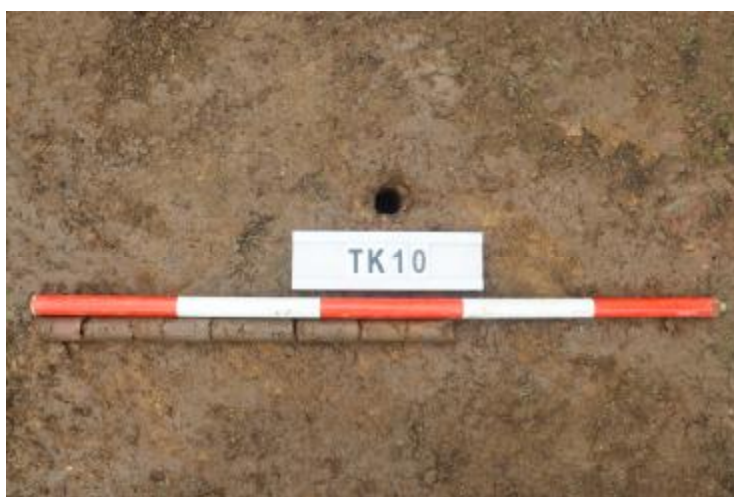
图 36 TK10 土样（一米标杆，土样由左往右）

①层：垫土层，距地表深 0-0.6 米，厚 0.6 米，为灰红色黏土，土质较疏松，含砂砾、建筑垃圾。以下有大石块，无法提取土样。