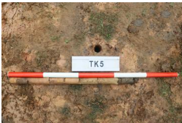
图 31 TK5 土样（一米标杆，土样由左往右）

②层：淤积层，距地表深 0.62-0.75 米，厚 0.13 米，为灰黑色淤泥，土质较疏松，含砂砾。以下渗水严重，无法提取土样。