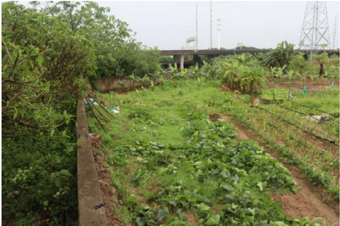
图 11 地块内北部现状（西-东）