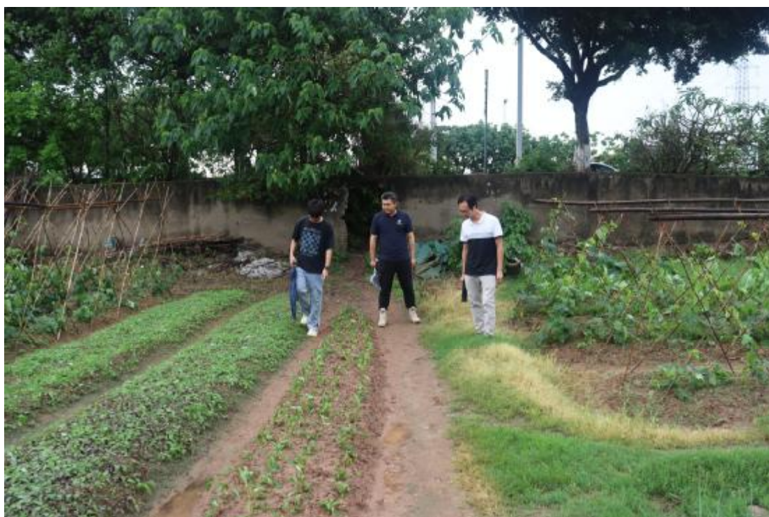
图 7 现场踏查（南-北）