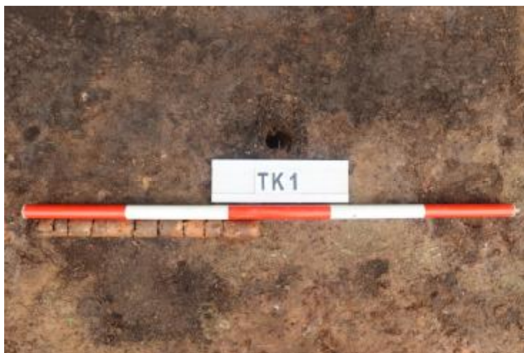
图 27 TK1 土样 (一米标杆, 土样由左往右)

①层: 垫土层, 距地表深 0-0.45 米, 厚 0.45 米, 为灰红色黏土, 土质较疏松, 含植物根系、建筑垃圾、砂砾。以下有大石块, 无法提取土样。