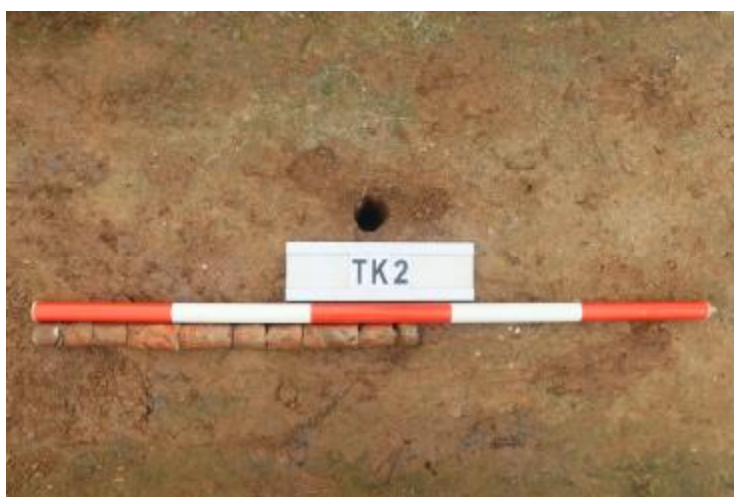
图 28 TK2 土样 (一米标杆, 土样由左往右)

①层: 垫土层, 距地表深 0-0.55 米, 厚 0.55 米, 为灰红色黏土, 土质较疏松, 含砂砾、建筑垃圾。以下有大石块, 无法提取土样。