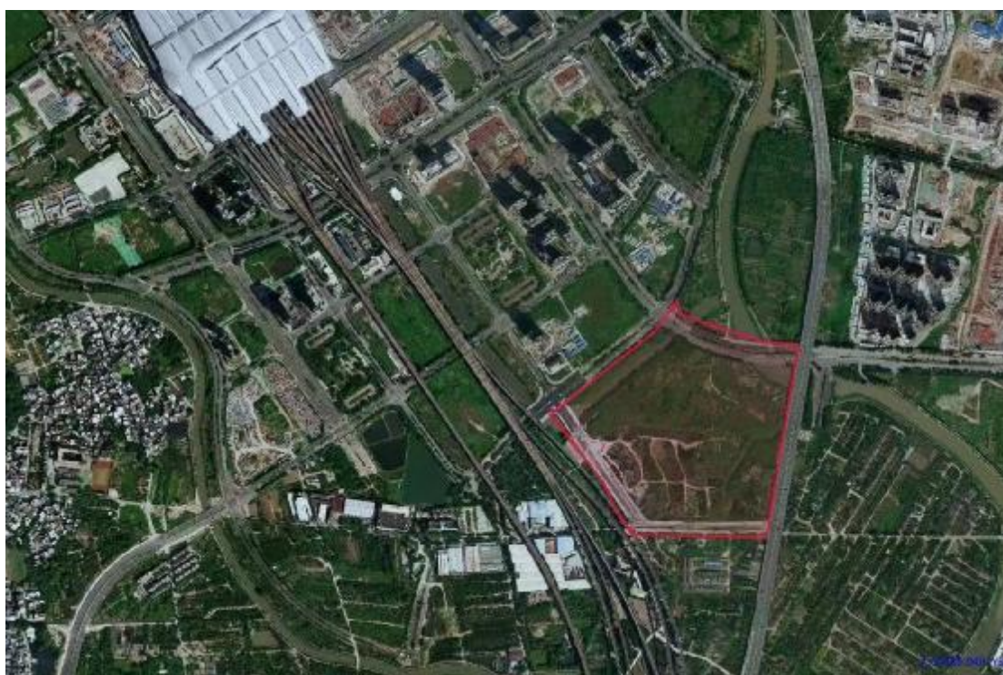
图 5 项目地块红线图(甲方提供)