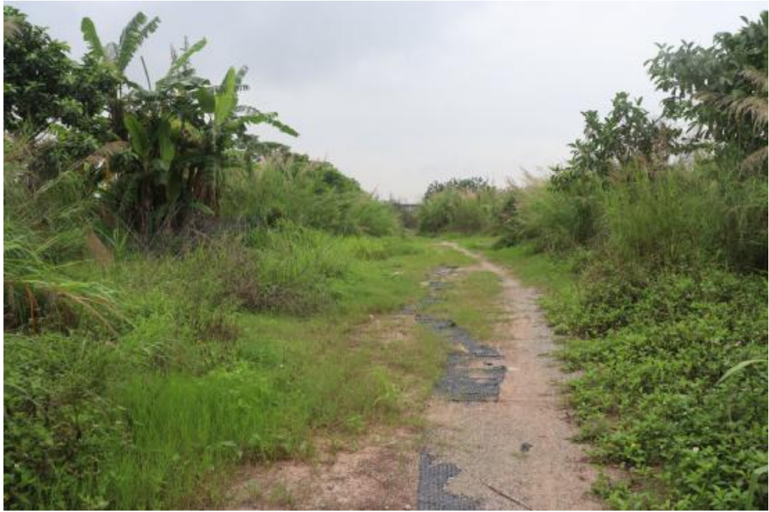
图 17 地块内南部现状（东-西）