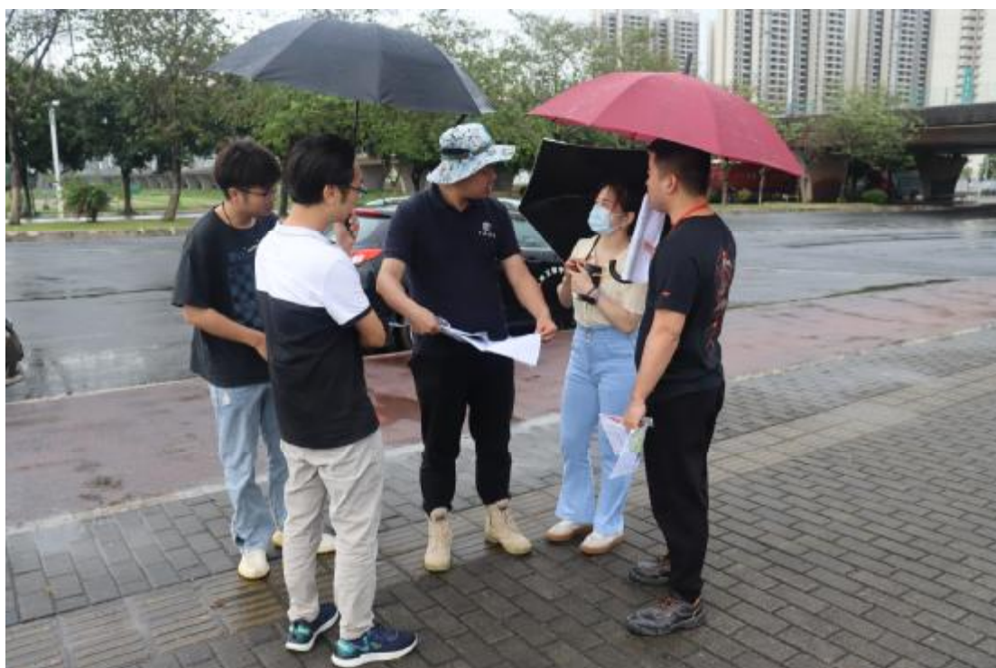
图 6 工作人员确认地块范围（西南-东北）