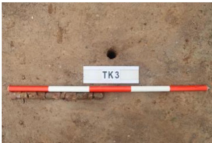
图 29 TK3 土样（一米标杆，土样由左往右）

①层：垫土层，距地表深 0-0.45 米，厚 0.45 米，为灰红色黏土，土质较疏松，含砂砾、建筑垃圾。以下有大石块，无法提取土样。