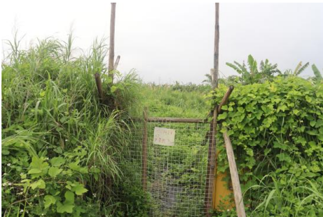
图 14 地块内中部现状（北-南）