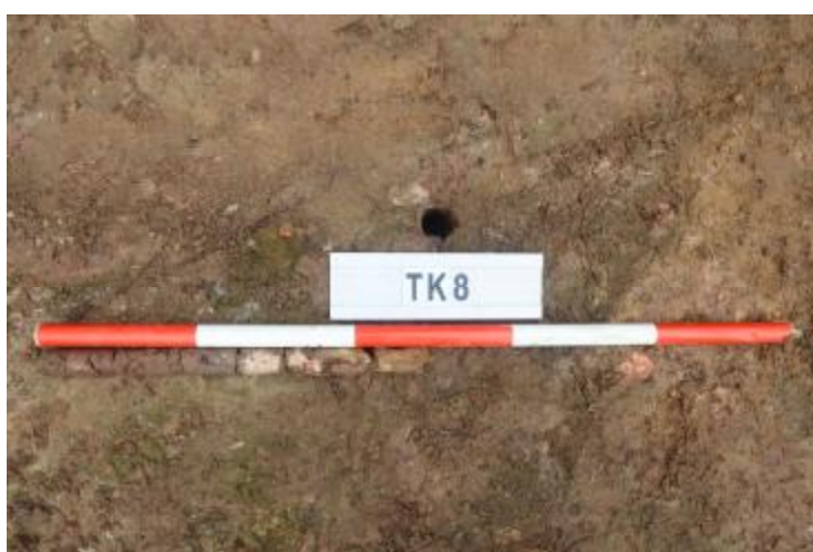
图 34 TK8 土样 (一米标杆, 土样由左往右)

①层: 垫土层, 距地表深 0-0.45 米, 厚 0.45 米, 为灰黄色黏土, 土质较疏松, 含砂砾、建筑垃圾。以下有大石块, 无法提取土样。