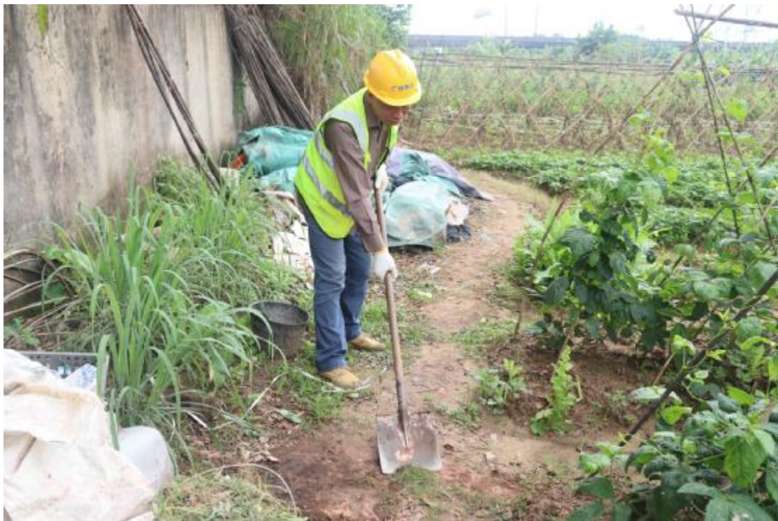
图 24 试探孔土样表面清理（西-东）