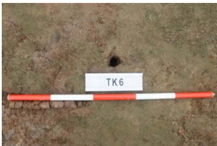
图 32 TK6 土样（一米标杆，土样由左往右）

①层：垫土层，距地表深 0-0.38 米，厚 0.38 米，为灰红色黏土，土质较疏松，含砂砾、建筑垃圾。以下有大石块，无法提取土样。