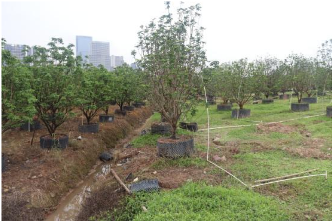
图 19 地块内南部现状（南-北）