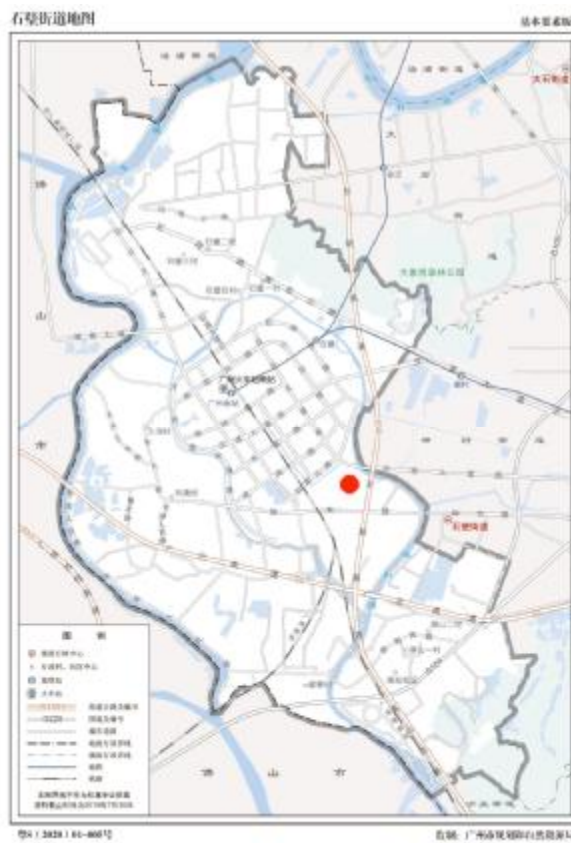
图 3 项目地块在石壁街道位置示意图（广州市规划和自然资源局）