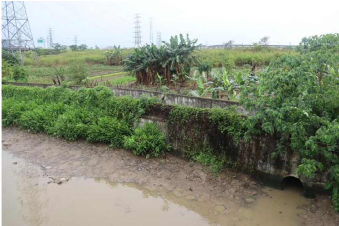
图 9 地块内北部现状（北-南）