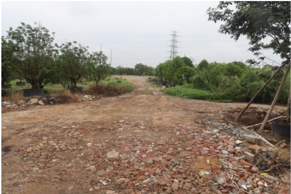
图 18 地块内南部现状（西-东）