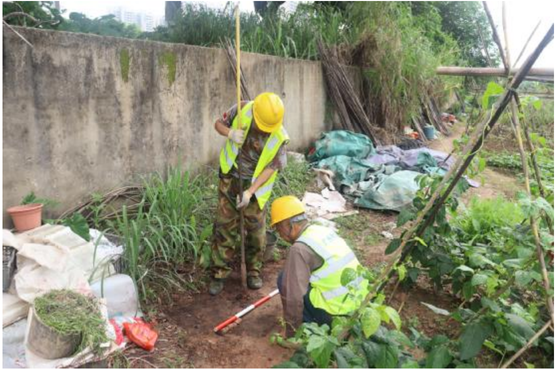
图 25 试探孔提取土样（西南-东北）