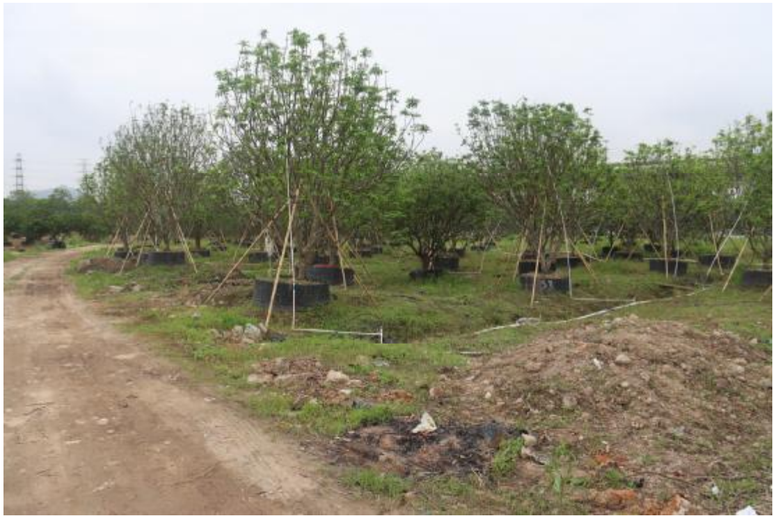
图 22 地块内西部现状（北-南）