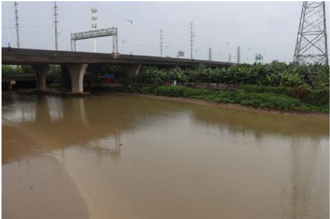
图 12 地块内东北部现状（北-南）