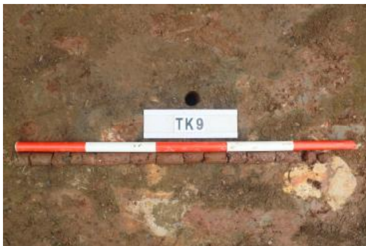
图 35 TK9 土样（一米标杆，土样由左往右）

①层：垫土层，距地表深 0-0.9 米，厚 0.9 米，为灰红色黏土，土质疏松，含砂砾、建筑垃圾。以下有大石块，无法提取土样。