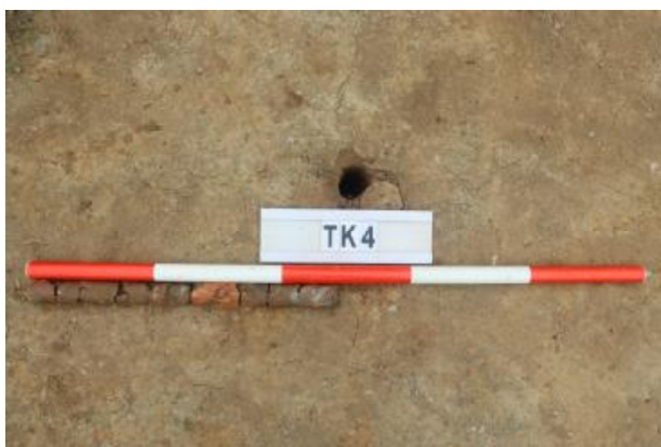
图 30 TK4 土样（一米标杆，土样由左往右）

①层：垫土层，距地表深 0-0.48 米，厚 0.48 米，为灰黄色黏土，土质较疏松，含砂砾、建筑垃圾。以下有大石块，无法提取土样。