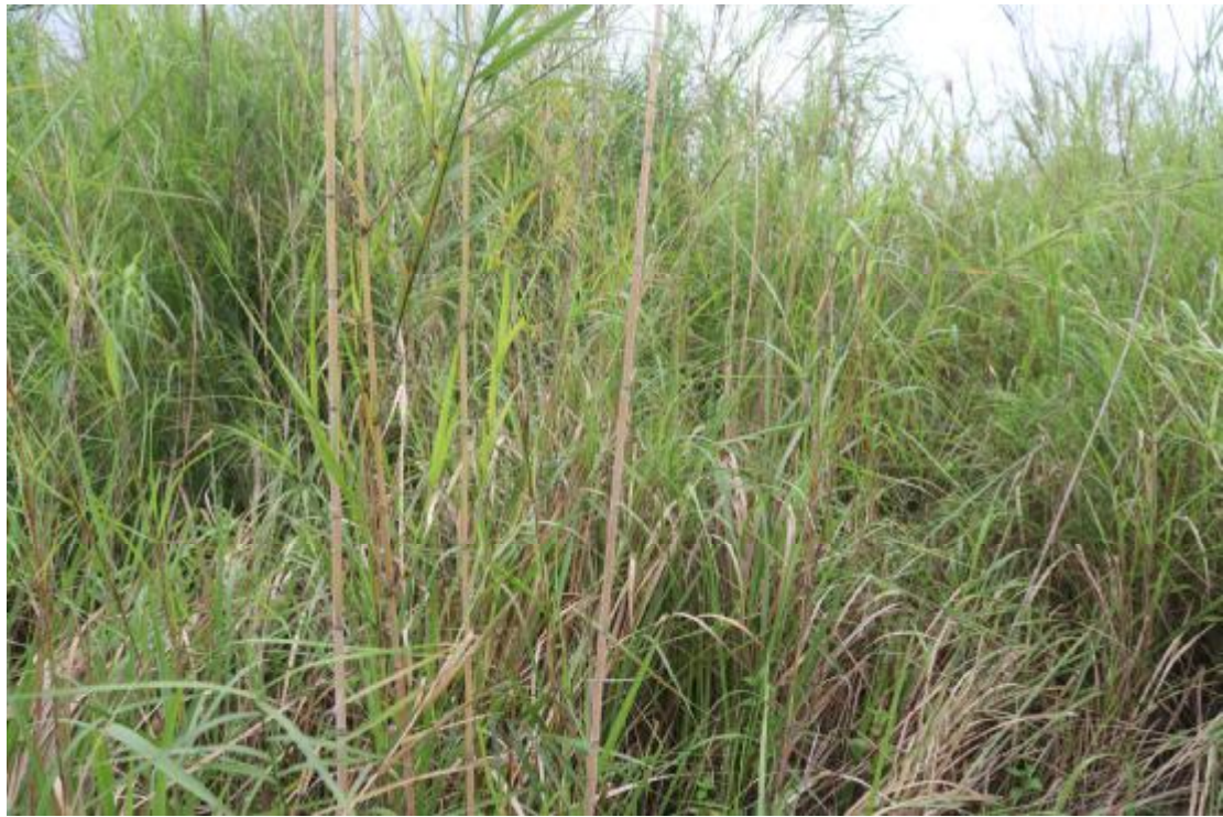
图 16 地块内中部现状（东-西）