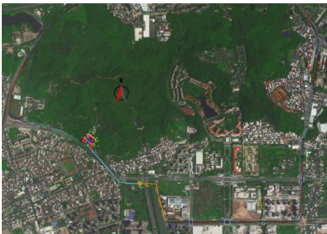
图 5 工程用地规划红线示意图（甲方提供）