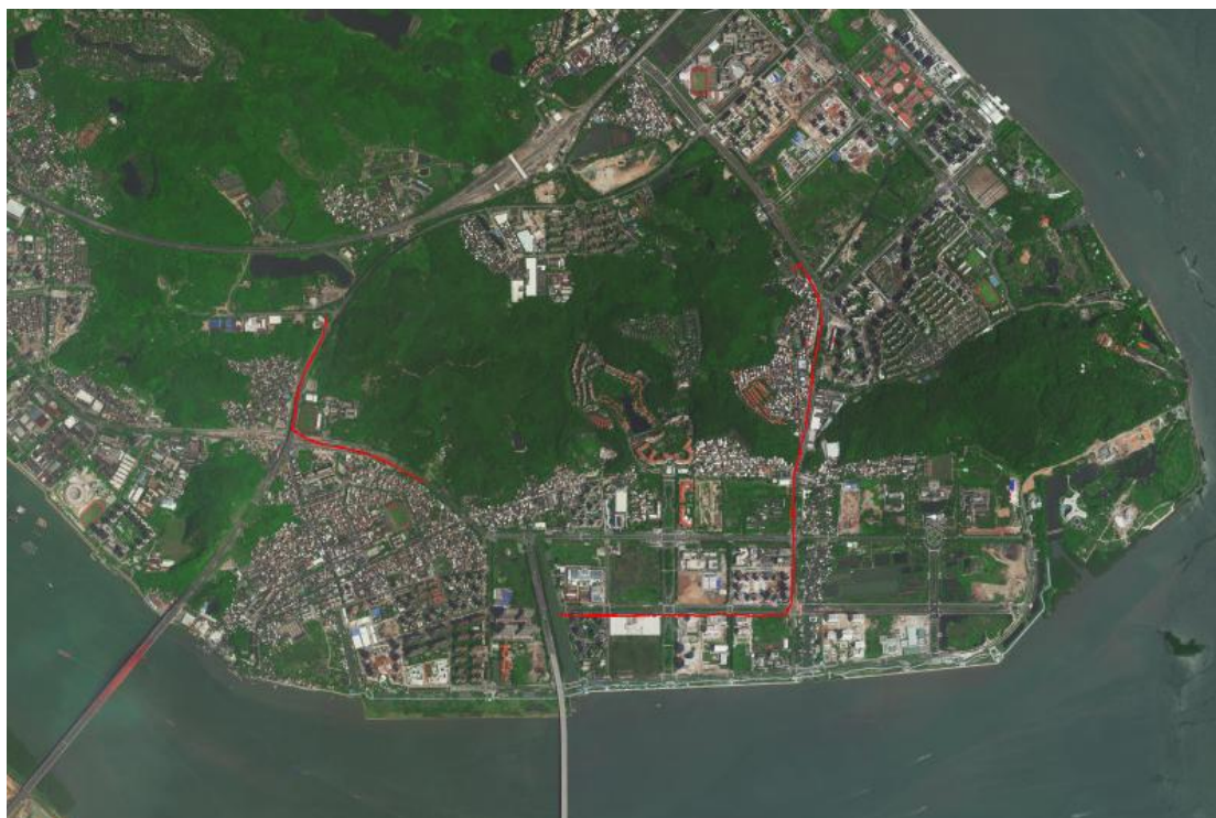
图 4 工程用地卫星红线图（高德地图）