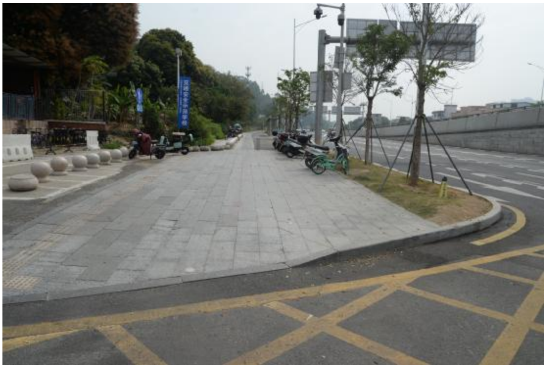
图 28 工程用地地表现状（西-东）