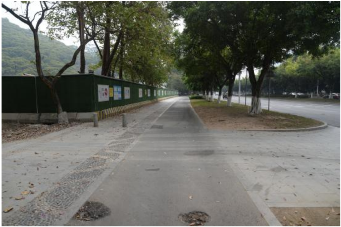
图 22 工程用地地表现状（东-西）