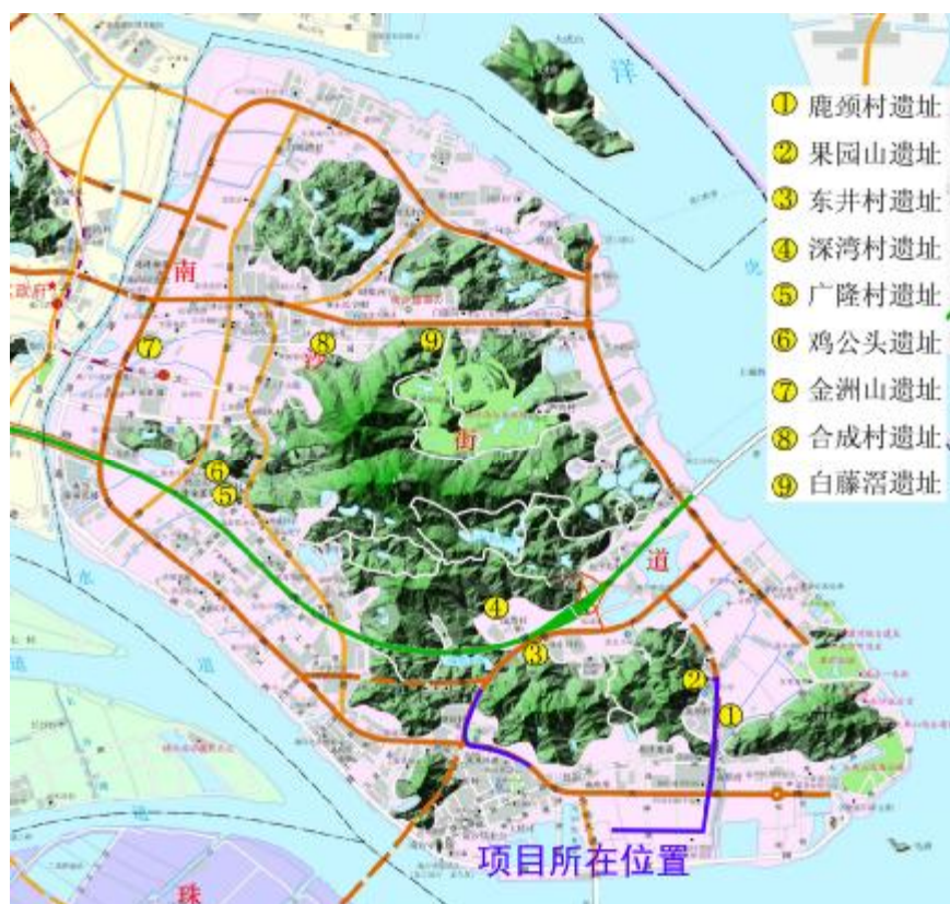
图 6 该工程项目与周边遗址的位置关系

果园山遗址：位于南沙街鹿颈村小学西北，果园路北侧果园山南坡，属鹿山东坡的一部分，山坡较缓，有的地方呈台阶状。在有的台阶断面上能明显看到文化层堆积，堆积厚度为 20—50 厘米。现地表种植有荔枝树、香蕉和竹子。遗址近三角形，其范围东西约 80 米、南北约 61 米，面积近 4000 平方米。地表采集到大量先秦时期的遗物和唐代釉陶片。先秦时期的陶片为夹砂陶，多呈红褐色、灰白色和红褐色，少量呈深灰色，胎质多呈深灰色、浅灰色和黑灰色，胎质稍硬。纹饰有三重菱格纹、绳纹、篮纹、曲折纹。器形有圈足盘、敞口器、折肩或折腹器。石器为凝灰岩，均为磨制，制作精美，形有石镞、斧及镞等。其年代相当于商代晚期。