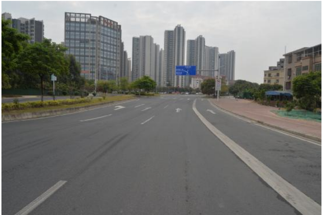
图 12 工程用地地表现状（南-北）