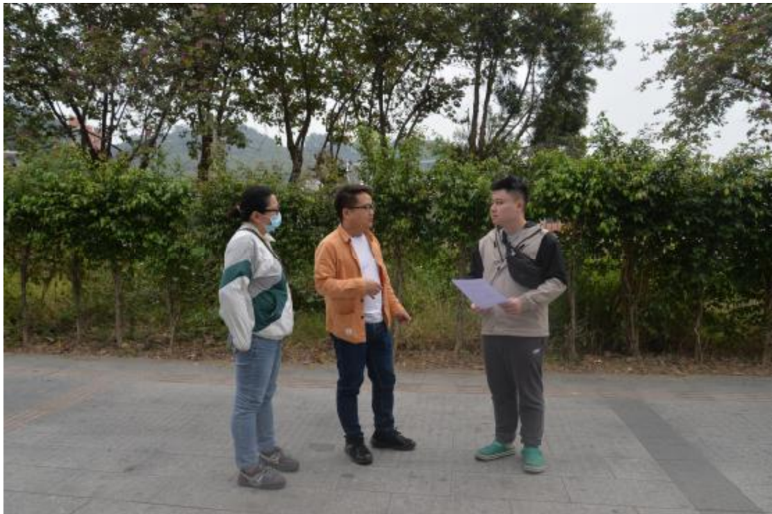
图 7 与现场工作人员确定工程范围（西-东）