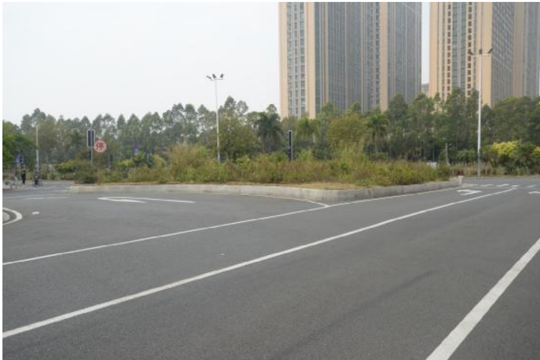
图 21 工程用地地表现状（西-东）