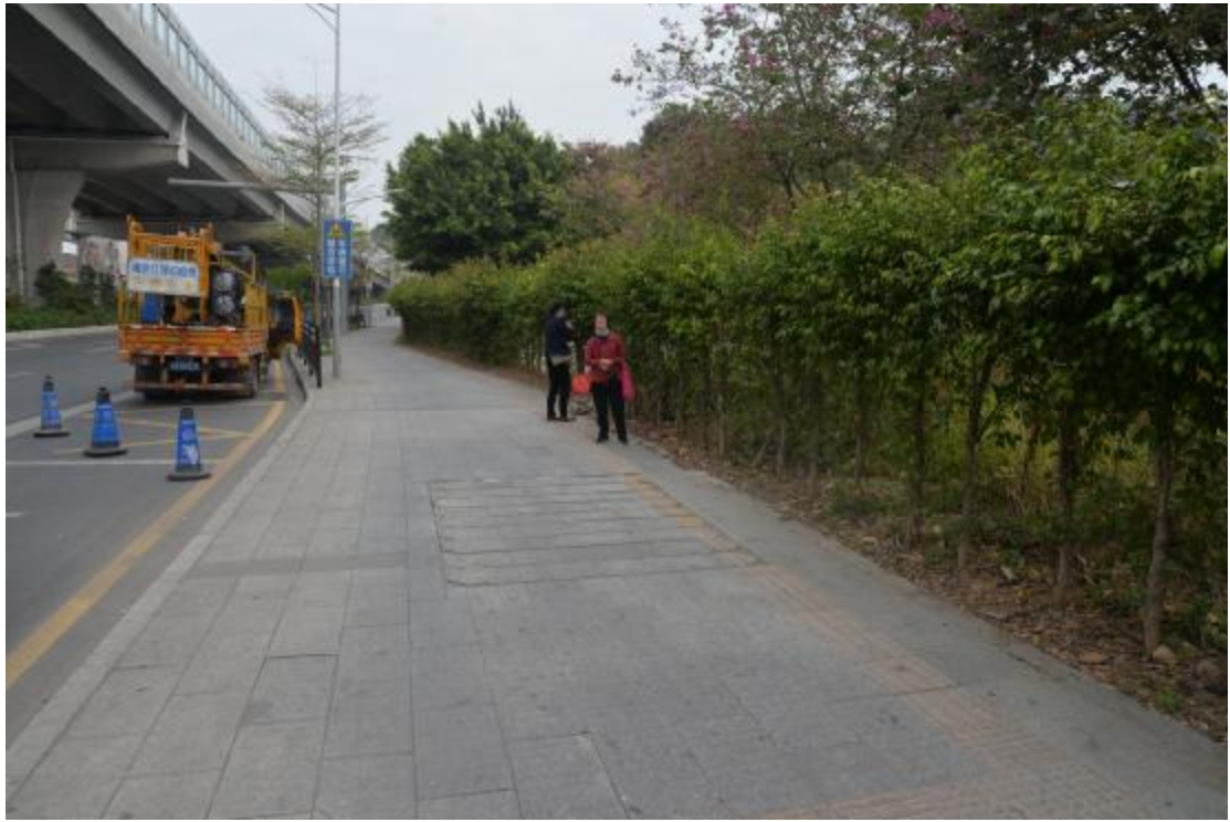
图 10 工程用地地表现状（南-北）