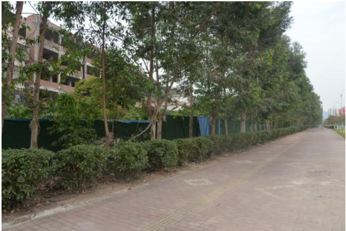
图 13 工程用地地表现状（北-南）