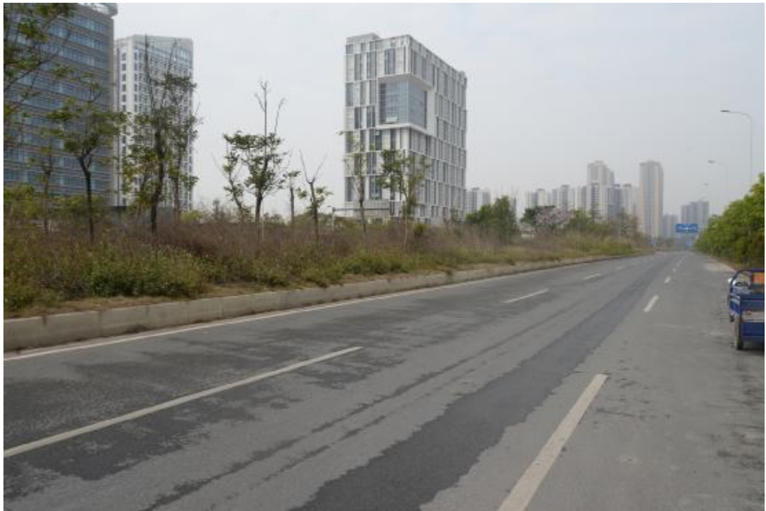
图 15 工程用地地表现状（西—东）