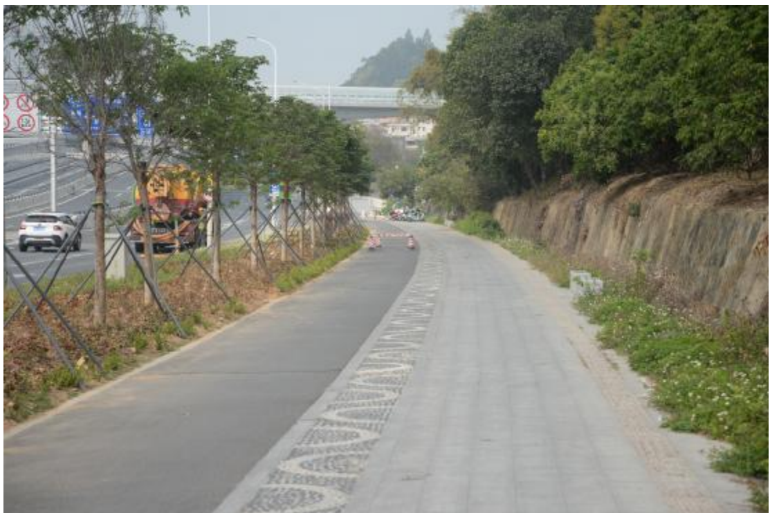
图 27 工程用地地表现状（东-西）