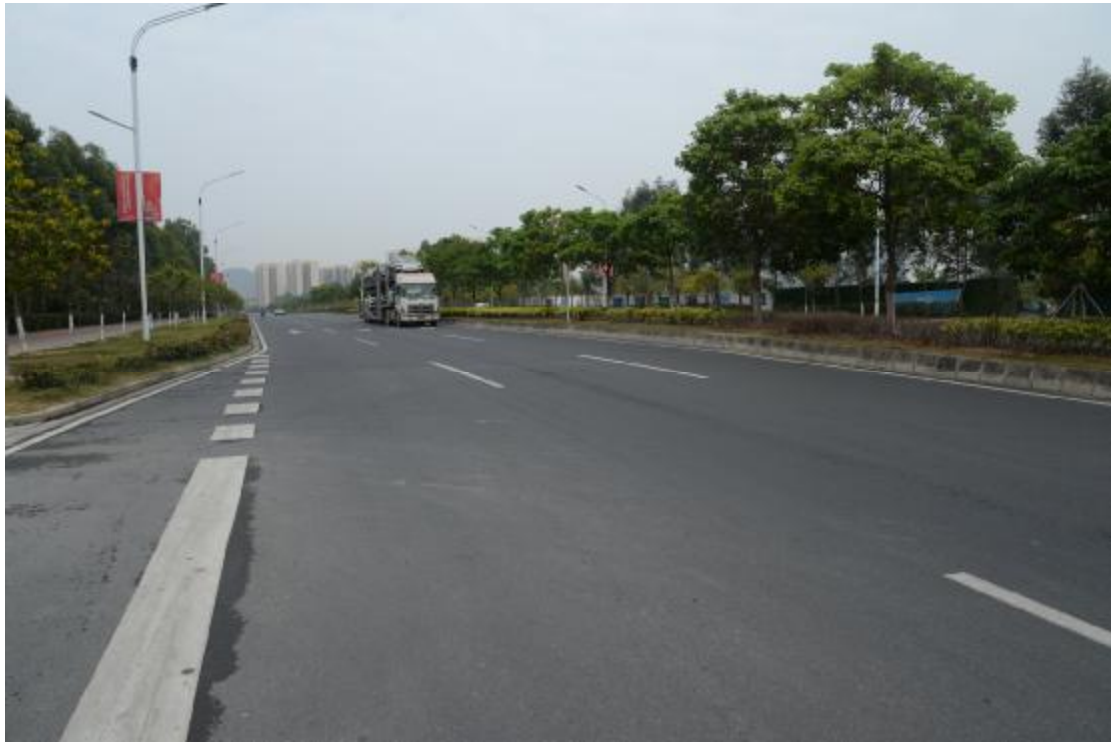
图 14 工程用地地表现状（南—北）