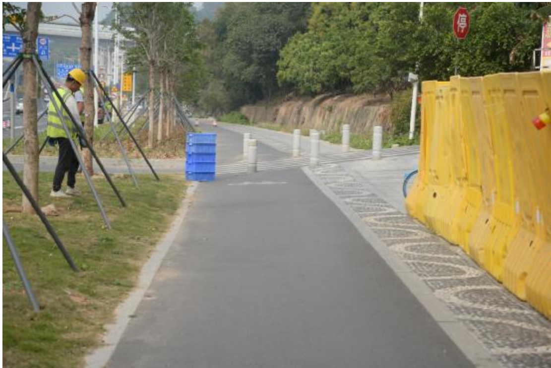
图 25 工程用地地表现状（西-东）