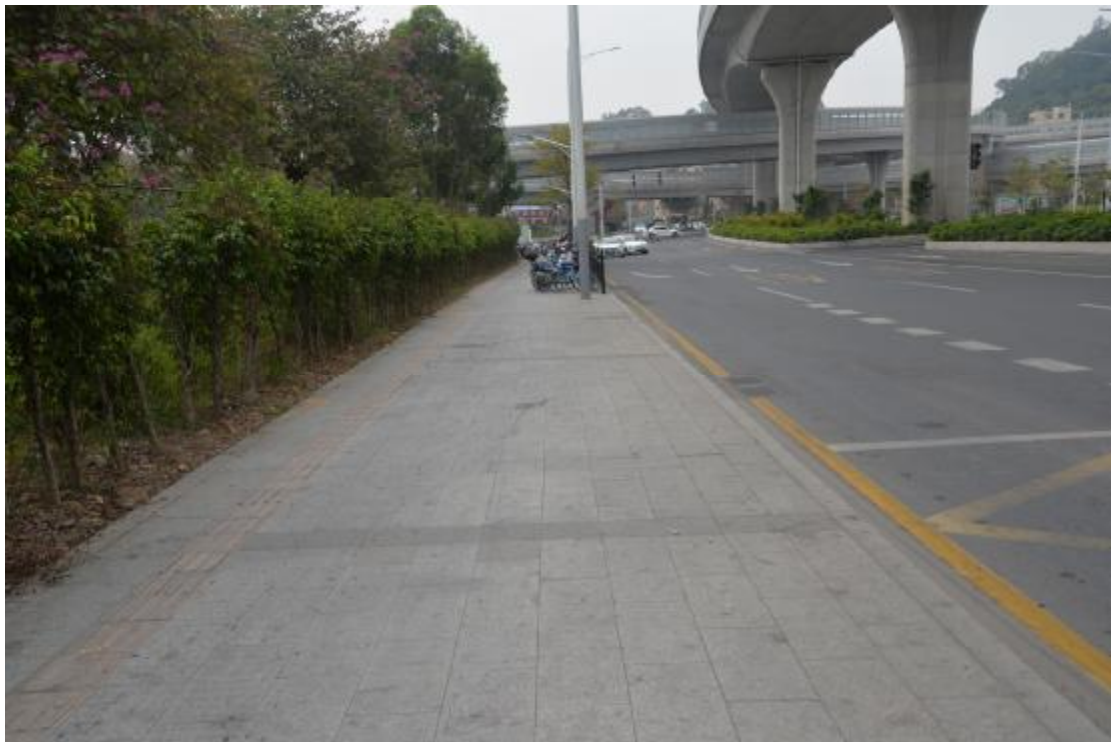
图 9 工程用地地表现状（北—南）