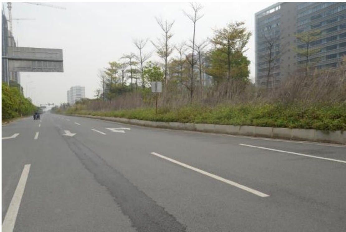
图 18 工程用地地表现状（东-西）