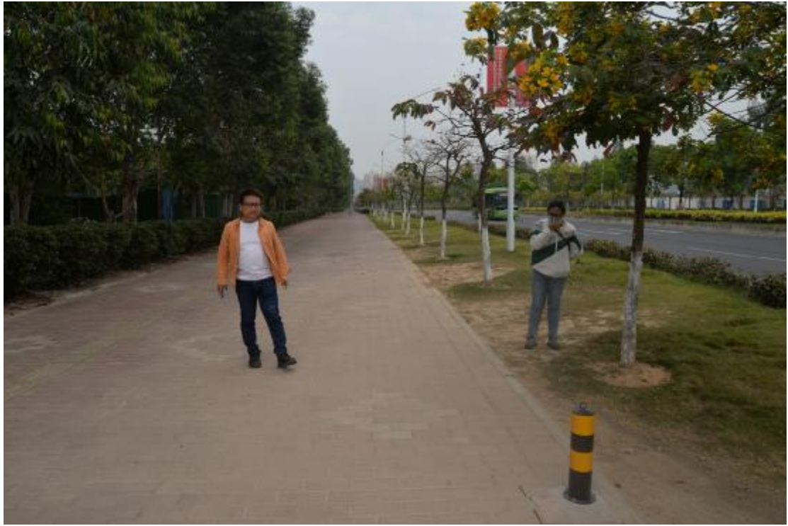
图 8 对工程用地地表进行踏查（北—南）