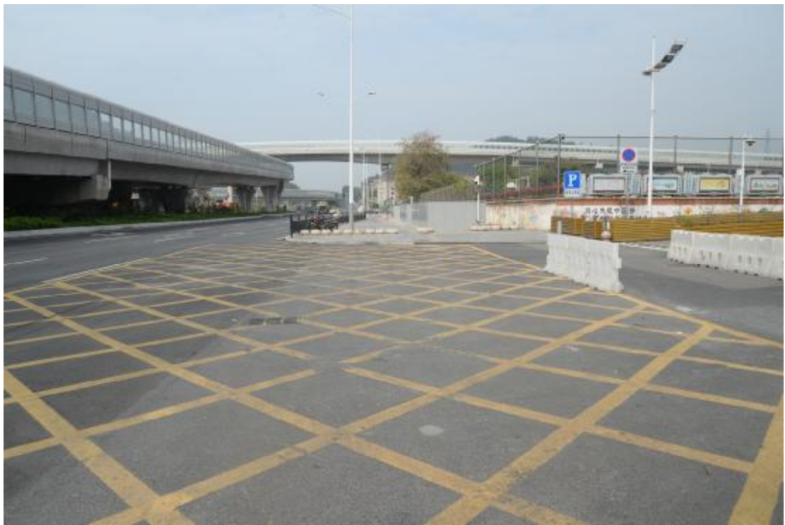
图 26 工程用地地表现状（东-西）