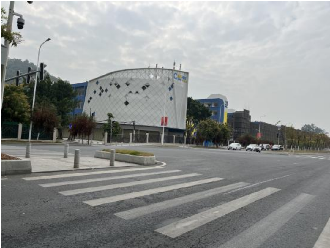
图 29 工程用地地表现状（南-北）