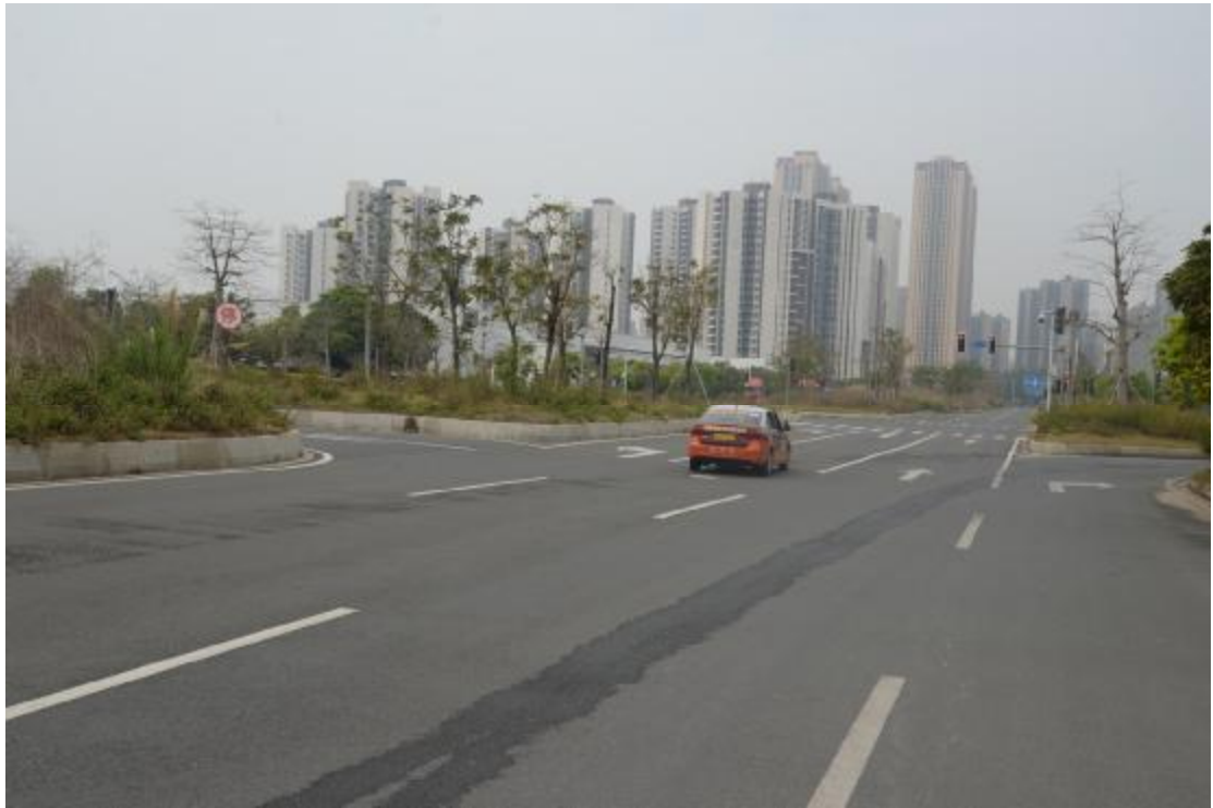
图 16 工程用地地表现状（西-东）