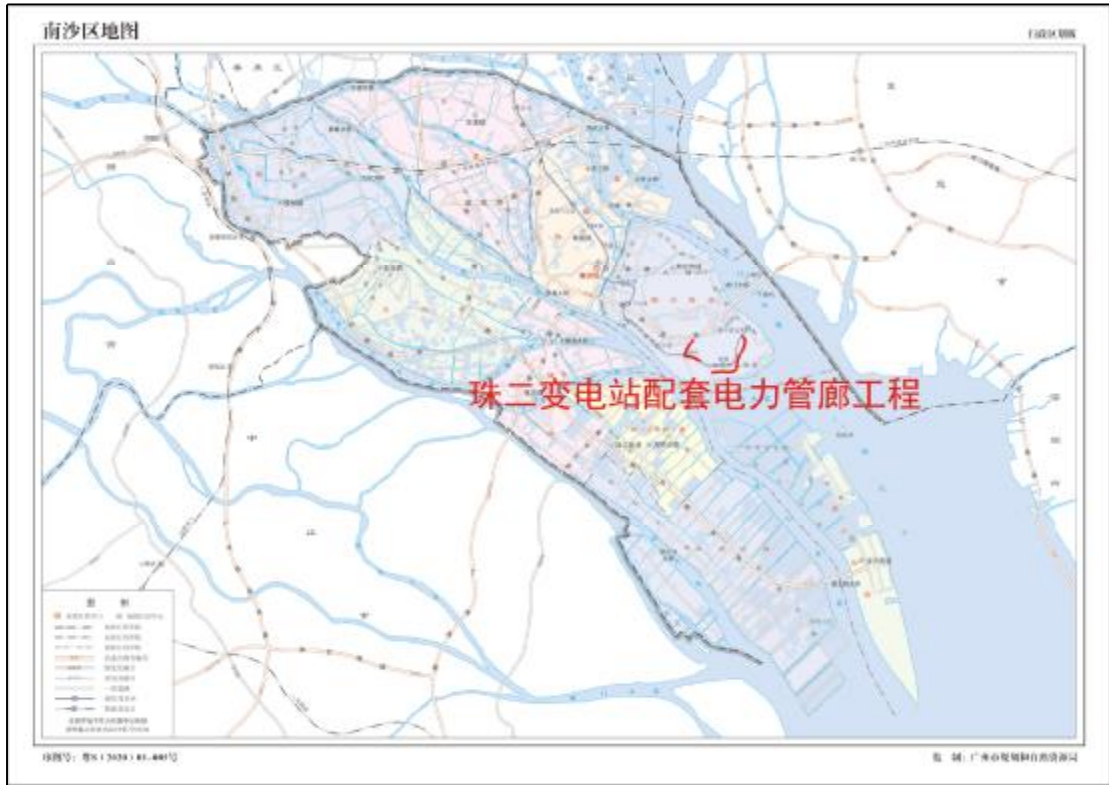
图 2 工程用地在南沙区的位置示意图（广东省规划和自然资源局）