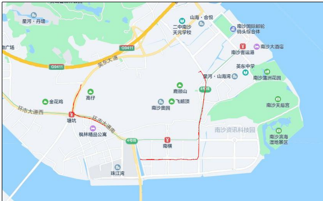
图 3 工程用地周边环境示意图（腾讯地图）