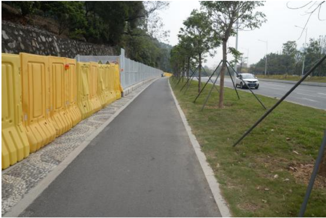
图 24 工程用地地表现状（东-西）