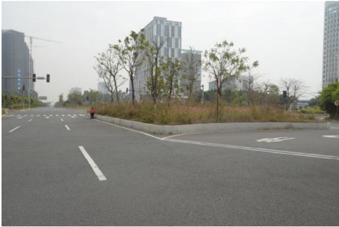
图 20 工程用地地表现状（东-西）