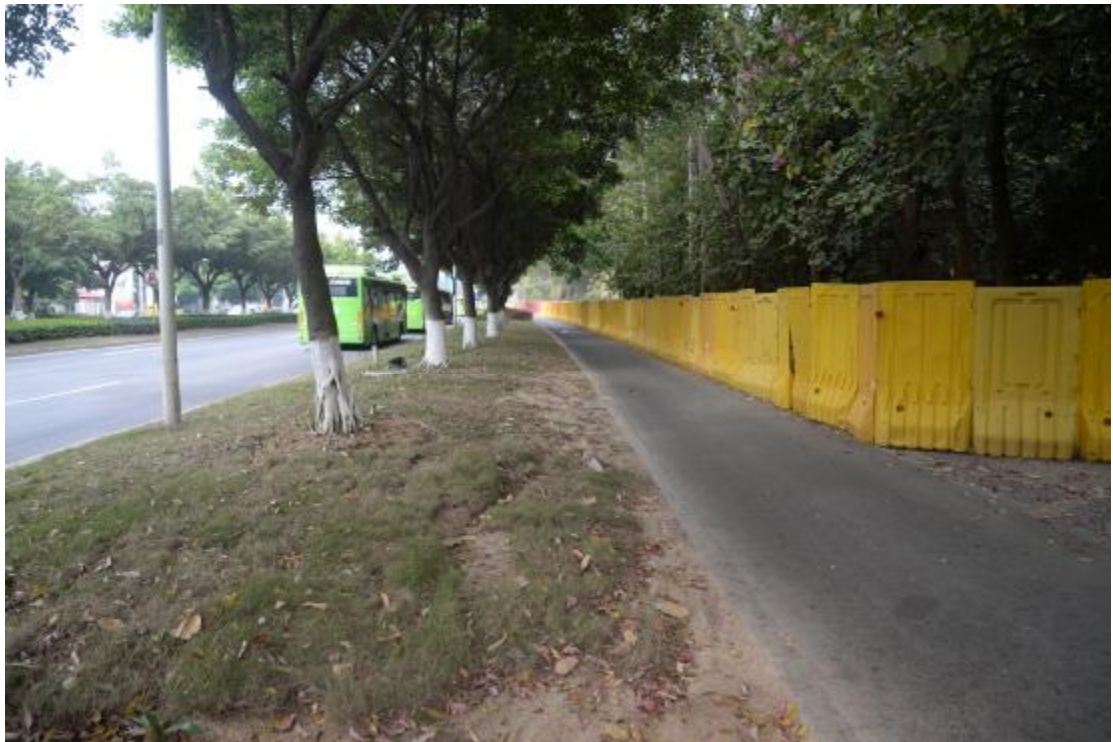
图 23 工程用地地表现状（西-东）