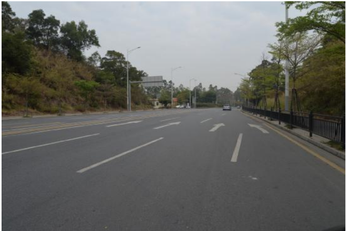
图 11 工程用地地表现状（南-北）