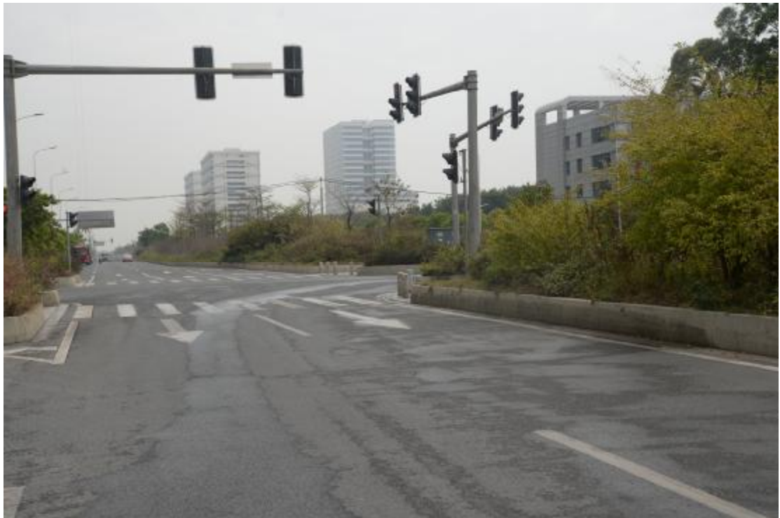
图 17 工程用地地表现状（东-西）