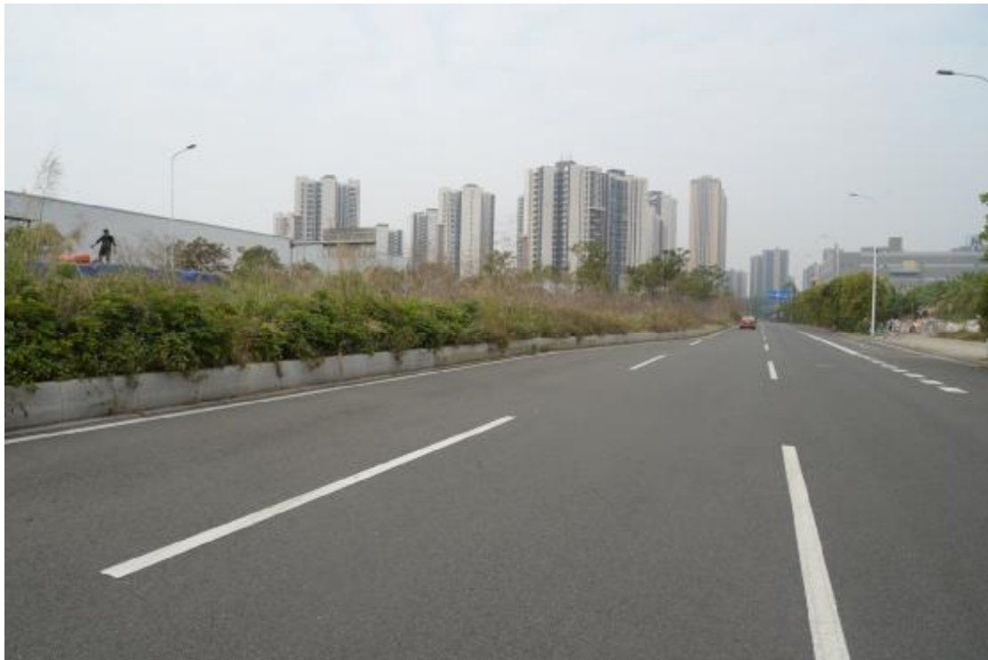
图 19 工程用地地表现状（西-东）