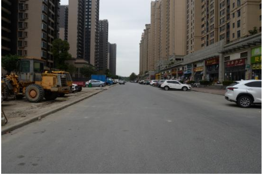
图 8 地块地表现状（西—东）