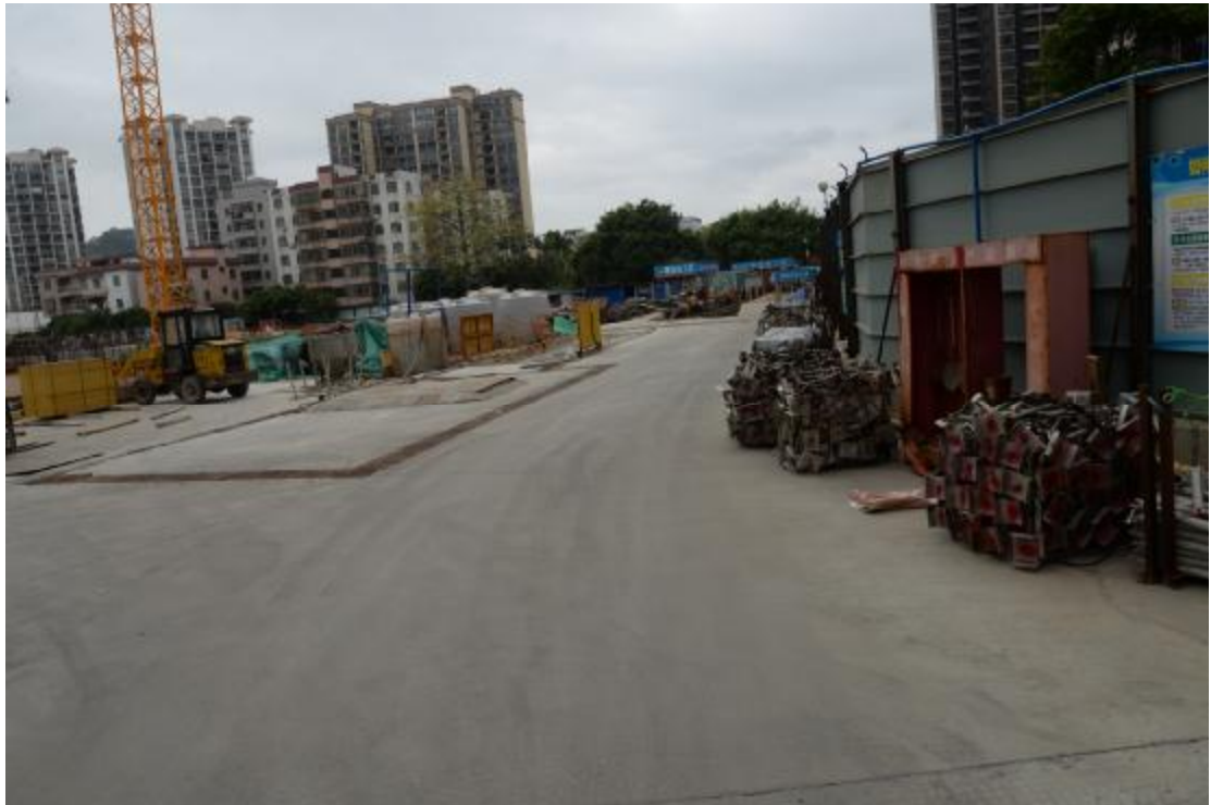
图 9 地块地表现状（南—北）