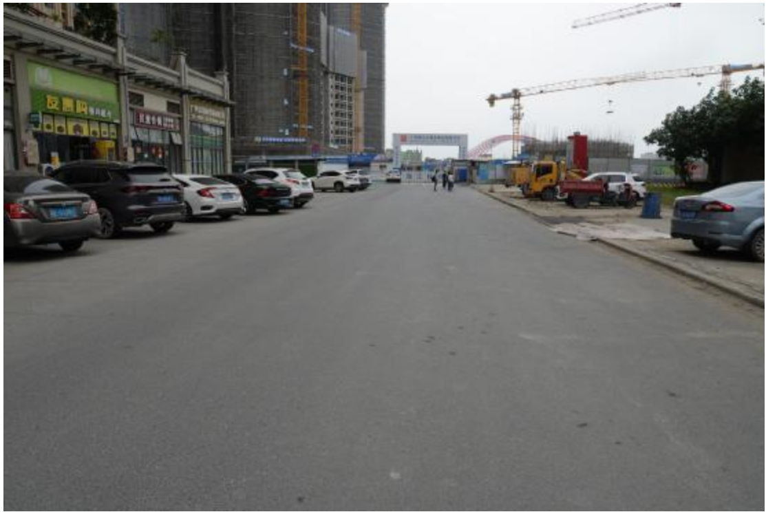
图 14 地块地表现状（东—西）