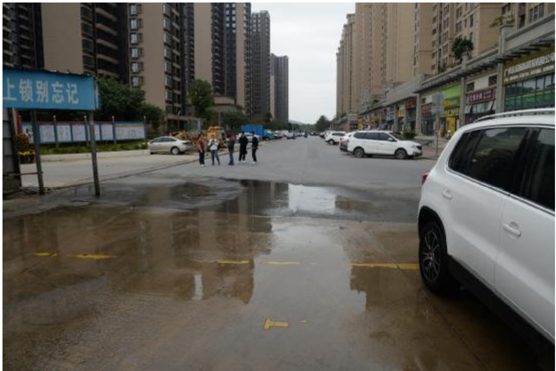
图 11 地块地表现状（西—东）