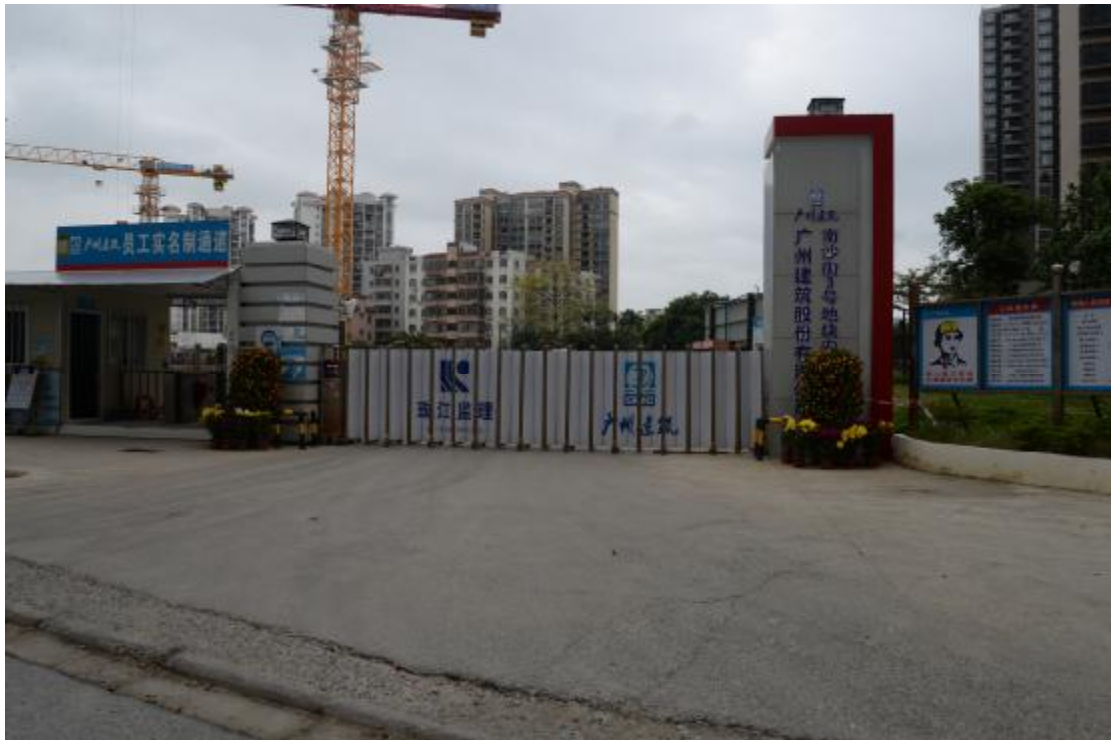
图 7 地块地表现状（南—北）