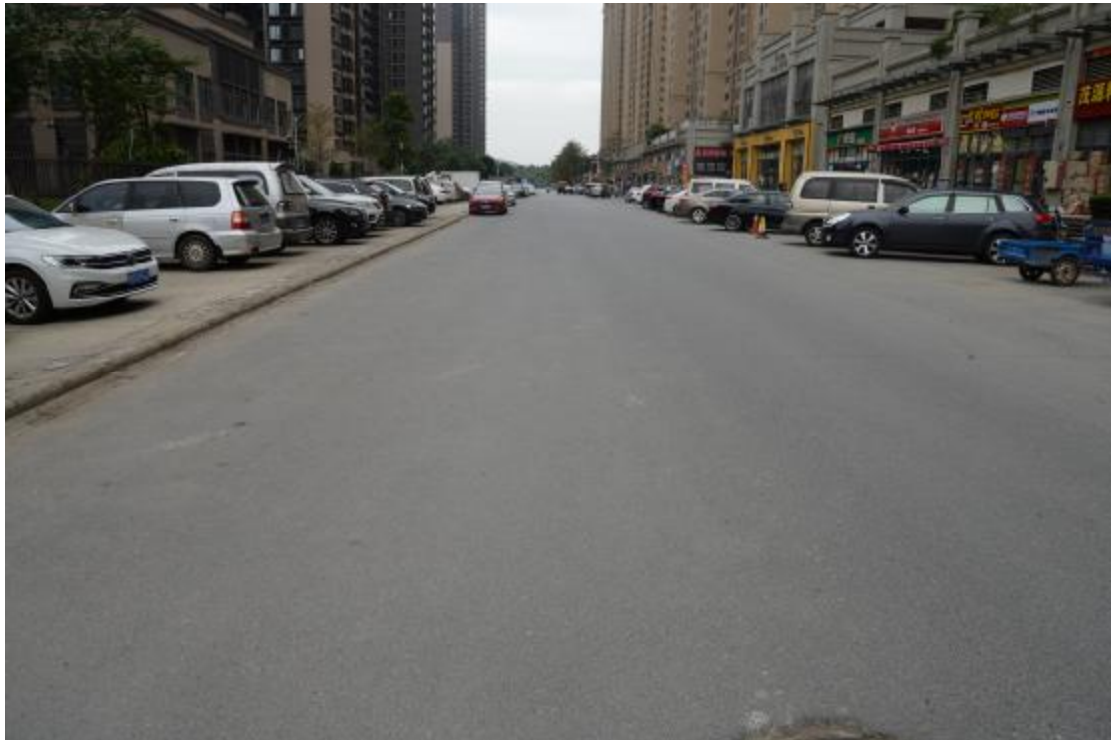
图 13 地块地表现状（西—东）