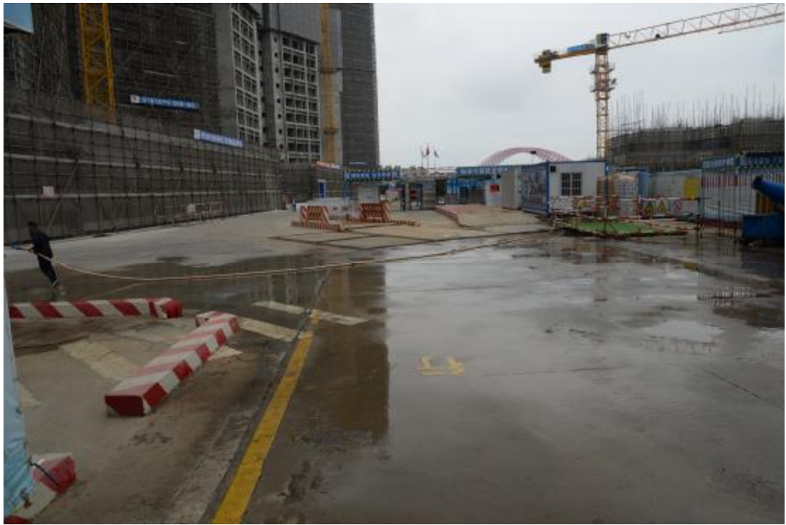
图 10 地块地表现状（东—西）