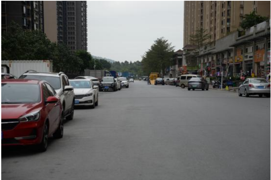
图 17 地块地表现状（西—东）