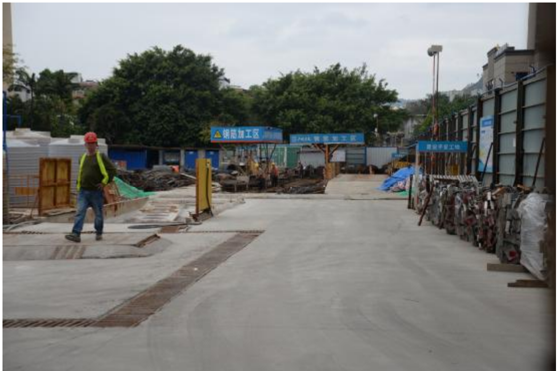
图 15 地块地表现状（南—北）