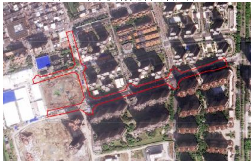
图 4 地块卫星红线图（甲方提供）