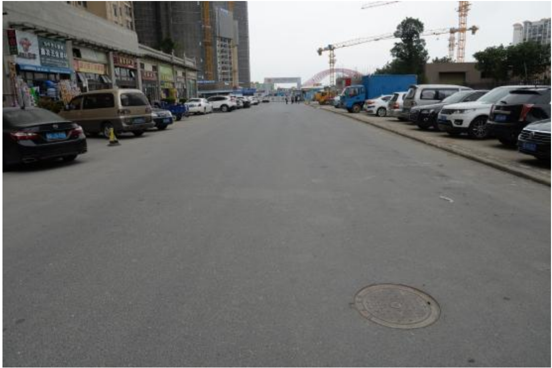
图 16 地块地表现状（东—西）