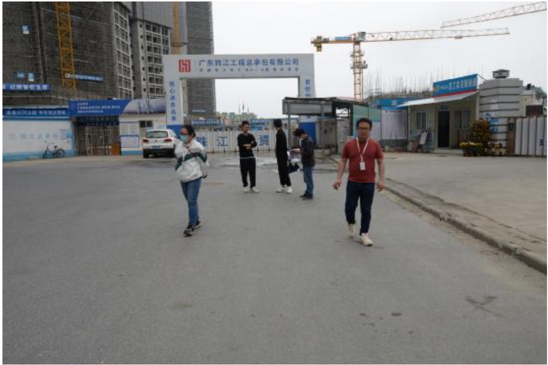
图 6 对地块地表进行踏查（东—西）