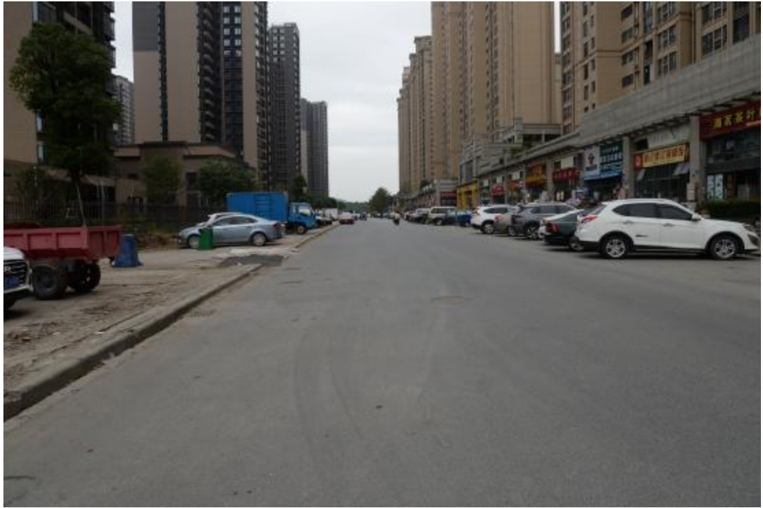
图 12 地块地表现状（西—东）