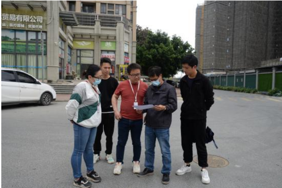
图 5 与现场工作人员确定地块范围（北—南）