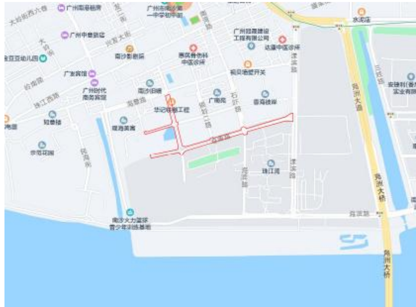
图 3 地块周边环境示意图（腾讯地图）