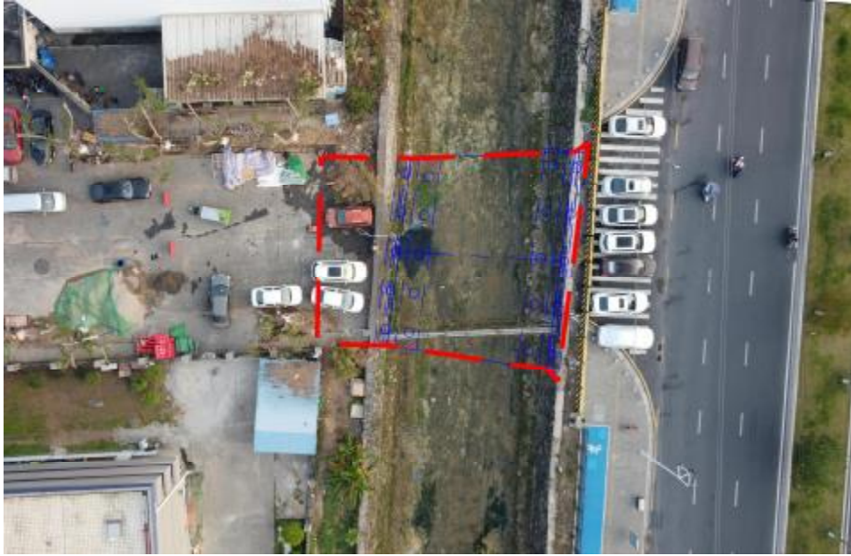
图 4 项目工程规划红线图