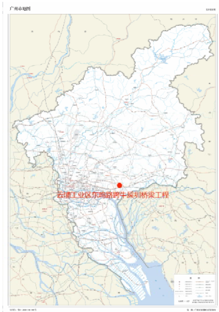
图 1 项目工程在广州市位置示意图（广州市规划和自然资源局）

根据《中华人民共和国文物保护法》《广州市文物保护规定》，按照《广州市文物局关于黄埔区云埔工业区玉云路宁埔大道等 7 个市政道路工程考古调查勘探工作的复函》（文物 2022391 号）的指导意见，受广州开发区财政投资建设项目管理中心委托，由我院配合该项目建设，对该地块进行考古调查工作。