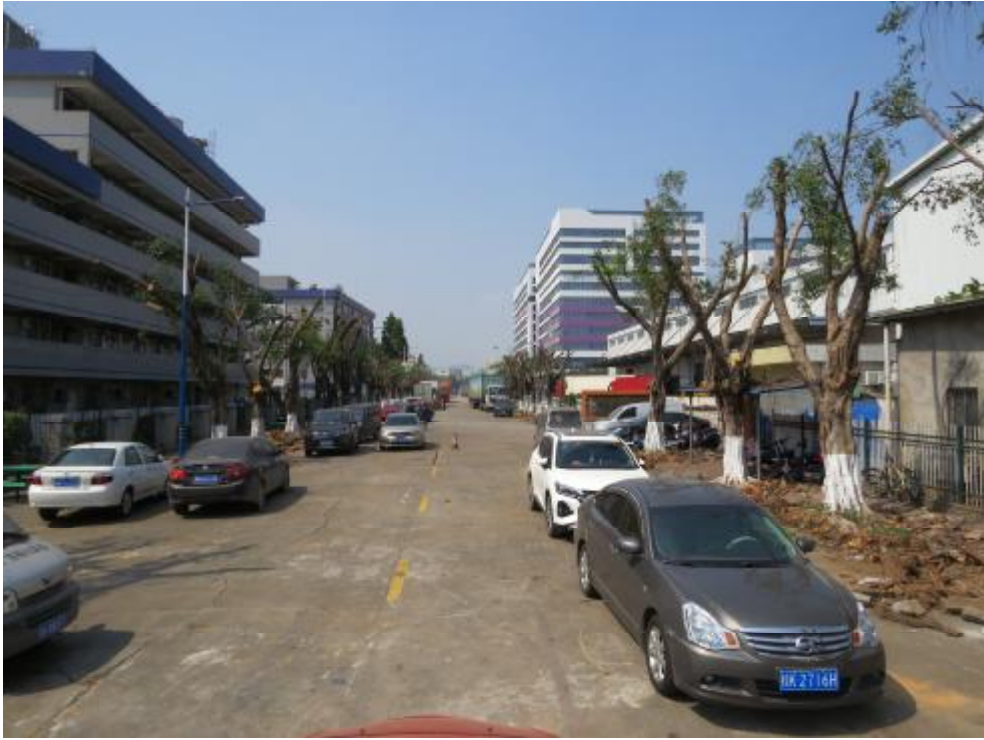
图 9 地块内现状（东-西）