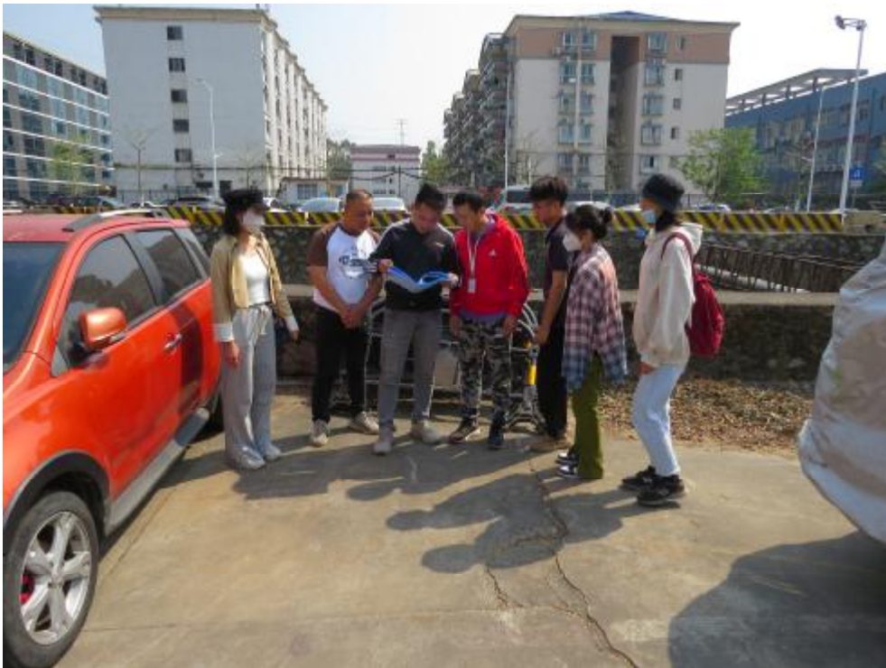
图 6 工作人员确认地块范围（西-东）