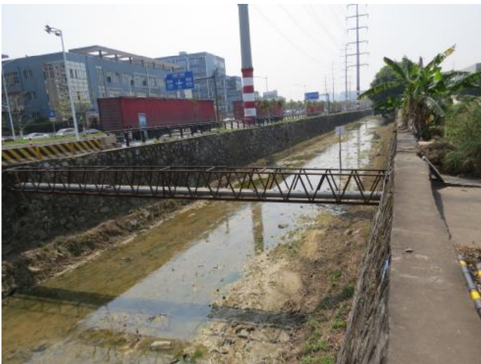
图 8 地块内现状（北-南）