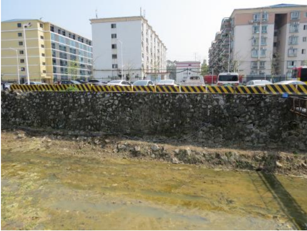
图 11 地块内现状（西-东）