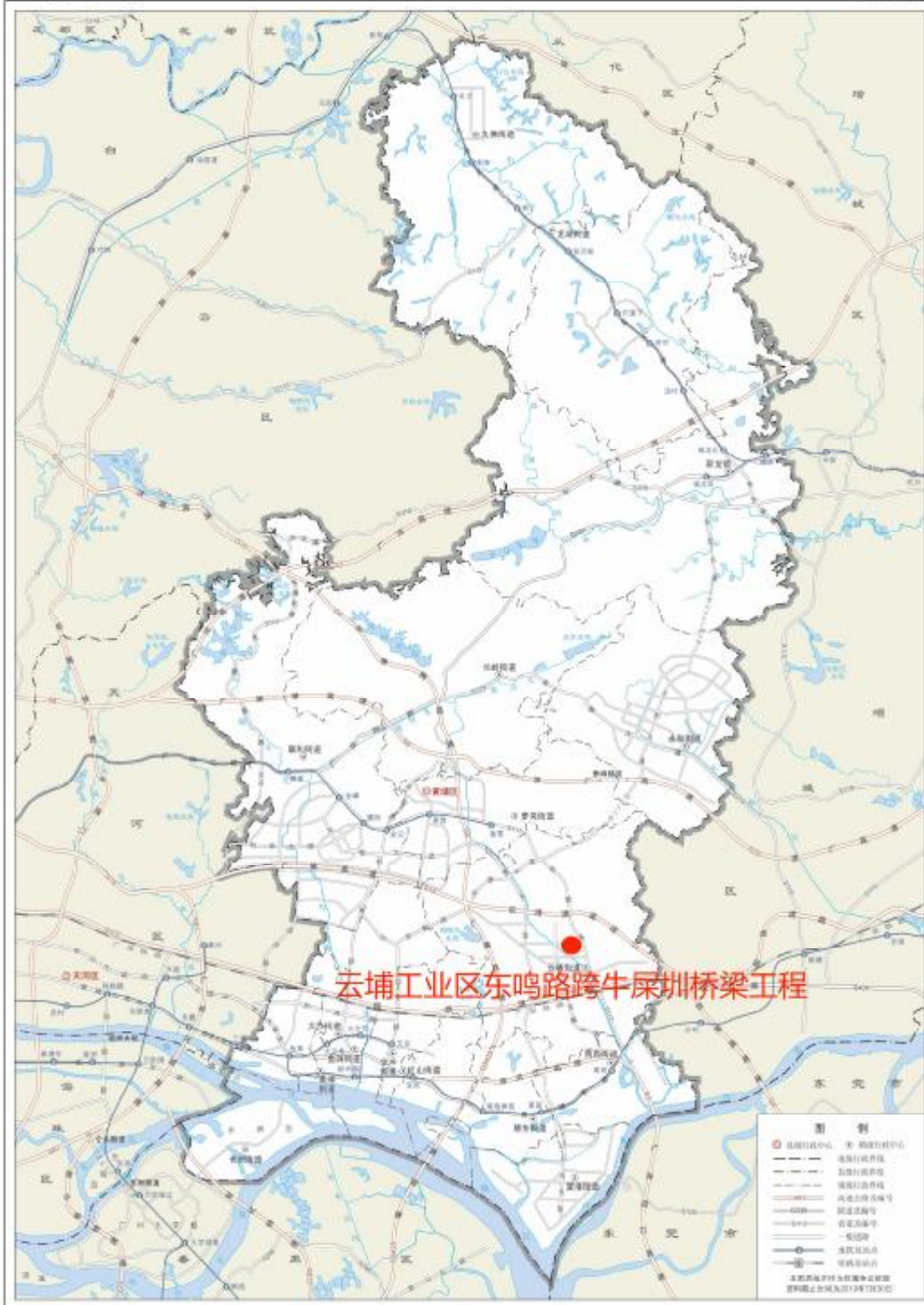
图 2 项目工程在黄埔区的位置（广州市规划和自然资源局）