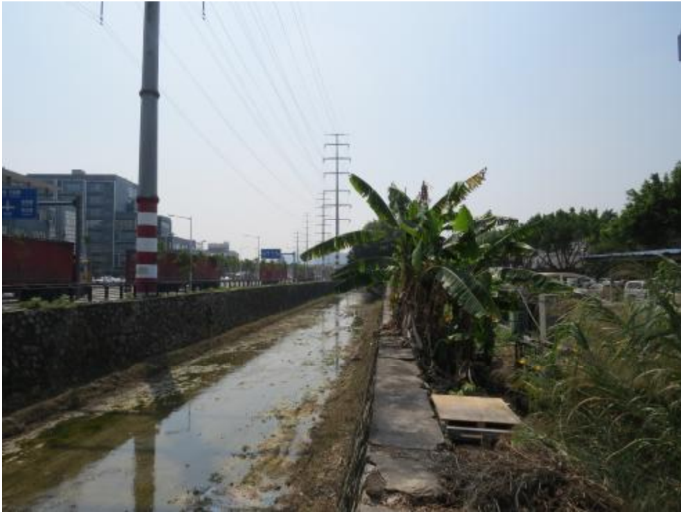
图 12 地块内现状（北-南）