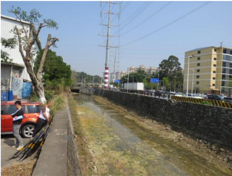
图 10 地块内现状（南-北）