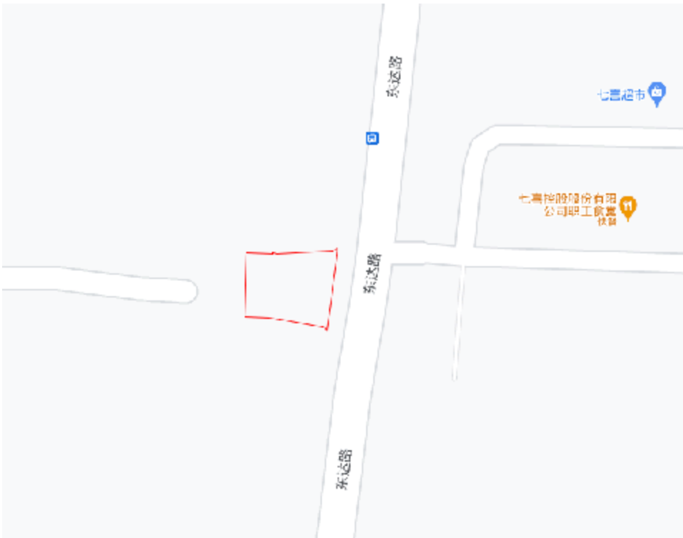
图 5 项目工程周边环境示意图