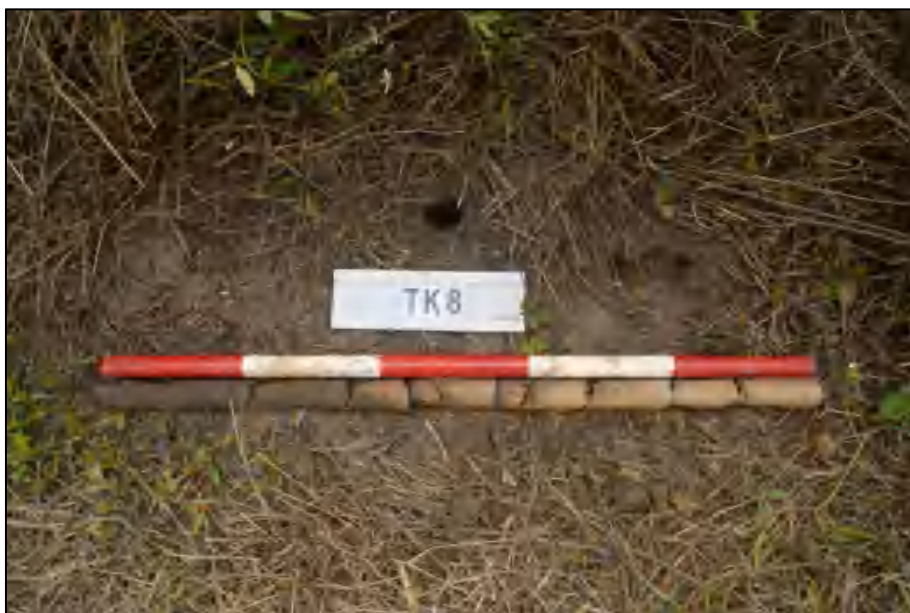
图 22 TK8 土样 (标杆长 1 米, 土样由左到右)

①层: 表土层, 距地表 0-0.4 米, 厚约 0.4 米, 灰褐色黏土, 土质较疏松, 包含大量植物根系。该层下为生土, 黄褐色黏土, 土质较致密。