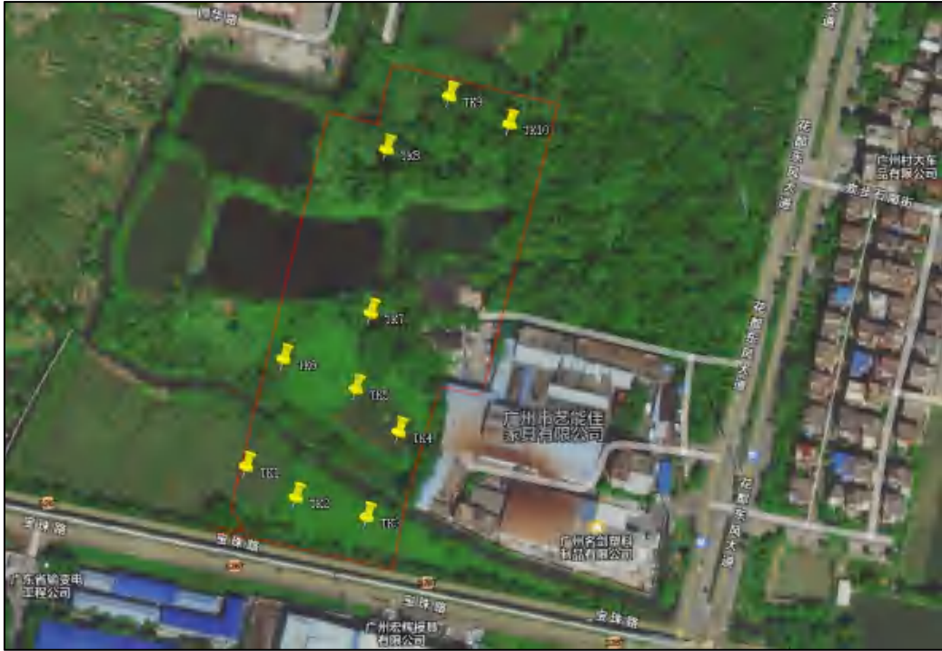
图 13 地块内试探探孔位置示意图（黄色标记点）

为了进一步掌握项目地块内的地层情况，根据实际条件，我们在地块内进行了探孔试探，编号为 TK1-TK10, 其具体情况如下：