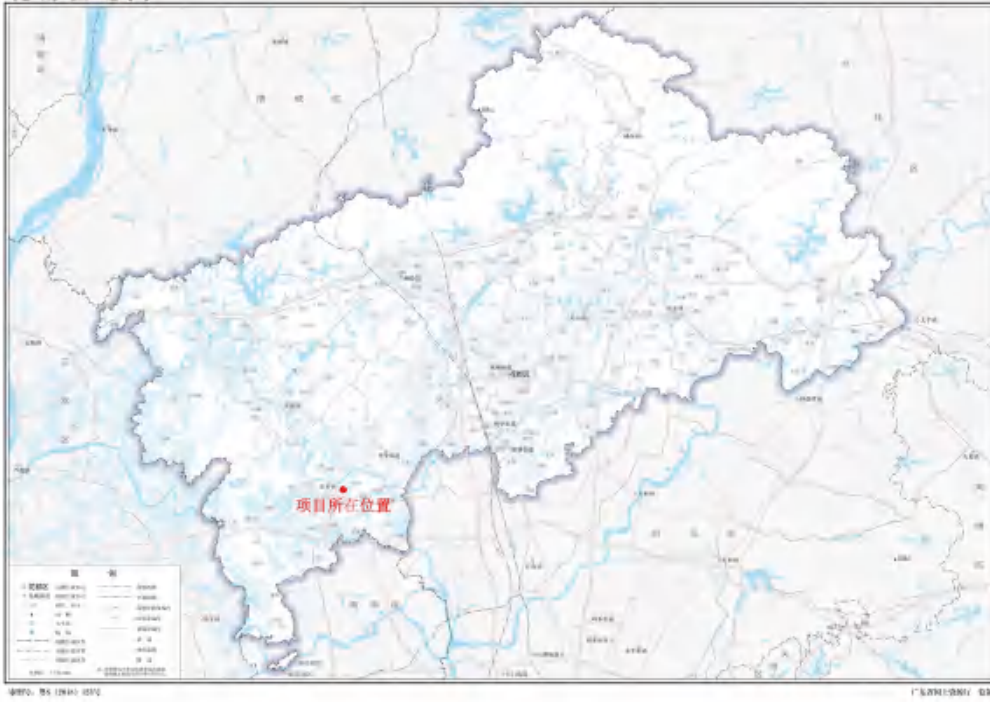
图 2 花都区炭步镇垂裕小学重建项目在花都区位置示意图（广东省自然资源厅）