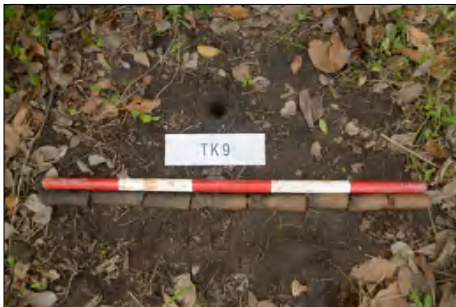
图 23 TK9 土样 (标杆长 1 米, 土样由左到右)

①层: 表土层, 距地表 0-0.6 米, 厚约 0.6 米, 灰褐色黏土, 土质较疏松, 包含少量植物根系。该层下为生土, 黄褐色黏土, 土质较致密。