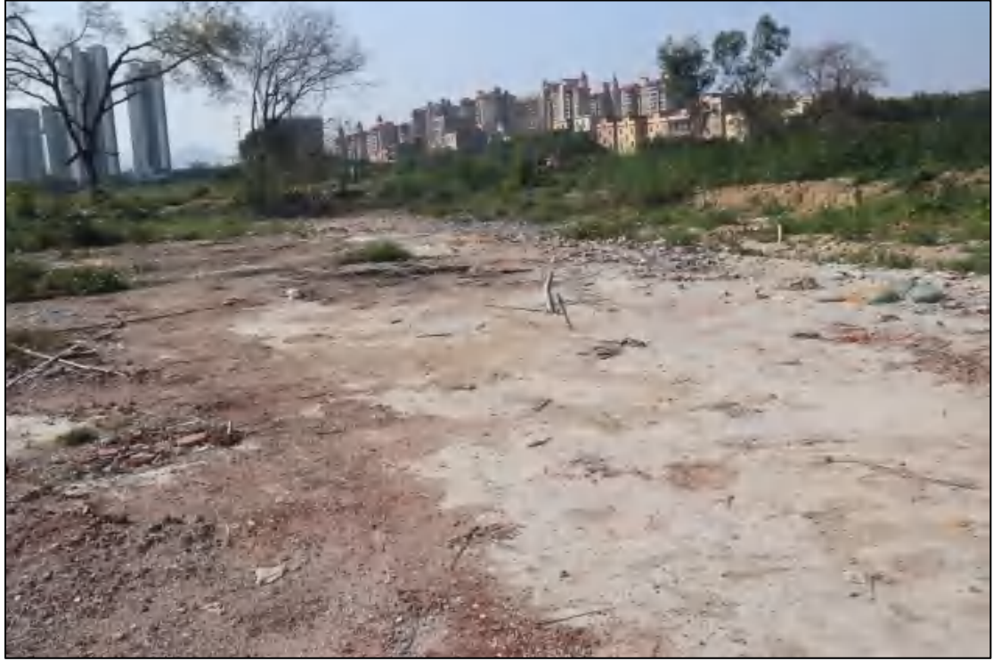
图 11 地块北部现状（南-北）