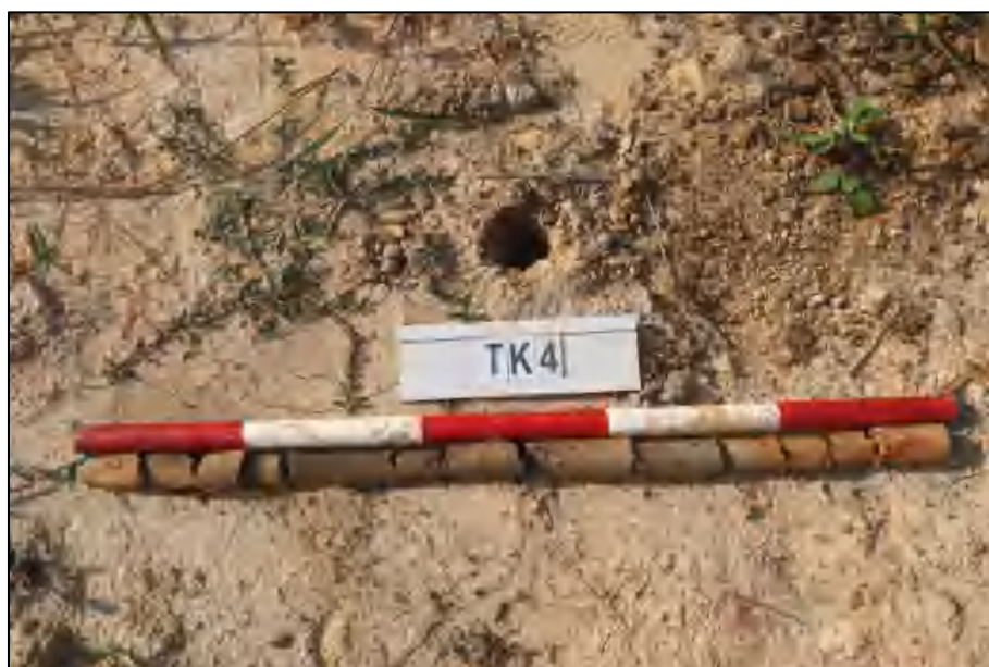
图 18 TK4 土样 (标杆长 1 米, 土样由左到右)

①层: 表土层, 距地表 0-0.7 米, 厚约 0.7 米, 灰褐色黏土, 土质较疏松, 含少量植物根系。该层下为生土, 黄褐色黏土, 土质较致密。