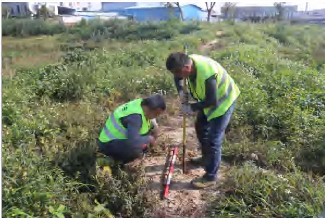
图 14 现场试探（北-南）