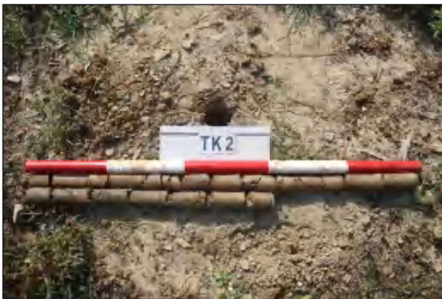
图 16 TK2 土样 (标杆长 1 米, 土样由左上到右下)

①层: 表土层, 距地表 0-1.0 米, 厚约 1.0 米, 灰褐色黏土, 土质较疏松, 包含植物根系。该层下为生土, 灰褐色黏土, 夹含红黄色风化石碎块。