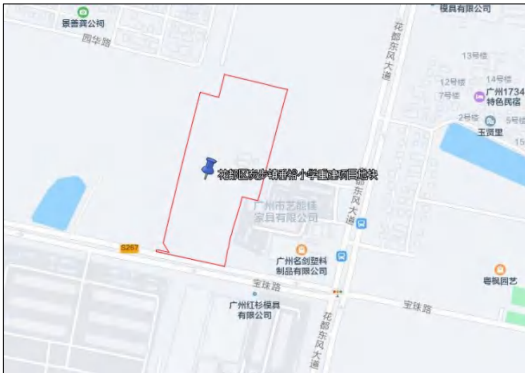
图 3 项目地块位置图