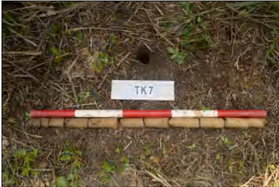
图 21 TK7 土样 (标杆长 1 米, 土样由左到右)

①层: 表土层, 距地表 0-0.3 米, 厚约 0.3 米, 灰褐色黏土, 土质较疏松, 包含少量植物根系。该层下为生土, 黄褐色黏土, 土质较致密。