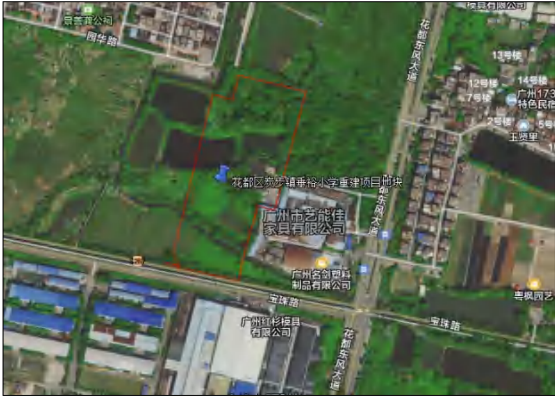
图 4 项目地块卫星影像图（腾讯地图）