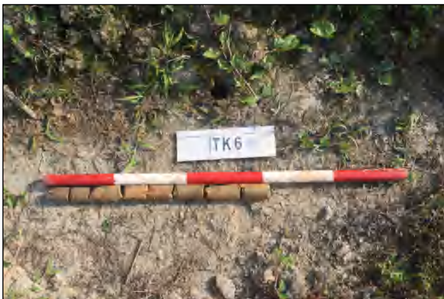
图 20 TK6 土样 (标杆长 1 米, 土样由左到右)

①层: 表土层, 距地表 0-0.1 米, 厚约 0.1 米, 灰褐色黏土, 土质较疏松, 包含大量植物根系。该层下为生土, 黄褐色黏土, 土质较致密。