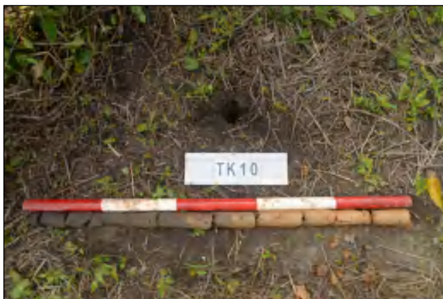
图 24 TK10 土样 (标杆长 1 米, 土样由左到右)

①层: 表土层, 距地表 0-0.5 米, 厚约 0.5 米, 灰褐色黏土, 土质较疏松, 包含大量植物根系。该层下为生土, 黄褐色黏土, 土质较致密。