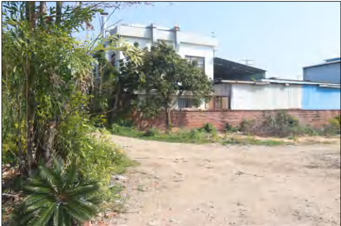
图 8 地块东部现状（西北-东南）