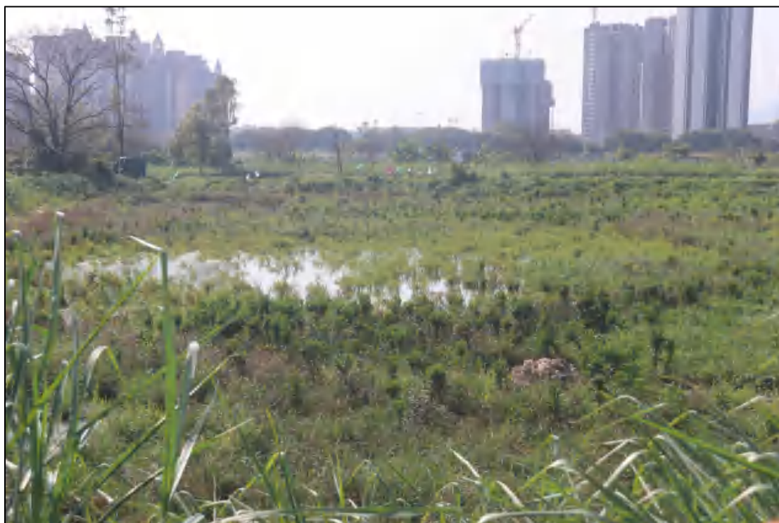
图 9 地块西部现状（东-西）