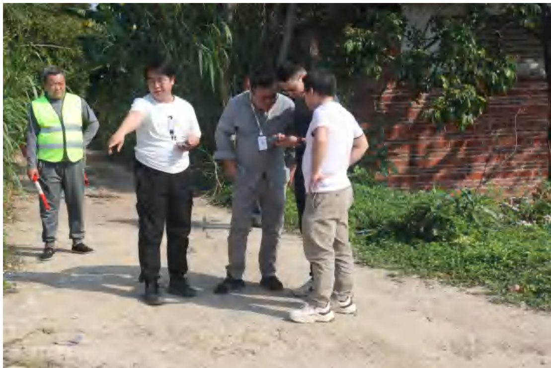
图 6 工作人员现场接洽（西北-东南）