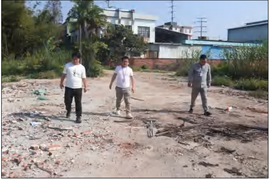
图 7 工作人员现场踏查（东-西）