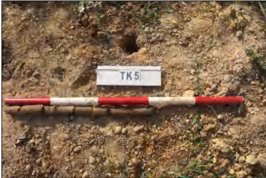
图 19 TK5 土样 (标杆长 1 米, 土样由左到右)

①层: 表土层, 距地表 0-0.4 米, 厚约 0.4 米, 灰褐色黏土, 土质较疏松, 包含少量植物根系。该层下为生土, 黄褐色黏土, 土质较致密。