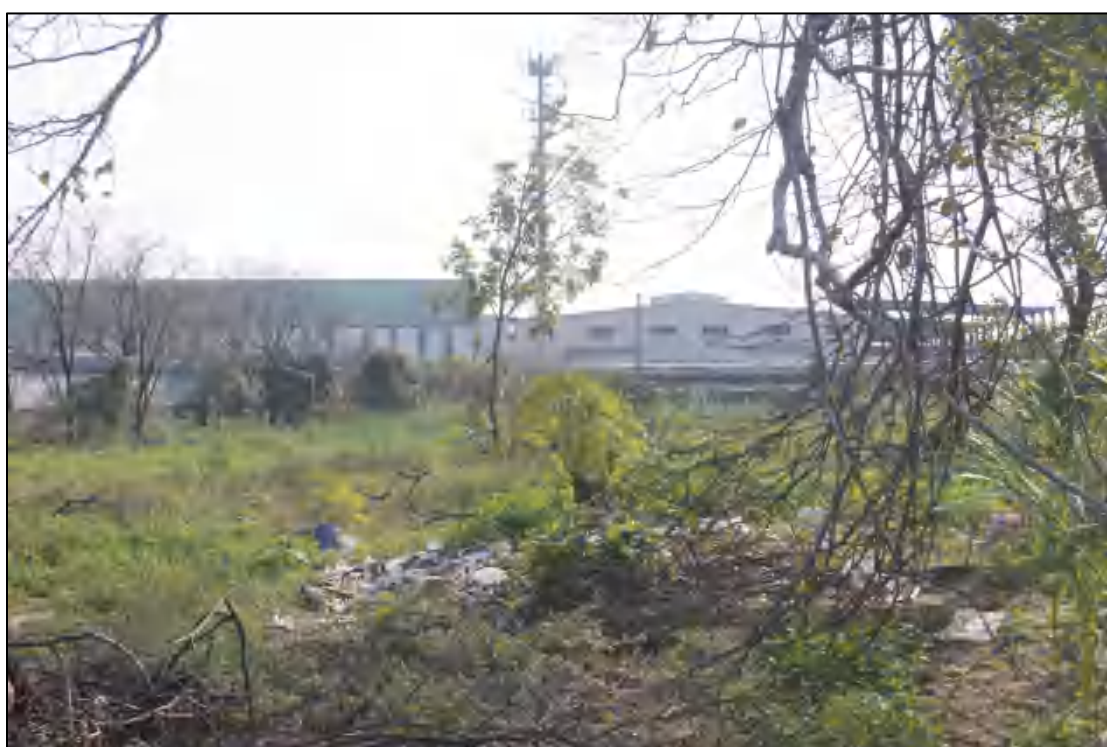
图 10 地块南部现状（北-南）