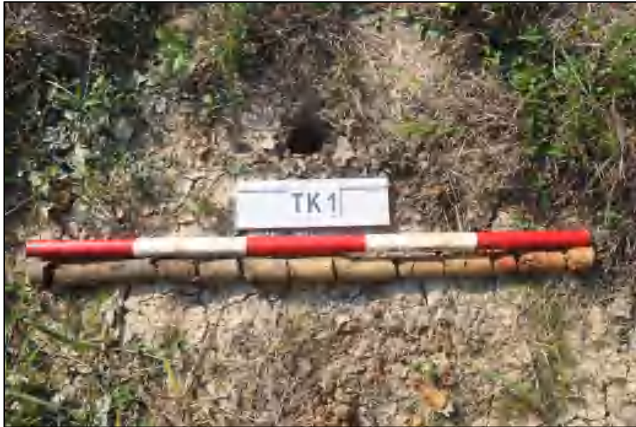
图 15 TK1 土样 (标杆长 1 米, 土样由左到右)

①层: 表土层, 距地表 0-0.3 米, 厚约 0.3 米, 灰褐色黏土, 土质较疏松, 包含植物根系。该层下为生土, 黄褐色黏土, 土质较致密。