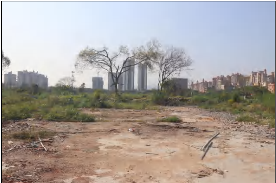
图 12 地块中部现状（东北-西南）