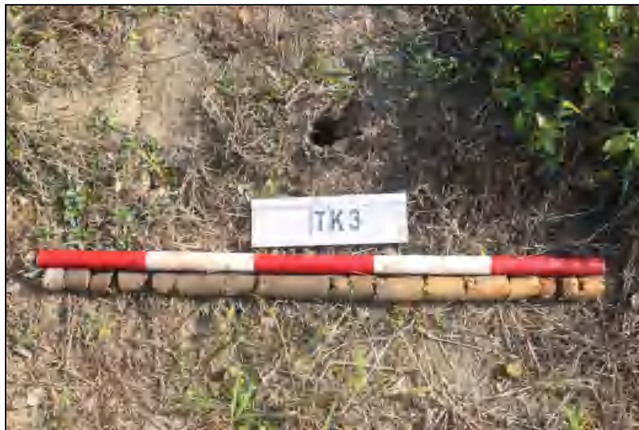
图 17 TK3 土样 (标杆长 1 米, 土样由左到右)

①层: 表土层, 距地表 0-0.5 米, 厚约 0.5 米, 灰褐色黏土, 土质较疏松, 包含大量植物根系。该层下为生土, 黄褐色黏土, 土质较致密。