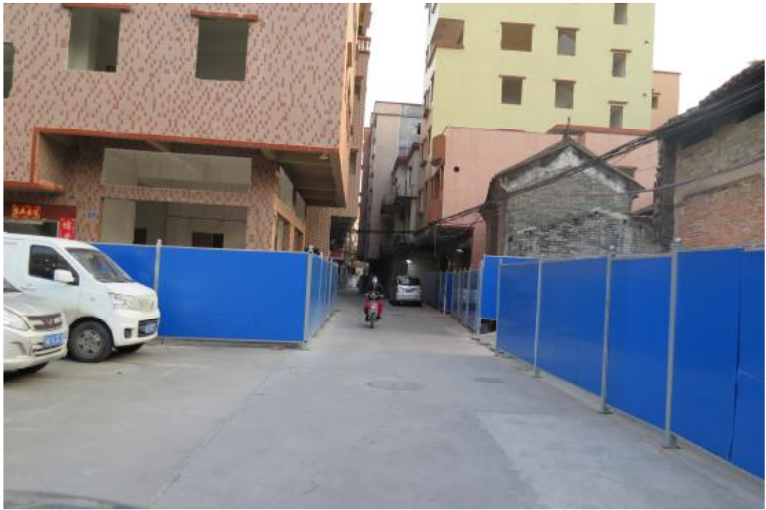
图 13 地块内南部现状（北-南）