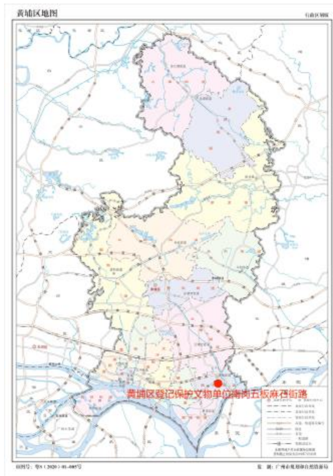
图 2 南岗五板麻石街路在黄埔区的位置示意图（广州市规划和自然资源局）