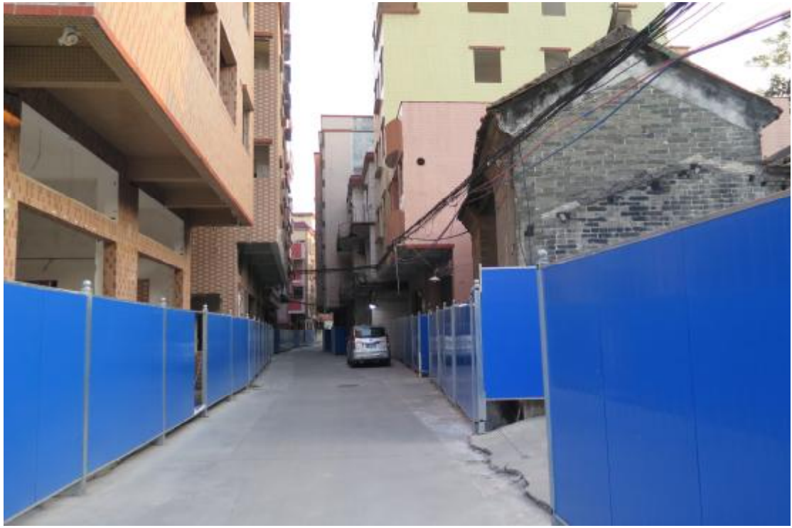
图 7 道路两侧房屋围蔽现状