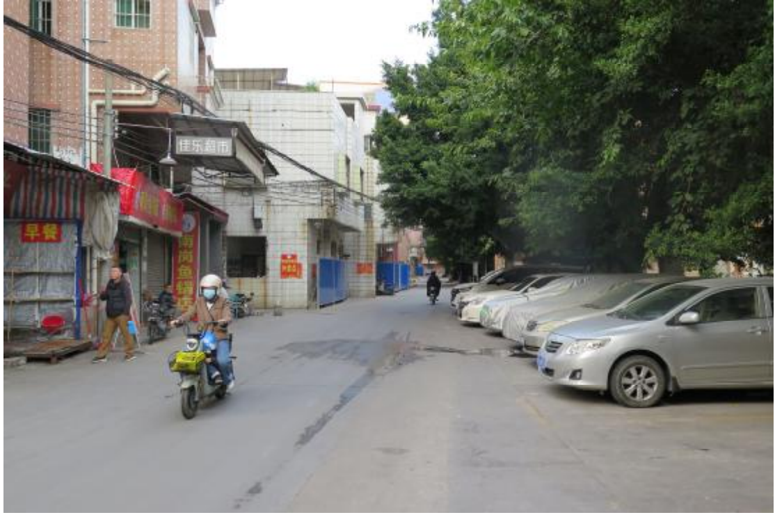
图 11 地块内北部现状（南-北）