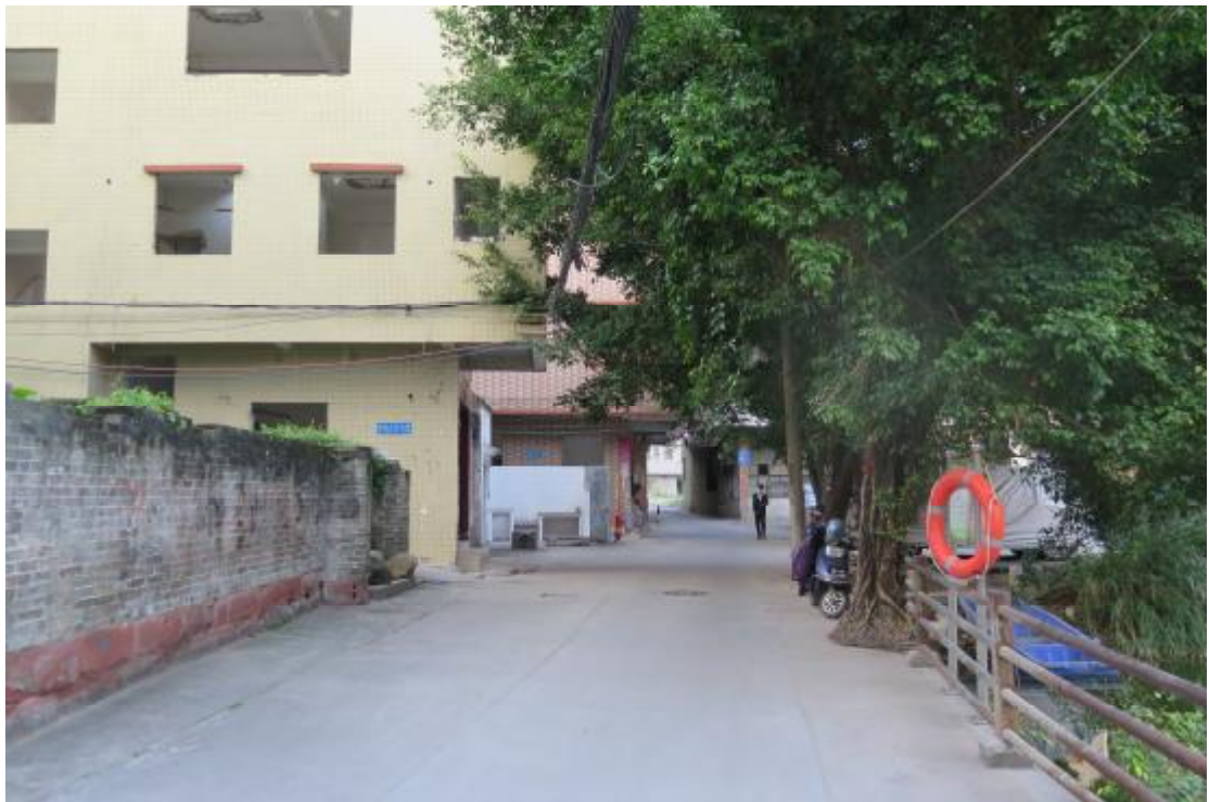
图 10 地块内北部现状（南-北）