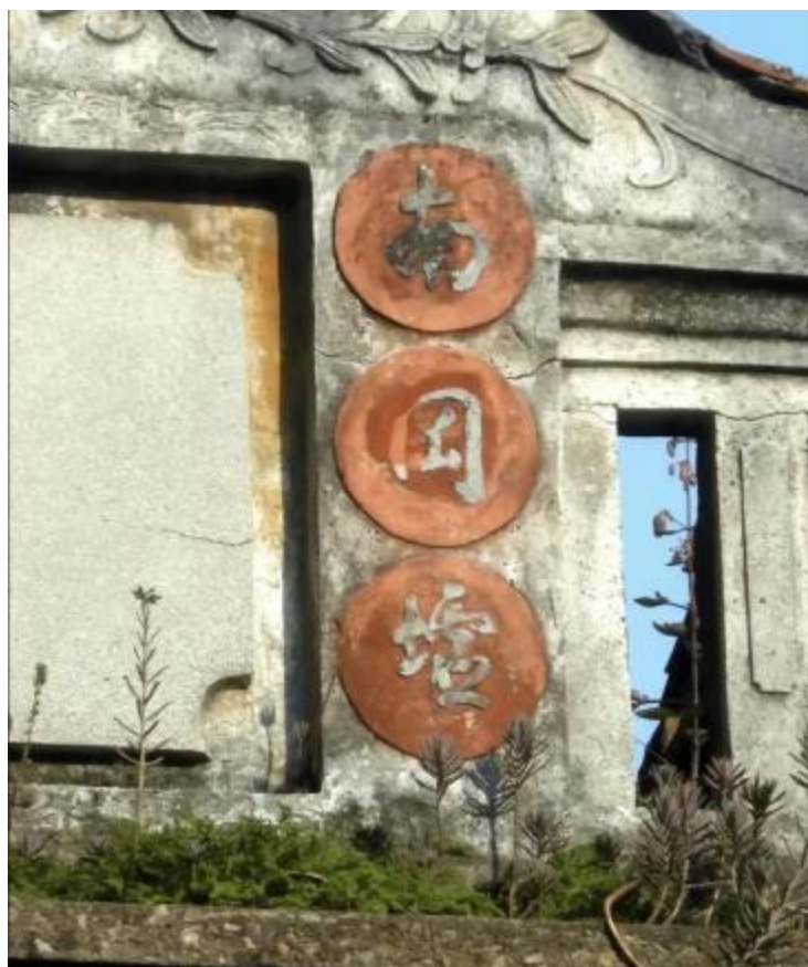
图 5 南岗圩