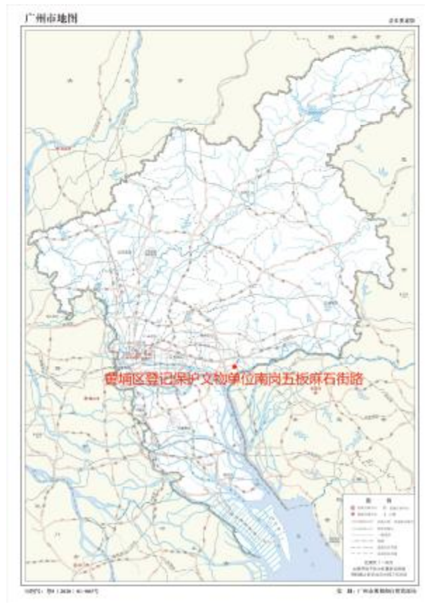
图 1 南岗五板麻石街路在广州市的位置示意图（广州市规划和自然资源局）

根据《中华人民共和国文物保护法》《广州市文物保护规定》，按照《广州市文物局关于黄埔区登记保护文物保护单位南岗五板麻石街路开展考古调查勘探工作的复函》（文物 2022625 号）指导意见，受广州市黄埔区南岗街南岗股份经济联合社委托，由我院负责黄埔区登记保护文物保护单位南岗五板麻石街路的考古调查工作。