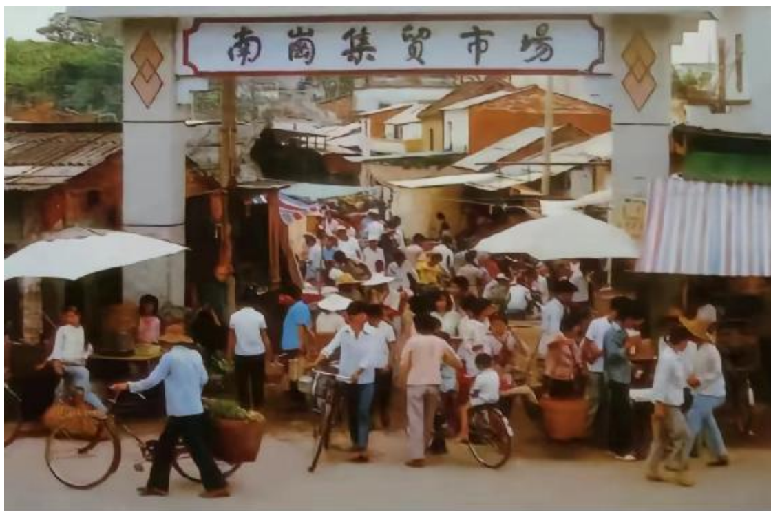
图 4 南岗集贸市场