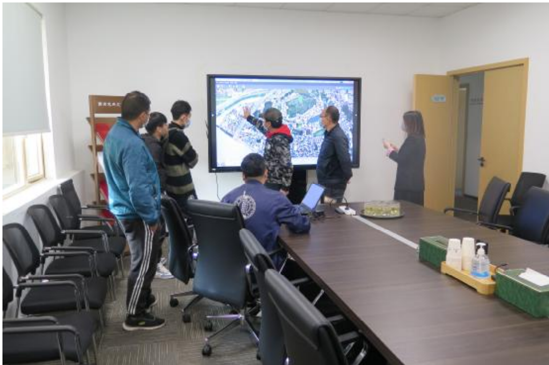
图 6 工作人员确认地块范围（南-北）

经调查，该不可移动文物位于广州市黄埔区南岗街道南岗社区南岗墟集成正街38号至南岗南园正街54号。总面积为4200平方米。该地块现为水泥路面，尚未破除；道路两侧为现代居民楼，已进行围蔽。通过访问村民得知，该不可移动文物在二十世纪九十年代之后陆续被改造成水泥路，原路面麻石板或迁移或掩埋。因年代久远及施工工程资料缺失，已不能确定该不可移动文物的保存情况。