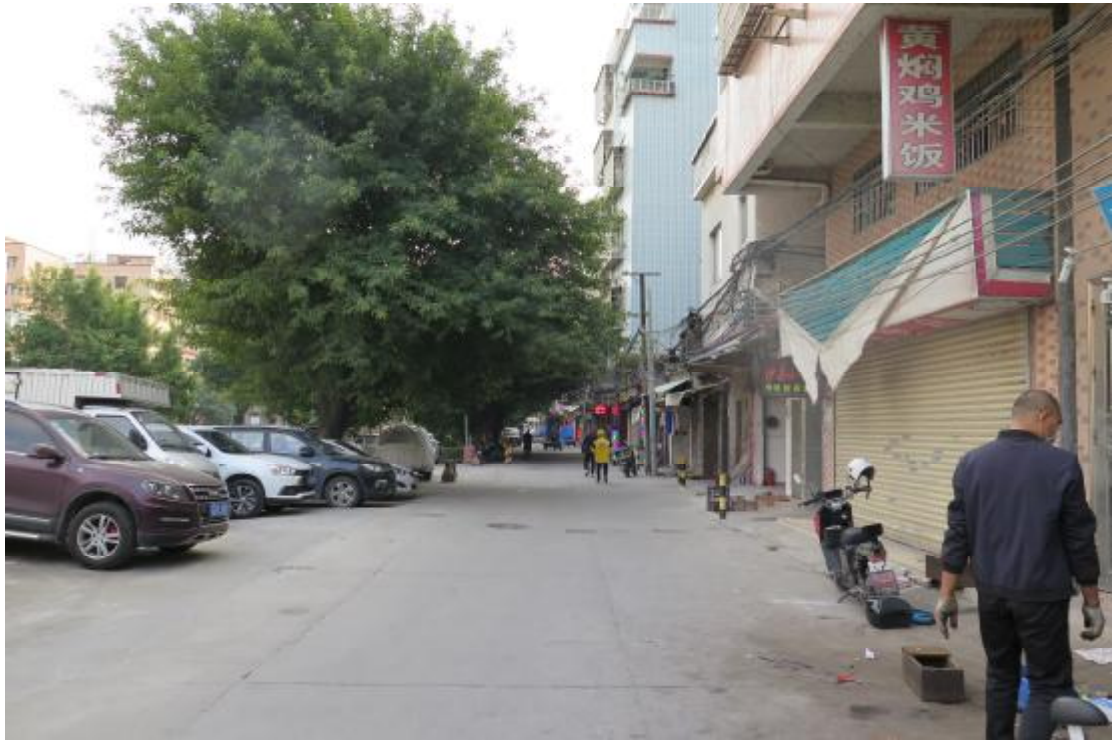
图 8 地块内北部现状（北-南）