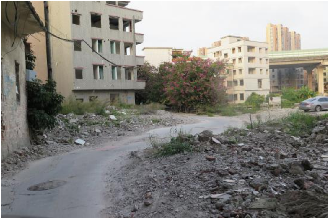
图 9 地块内北部现状（南-北）