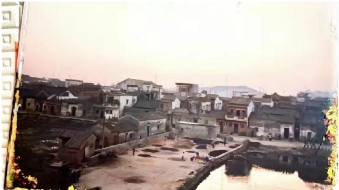
图 14 南岗五板麻石街路改造前状况