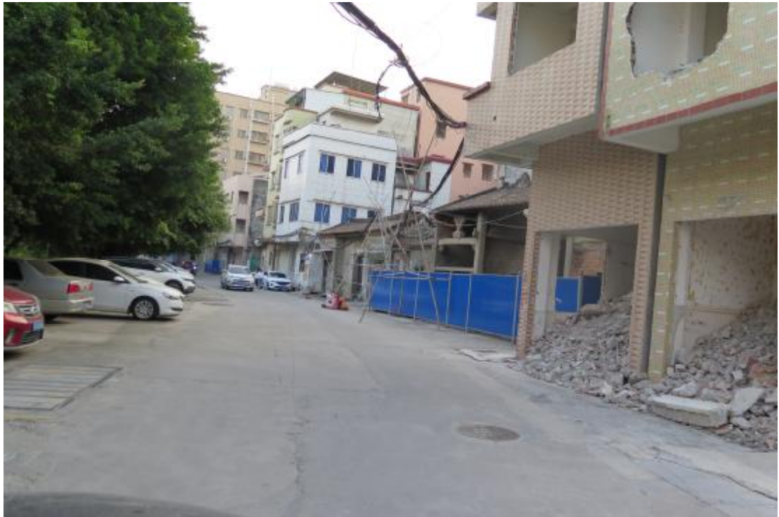
图 12 地块内中部现状（北-南）