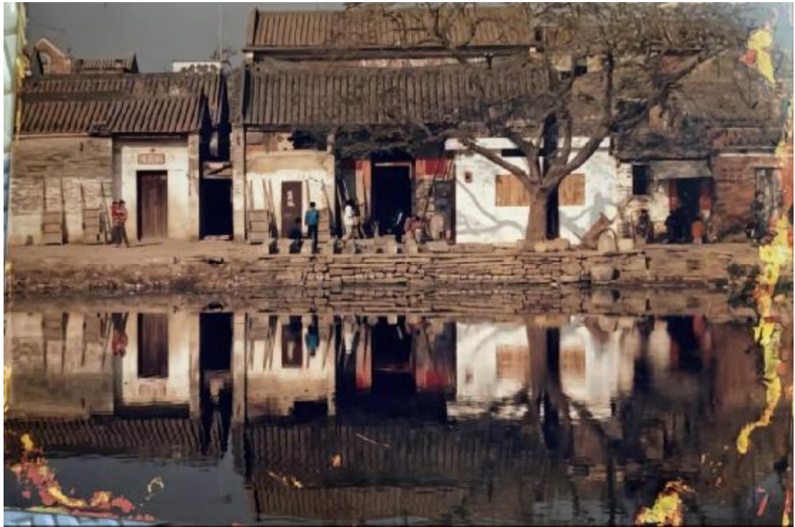
图 16 南岗五板麻石街路改造前状况