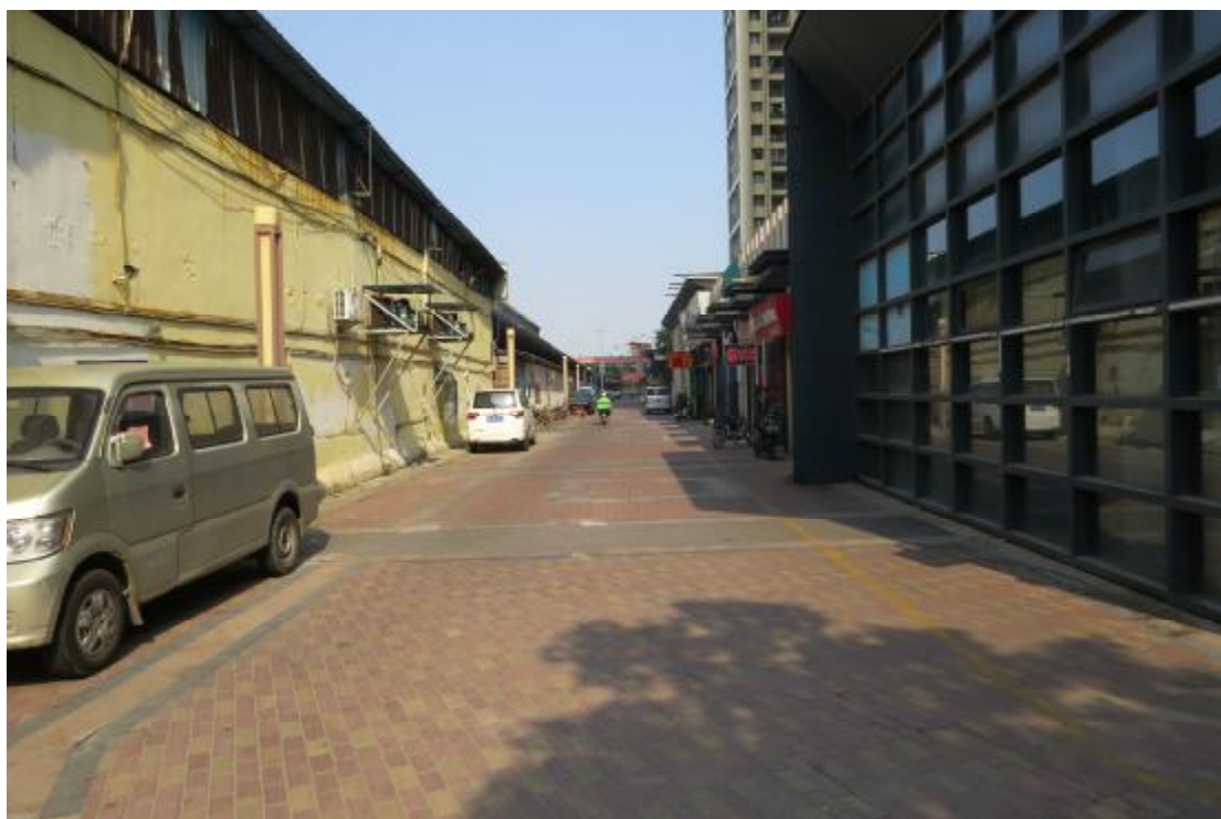
图 11 地块内西部现状（东-西）