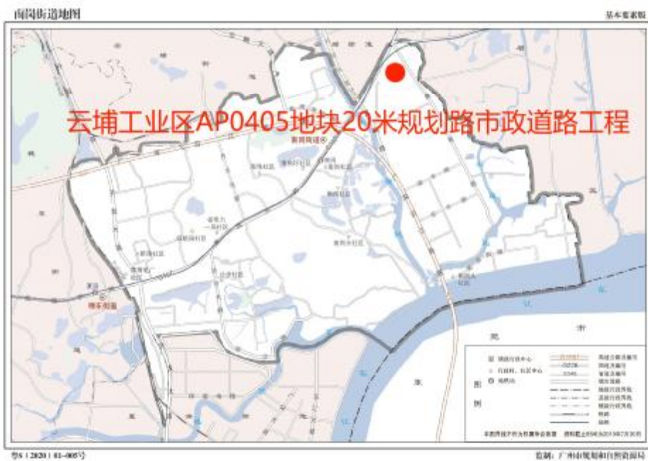
图 3 项目工程在南岗街道位置示意图（广州市规划和自然资源局）