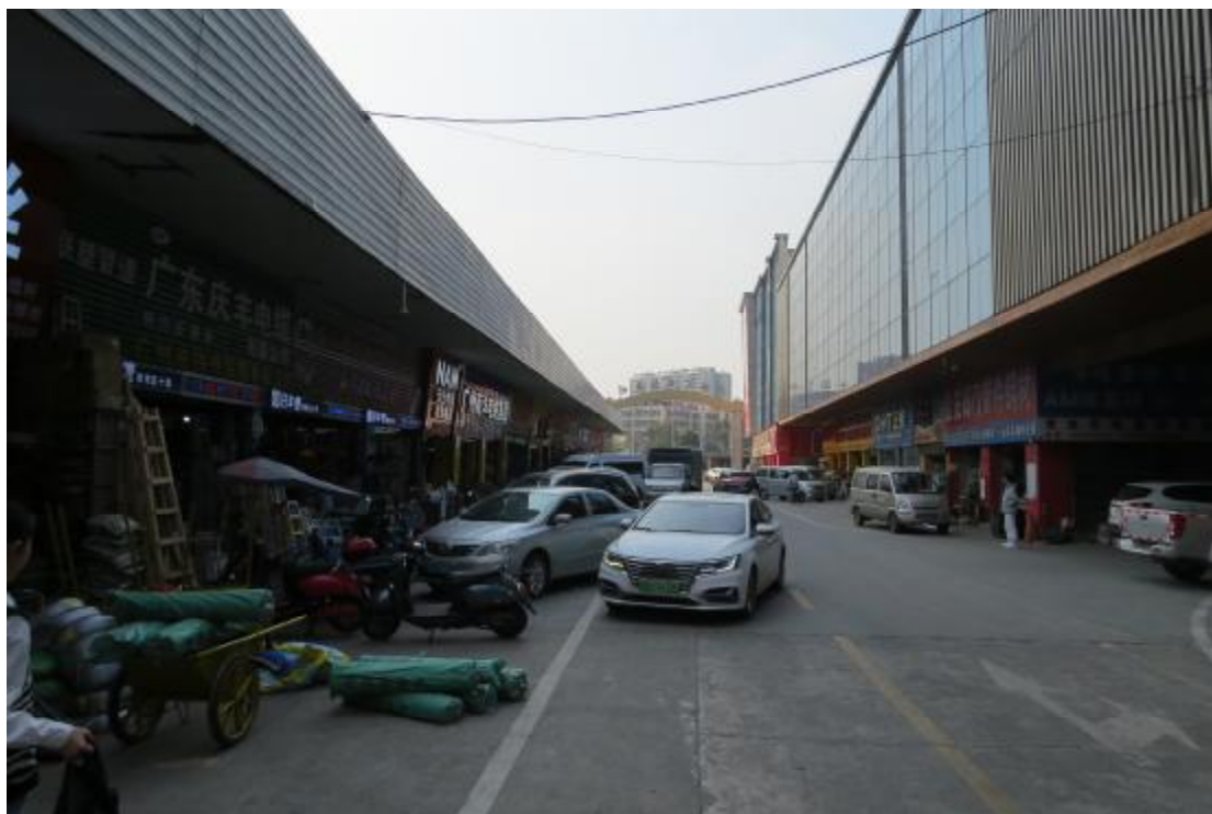
图 10 地块内西部现状（西-东）