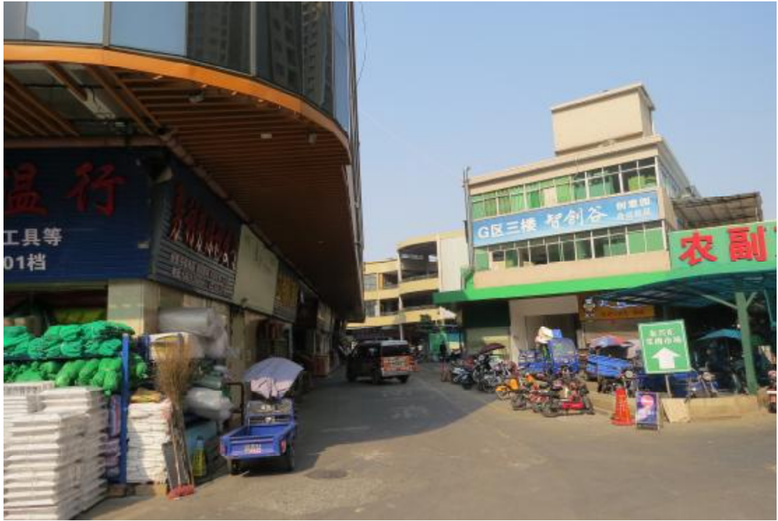
图 14 地块内东部现状（北-南）