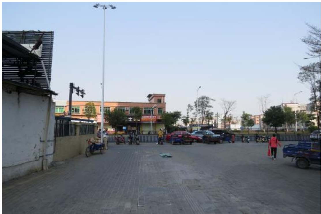
图 9 地块西部现状（东-西）