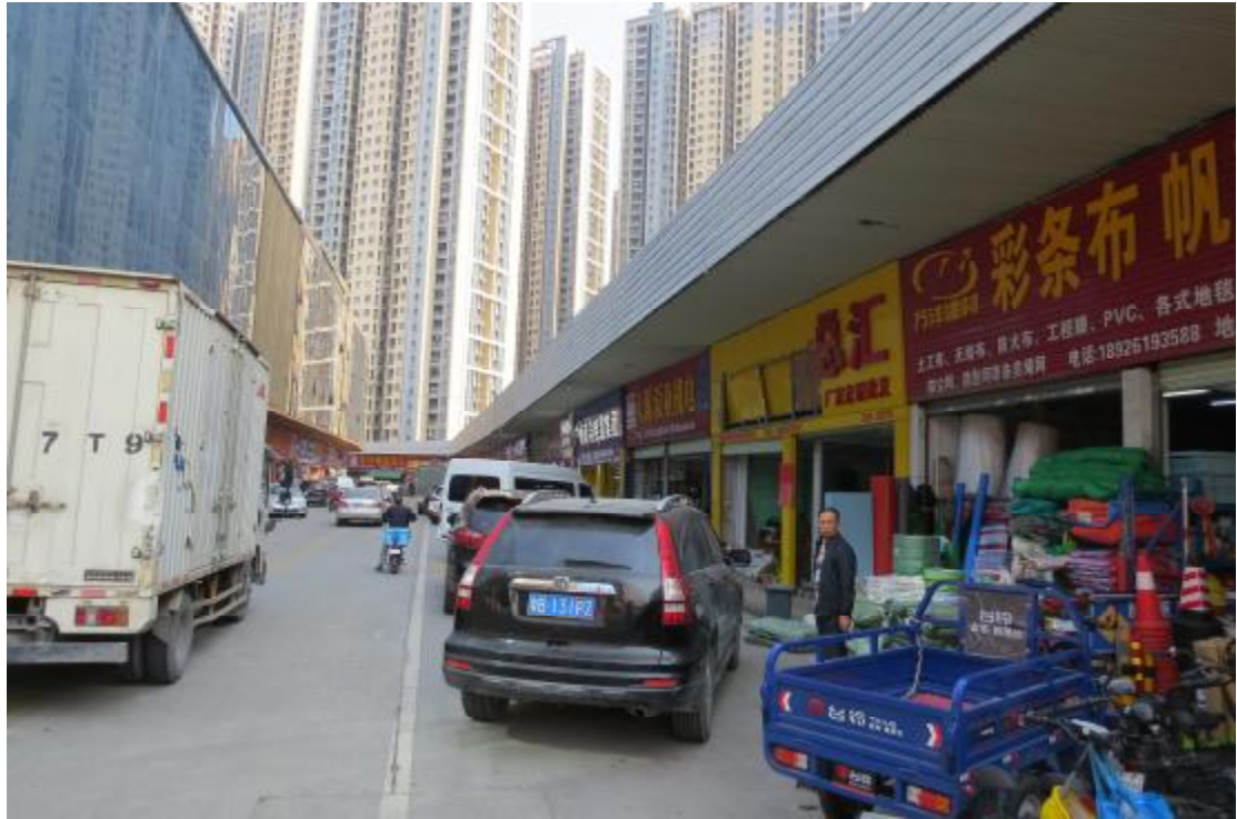
图 12 地块内东部现状（东-西）