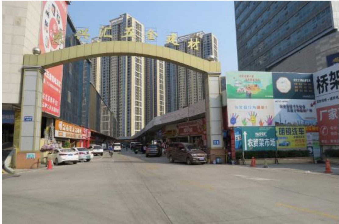
图 16 地块内东部现状（东-西）