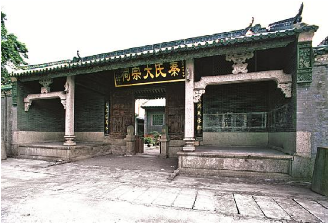
图 6 秦氏大宗祠

2020年6月至2021年3月广州市文物考古研对黄埔区南岗街道南岗社区(南片)改造项目进行过考古调查，未发现古代文化遗存。