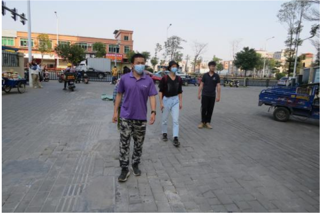
图 8 对地块地表进行现场踏查（东-西）