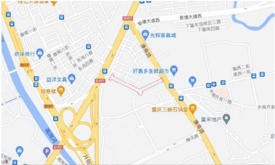
图 4 项目工程块周边环境示意图（奥维地图）