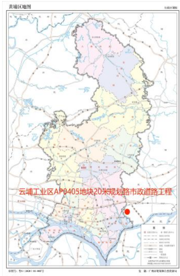
图 2 项目工程在黄埔区位置示意图（广州市规划和自然资源局）