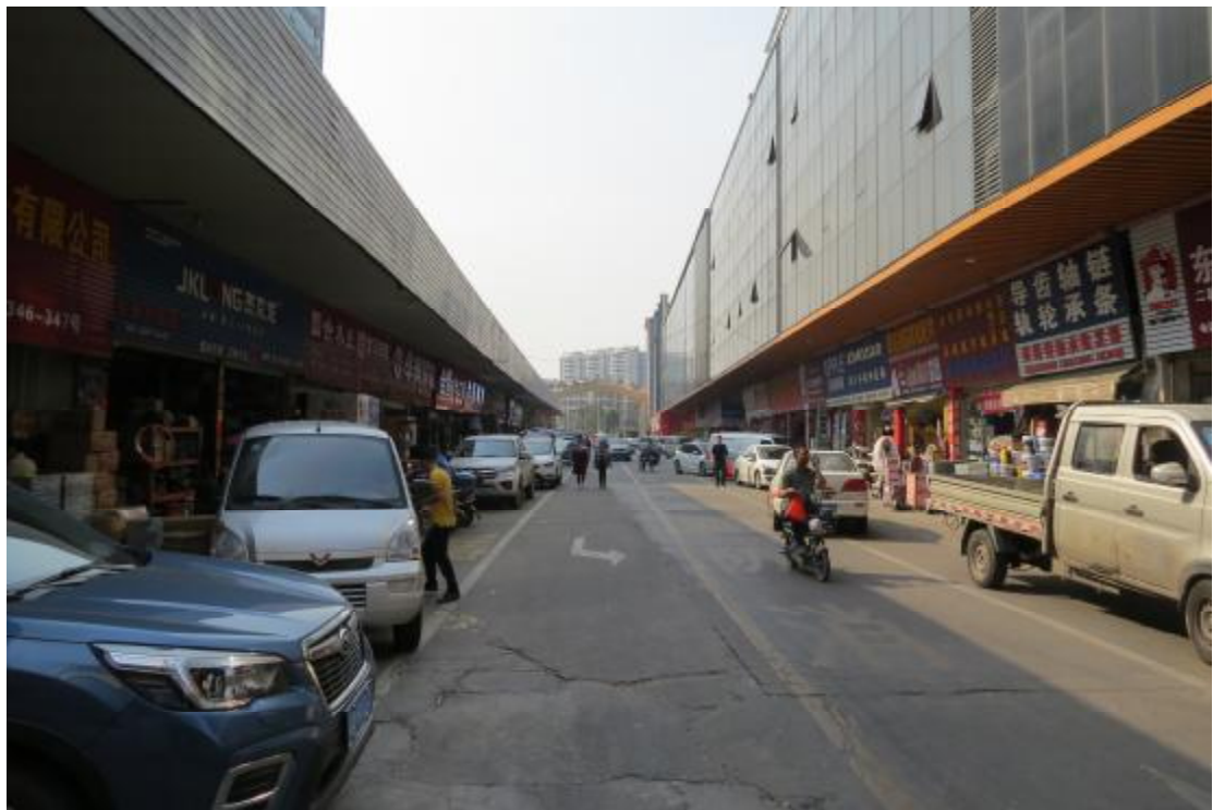
图 15 地块内东部现状（西-东）