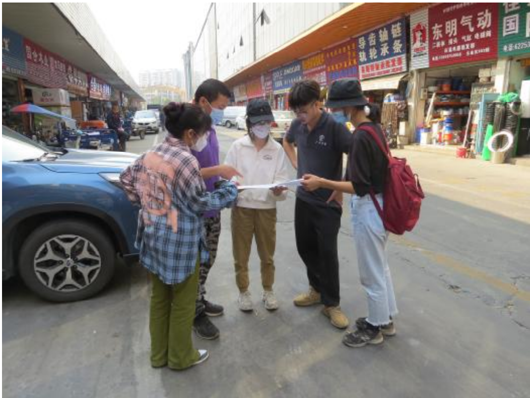
图 7 工作人员确认地块范围（西-东）