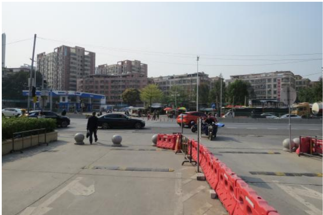
图 13 地块内东部现状（西-东）