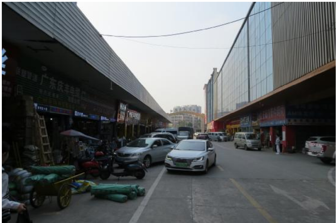
图 17 地块内东部现状（西-东）