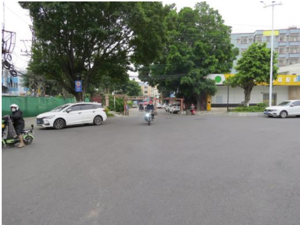
图 21 地块内南部现状（北-南）