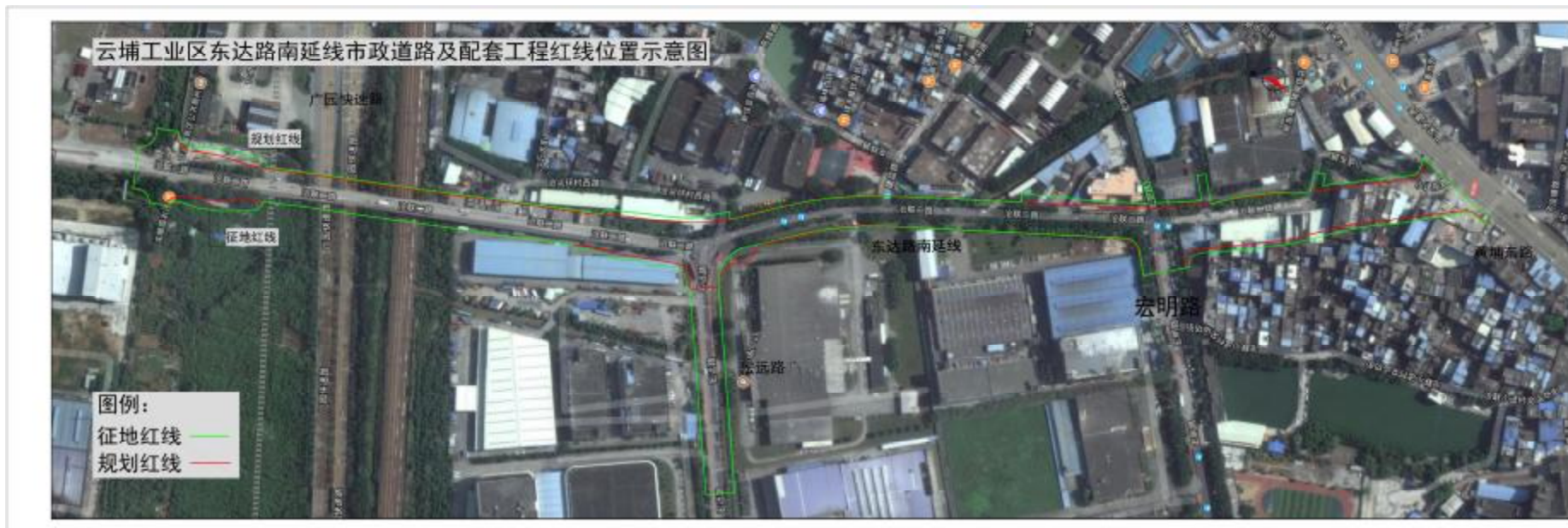
图 6 项目工程用地红线图