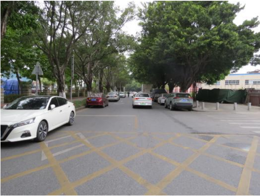
图 24 地块内南部现状（南-北）