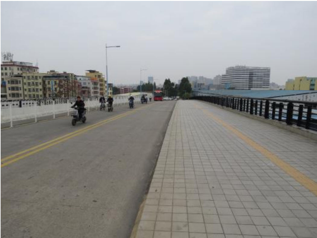
图 11 地块内北部现状（北-南）