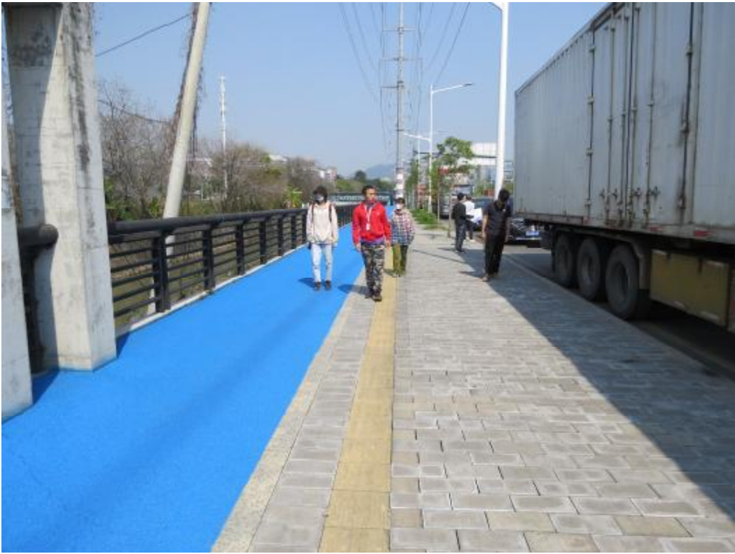
图 10 对地块地表进行现场踏查（南-北）