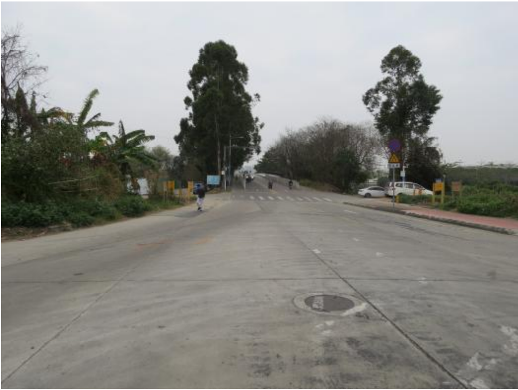
图 12 地块内北部现状（北-南）