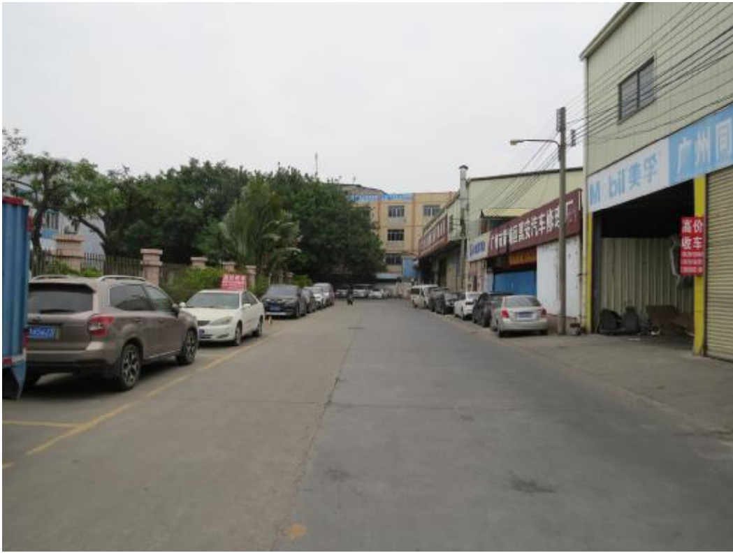
图 20 地块内南部现状（北-南）