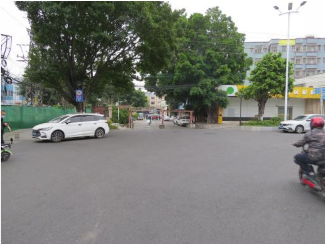
图 25 地块内南部现状（北-南）