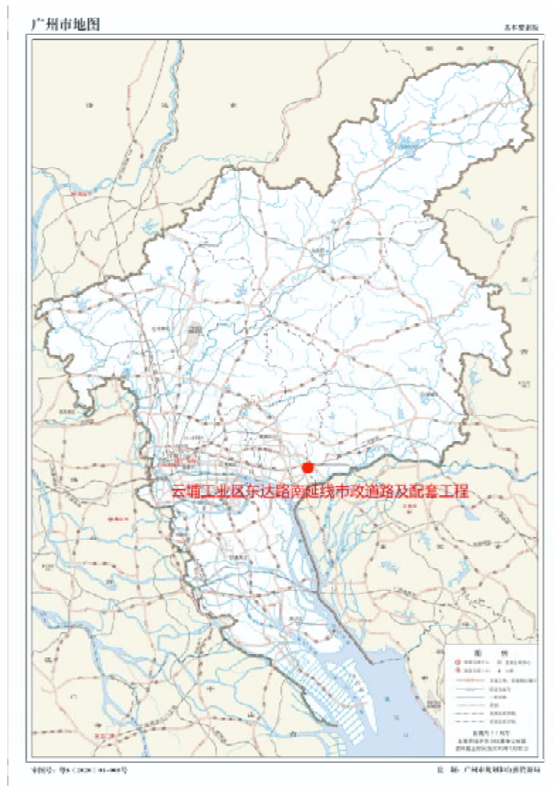
图 1 项目工程在广州市位置示意图（广州市规划和自然资源局）

按照《广州市文物局关于黄埔区云埔工业区玉云路宁埔大道等 7 个市政道路工程考古调查勘探工作的复函》（文物 2022391 号）指导意见，受广州开发区财政投资建设项目管理中心委托，由我院配合该工程建设，对该工程进行考古调查工作。