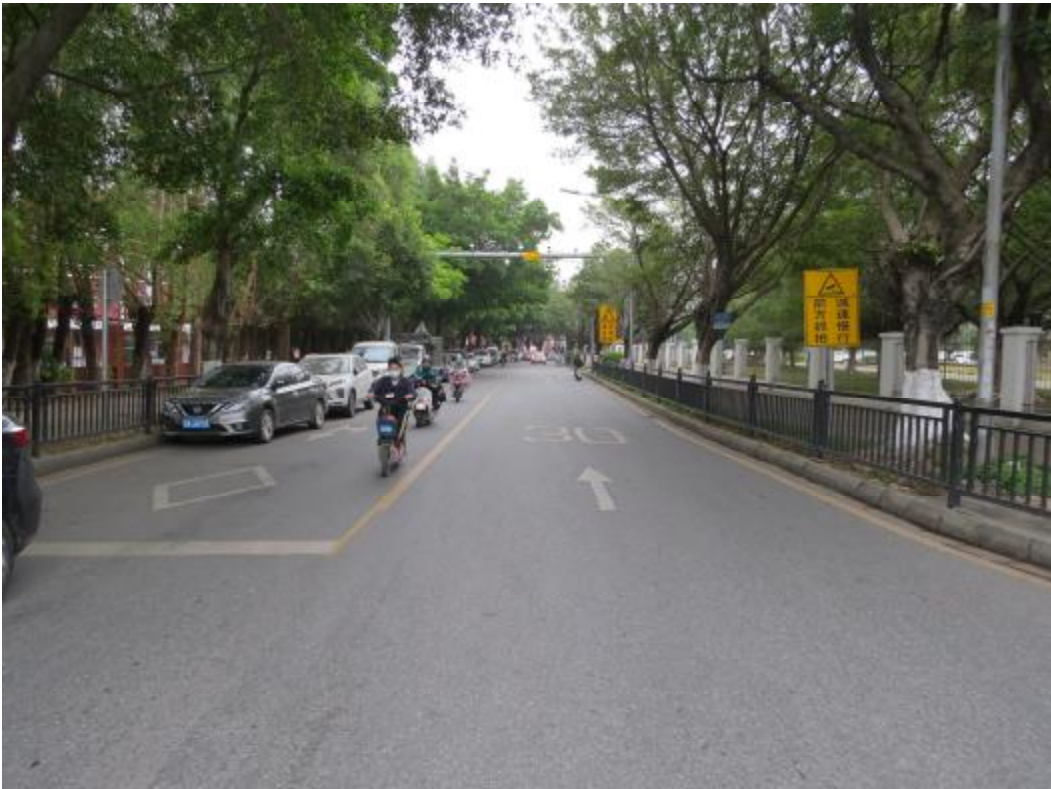
图 15 地块内中部现状（北-南）