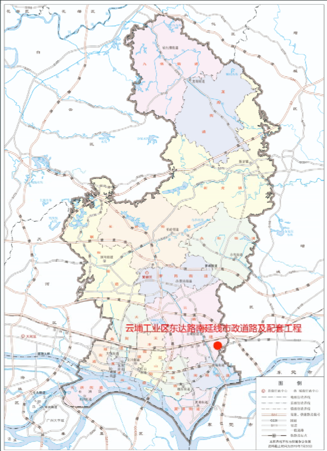
图 2 项目工程在黄埔区位置示意图（广州市规划和自然资源局）