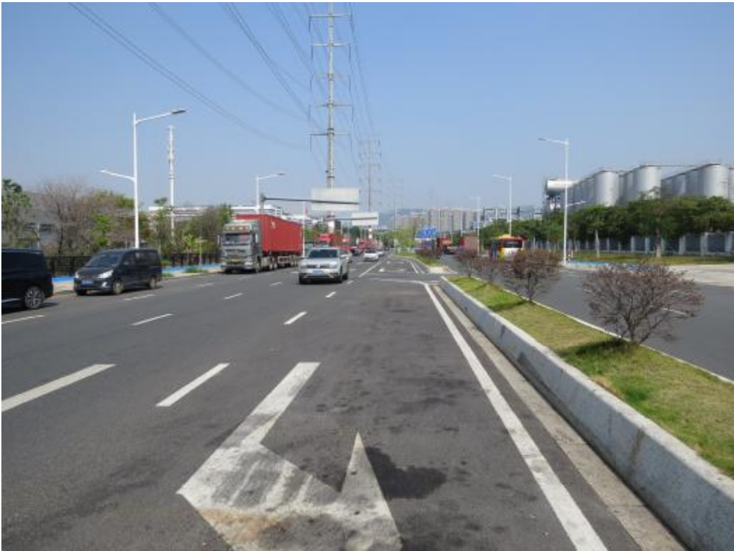
图 19 地块内中部现状（南-北）