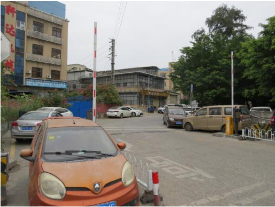
图 22 地块内南部现状（东南-西北）