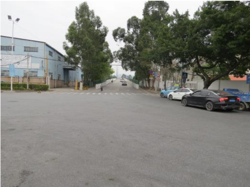
图 13 地块内北部现状（南-北）