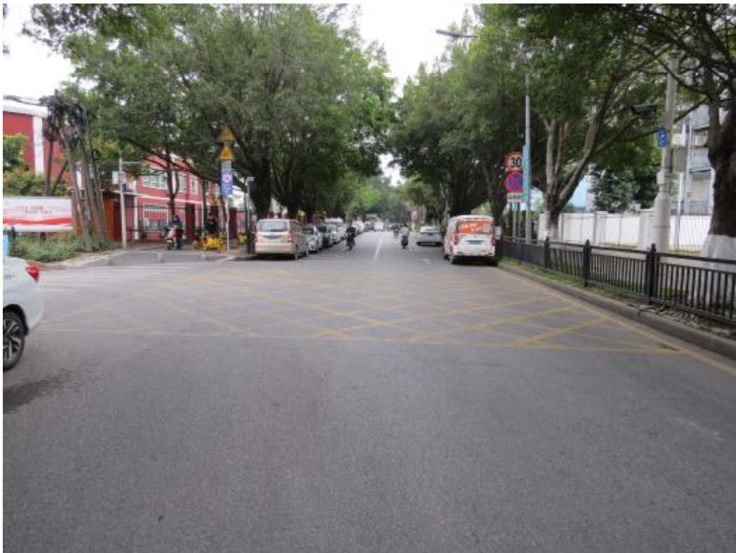
图 17 地块内中部现状（北-南）