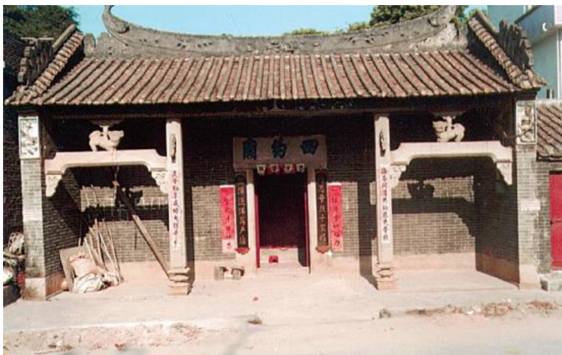
图 7 四约庙

2022年7月26日、9月24日，广州市文物考古研究院在该地块附近的广州开发区收回融盛地块开展考古调查工作，未发现古代文化遗存。