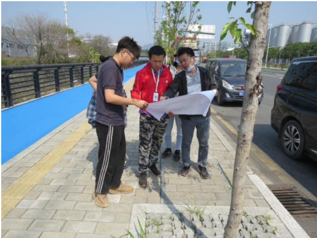
图9 与甲方确认地块范围（南-北）