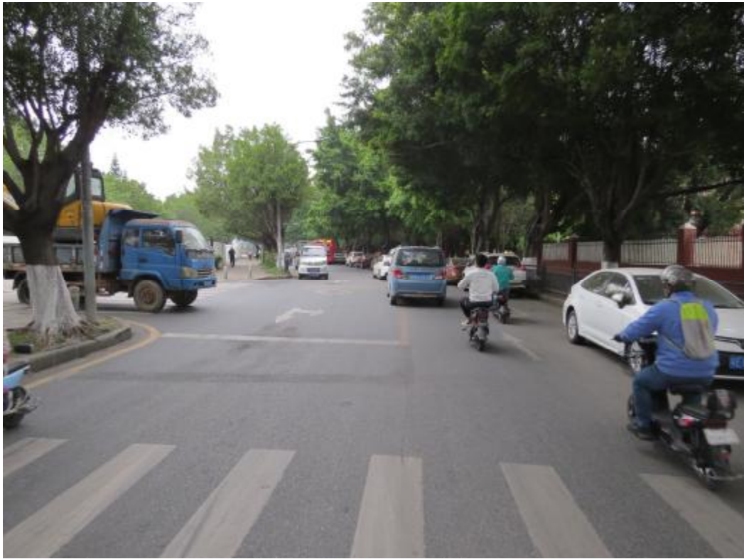
图 16 地块中部现状（南-北）