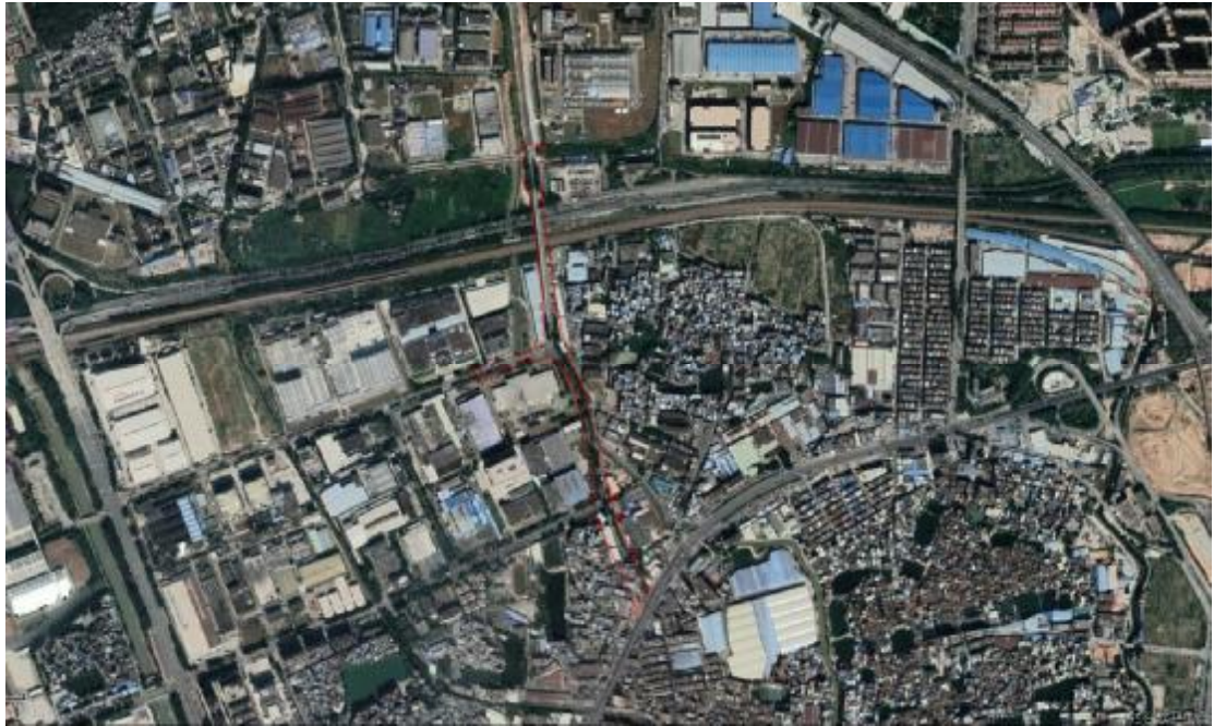
图 4 项目工程卫星红线图（奥维地图）