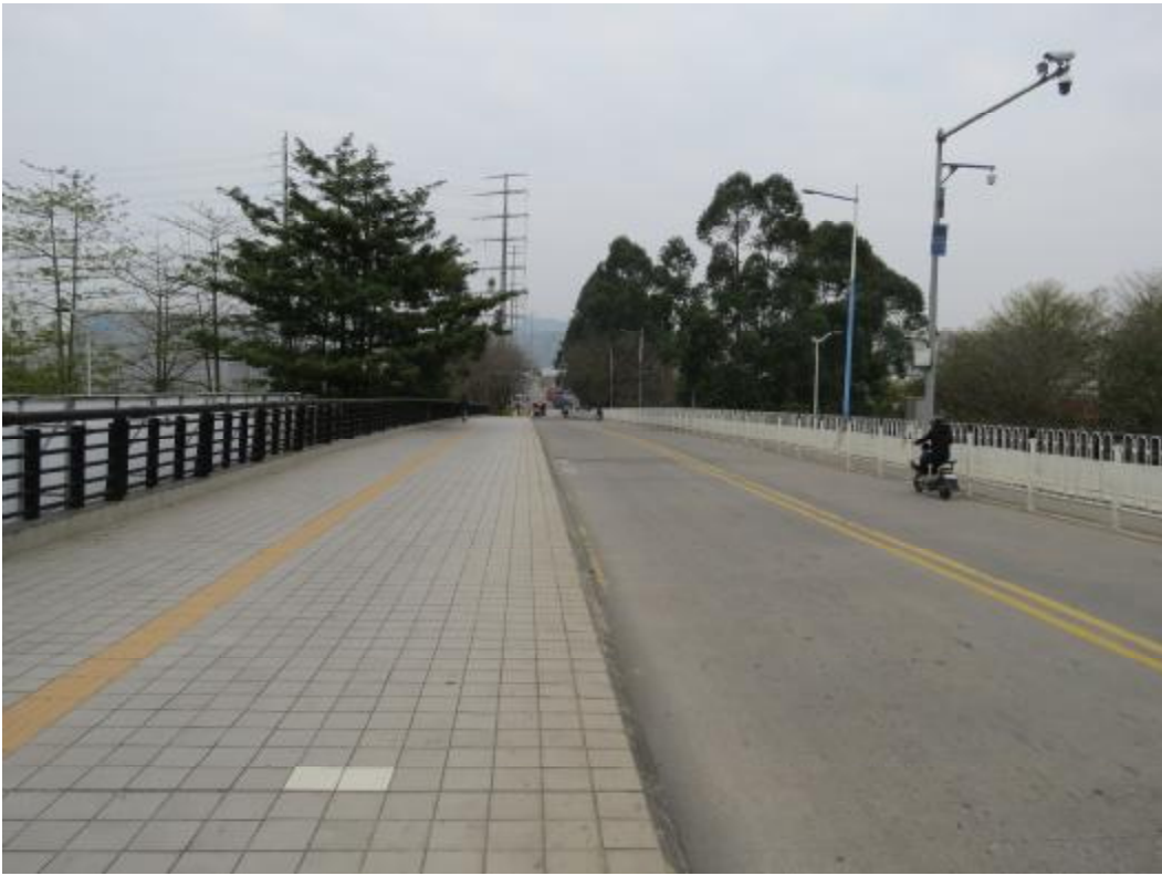
图 14 地块内北部现状（南-北）