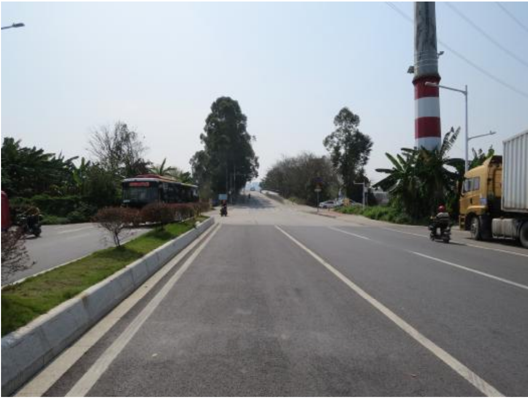
图 18 地块内中部现状（北-南）