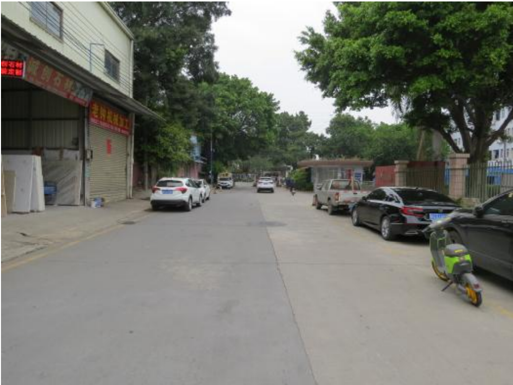
图 23 地块内南部现状（南-北）