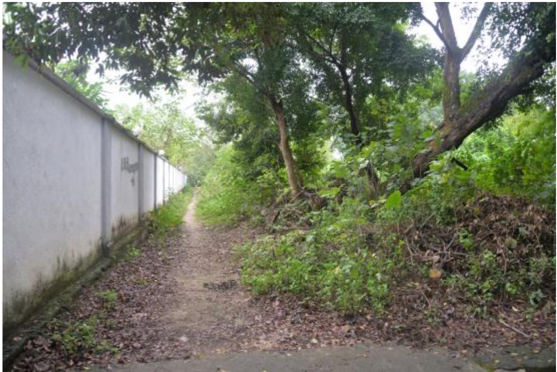
图 25 地表现状（北—南）