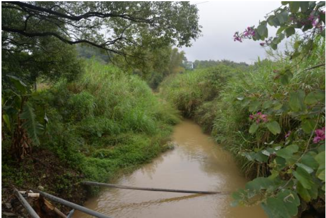
图 9 地表现状（东-西）