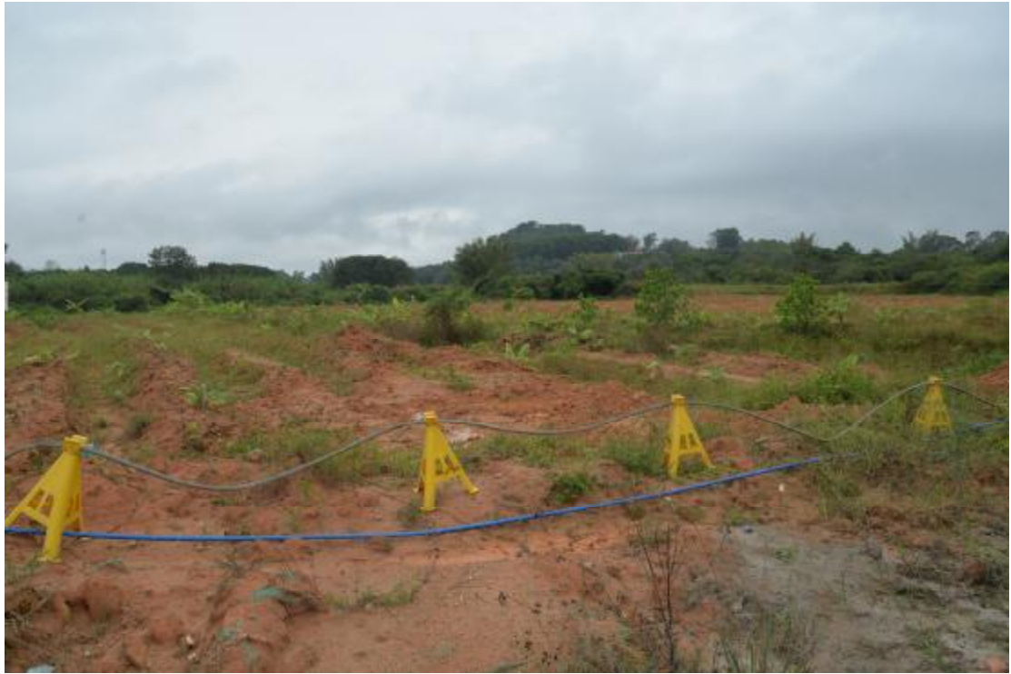
图 14 地表现状（北—南）