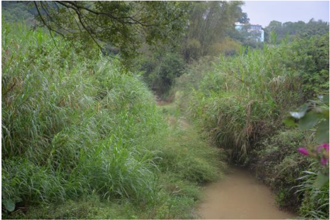
图 10 地表现状（东-西）