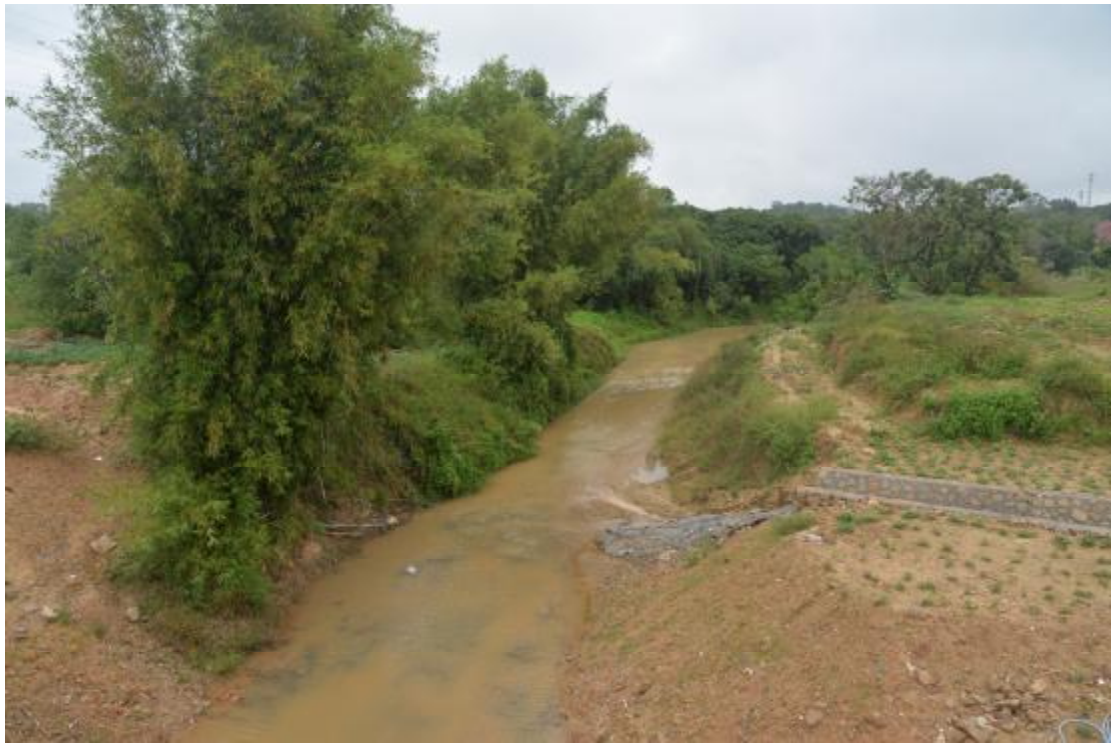
图 17 地表现状（西—东）