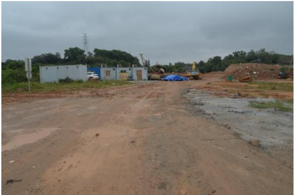
图 13 地表现状（东—西）