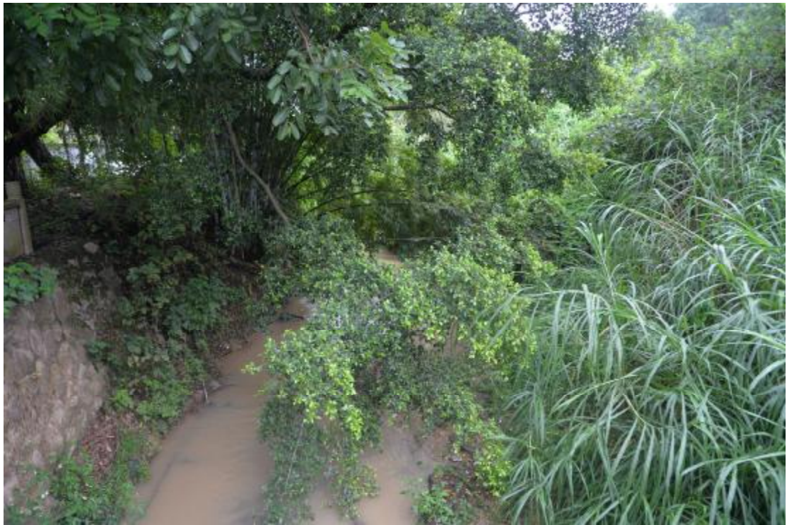
图 23 地表现状（北—南）