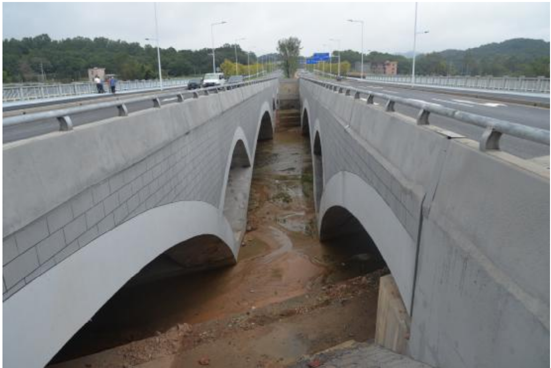
图 19 地表现状（北—南）