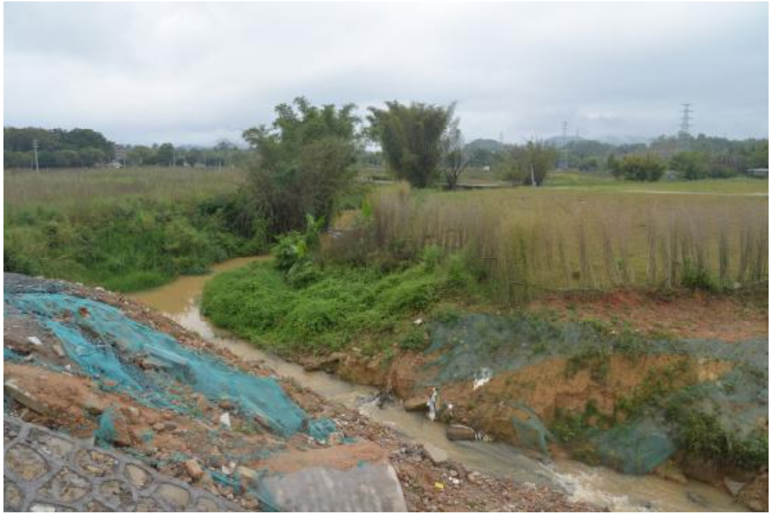
图 22 地表现状（东—西）