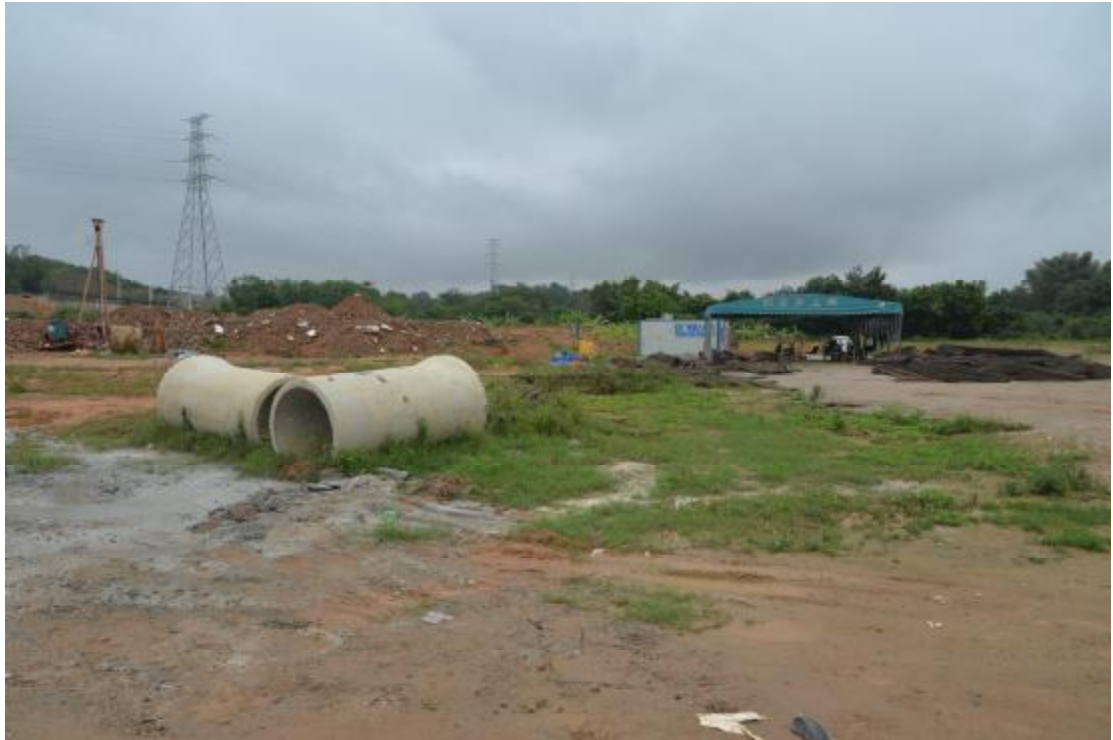
图 12 地表现状（南—北）