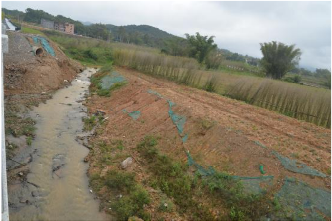
图 20 地表现状（北—南）