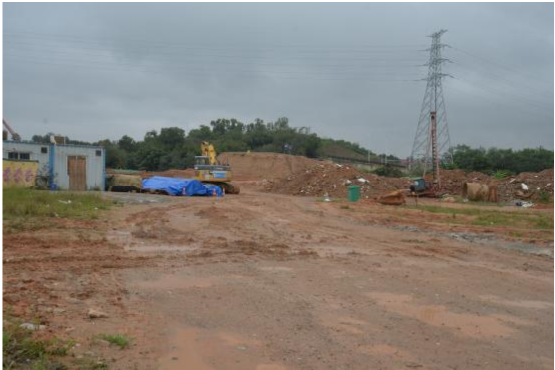
图 15 地表现状（东—西）