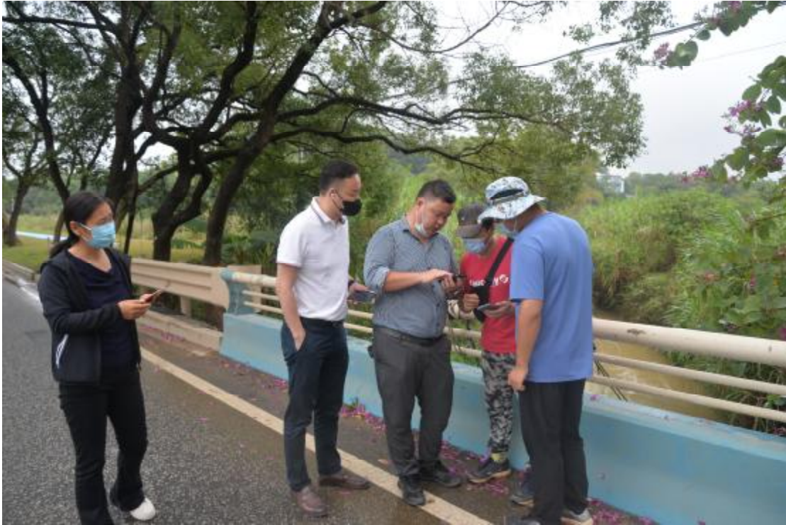
图 7 与甲方工作人员确认地块范围（北-南）