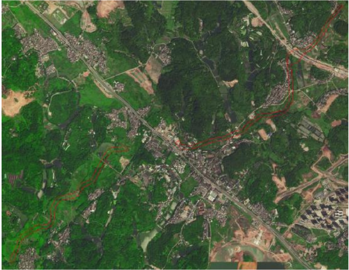
图 3 地块卫星红线示意图（高德地图）