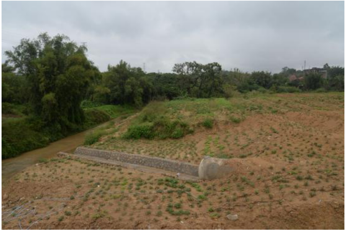
图 16 地表现状（西—东）