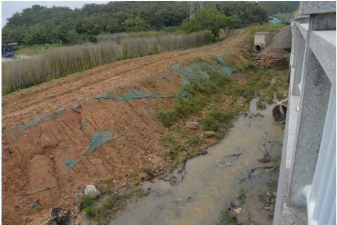
图 21 地表现状（南—北）