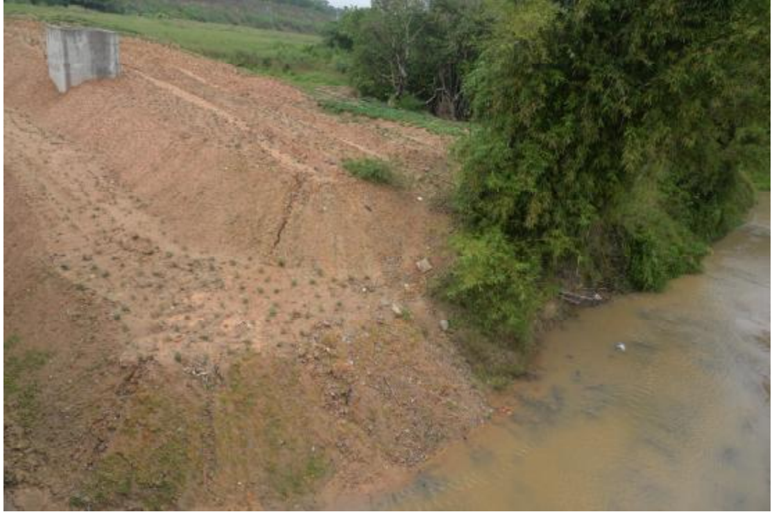
图 18 地表现状（西—东）