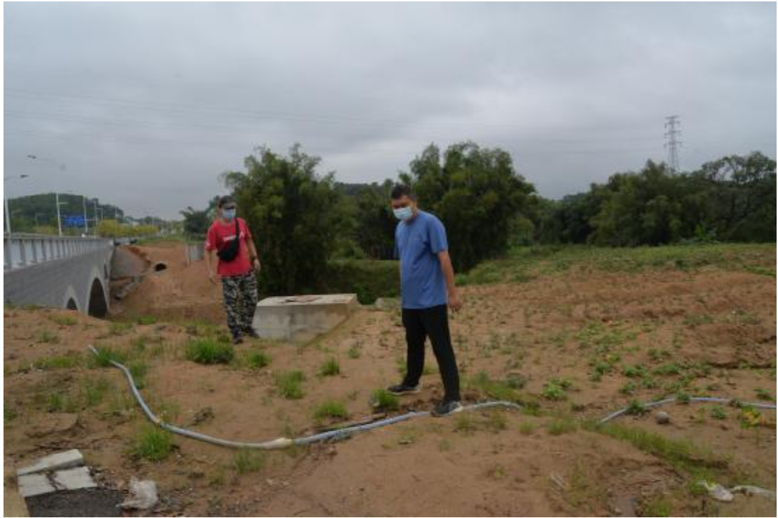
图 8 对地块地表进行踏查（南-北）