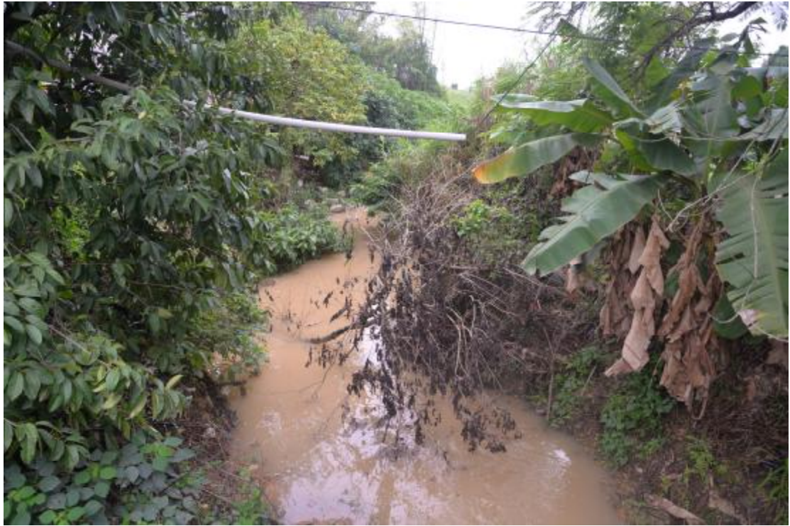
图 24 地表现状（南—北）