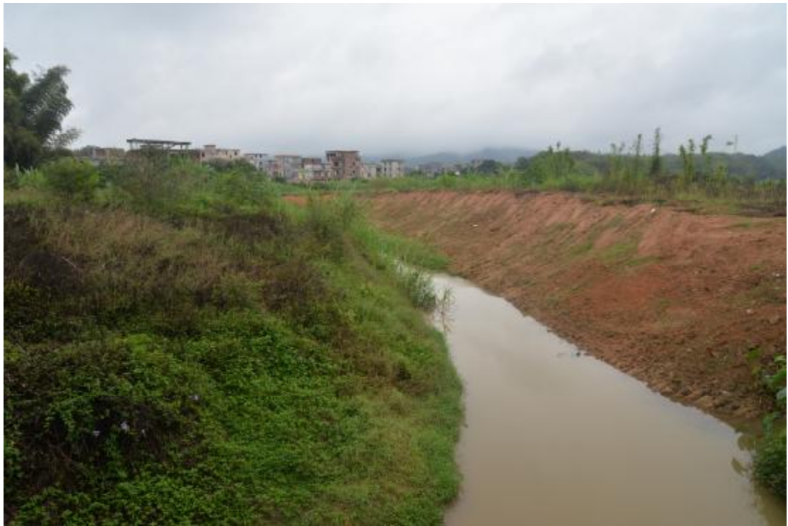
图 11 地表现状（西-东）