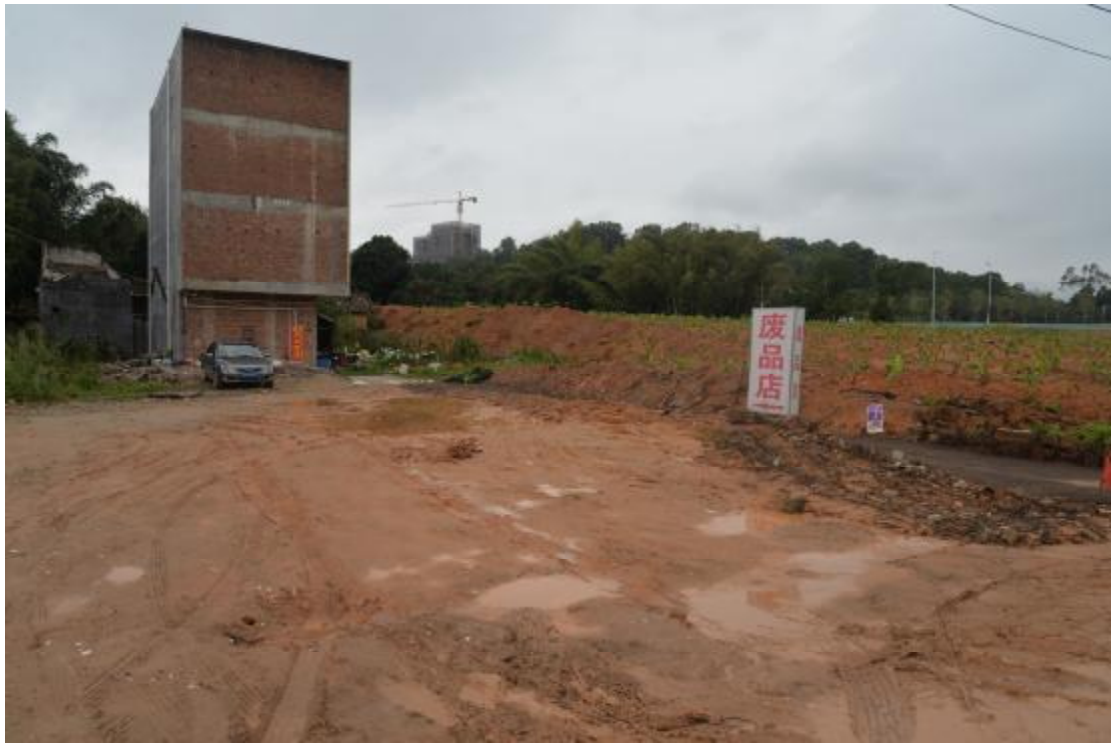
图 15 地表现状（东—西）