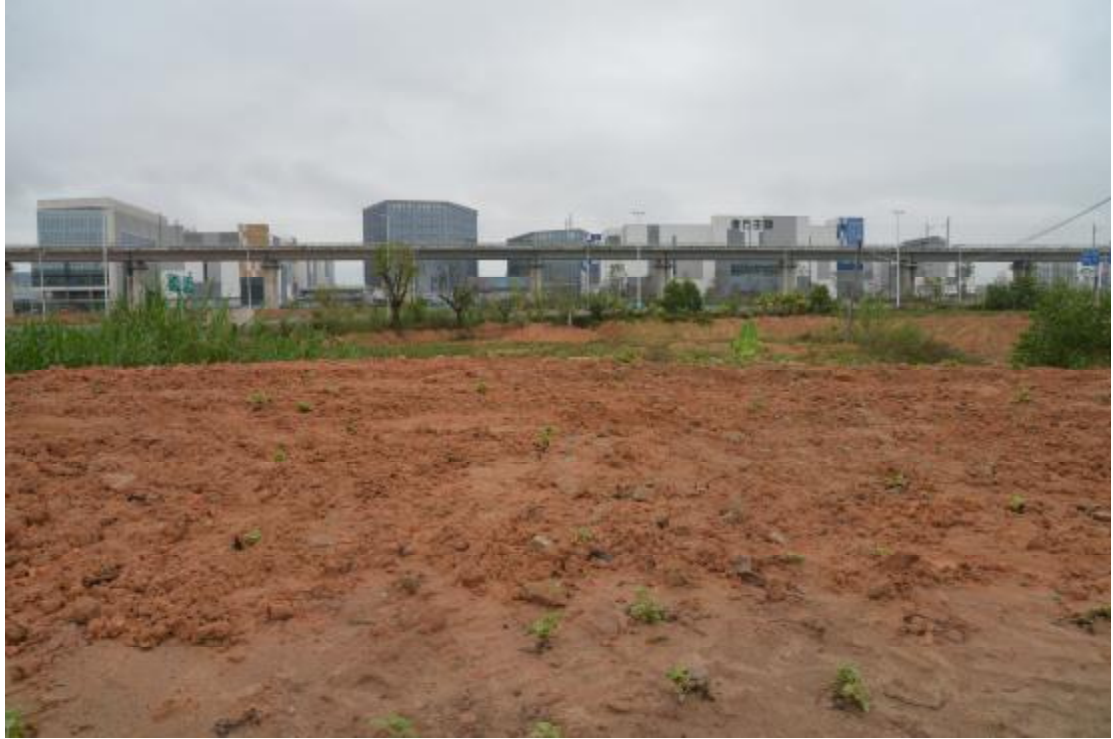
图 14 地表现状（南—北）