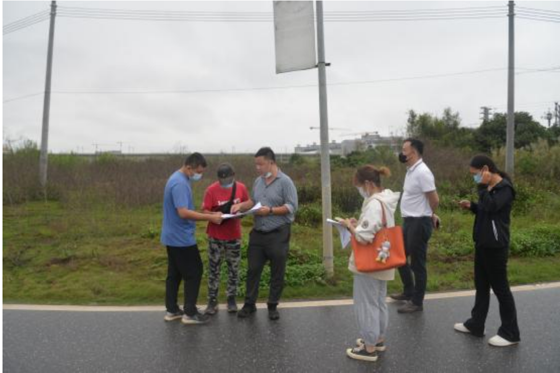
图7 与甲方工作人员确认地块范围（南-北）