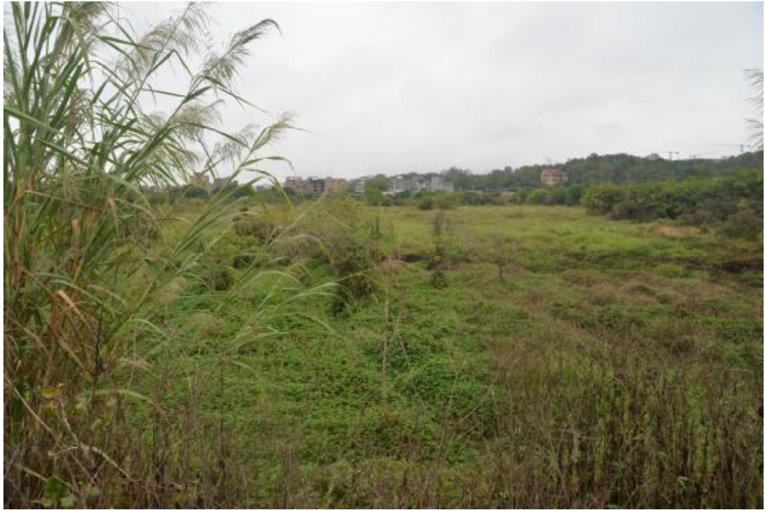
图 12 地表现状（北—南）