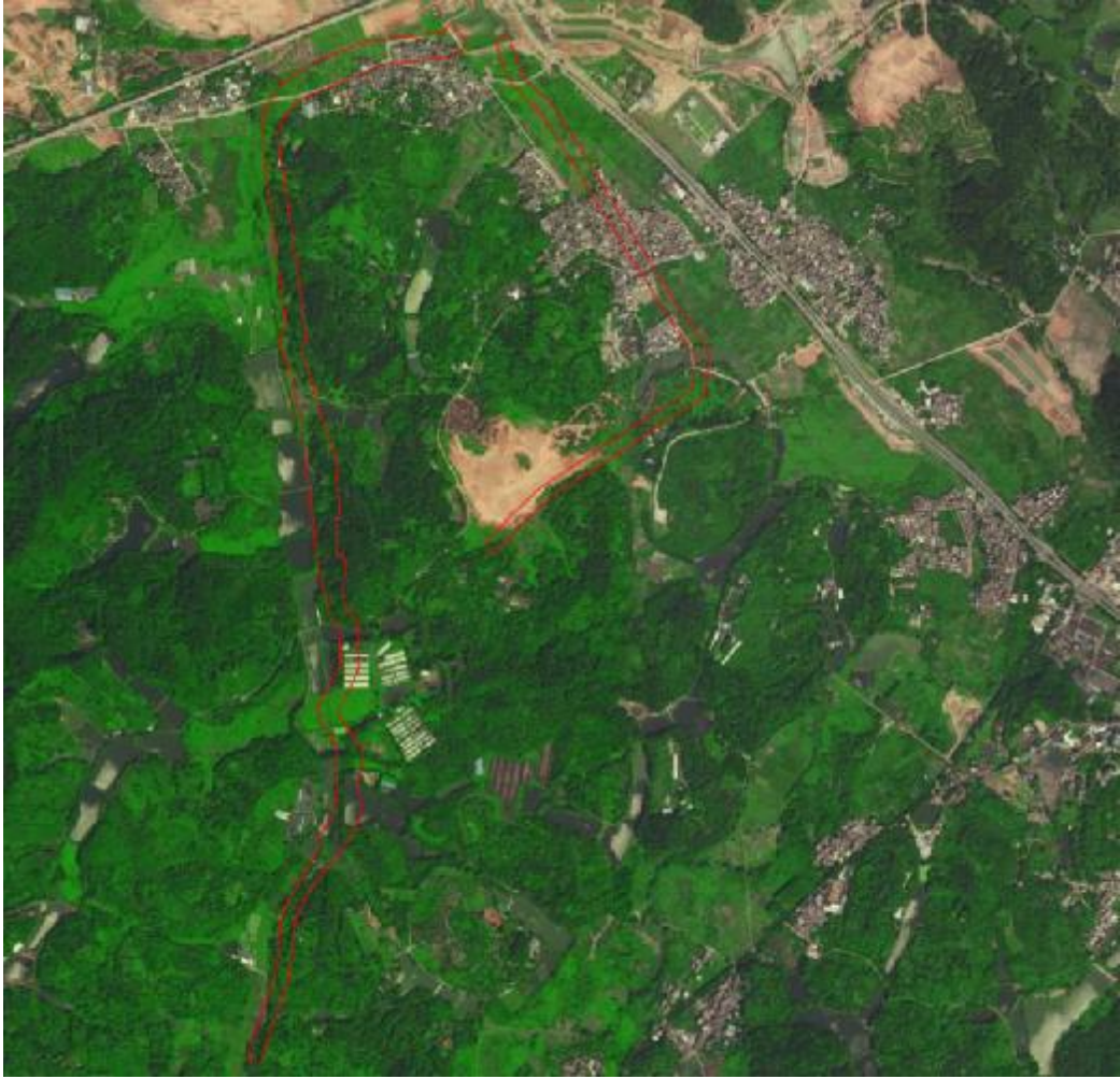
图 3 地块卫星红线示意图（高德地图）