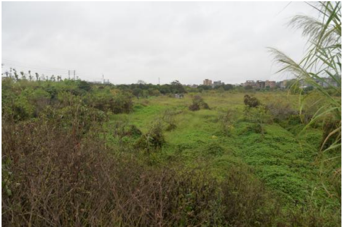
图 13 地表现状（北—南）