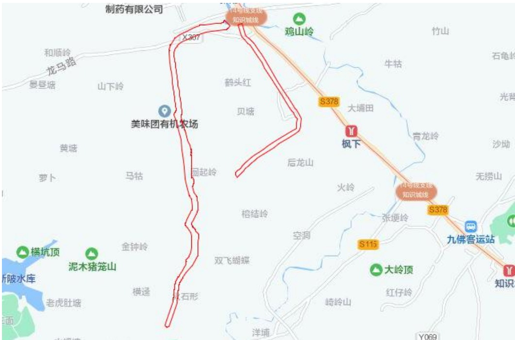
图 4 地块周边环境示意图（腾讯地图）