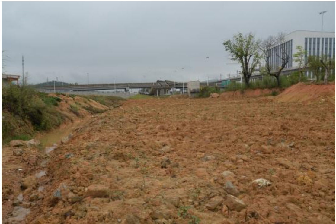
图 17 地表现状（东—西）