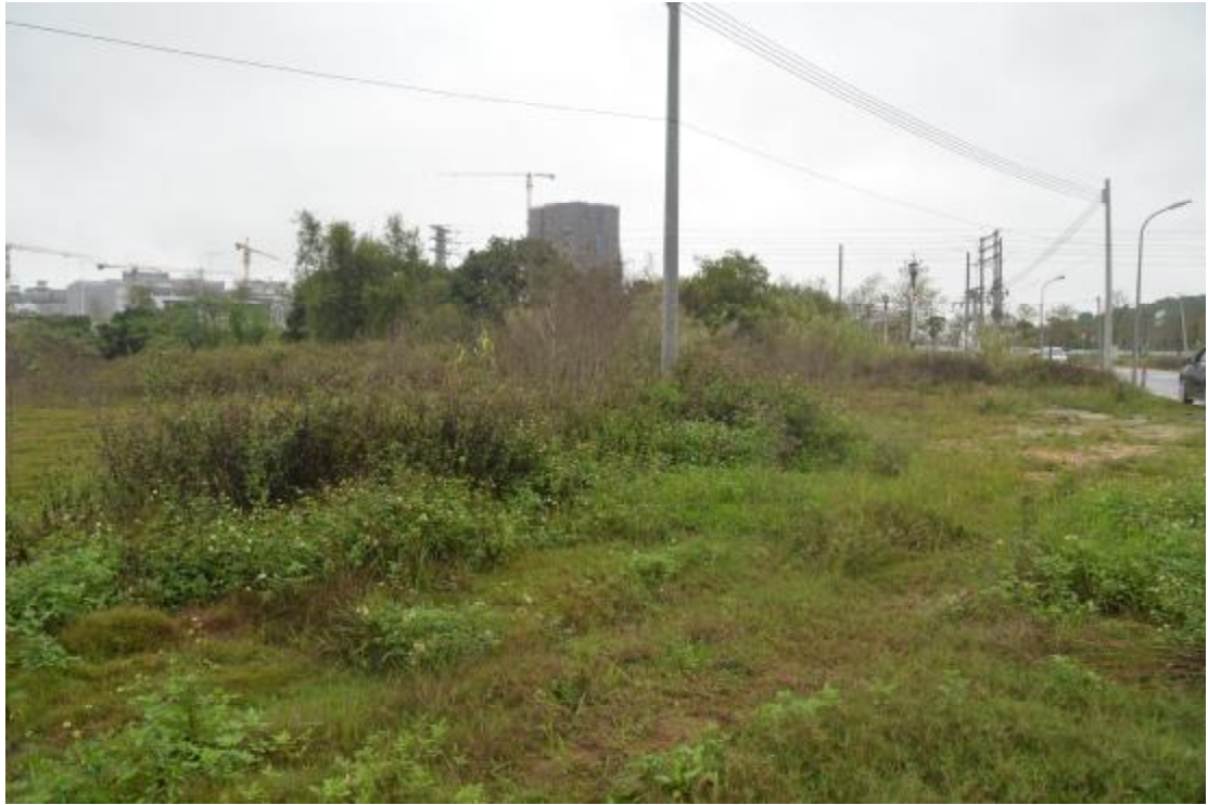
图 10 地表现状（东-西）