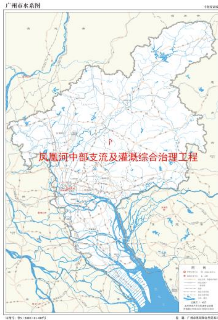
图 1 地块在广州市的位置示意图（广州市规划和自然资源局）

根据《中华人民共和国文物保护法》《广州市文物保护规定》，按照《广州市文物局关于黄埔区凤凰河中部支流及灌溉综合治理工程等 3 个水利项目考古调查勘探工作的复函》（文物 20221222 号）的指导意见，受中新广州知识城财政投资建设项目管理中心委托，由我院配合该工程用地的考古调查工作。