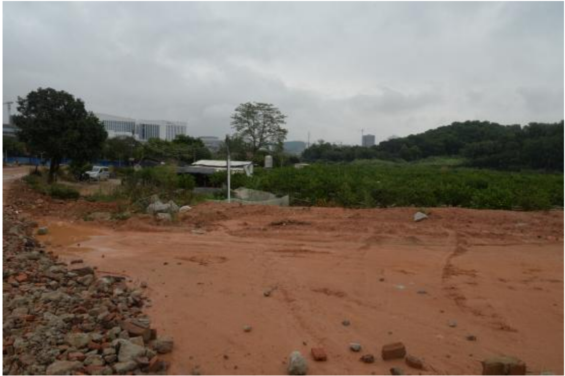
图 18 地表现状（西—东）