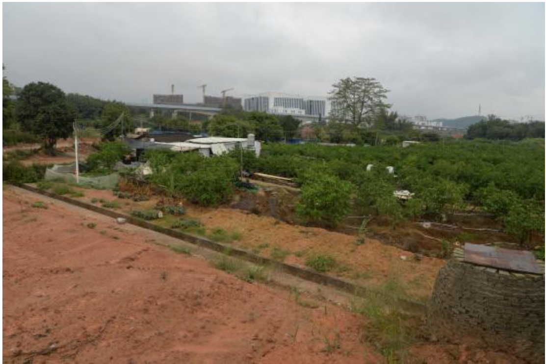
图 21 地表现状（南—北）