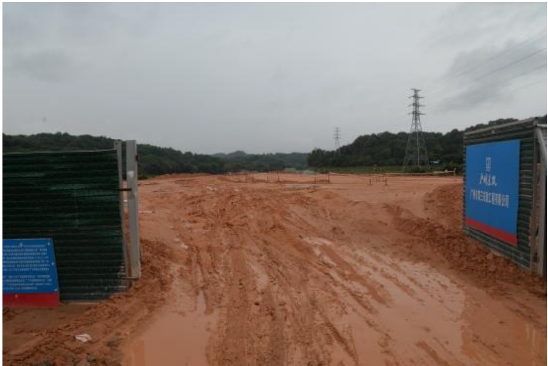
图 19 地表现状（北—南）