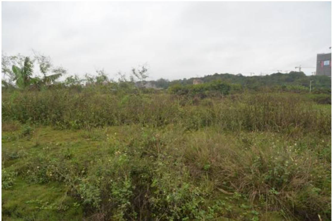
图 11 地表现状（北-南）