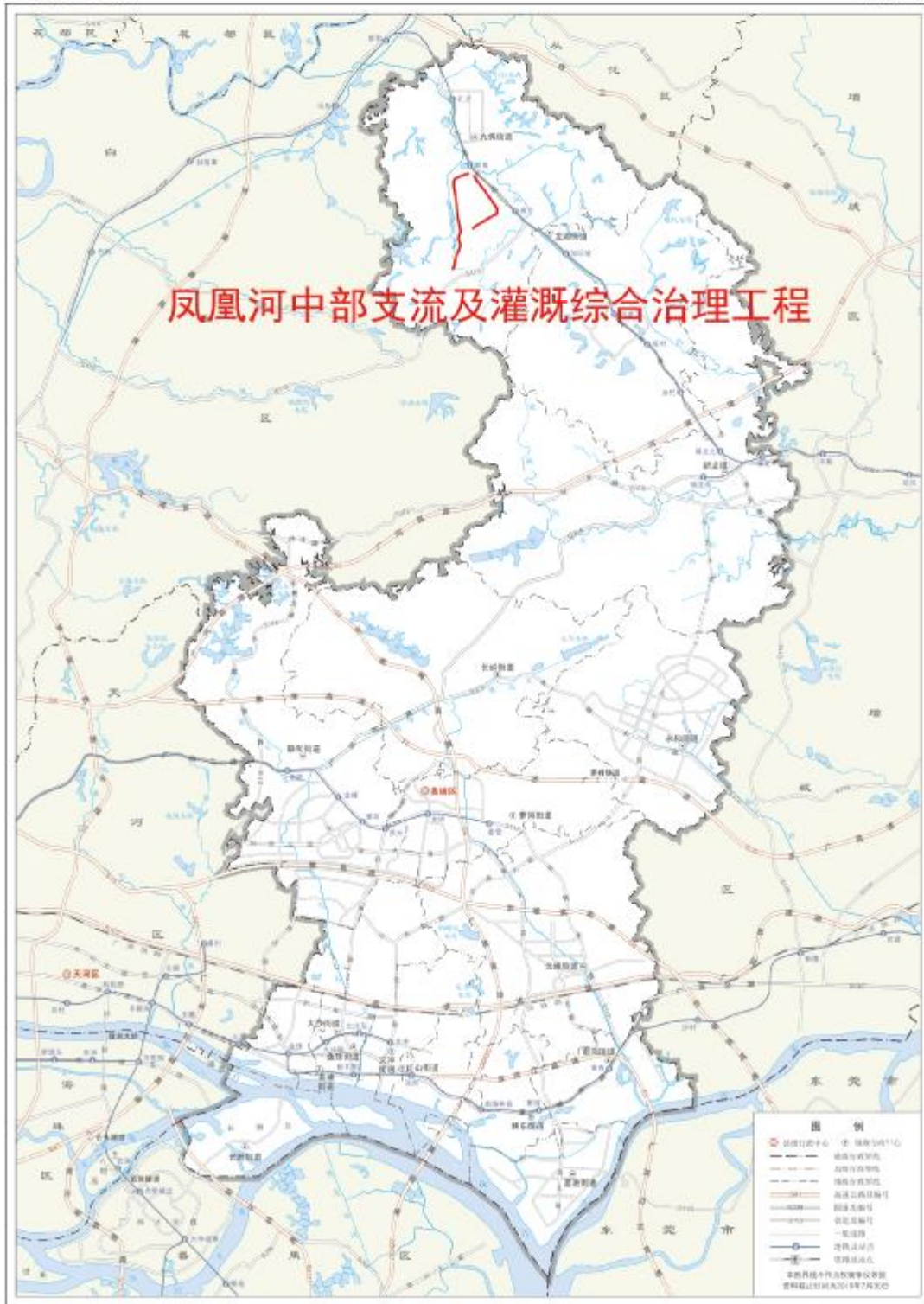
图 2 地块在黄埔区的位置示意图（广州市规划和自然资源局）