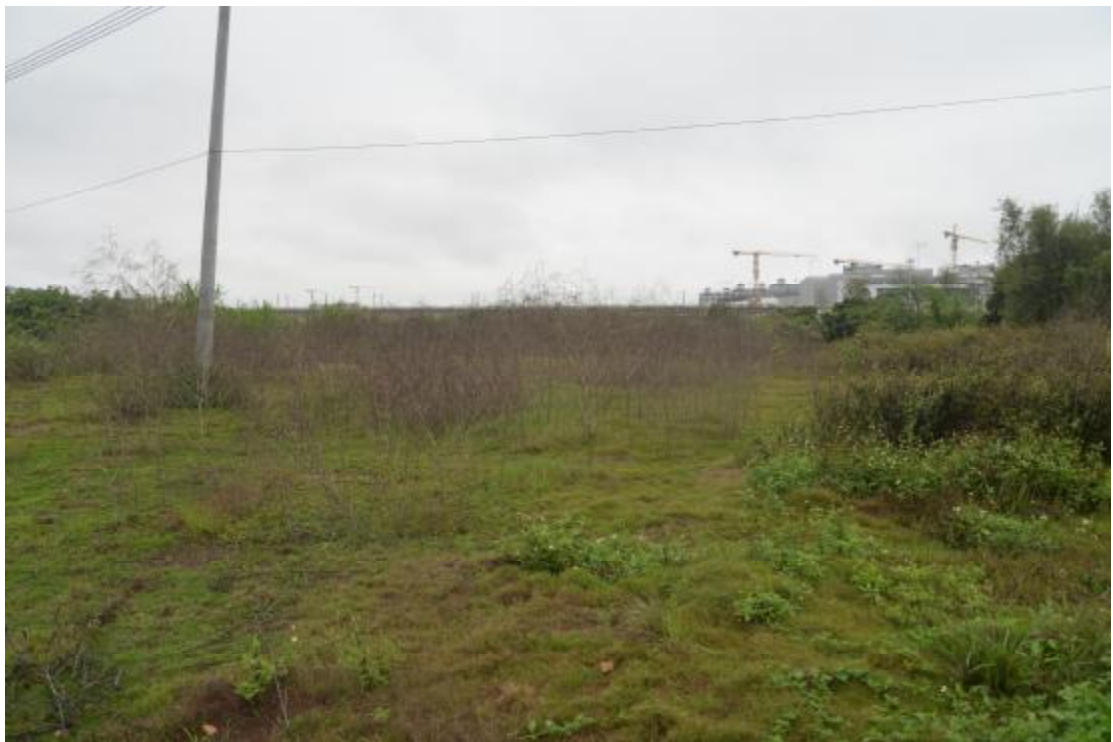
图 9 地表现状（东-西）