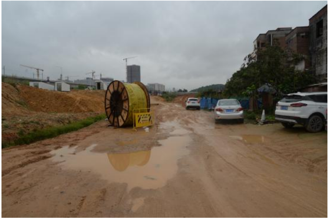
图 16 地表现状（西—东）