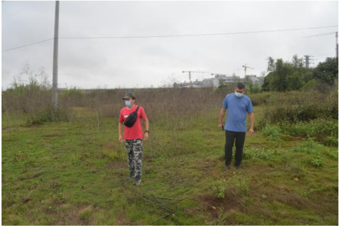
图 8 对地块地表进行踏查（南-北）