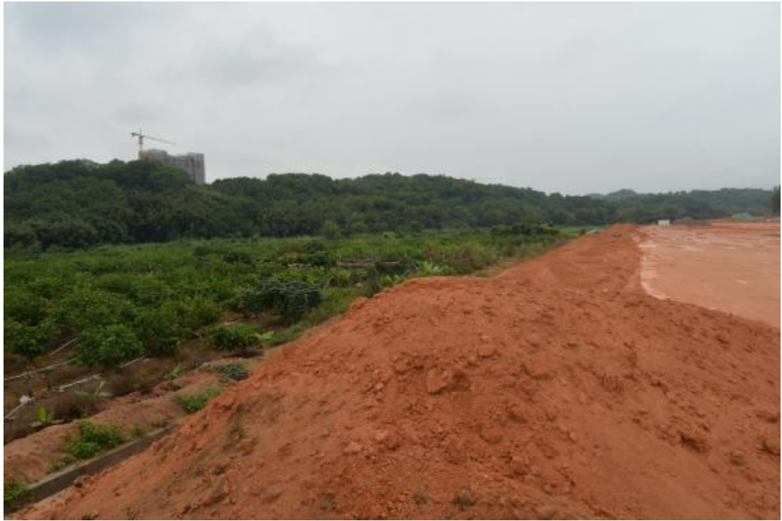
图 20 地表现状（北—南）