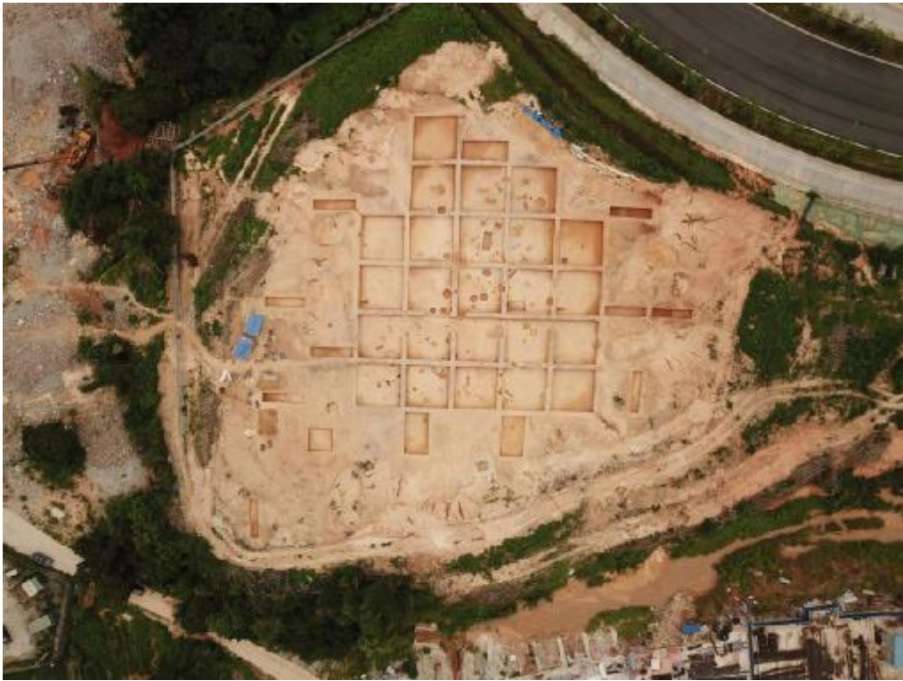
图 6 马头庄遗址 2020 年 6 月 30 日全景（俯拍）