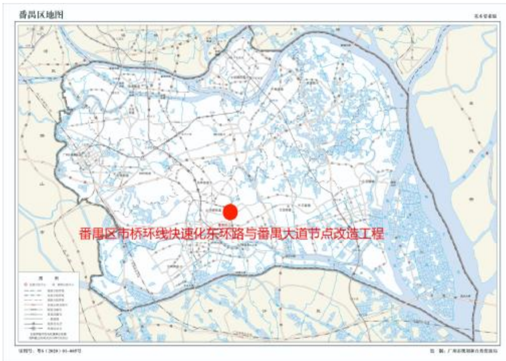
图 2 项目工程在番禺区位置示意图（广州市规划和自然资源局）