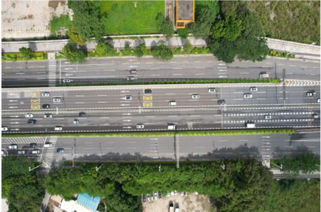
图 17 地块内东北部现状（上西-下东）