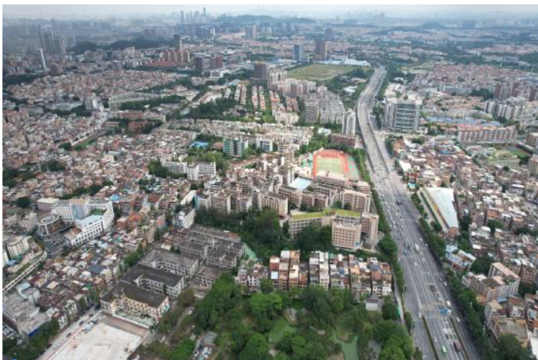
图 16 地块西部地形地貌航拍图（南-北）