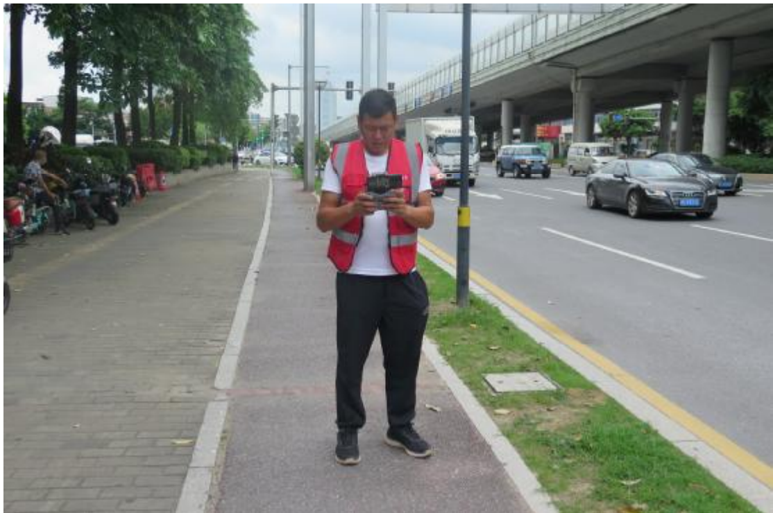
图 10 航拍工作照（北-南）