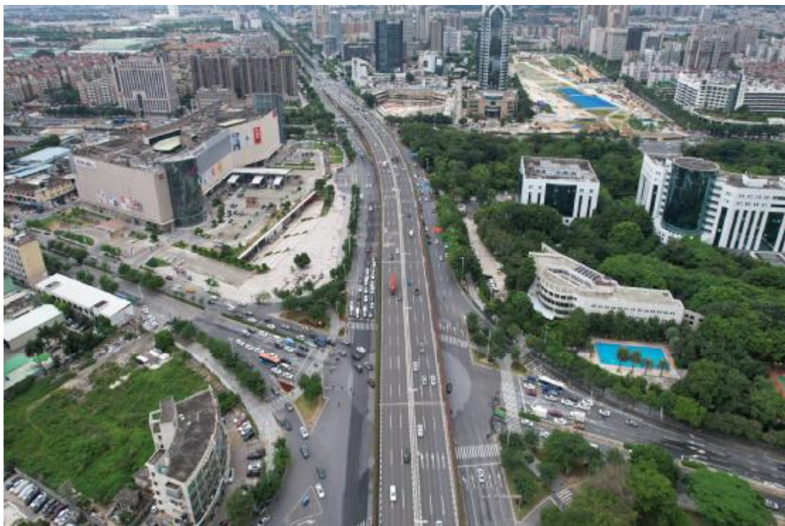
图 15 地块南部地形地貌航拍图（北-南）