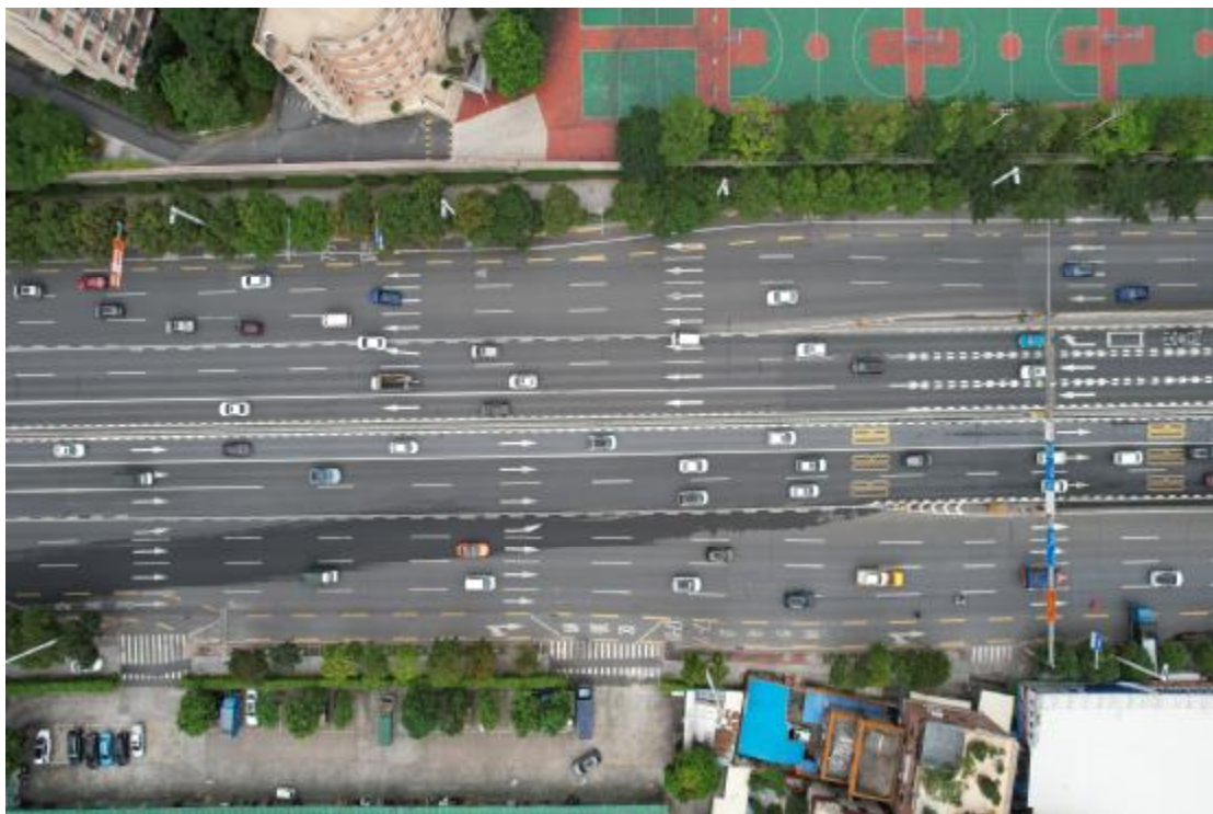
图 23 地块内南部现状（上西-下东）