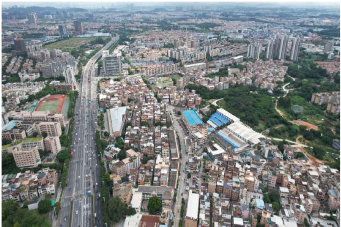
图 14 地块东部地形地貌航拍图（南-北）