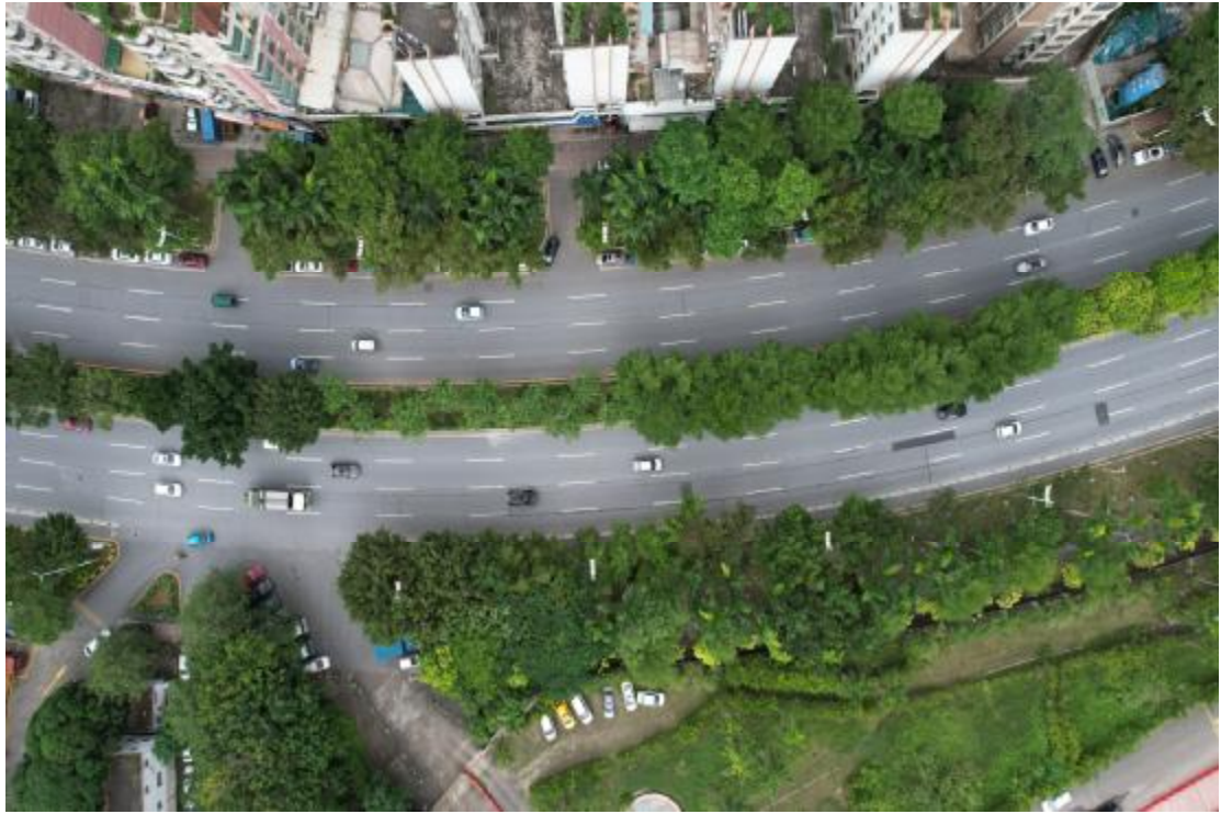
图 19 地块内西北部现状（上西-下东）