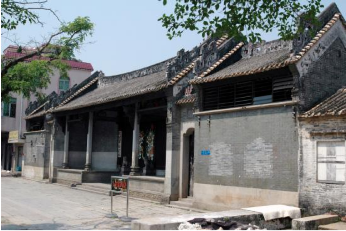
图 6 陈尚书祠