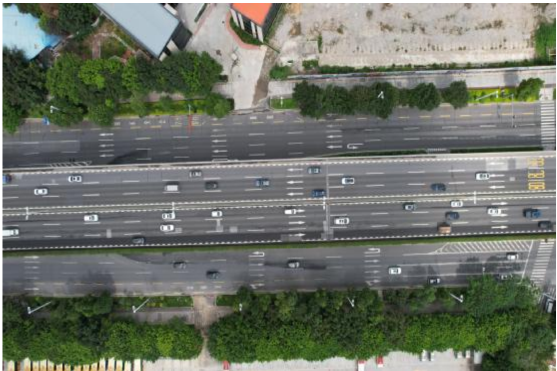
图 18 地块内东北部现状（上西-下东）