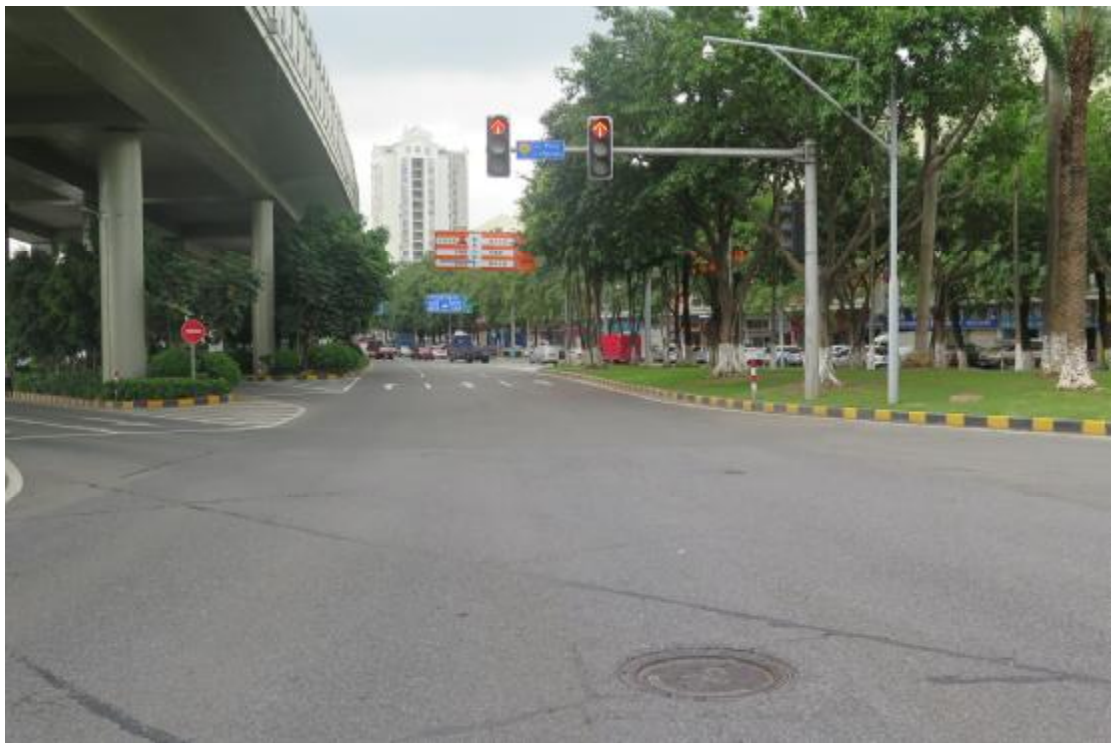
图 26 地块内现状（南-北）