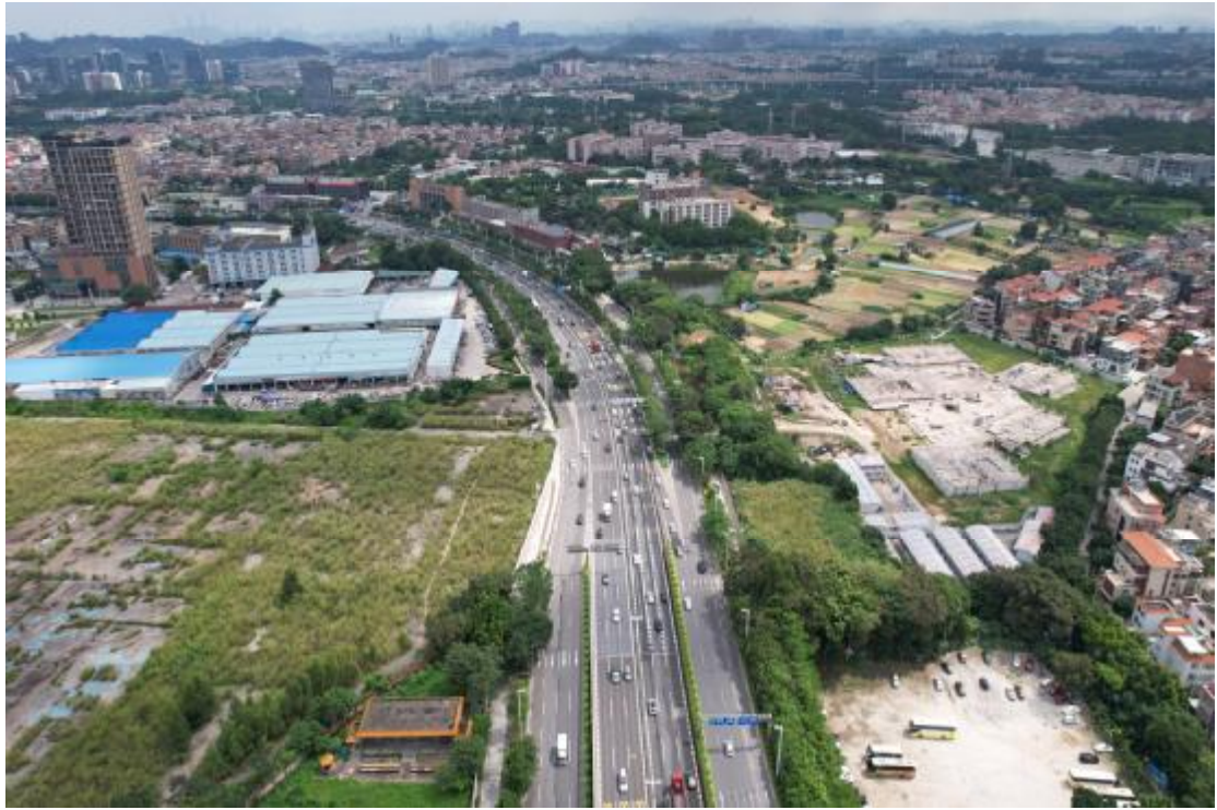
图 13 地块东北部地形地貌航拍图（南-北）