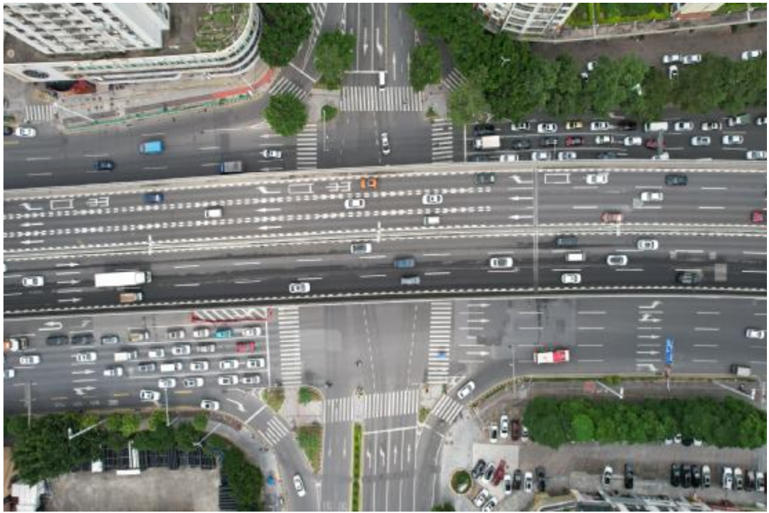
图 21 地块内中部现状（上西-下东）