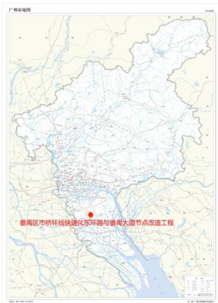
图 1 项目地块在广州市位置示意图（广州市规划和自然资源局）

根据《中华人民共和国文物保护法》《广州市文物保护规定》，按照《广州市文物局关于番禺区市桥环线快速化东环路与番禺大道节点改造工程开展考古调查勘探工作的复函》（文物 2022139 号）的指导意见，受广州市番禺建设管理有限公司委托，由我院配合该项目建设，对项目地块进行考古调查工作。