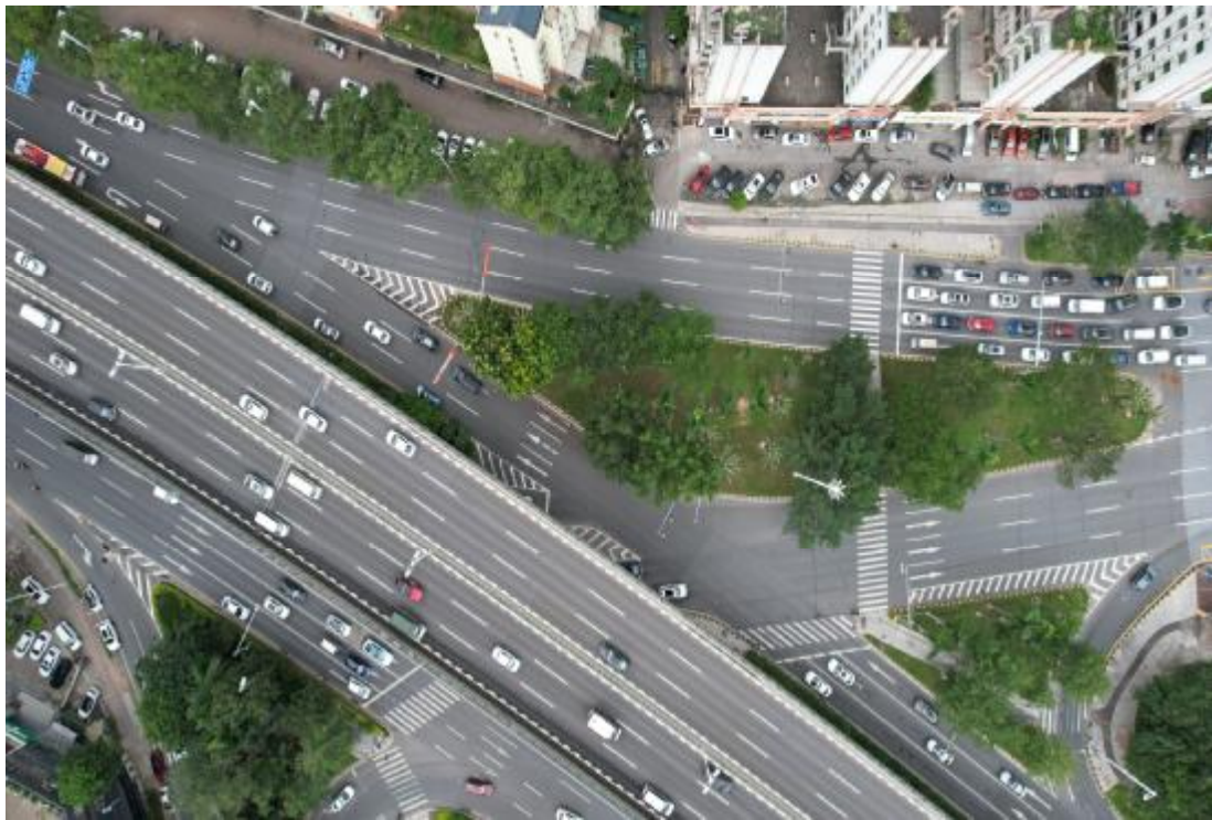
图 20 地块内西北部现状（上西-下东）