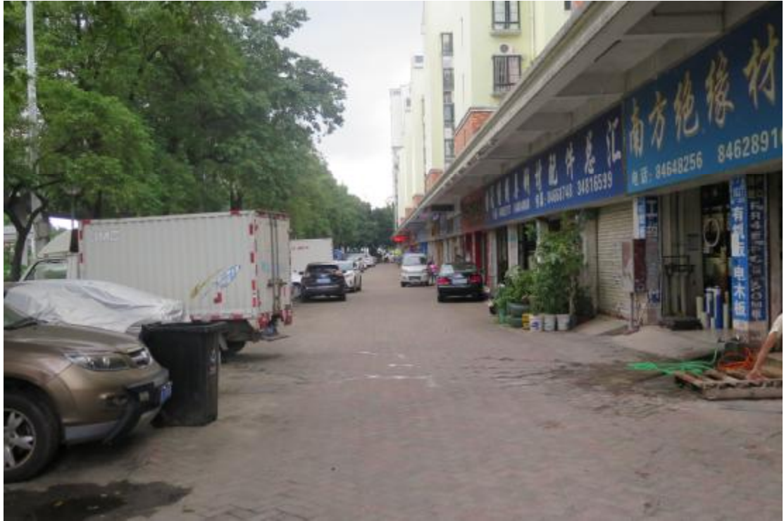
图 25 地块内现状（北-南）