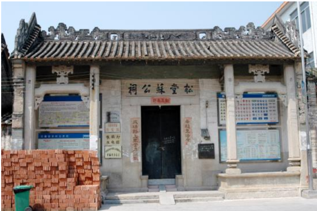
图 7 松堂苏公祠