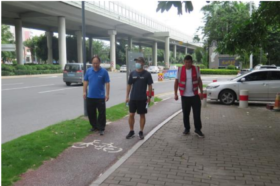
图 9 地表踏查（南-北）