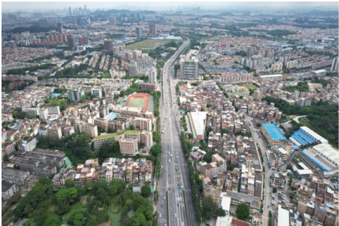
图 12 地块全景航拍图（南-北）