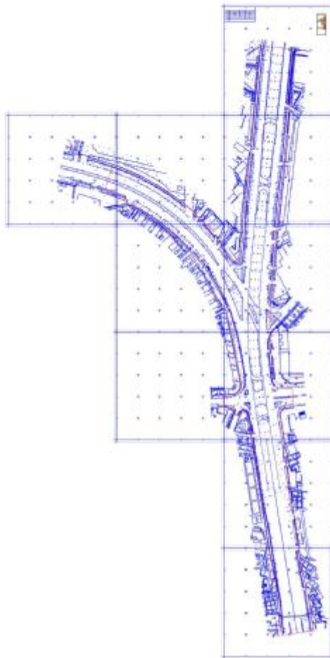
图 3 项目工程规划红线图