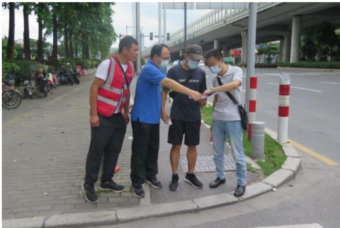
图 8 与甲方确认地块范围（北-南）