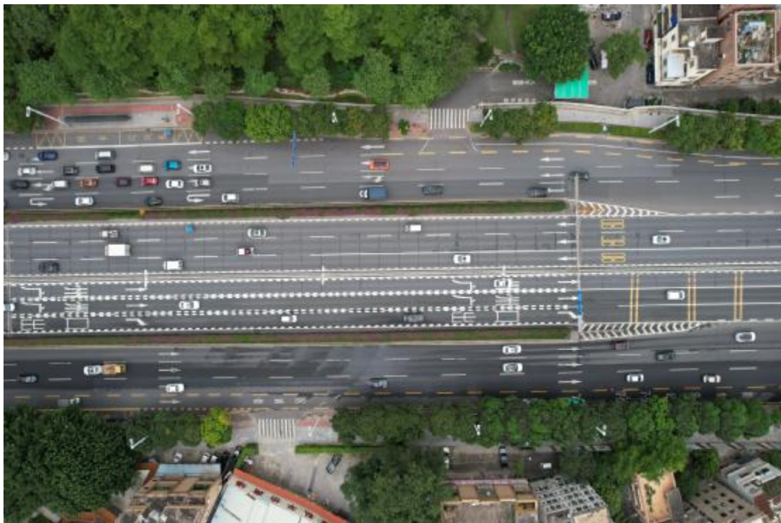
图 24 地块内南部现状（上西-下东）