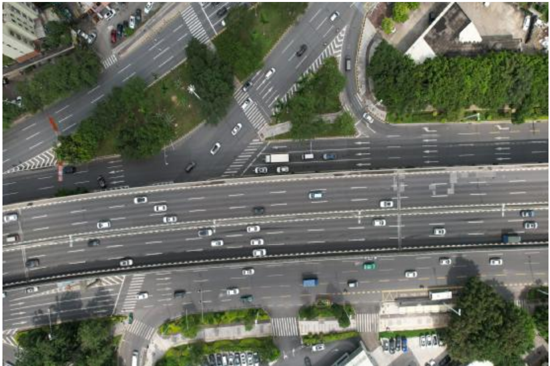
图 22 地块内中部现状（上西-下东）