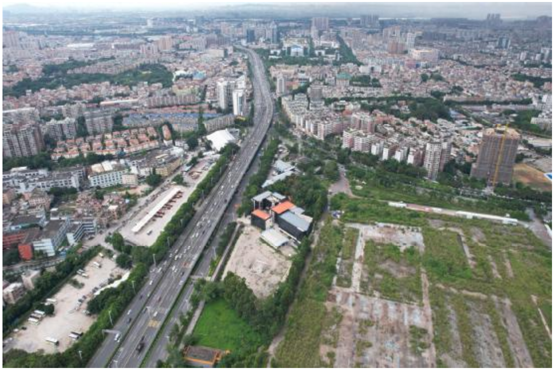
图 11 地块全景图航拍图（北-南）