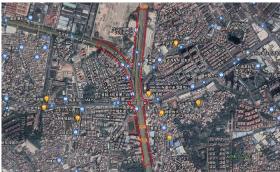
图 4 项目工程卫星红线图（奥维地图）