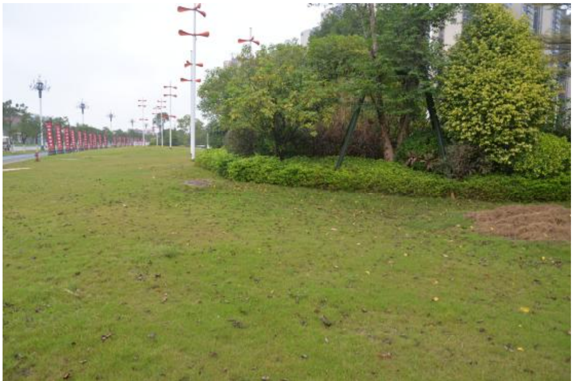
图 13 地表现状（南—北）