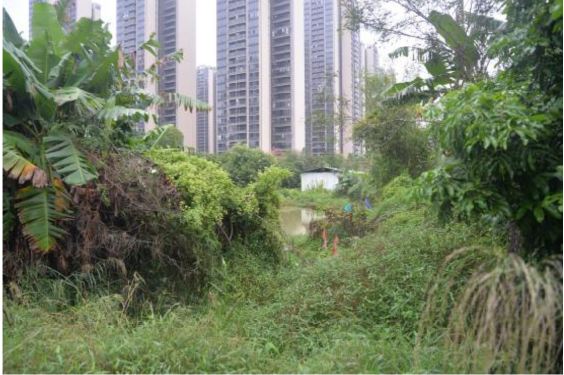
图 18 地表现状（东—西）