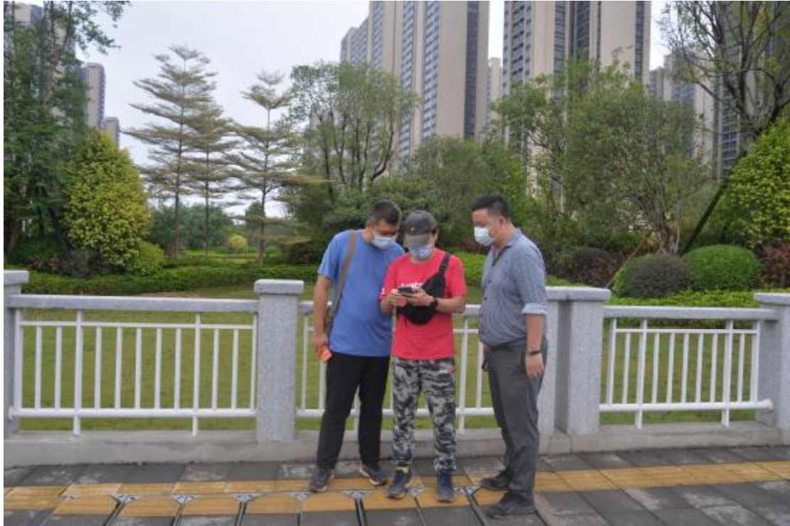
图 7 与甲方工作人员确认地块范围（西-东）