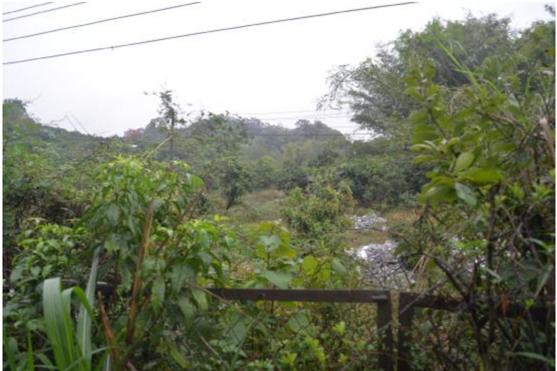
图 21 地表现状（北—南）