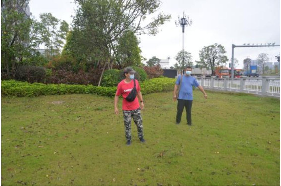
图 8 对地块地表进行踏查（北-南）