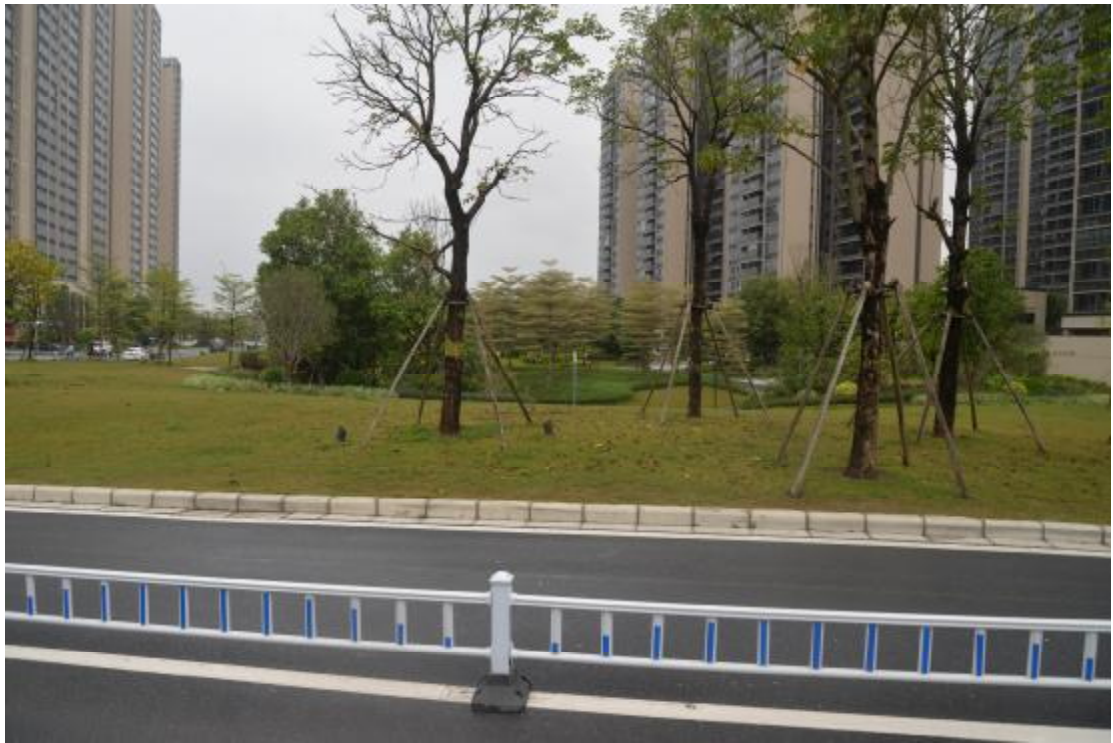
图 17 地表现状（东—西）