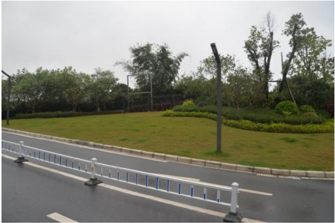
图 16 地表现状（西—东）