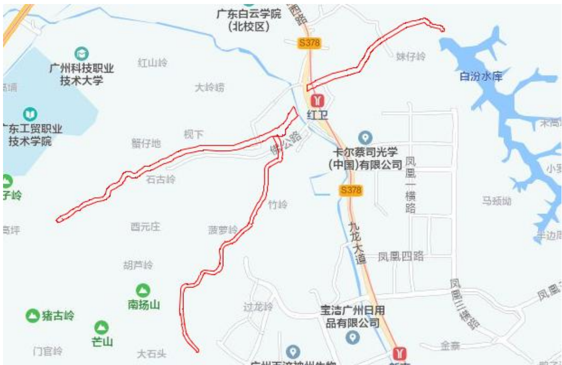
图 4 地块周边环境示意图