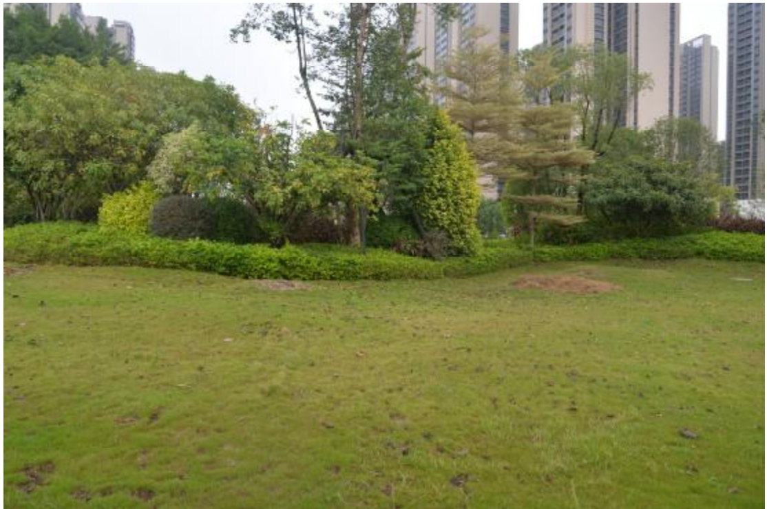
图 9 地表现状（西-东）