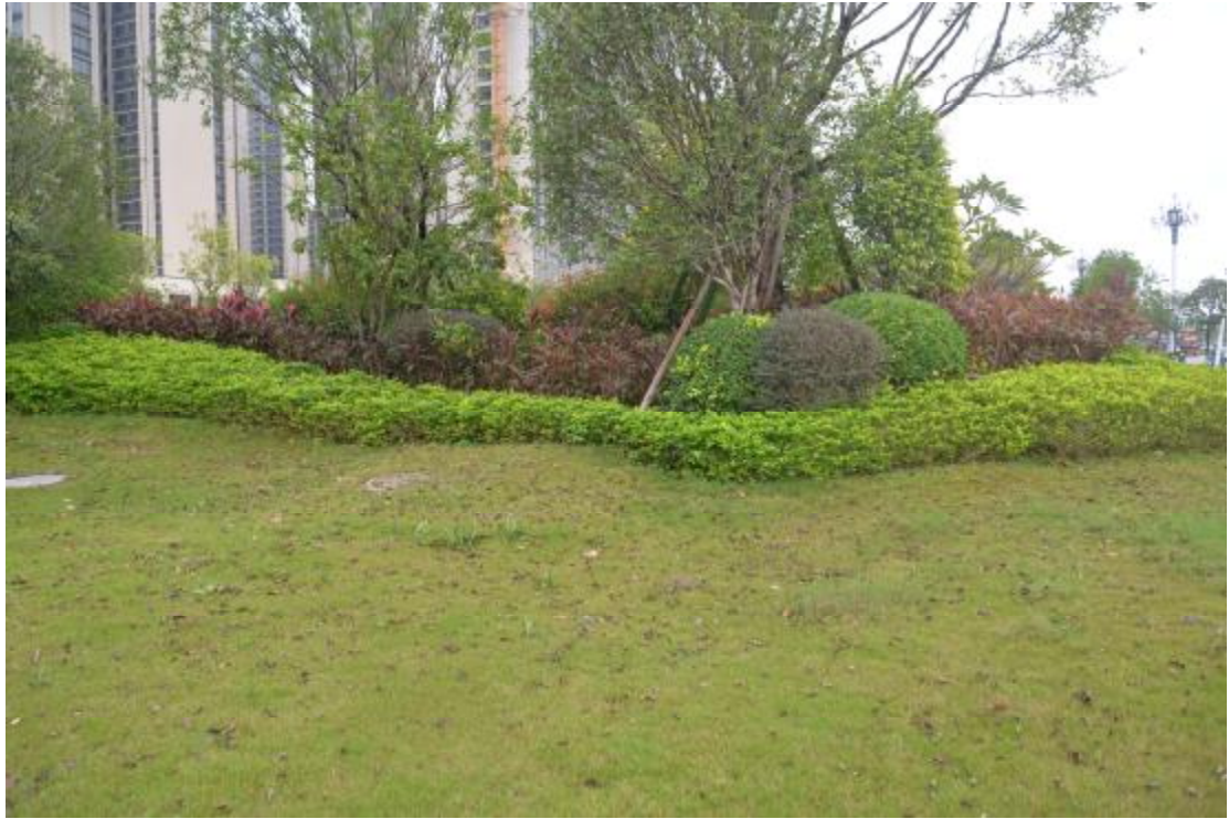
图 12 地表现状（西—东）