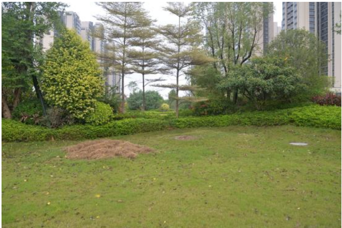
图 11 地表现状（西-东）