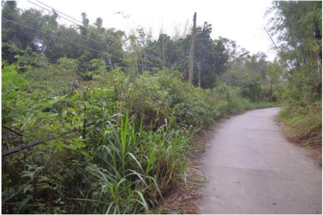
图 20 地表现状（东—西）