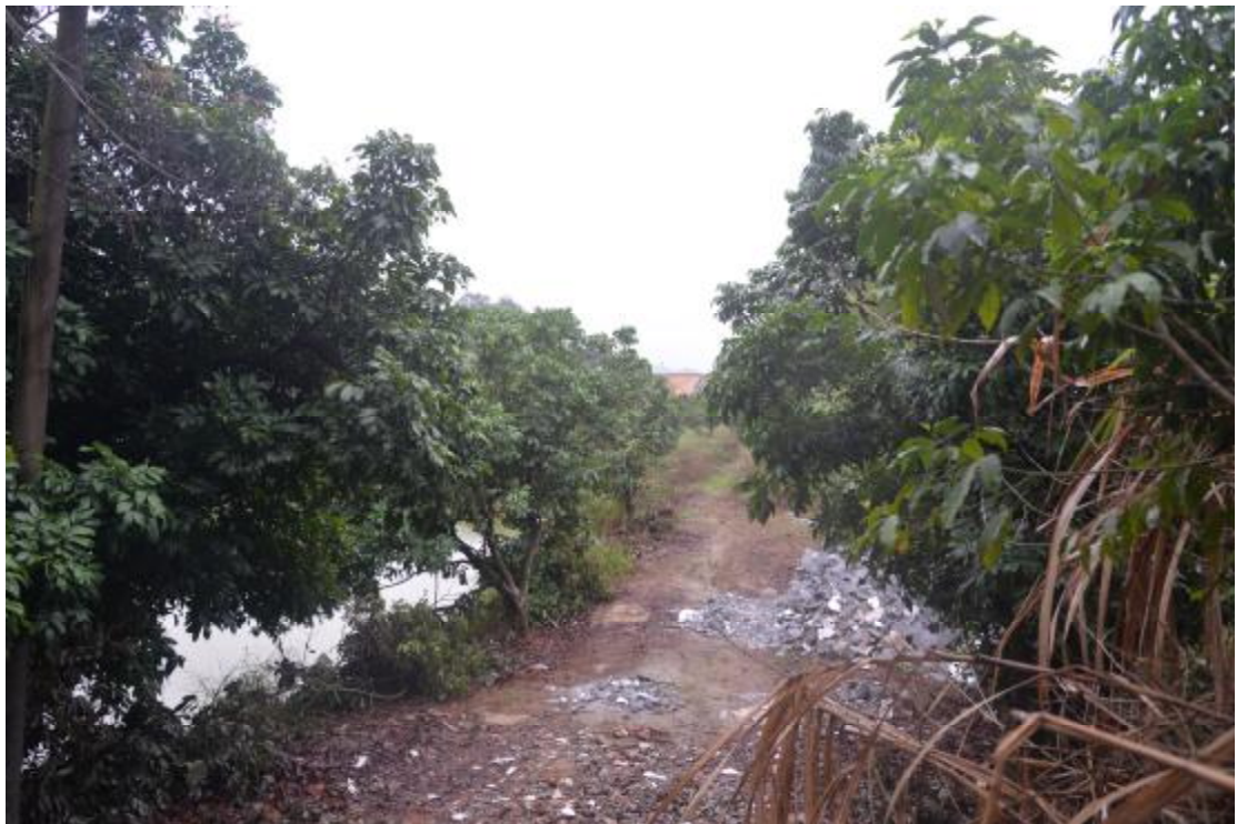
图 19 地表现状（北—南）