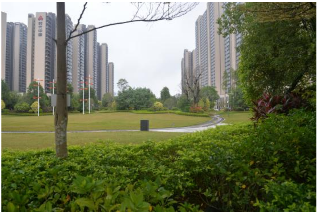
图 14 地表现状（西—东）