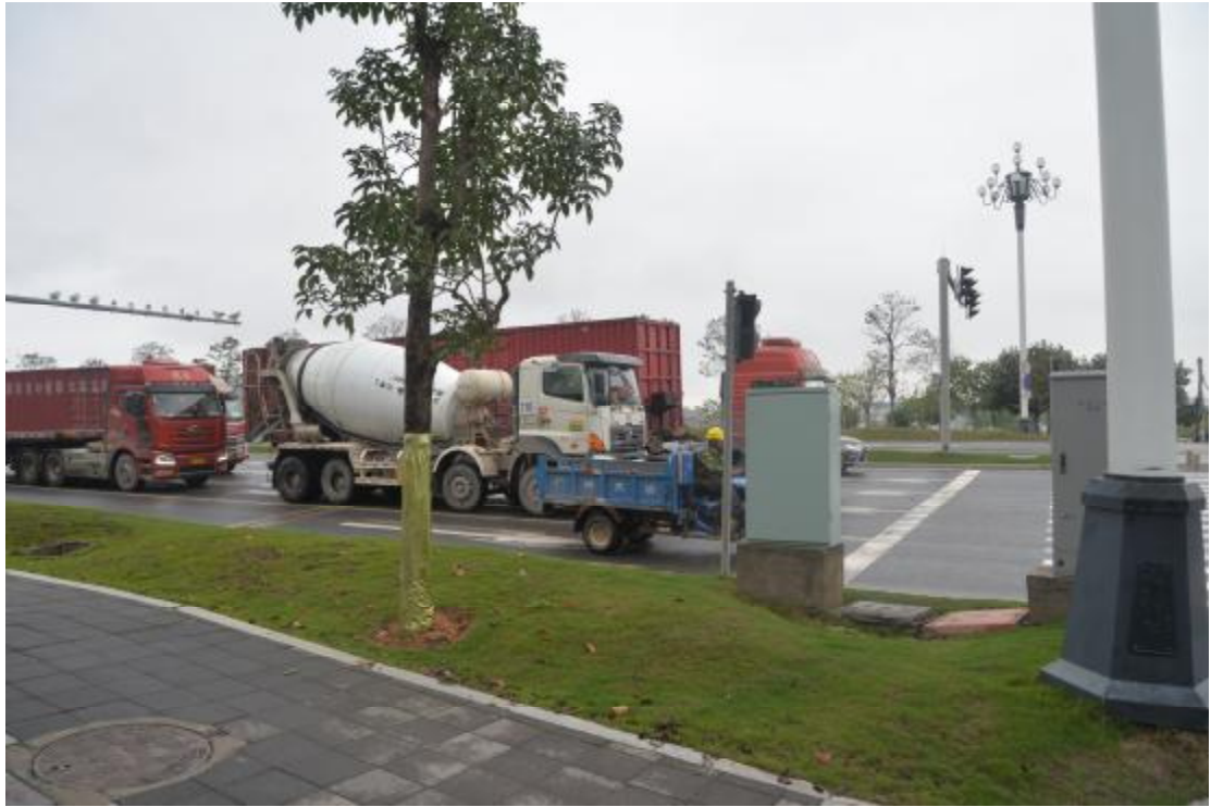
图 10 地表现状（东-西）