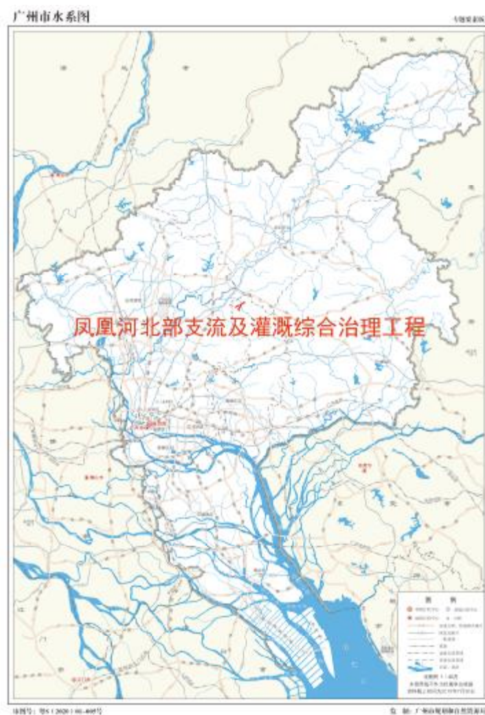
图 1 地块在广州市的位置示意图（广州市规划和自然资源局）

根据《中华人民共和国文物保护法》《广州市文物保护规定》，按照《广州市文物局关于黄埔区凤凰河北部支流及灌溉综合治理工程等 3 个水利项目考古调查勘探工作的复函》（文物 20221222 号）的指导意见，受中新广州知识城财政投资建设项目管理中心委托，由我院配合该工程用地的考古调查工作。