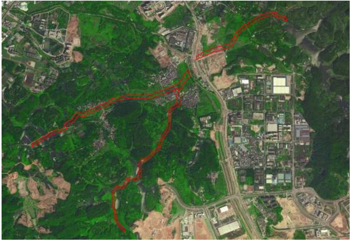
图 3 地块卫星红线示意图（高德地图）