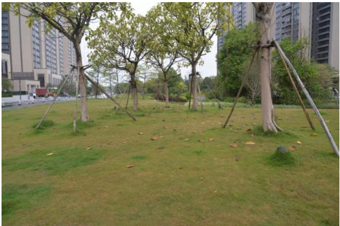
图 15 地表现状（东—西）