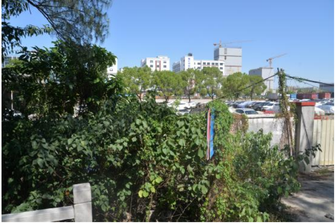
图 16 地块东部地表现状（南—北）