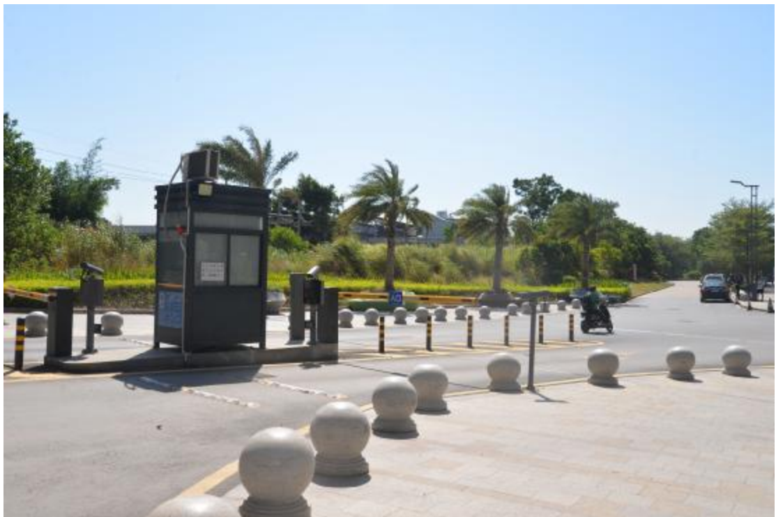
图 13 地块东部地表现状（北—南）