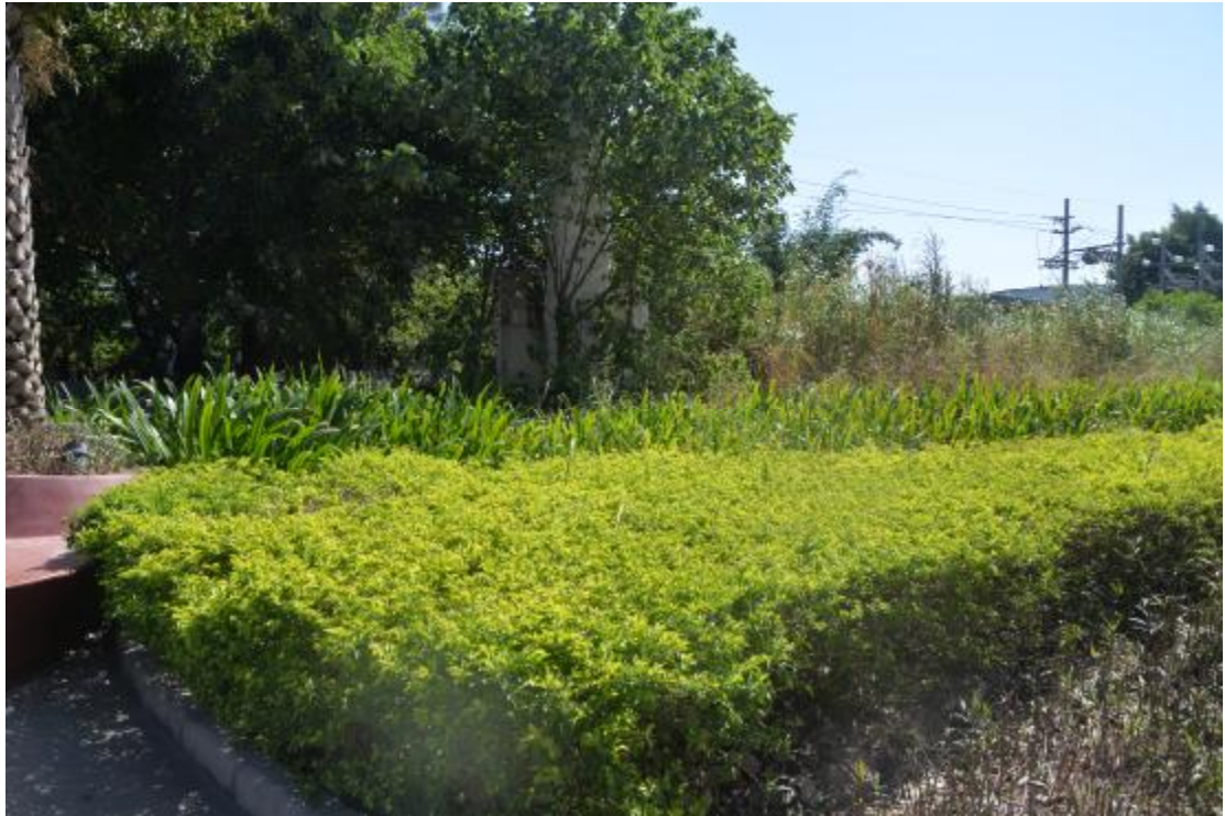
图 14 地块东部地表现状（西—东）