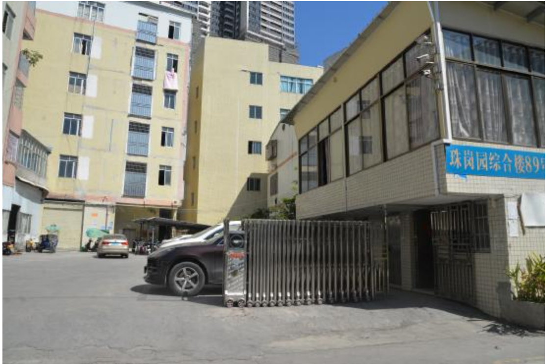
图 26 地块西南部地表现状（南—北）