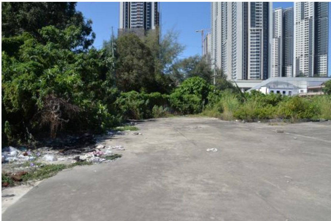
图 11 地块北部地表现状（东—西）