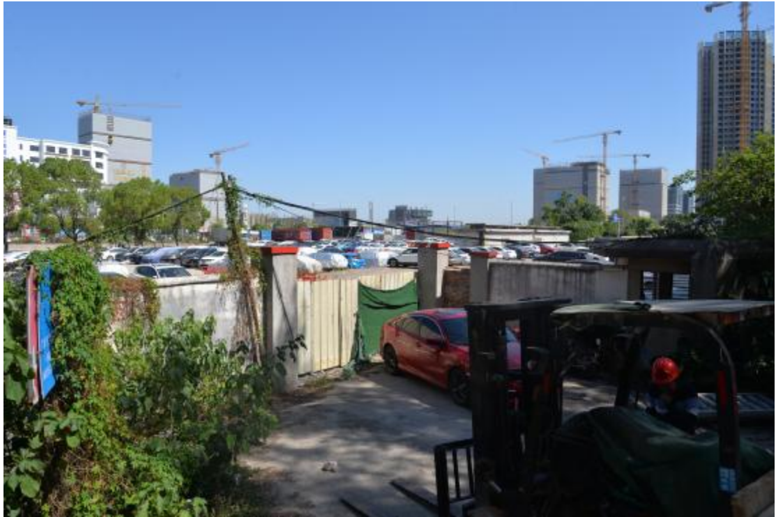
图 18 地块东部地表现状（南—北）