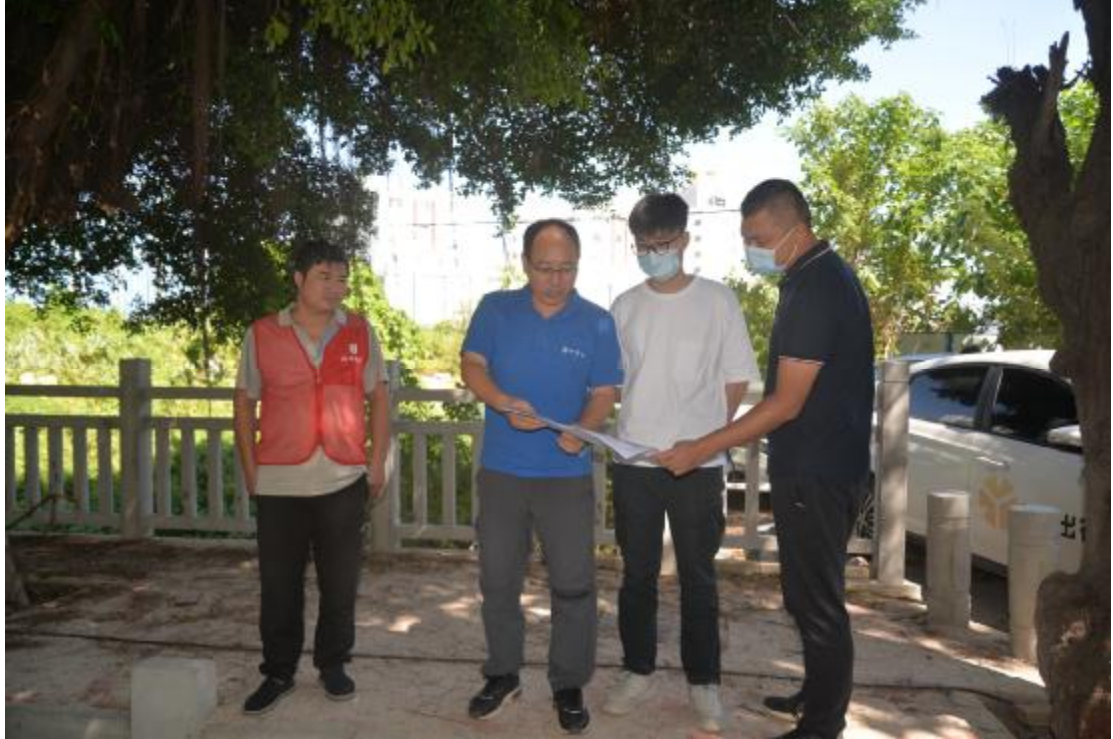
图 6 与工作人员确认地块范围（南—北）