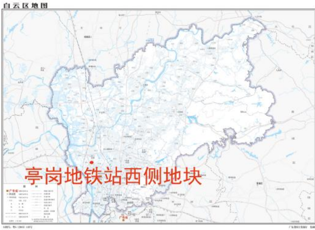
图 2 地块在白云区的位置示意图（广东省国土资源厅）