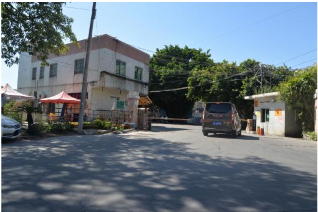
图 19 地块中部地表现状（北—南）