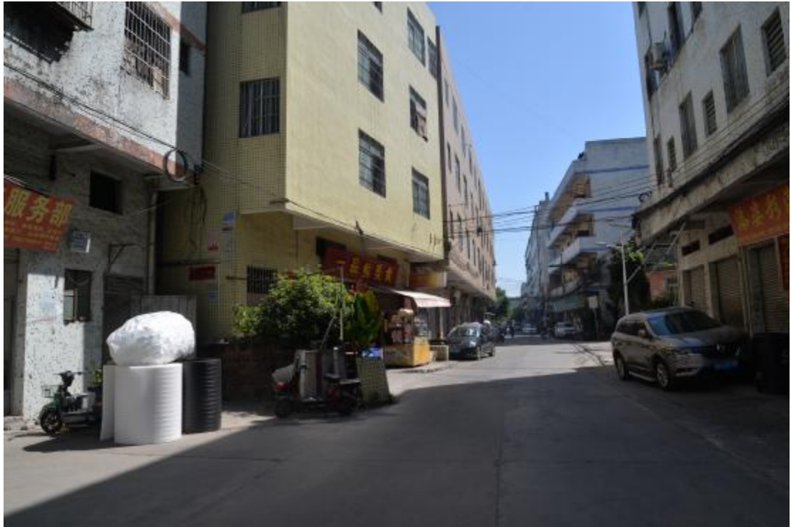
图 28 地块西南部地表现状（西—东）