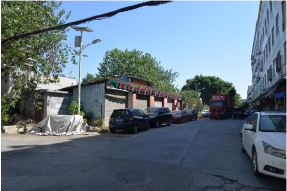
图 20 地块中部地表现状（西—东）