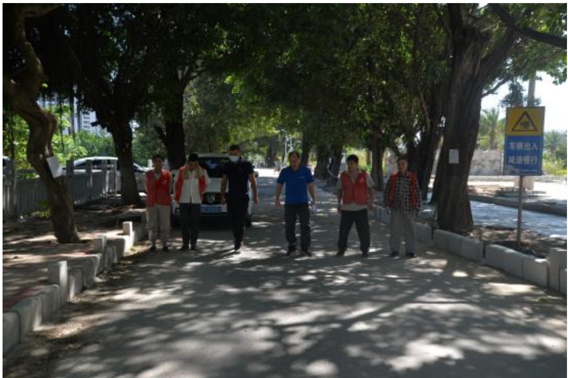
图 7 对地块地表进行踏查（西—东）