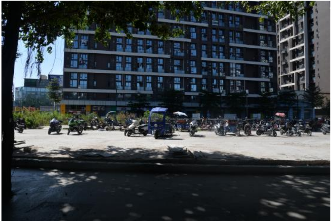
图 12 地块东部地表现状（北—南）