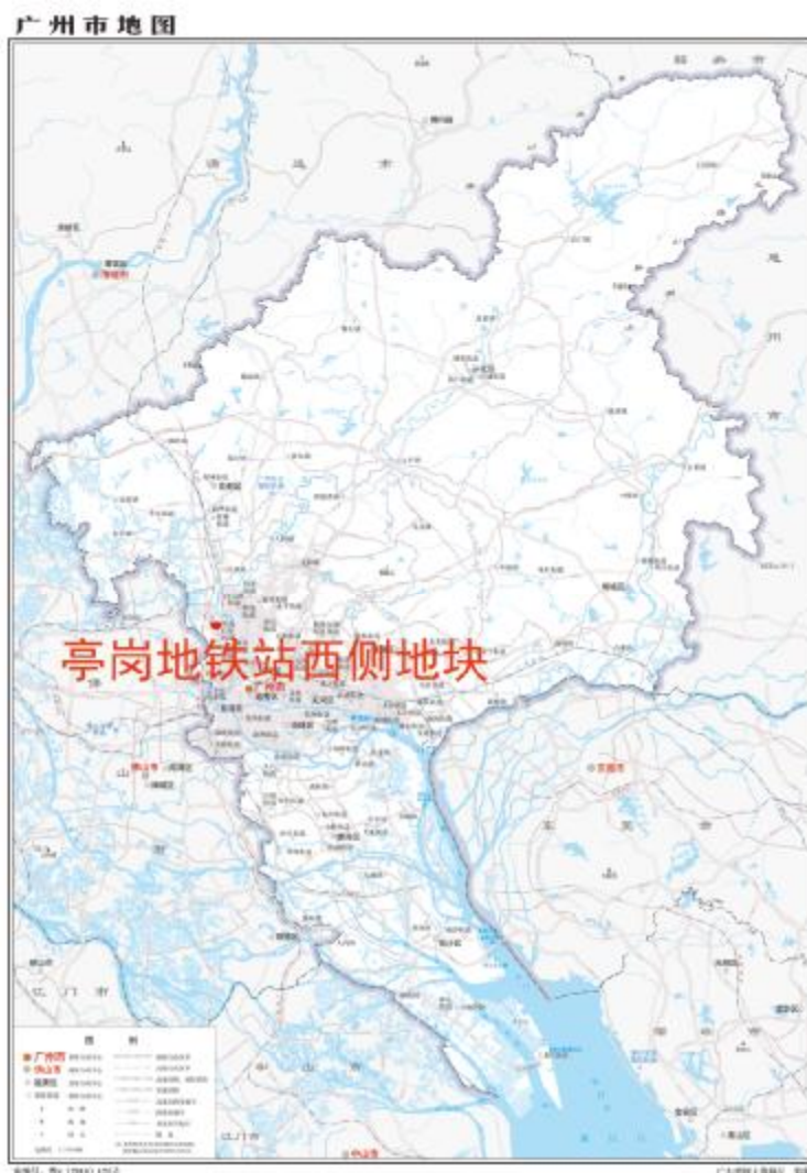
图 1 地块在广州市的位置示意图（广东省国土资源厅）

根据《中华人民共和国文物保护法》《广州市文物保护规定》，按照《广州市文物局关于白云区亭岗地铁站西侧地块进行文物考古调查勘探的复函》（文物 20221099 号）的指导意见，受广州市白云区土地开发中心委托，由我院配合该地块出让，对该地块进行考古调查工作。