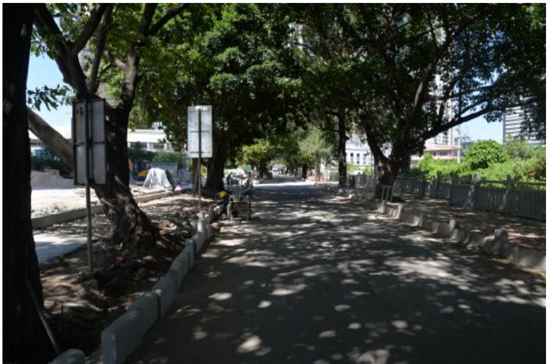
图 9 地块北部地表现状（东—西）