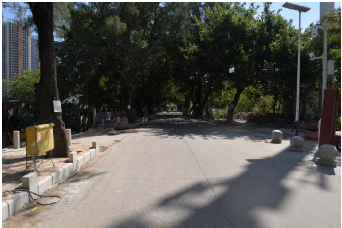
图 15 地块东部地表现状（西—东）