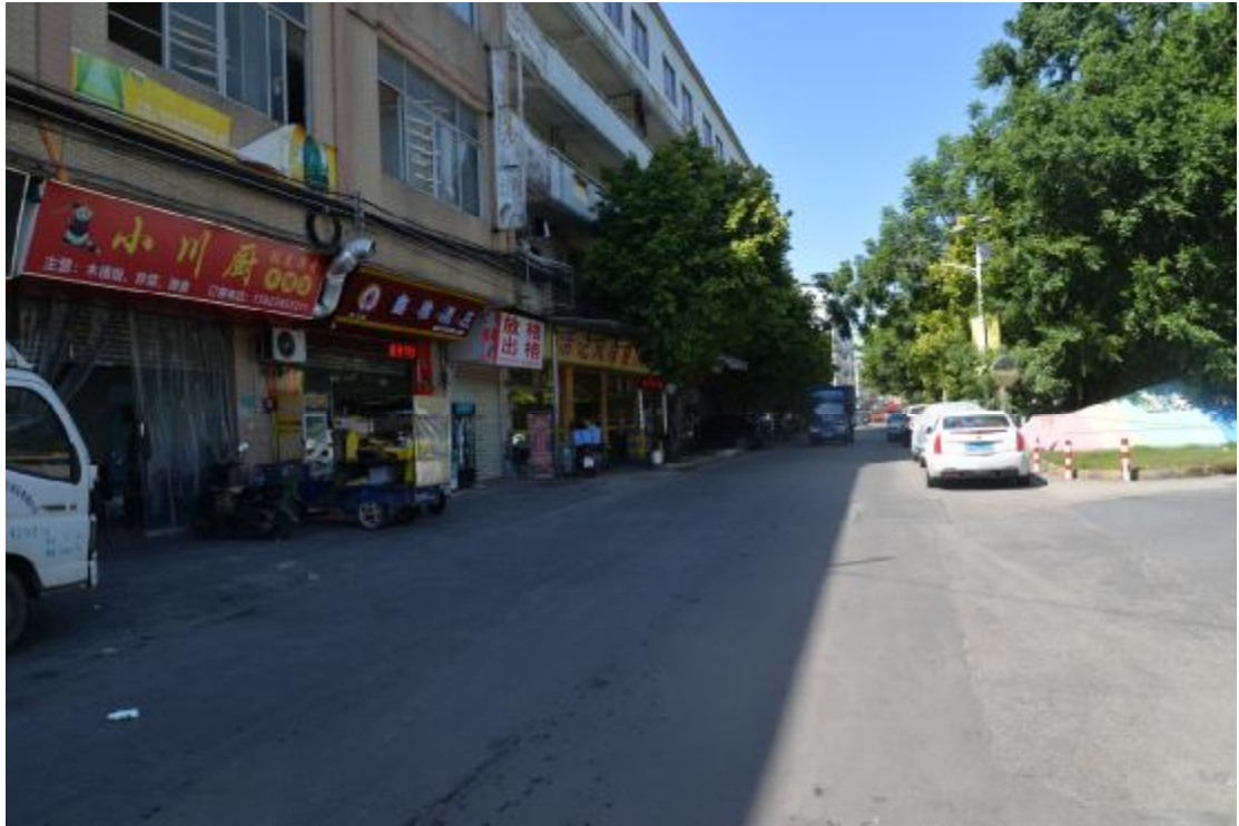
图 22 地块南部地表现状（东—西）