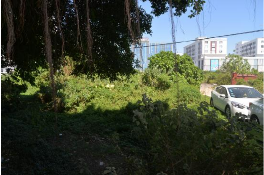
图 8 地块北部地表现状（南—北）