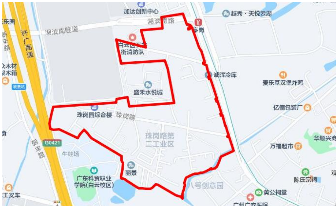
图 3 地块周边环境示意图（谷歌地图）