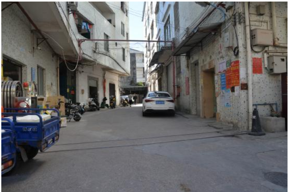
图 27 地块西南部地表现状（北—南）