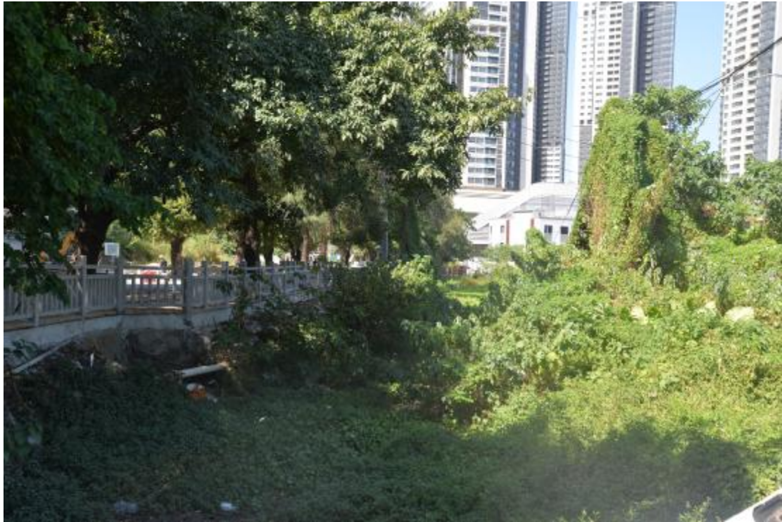
图 10 地块北部地表现状（东—西）