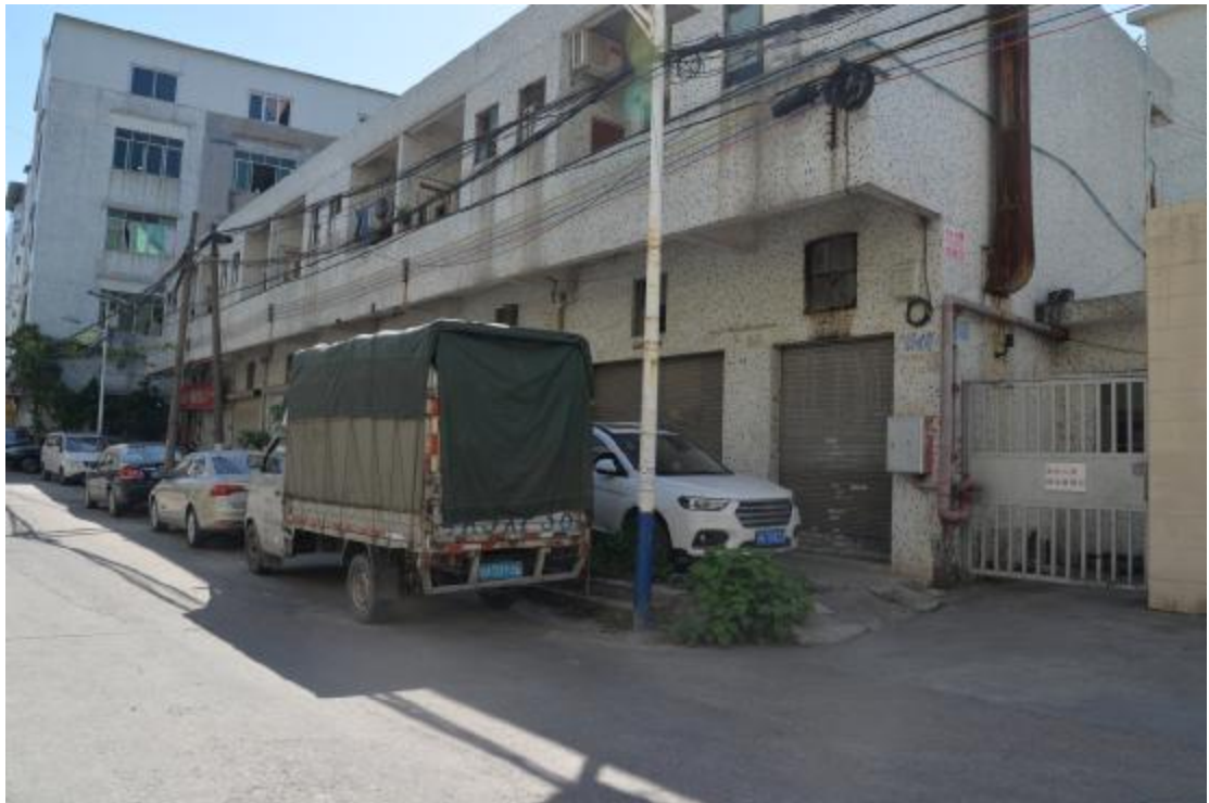
图 25 地块西南部地表现状（西—东）