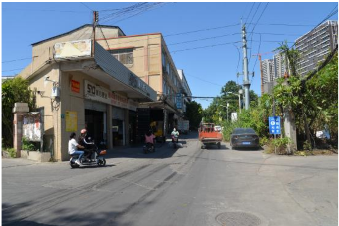
图 21 地块南部地表现状（东—西）