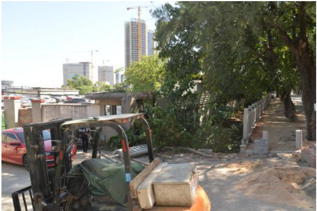
图 17 地块东部地表现状（西—东）