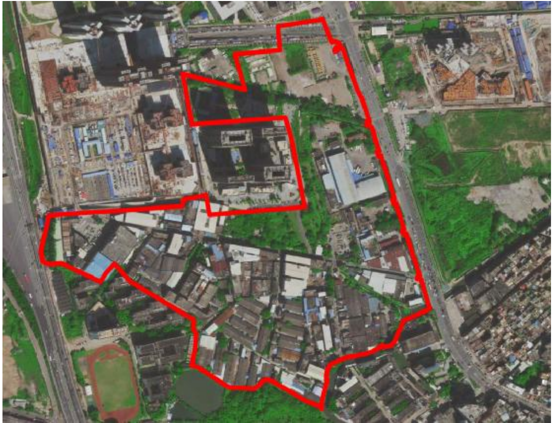
图 4 地块卫星红线图