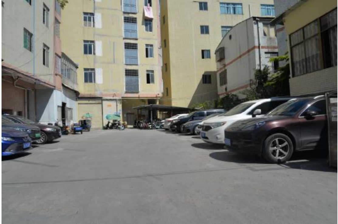
图 24 地块南部地表现状（南—北）