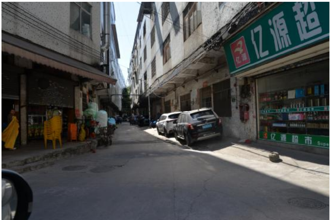
图 29 地块西南部地表现状（北—南）