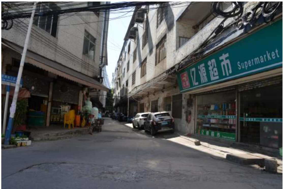
图 23 地块南部地表现状（北—南）