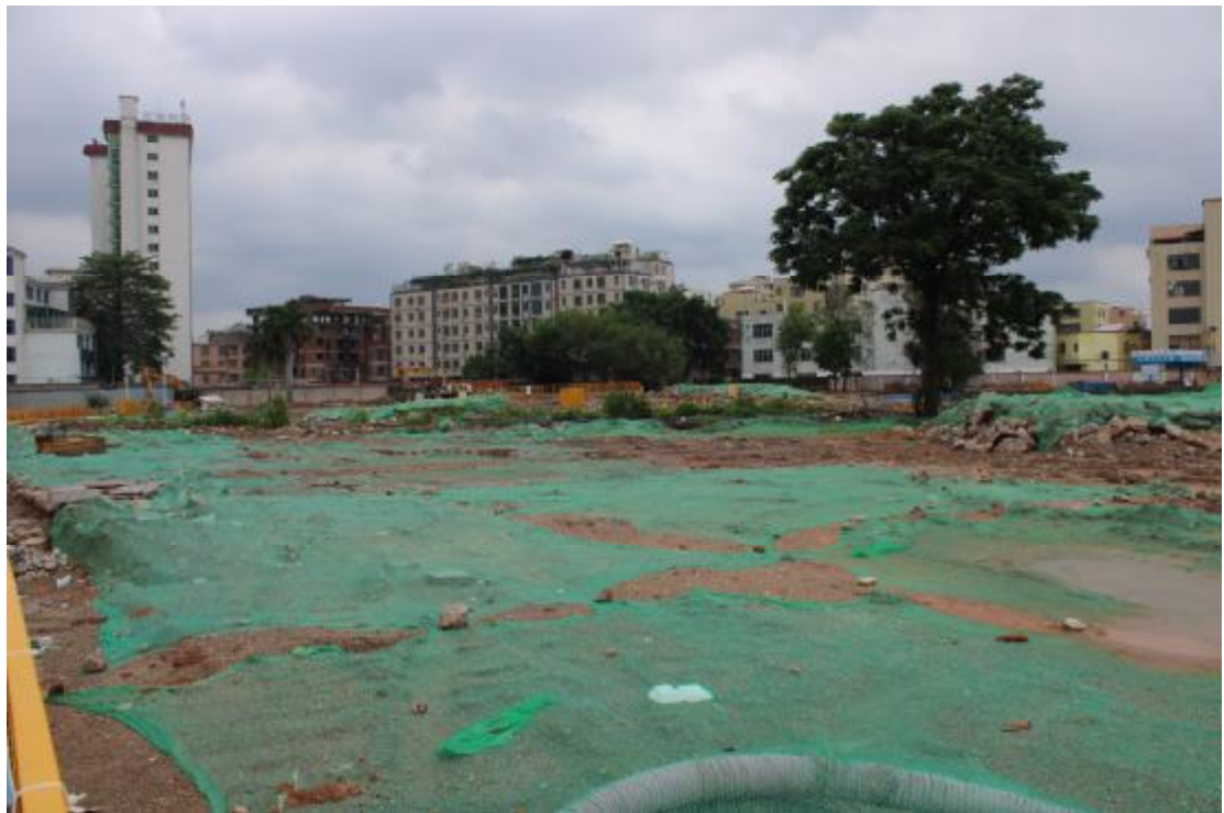
图 12 地表现状（南-北）