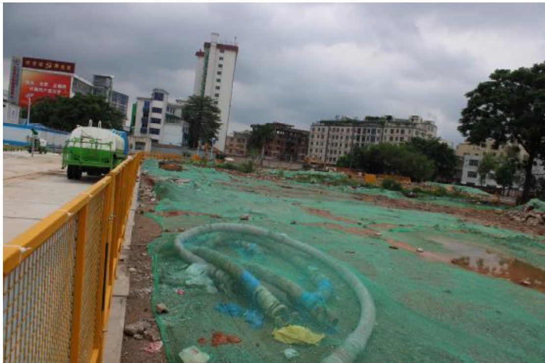
图 10 地表现状（南-北）