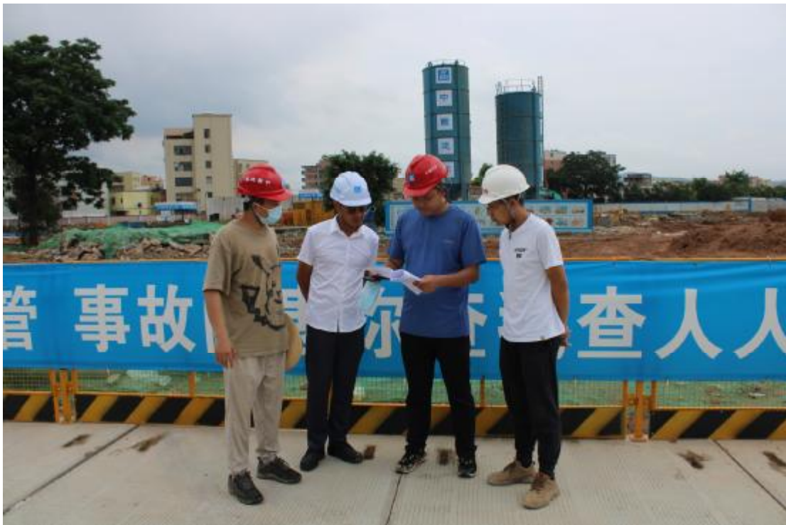
图 6 工作人员确认地块范围（西-东）