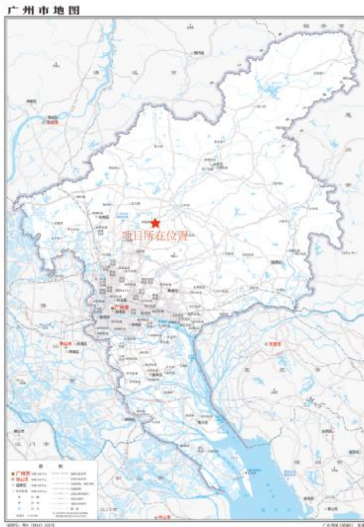
图 1 项目地块在广州市位置示意图（标准地图）

根据《中华人民共和国文物保护法》《广州市文物保护规定》，按照《广州市文物局关于广州市白云区钟落潭镇五龙岗村级工业园改造二期项目考古调查勘探工作的复函》（文物 2022624号）的指导意见，受广州白云美湾产业发展有限公司委托，由我院负责该地块的考古调查工作。