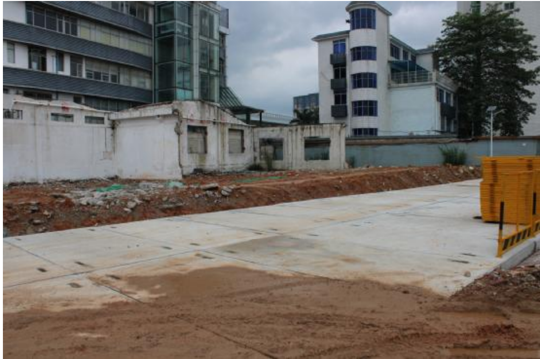
图 15 地表现状（南-北）