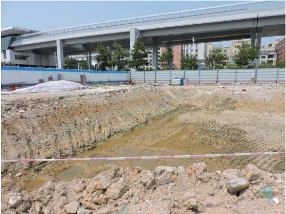
图 19 地表现状（南-北）