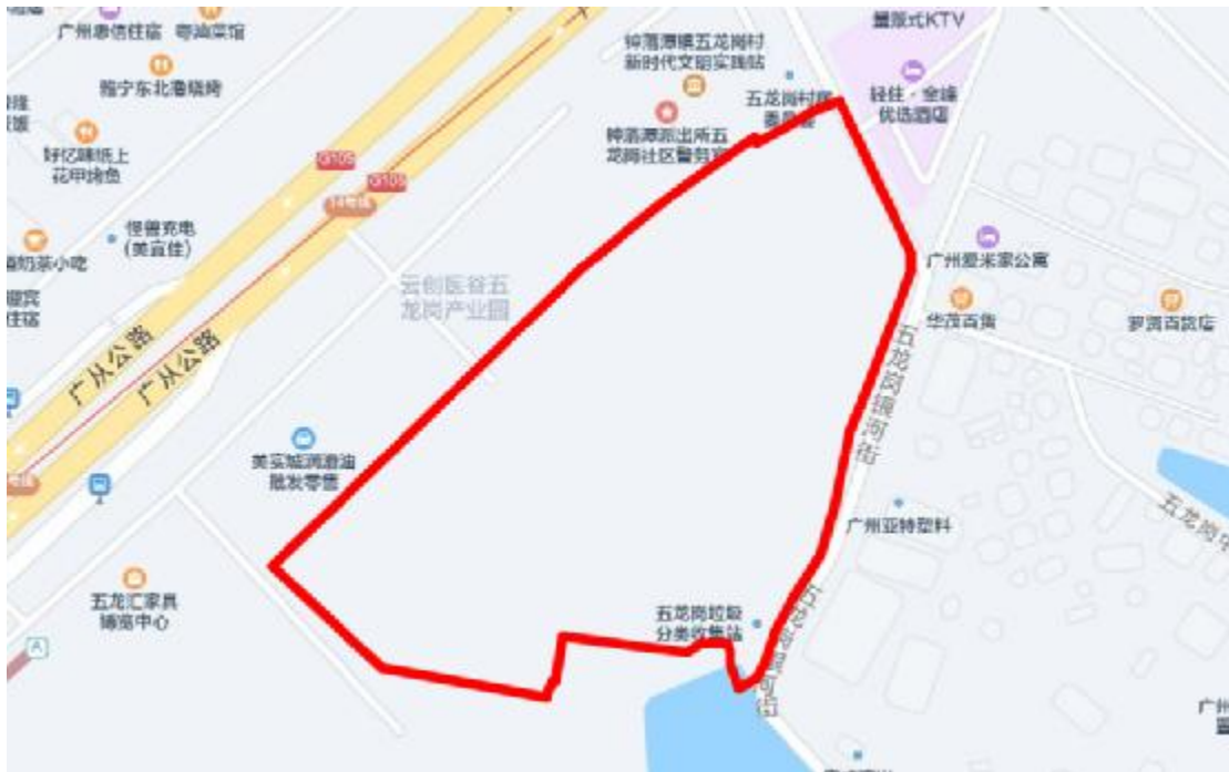
图 3 项目地块周边位置示意图（腾讯地图）