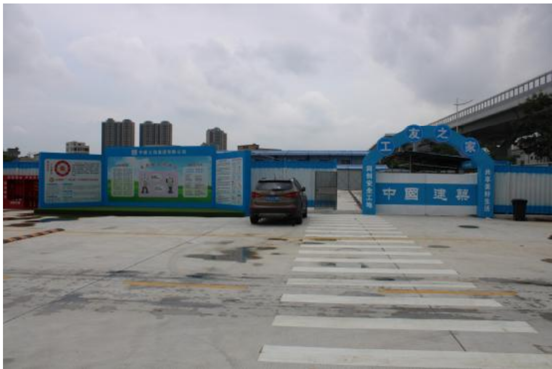
图 8 地表现状（北-南）