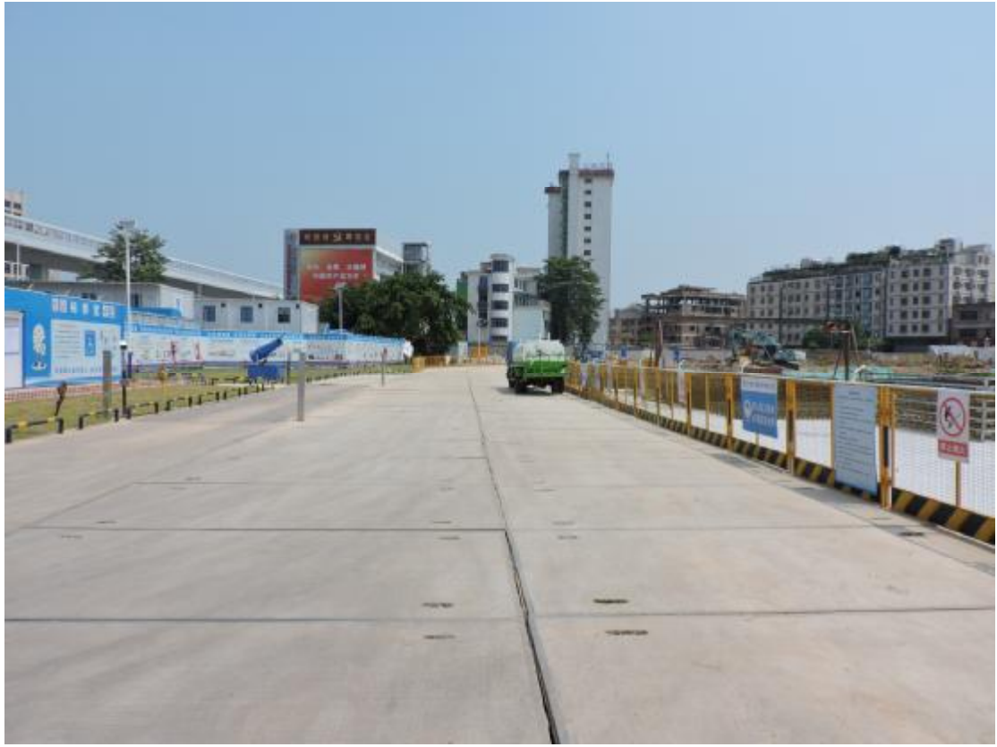
图 17 地表现状（西-东）