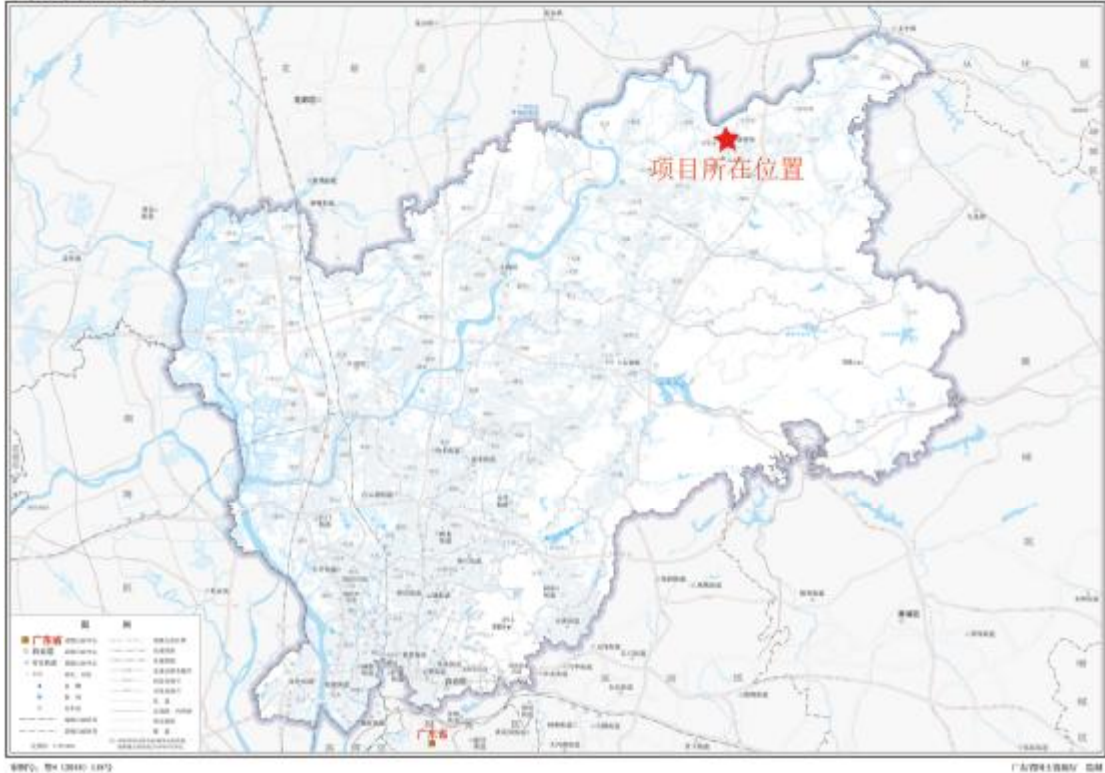
图 2 项目地块在白云区位置示意图（标准地图）