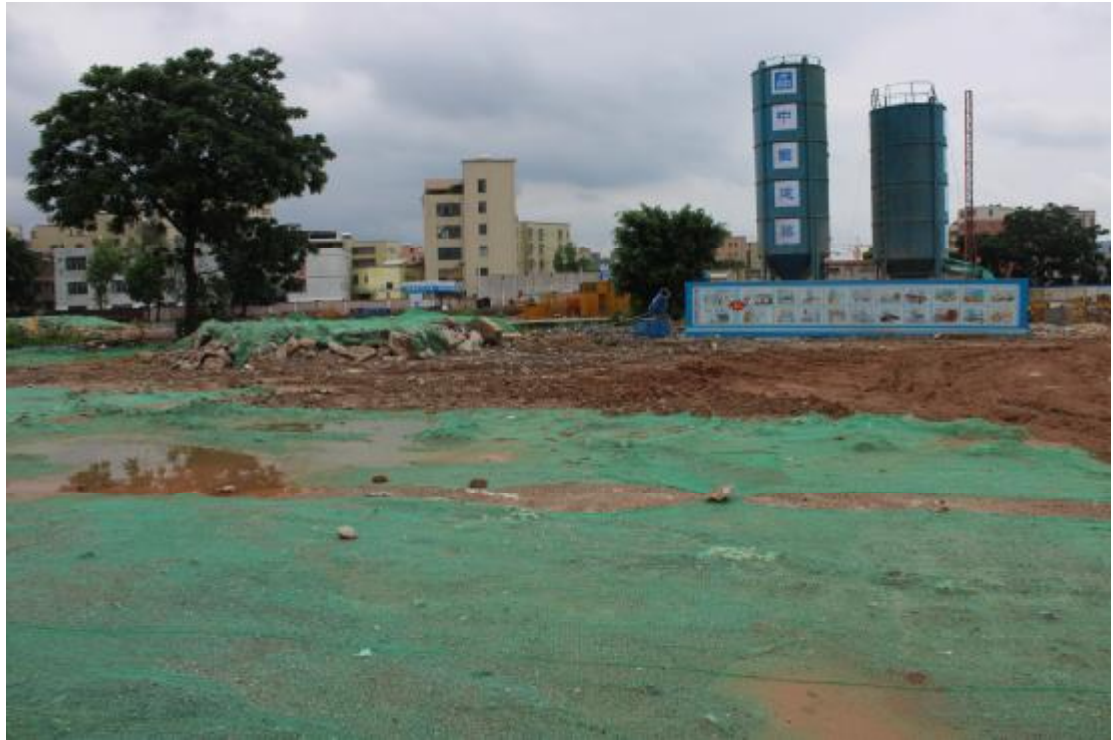
图 11 地表现状（西-东）