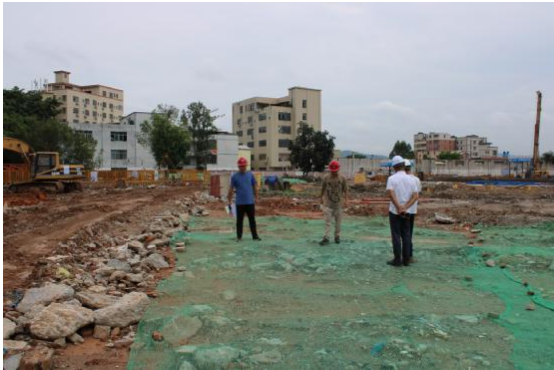
图 7 地表踏查（西-东）