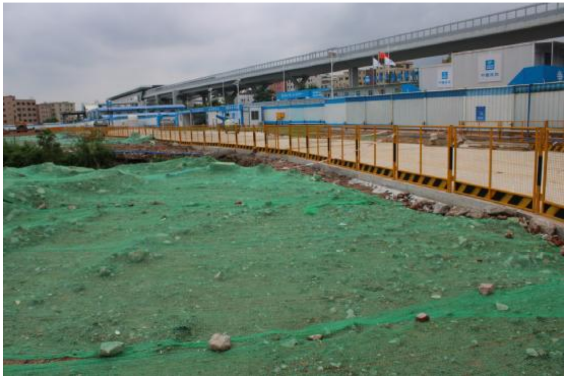
图 16 地表现状（东-西）