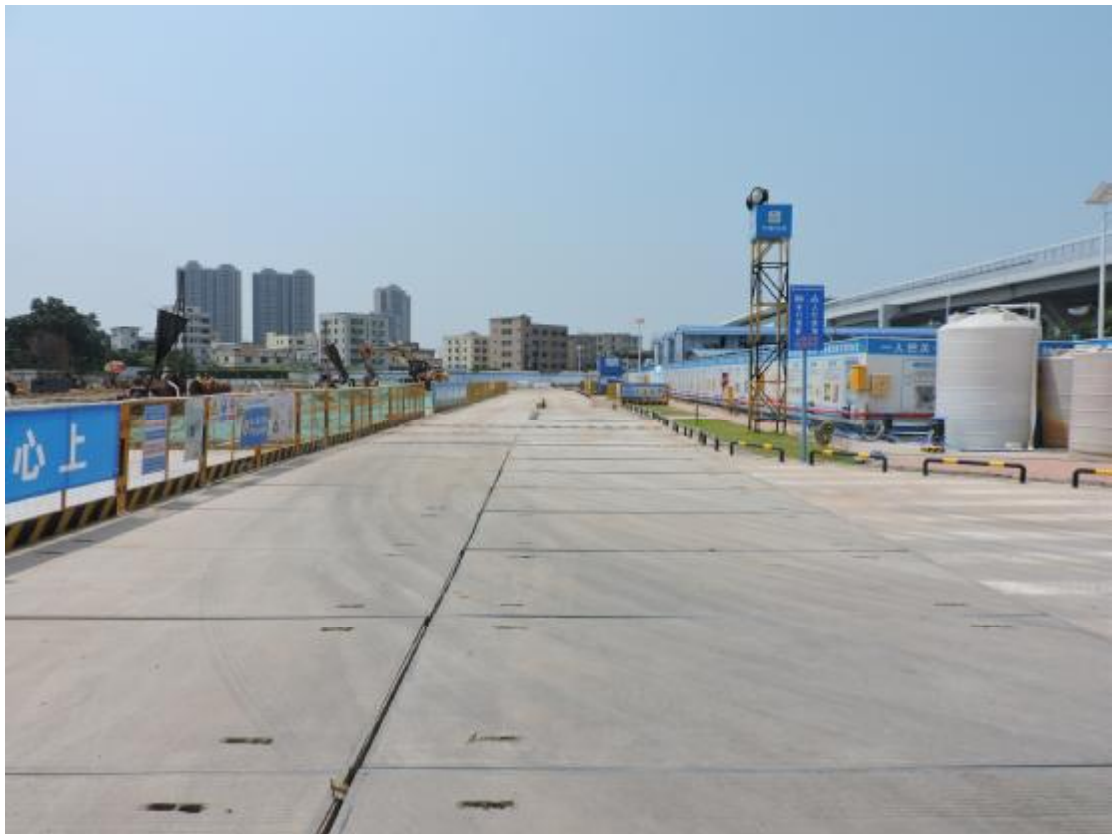
图 18 地表现状（东-西）