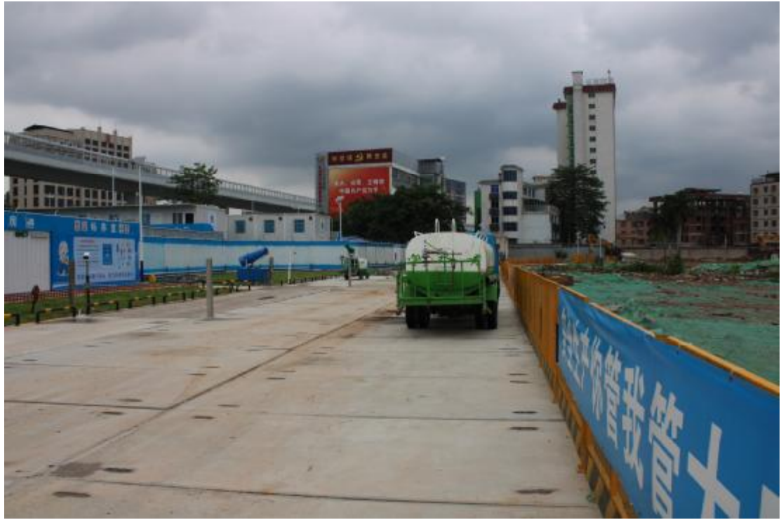
图 13 地表现状（南-北）