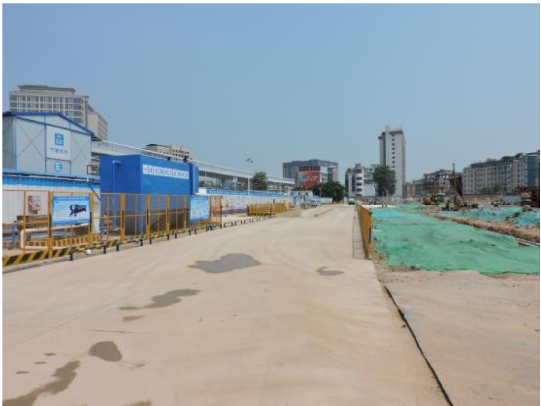
图 20 地表现状（西-东）