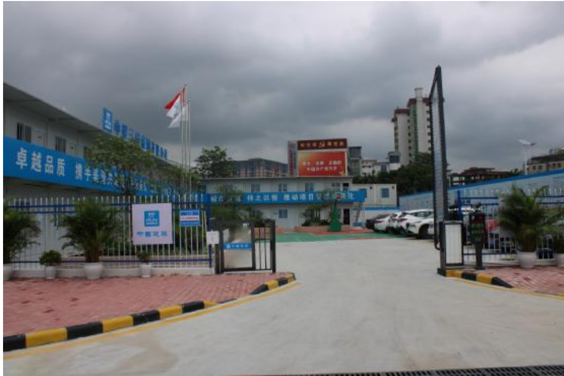
图 9 地表现状（南-北）