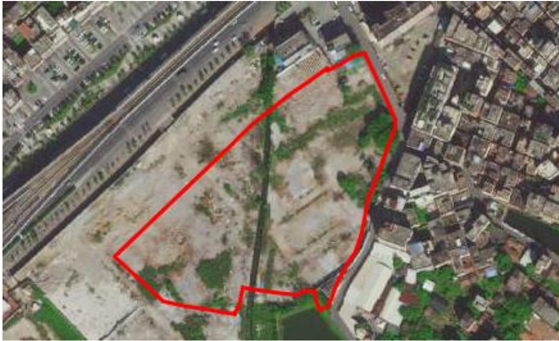
图 4 项目地块卫星影像图