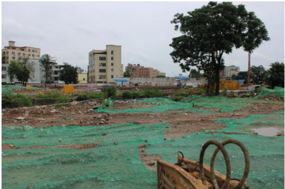
图 14 地表现状（西-东）