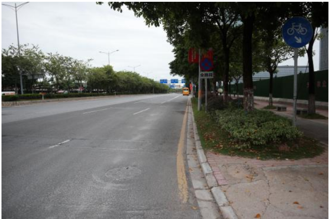
图 9 地块中部间隔云城西路（南-北）