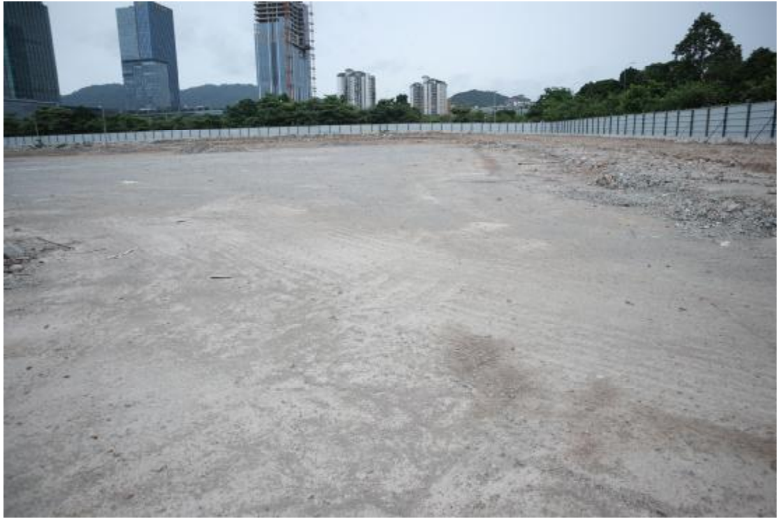
图 18 西部地块远景（北-南）