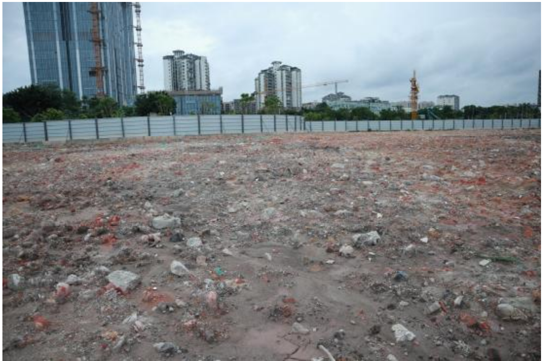
图 11 东部地块远景（西-东）