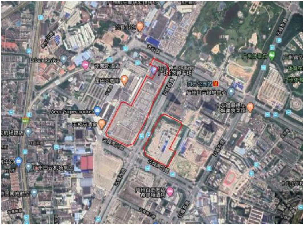
图 4 白云区白云新城云港城地块周边卫星图