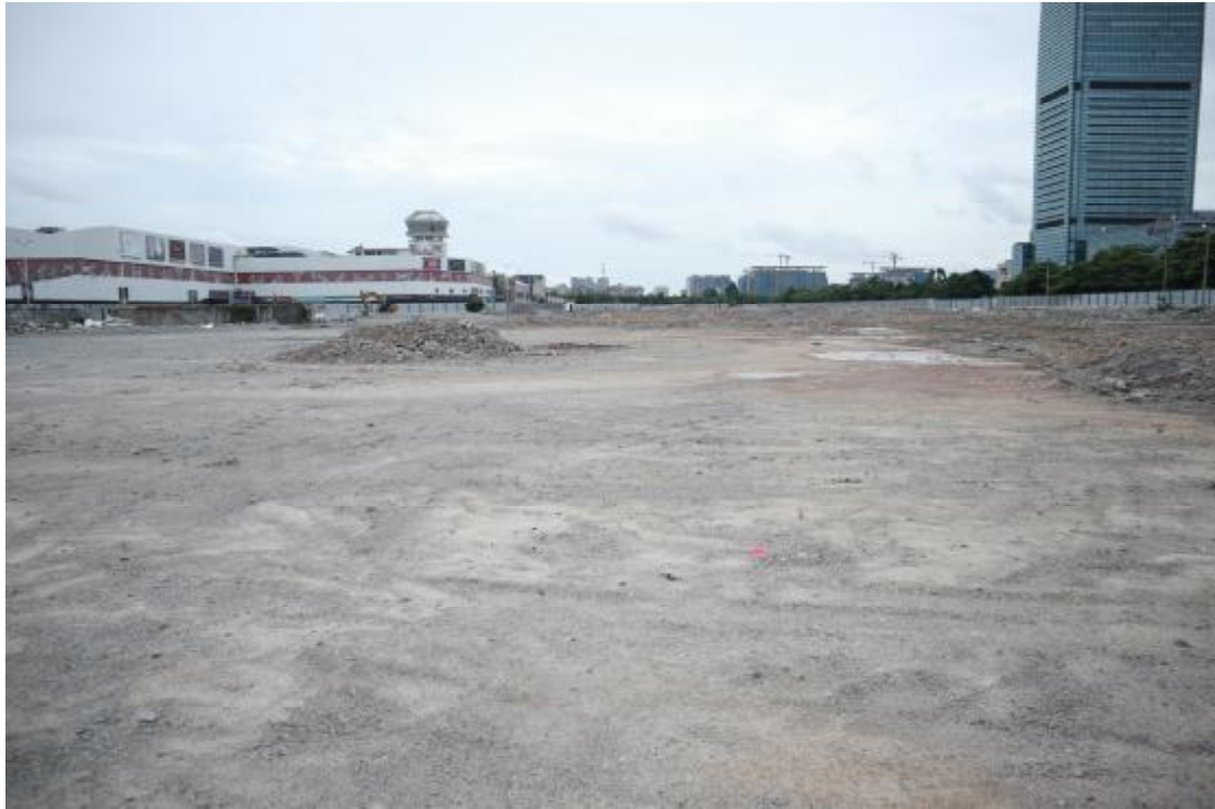
图 20 西部地块远景（西南-东北）