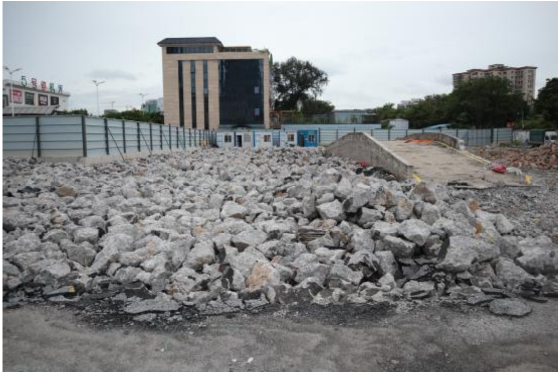
图 22 西部地块现状（东-西）