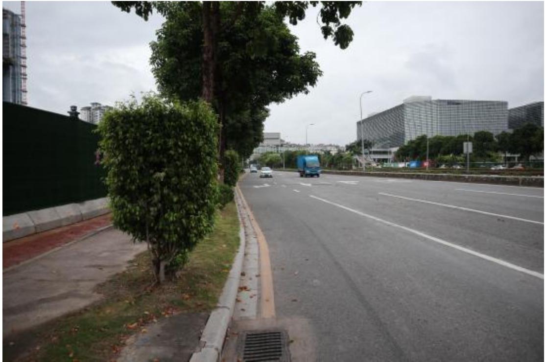
图 8 地块南部外围云城南四路（西北-东南）