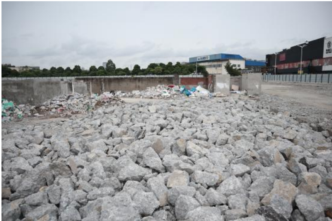
图 21 西部地块现状（东北-西南）