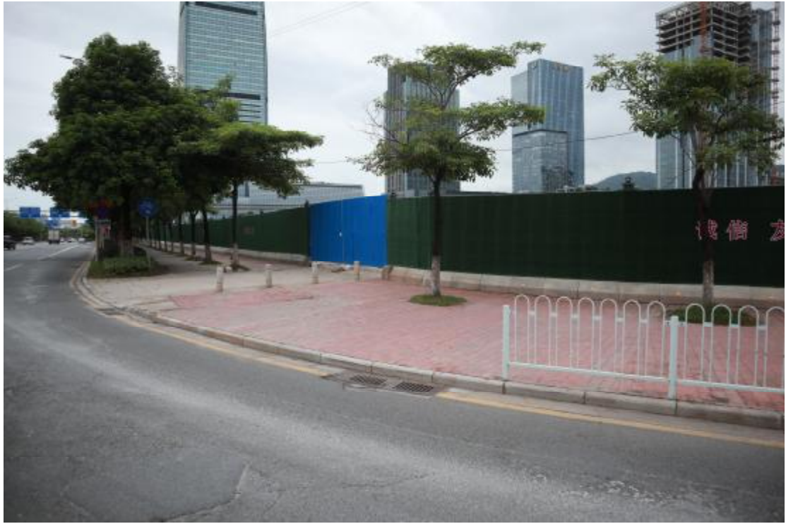
图 10 地块围蔽情况（西南-东北）