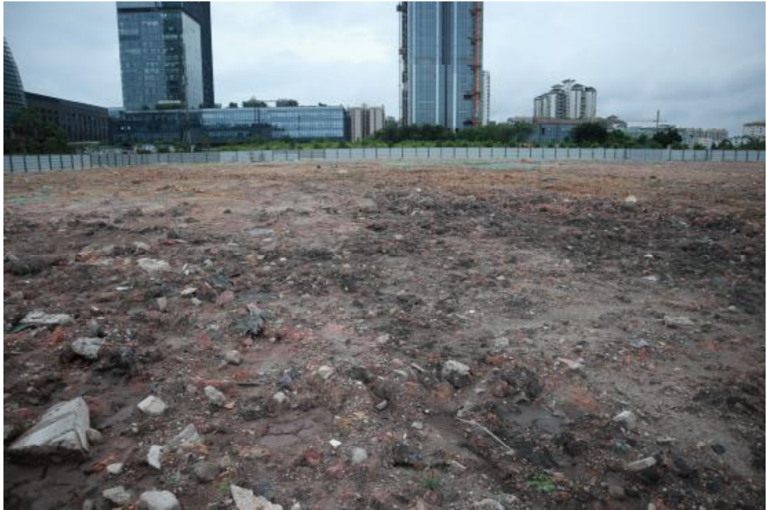
图 12 东部地块远景（西-东）