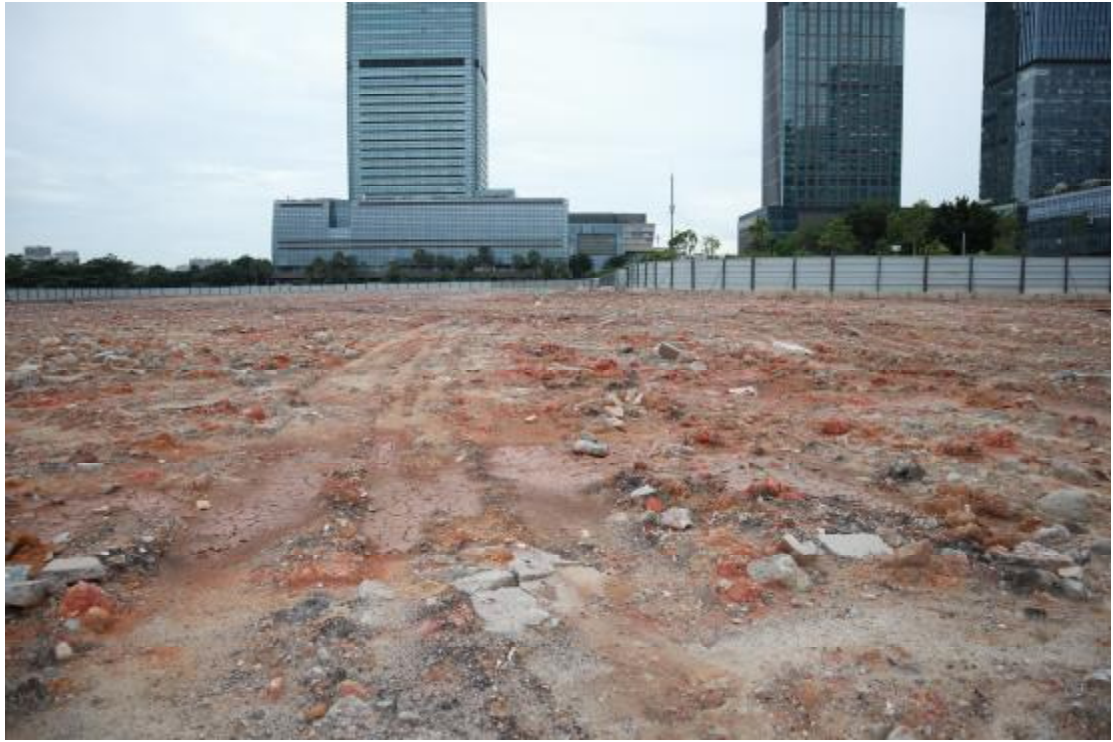
图 14 东部地块远景（西南-东北）