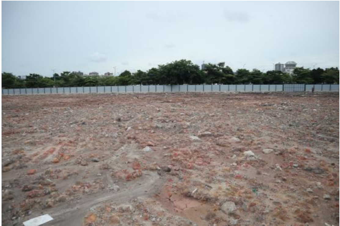
图 16 东部地块现状（东-西）