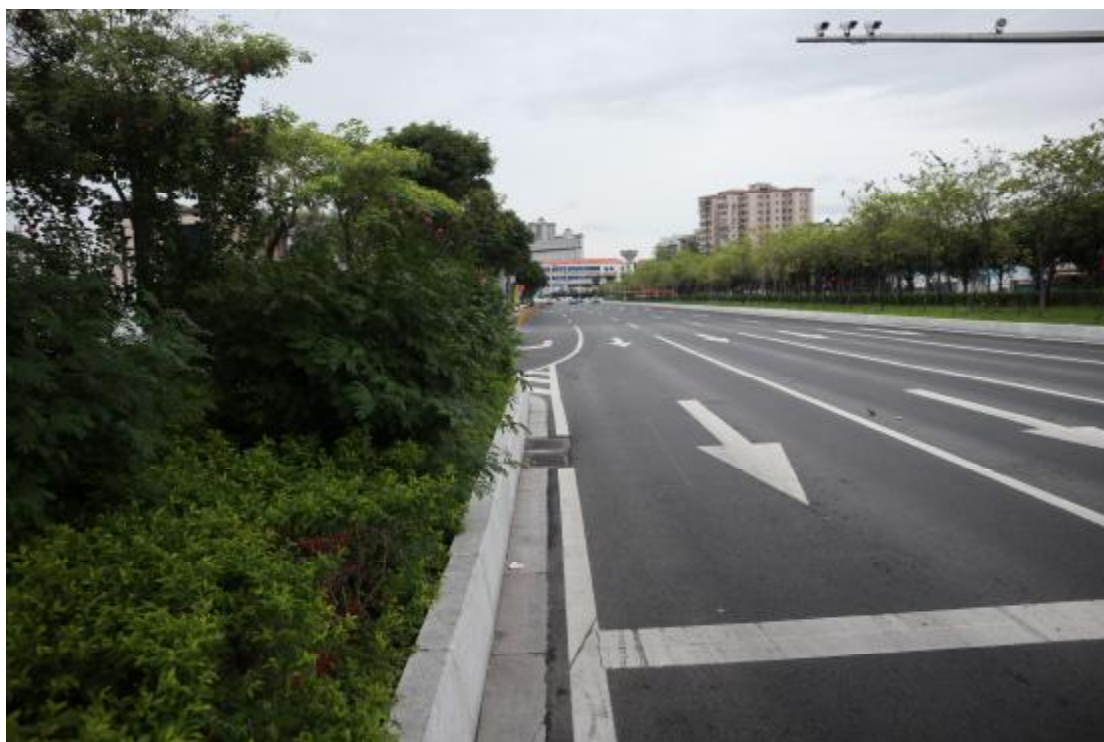
图 7 地块北部外围齐心路（东-西）