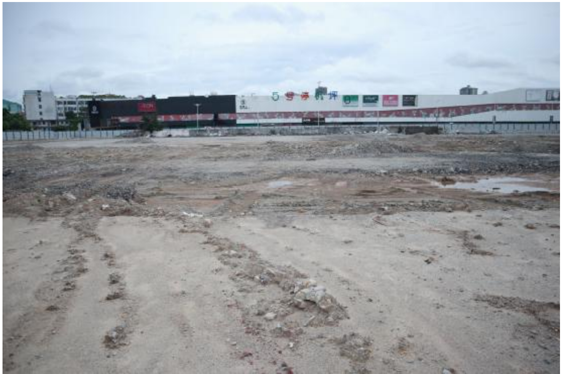
图 19 西部地块远景（东-西）