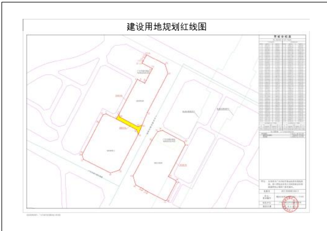
图 5 白云区白云新城云港城地块地块规划红线图（甲方提供）