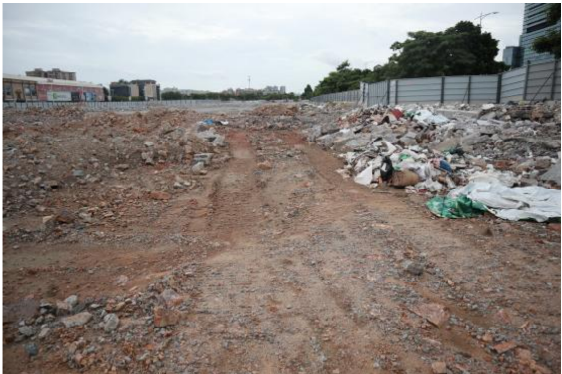
图 23 西部地块现状（西南-东北）