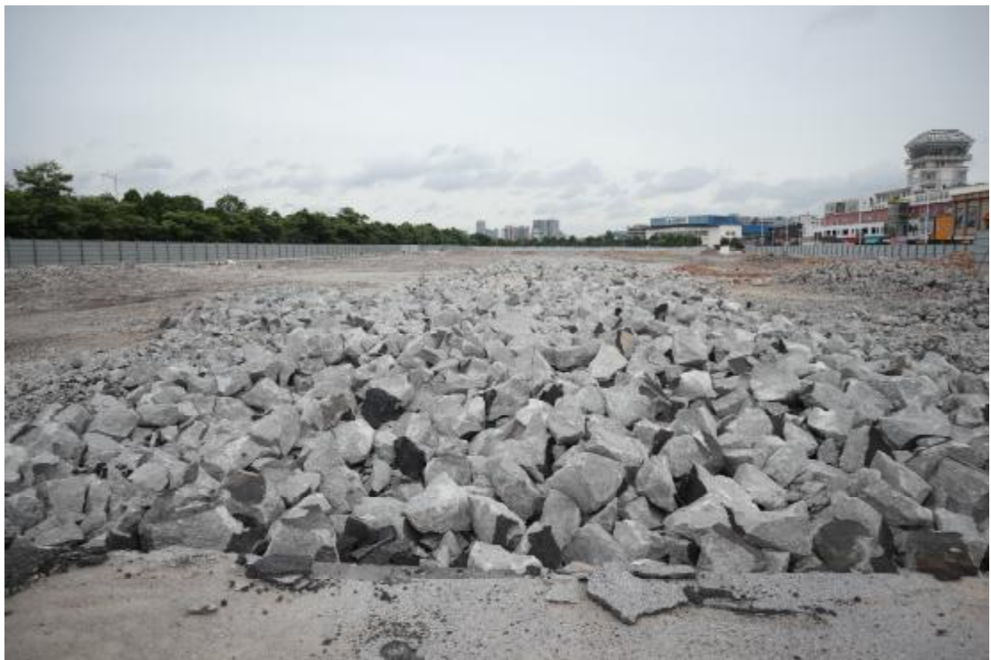
图 17 西部地块远景（东北-西南）