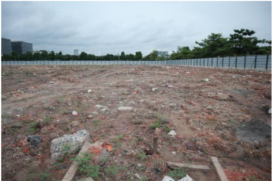
图 15 东部地块现状（东北-西南）