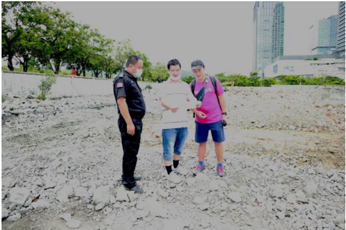
图 13 工作人员确认地块范围（西-东）