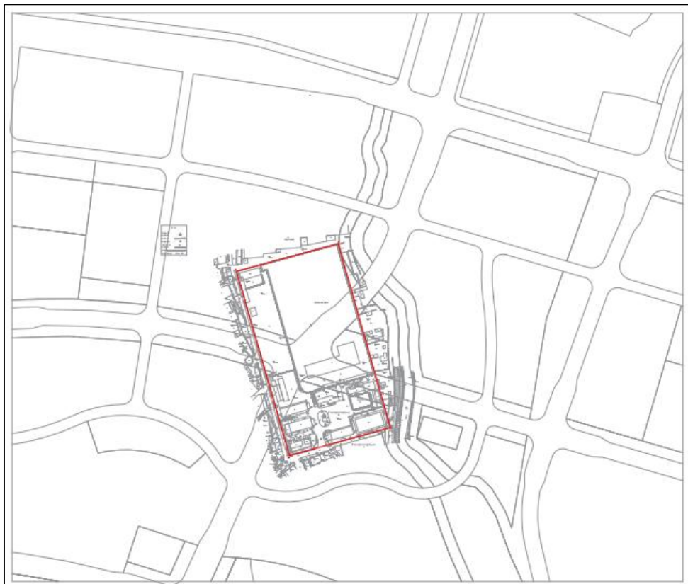
图 5 广州市煤气公司第一储罐地块红线图