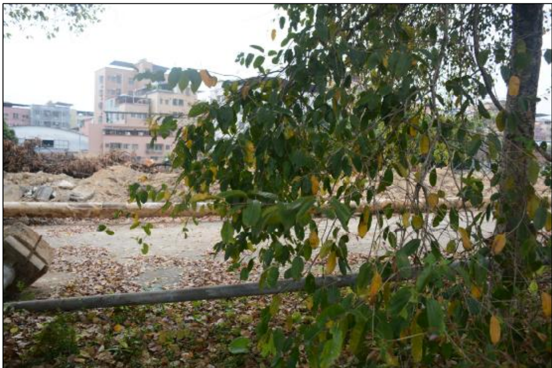
图 17 该项目西部地貌现状（东-西）