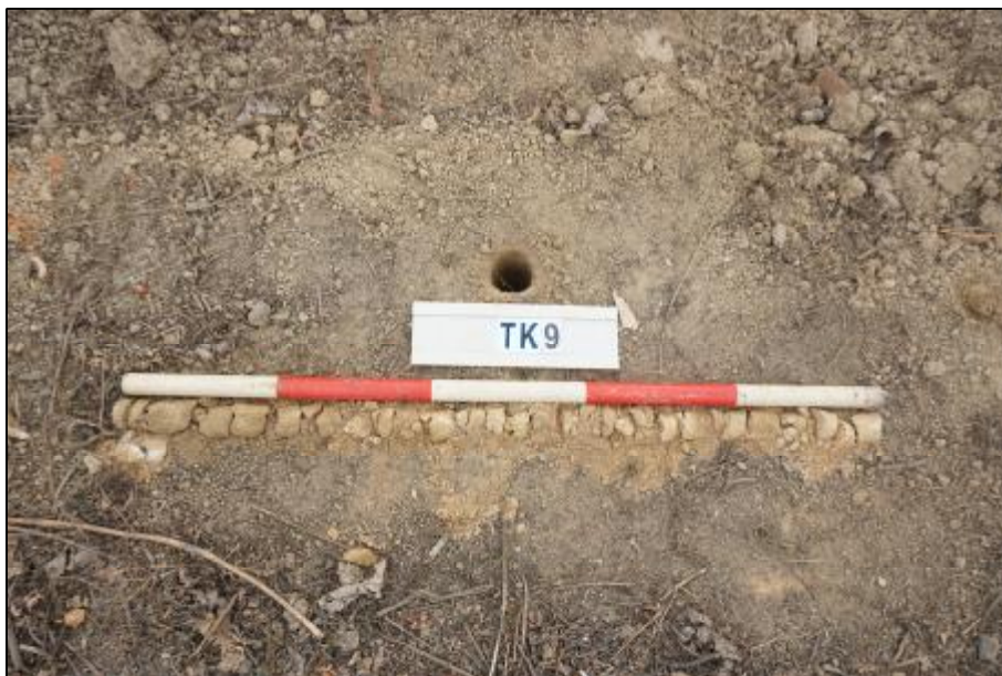
图 34 TK9 土样（标杆长 1 米，土样由左上到右下）

第①层：表土层，厚约 0.3 米，灰褐色粘土，土质较致密，包含少量植物根茎及砂石。该层下为生土层，黄褐色粘土，土质疏松，包含风化石渣。