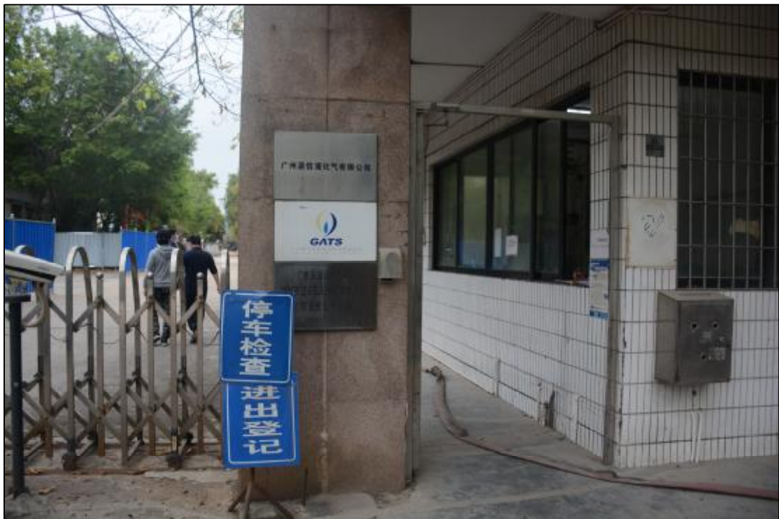
图 23 该项目地块大门现状（南-北）