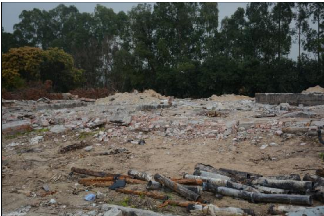
图 19 该项目东南部地貌现状（西北-东南）