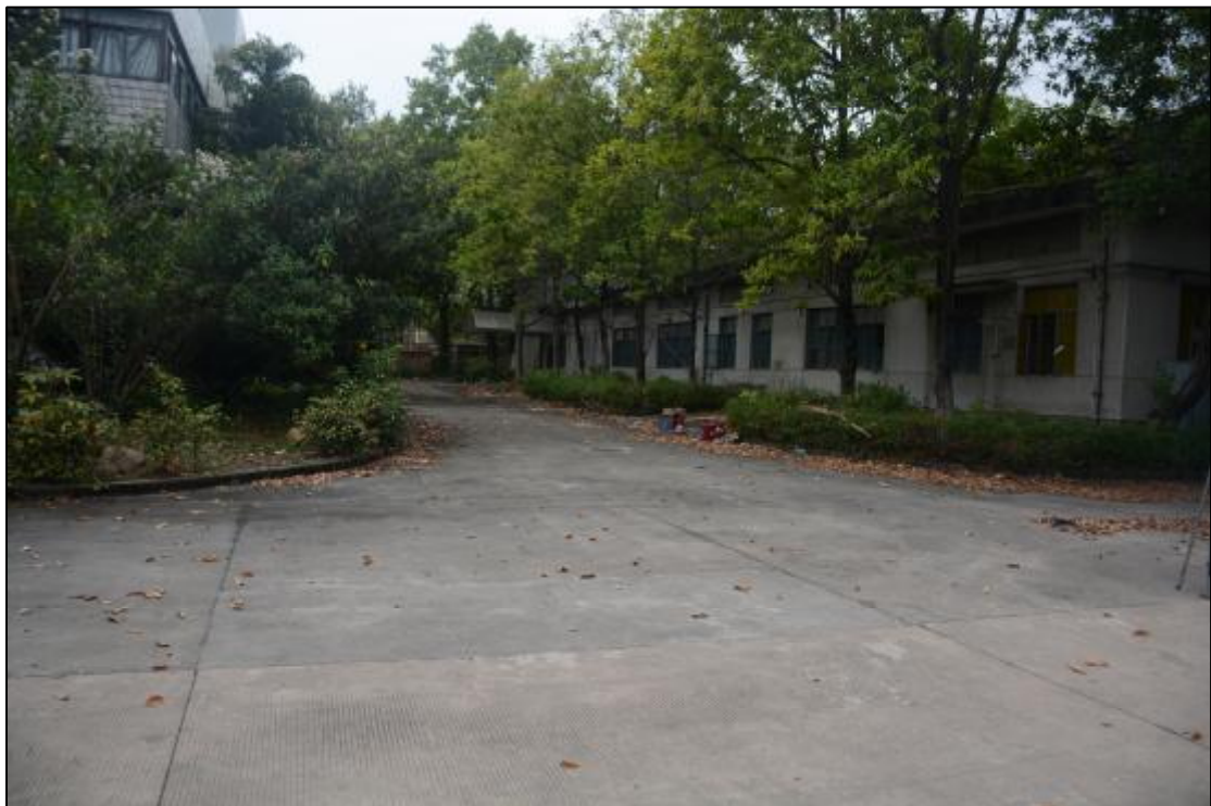
图 21 该项目西北部地貌现状（东南-西北）