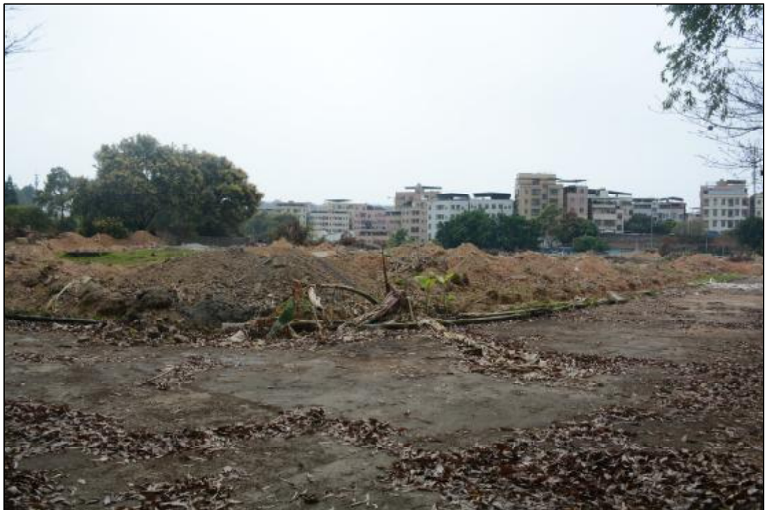
图 9 项目地块远景（东北-西南）