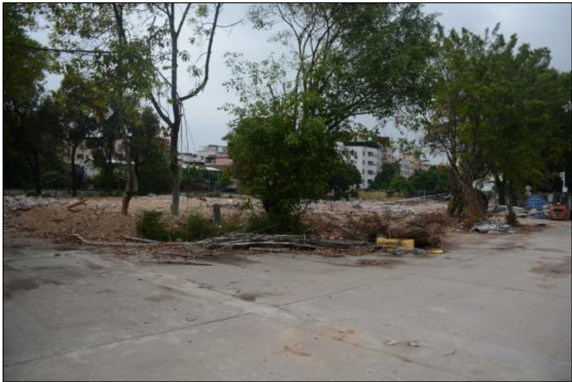
图 18 该项目东南部地貌现状（西北-东南）