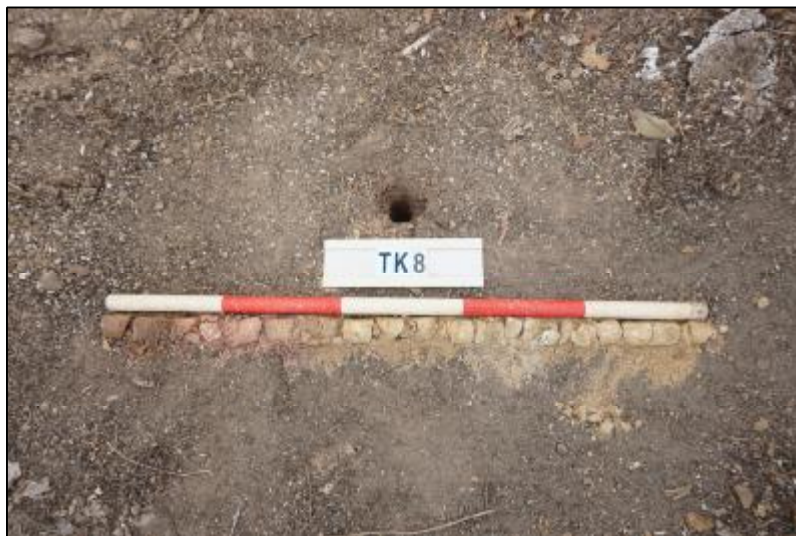
图 33 TK8 土样（标杆长 1 米，土样由左上到右下）

第①层：表土层，厚约 0.15 米，灰褐色粘土，土质较致密，包含少量植物根茎及砂石。该层下为生土层，黄褐色粘土与红褐色粘土相杂，土质较致密，包含风化石渣。