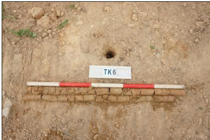
图 31 TK6 土样 (标杆长 1 米, 土样由左上到右下)

第①层: 垫土层, 厚约 1.8 米, 灰褐色粘土, 土质较疏松, 包含大量砂石。该层下为生土层, 红褐色粘土, 土质致密。