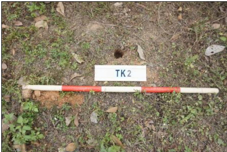
图 27 TK2 土样（标杆长 1 米，土样由左上到右下）

第①层：表土层，厚约 0.3 米，黄褐色粘土，土质疏松，包含少量植物根茎和砂石。该层下有较多石块，无法继续勘探。