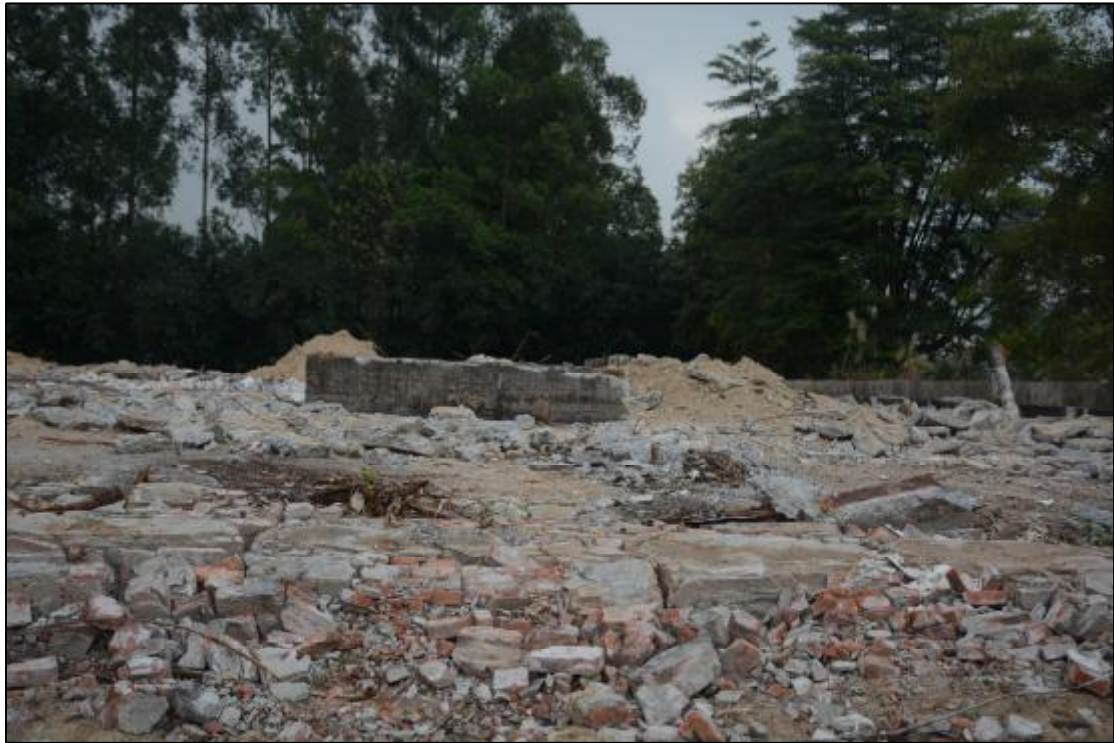
图 20 该项目东部地貌现状（西-东）