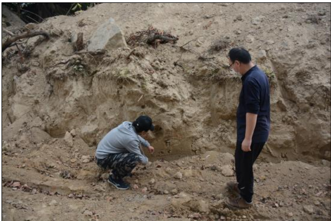
图 11 现场查看剖面（西-东）