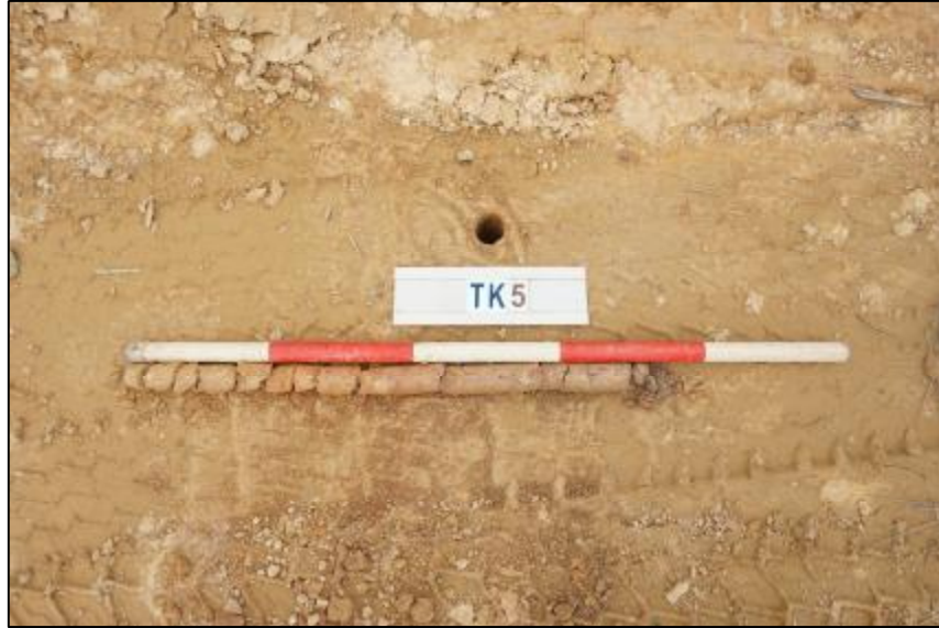
图 30 TK5 土样 (标杆长 1 米, 土样由左上到右下)

第①层: 垫土层, 厚约 0.7 米, 黄褐色粘土, 土质较疏松, 包含大量砂石。该层下有较多石块, 无法继续勘探。