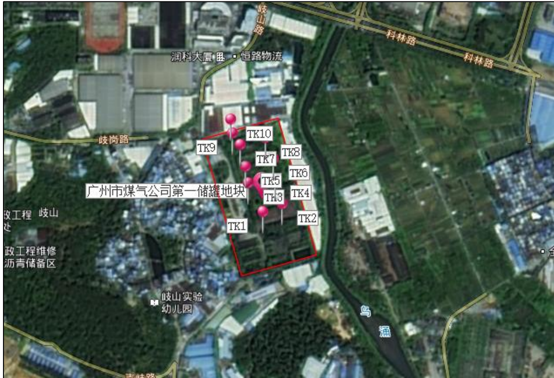
图 24 地块内试探探孔位置示意图（奥维地图）

为了进一步掌握项目地块内的地层情况，根据实际条件，我们在地块内进行了探孔试探，共 10 个试探孔，分布编号为 TK1-TK10, 其具体情况如下：