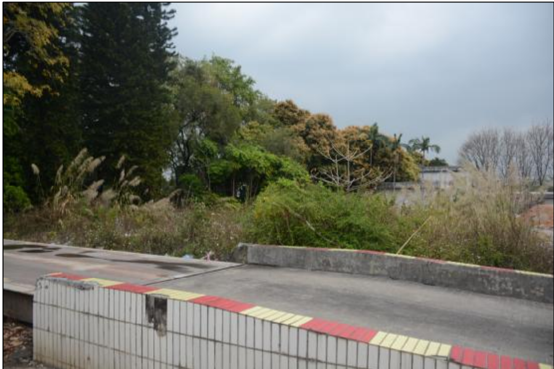
图 15 该项目西南部地貌现状（东北-西南）