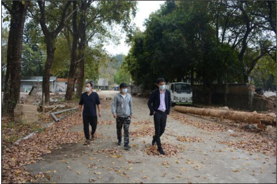
图 8 考古工作人员现场踏查（南-北）