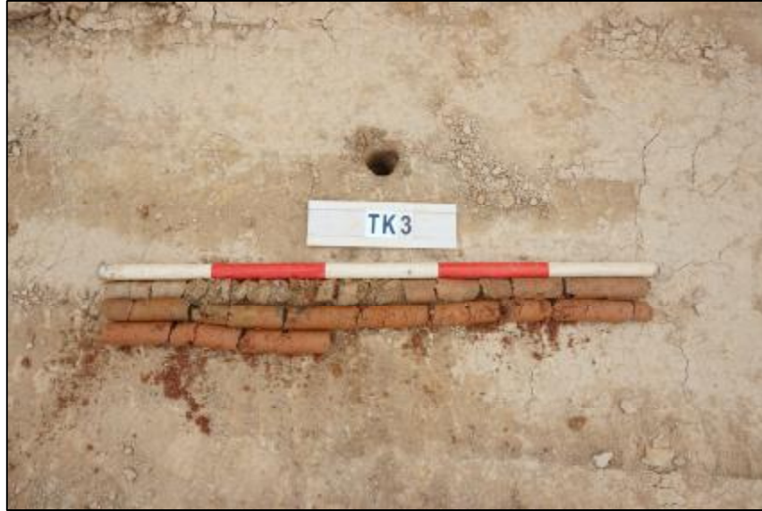
图 28 TK3 土样 (标杆长 1 米, 土样由左上到右下)

第①层: 垫土层, 厚约 2 米, 灰褐色粘土, 土质较致密, 包含大量砂石。 该层下为生土层, 红褐色粘土, 土质致密。