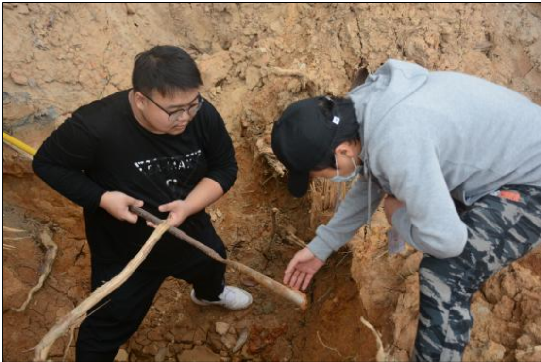
图 12 现场分析土样（西北-东南）