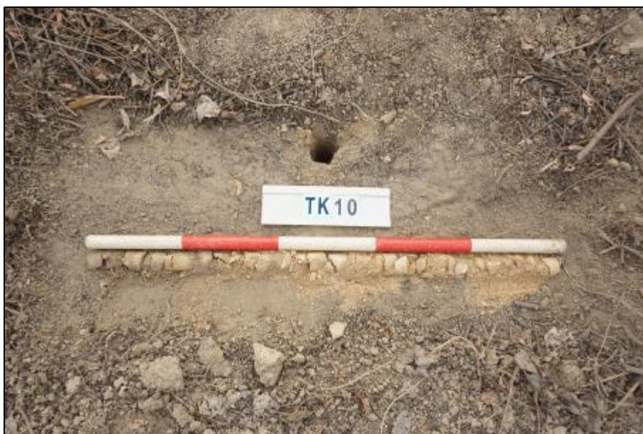
图 35 TK10 土样（标杆长 1 米，土样由左上到右下）

第①层：表土层，厚约 0.1 米，灰褐色粘土，土质较致密，包含砂石。该层下为生土层，黄褐色粘土，土质疏松，包含风化石渣。