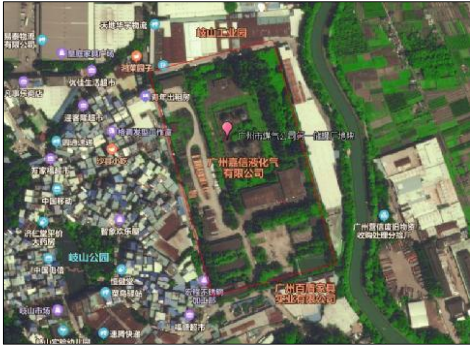
图 4 广州市煤气公司第一储罐地块卫星影像图（奥维地图）