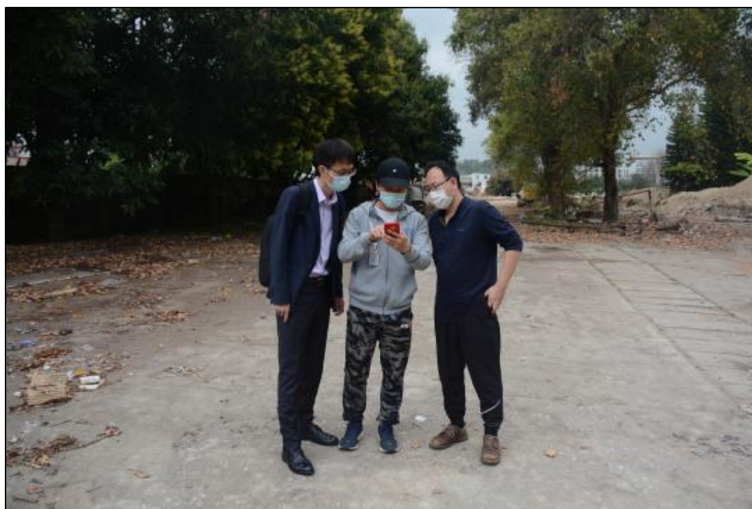
图7 工作人员现场核对该项目红线图（南-北）