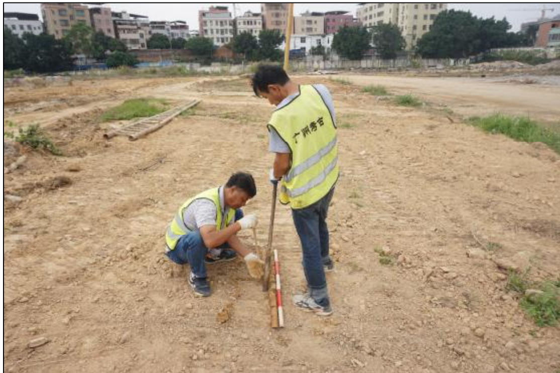
图 25 现场试探（东-西）