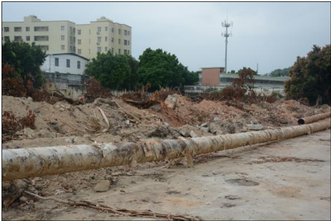
图 14 该项目南部地貌现状（东北-西南）