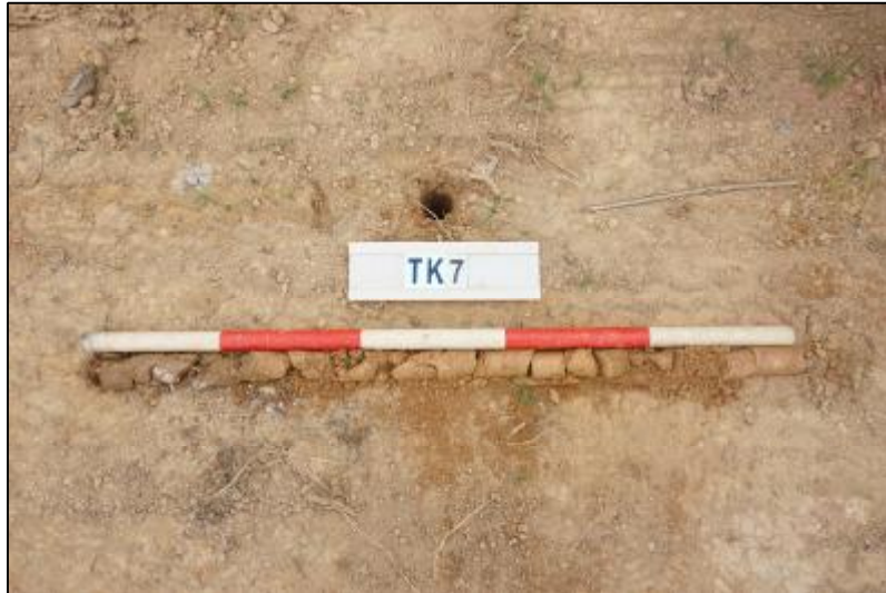
图 32 TK7 土样（标杆长 1 米，土样由左上到右下）

第②层：垫土层，厚约 0.72 米，黄褐色粘土，土质较致密，包含风化石渣。该层下为生土层，黄褐色粘土，土质较致密。