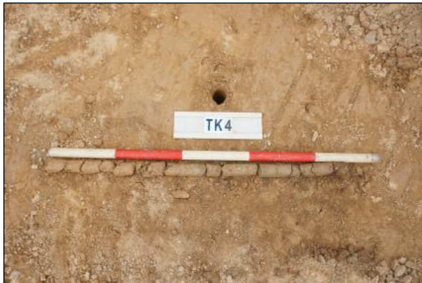
图 29 TK4 土样 (标杆长 1 米, 土样由左上到右下)

第①层: 垫土层, 厚约 0.9 米, 灰褐色粘土, 土质较致密, 包含大量砂石。 该层下有较多石块, 无法继续勘探。