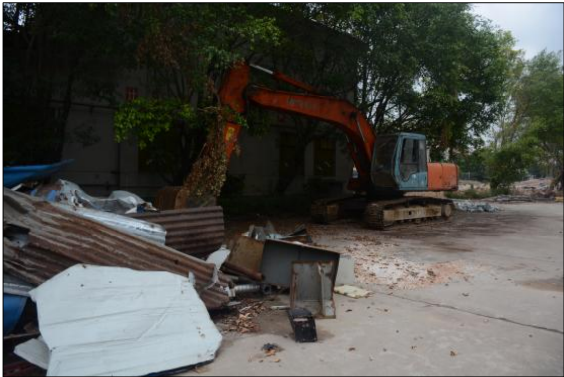
图 22 该项目北部地貌现状（南-北）