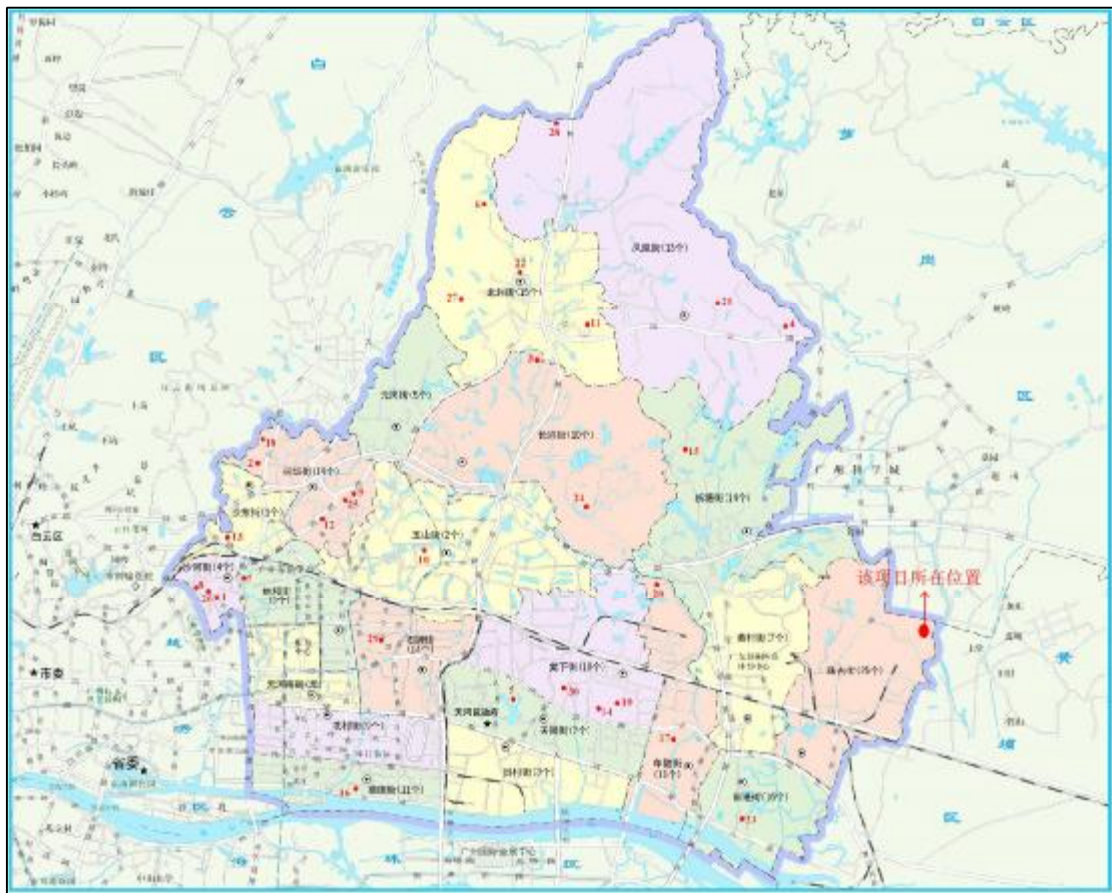
图 6 天河区文物资源分布示意图

根据《广州市文物普查汇编·天河区卷》记载，该项目地块所属的珠吉街道文物资源较为丰富，共 25 处。其中靠近项目地块的包括宋 林千三夫妇合坟墓、晋庆庙、三元殿等。