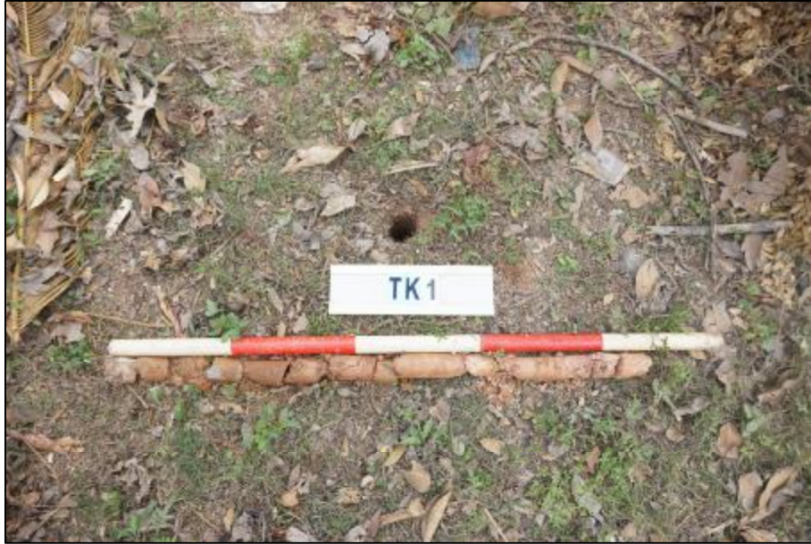
图 26 TK1 土样（标杆长 1 米，土样由左上到右下）

第①层：表土层，厚约 0.38 米，灰褐色粘土，土质较致密，包含少量植物根茎和砂石。该层下为生土层，黄褐色粘土，土质较致密，包含风化石渣。