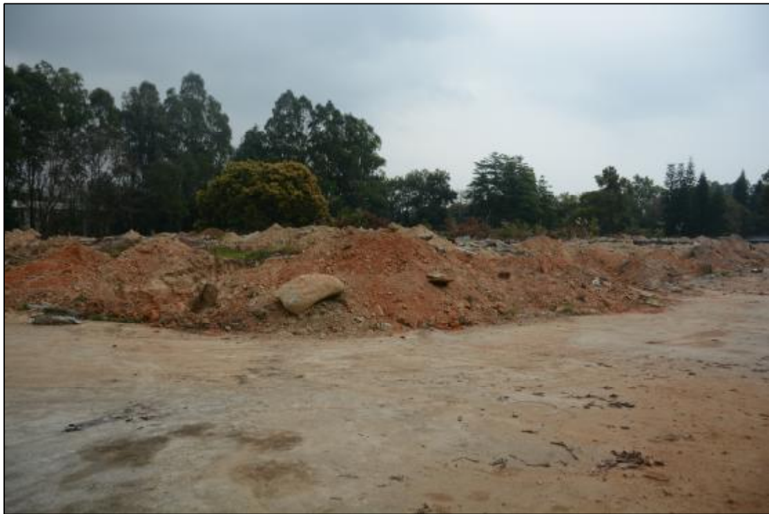
图 10 项目地块远景（西北-东南）