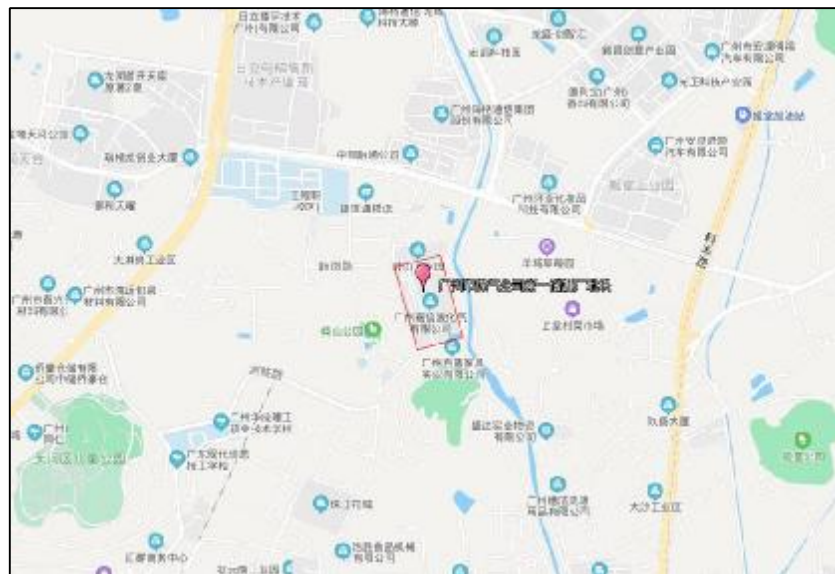
图 3 广州市煤气公司第一储罐地块周边位置图