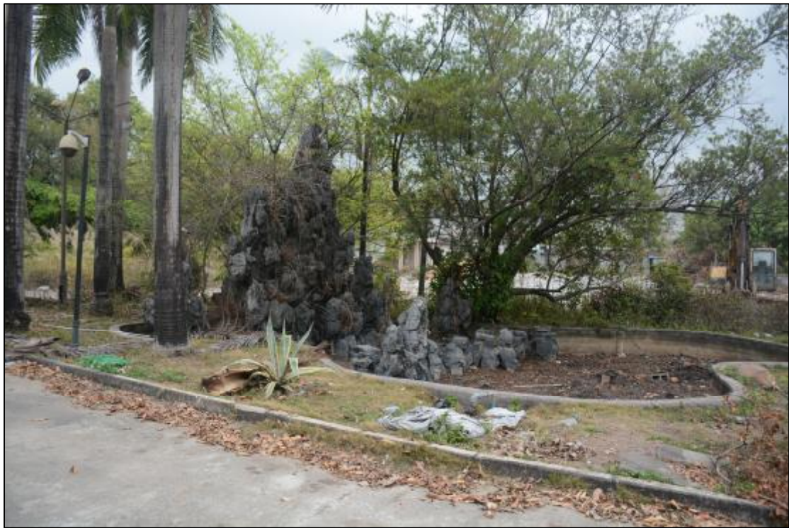
图 16 该项目东北部地貌现状（西南-东北）