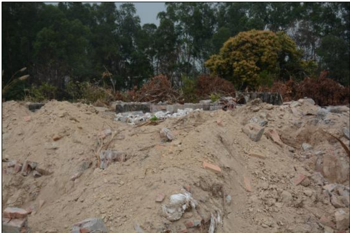
图 13 该项目南部地貌现状（北-南）